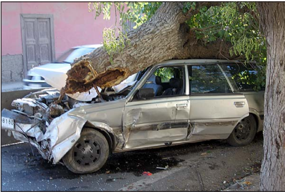
Y SE LO LLEVÓ.- Así quedó el vehículo, con el árbol montado sobre el techo y parabrisas del station wagon.