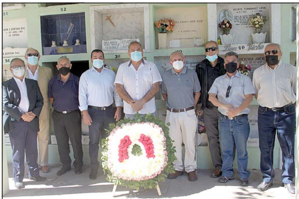
NUNCA OLVIDADOS. - Este sábado en el Mausoleo de la Sociedad de Artesanos La Unión, el directorio hizo acto de presencia para recordar a sus amigos ausentes.