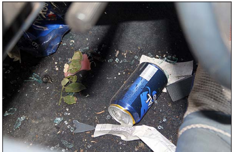
ALCOHOL EN EL VEHÍCULO.- Las cámaras de Diario El Trabajo registraron estos residuos de alcohol al interior del vehículo.