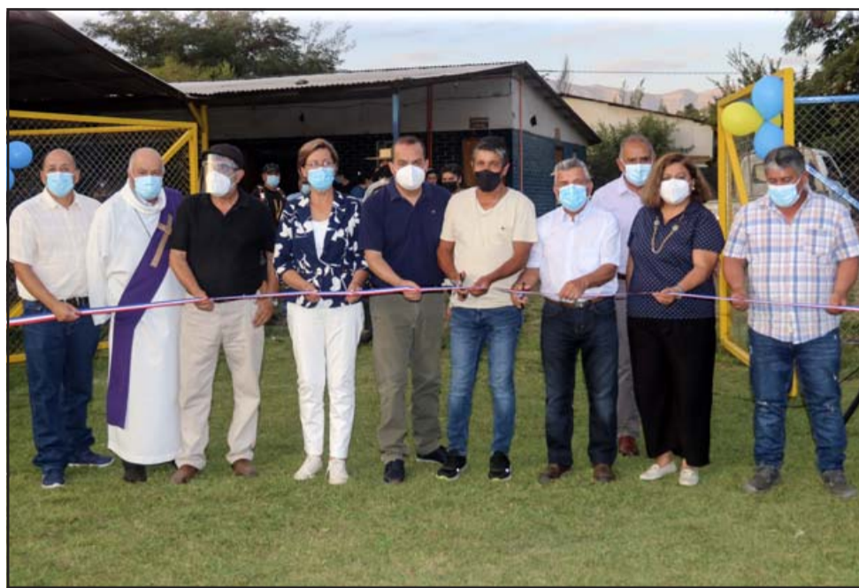
Las autoridades municipales y dirigentes deportivos participaron en el tradicional Corte de Cinta de estas mejoras en su recinto futbolístico.

En cuanto a instalaciones eléctricas, se realizó el montaje de nuevos equipos de iluminación LED, los cuales fueron distribuidos en los cuatros recintos del establecimiento con el fin de dotar con la luminosidad