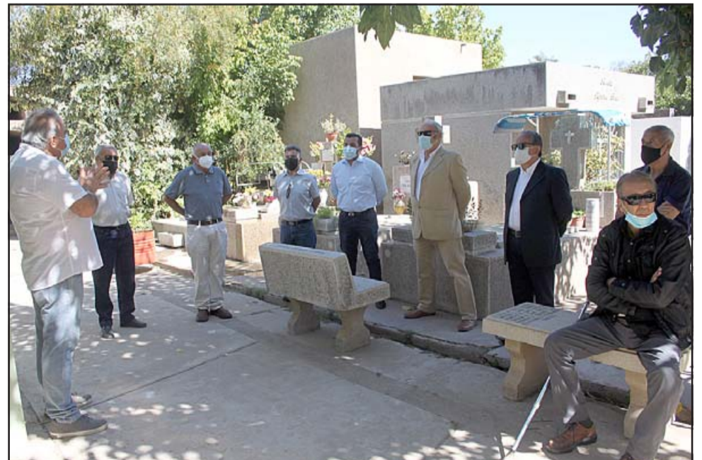
EN MEMORIA DE AQUELLOS. - Rezaron el Padre Nuestro en memoria de los socios que ya no están en la Sociedad.