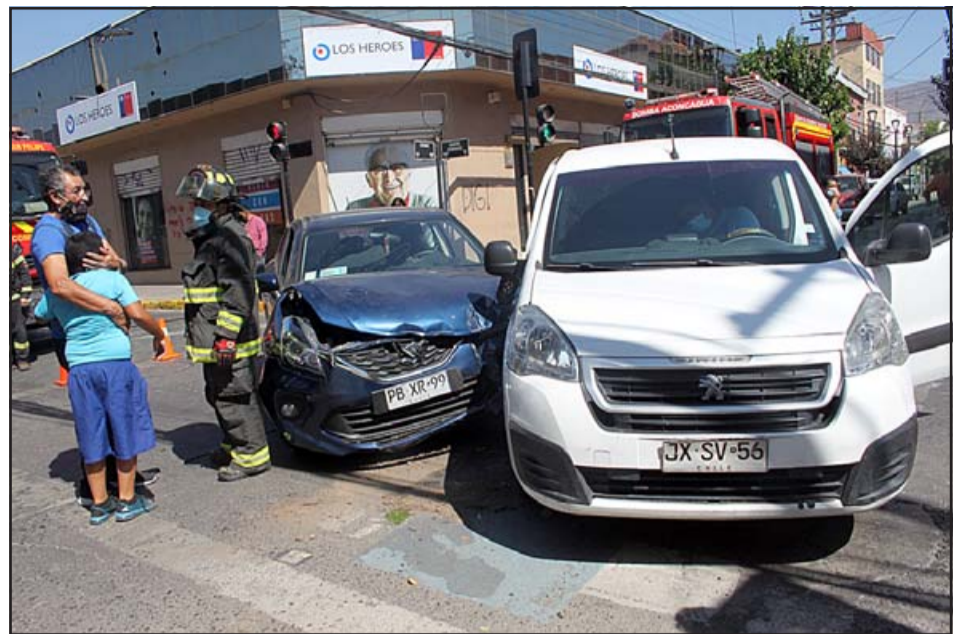
ACCIDENTE EN INVESTIGACIÓN.- Este niño es consolado por un familiar tras el potente choque, no resultaron personas heridas de gravedad.