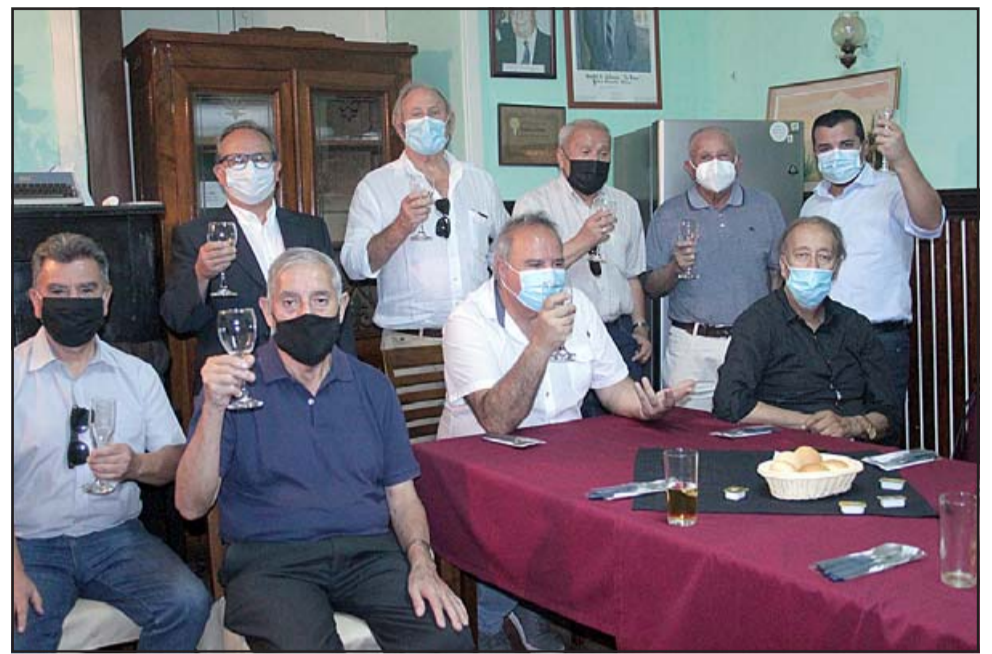
SOLEMNE BRINDIS. - Sólo ellos pudieron hacer este Brindis de Aniversario en su sede oficial, vieron algunos videos históricos y cerraron la reunión.