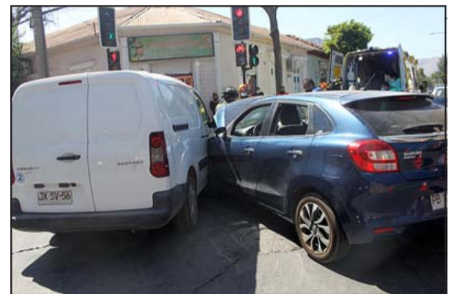
EN INVESTIGACIÓN.- Esta es la escena, ambos vehículos se dieron tremendo golpe, será Carabineros y autoridades de Tránsito quienes determinen responsabilidades.

der a sus ocupantes, aislaron los vehículos y habilitaron el tránsito.