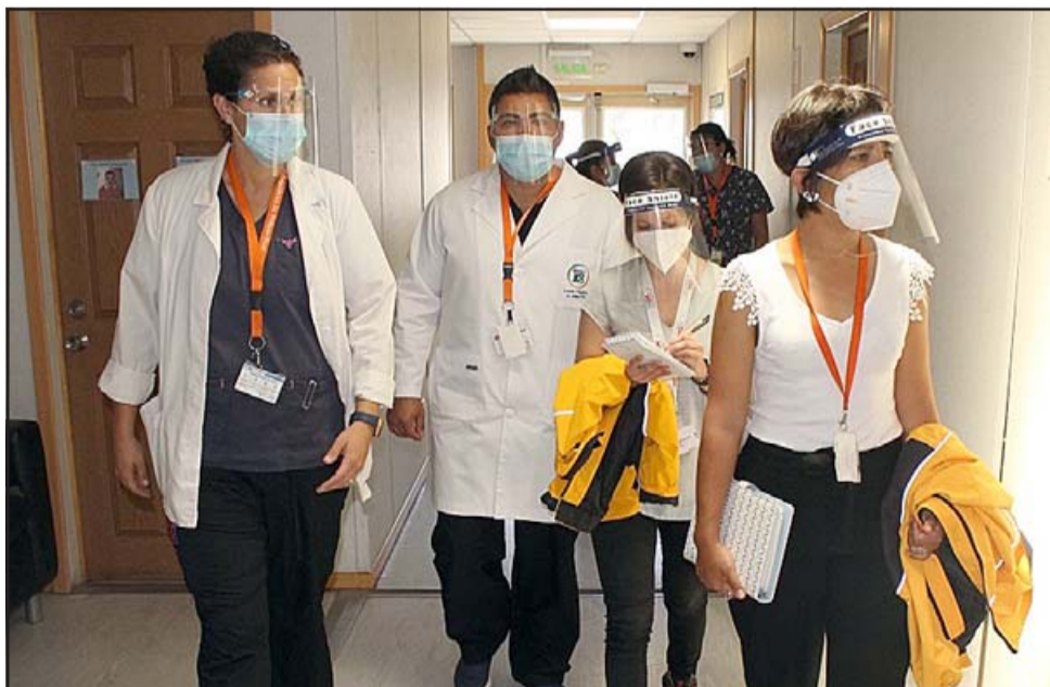
El equipo del INDH recorrió las unidades de psiquiatría general y forense, donde destacaron la calidad de las instalaciones y las prestaciones a las que tienen acceso los usuarios.

Las funcionarias del INDH también valoraron el traslado a dependencias modulares transitorias de algunas unidades clínicas, definiéndolo como un proceso ordenado y seguro. Al mismo tiempo, relevaron que el Hospital Psiquiátrico de Putaendo es el único en el país en vacunar a sus usuarios contra el Covid-19.