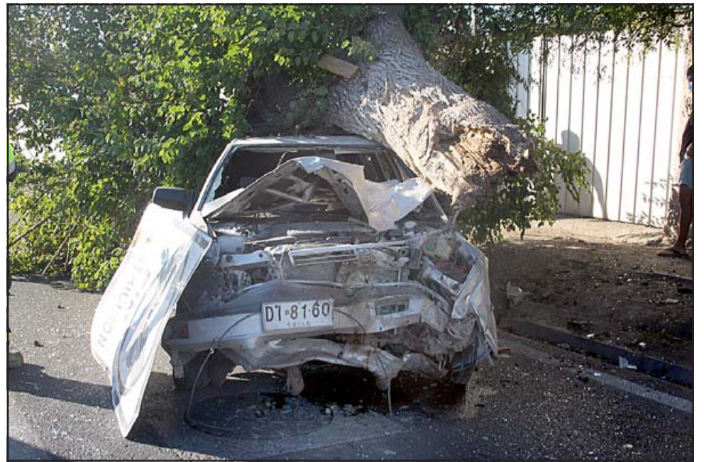
IMPRESIONANTE.- La escena refleja con claridad que este vehículo se desplazaba a gran velocidad, pues arrancó el grueso árbol y lo arrastró a más de 15 metros de su base.