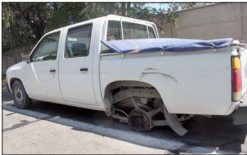
FALLA MECÁNICA.- Así quedó la camioneta a un lado de la vía, luego que su llanta trasera izquierda se desprendiera de su eje.