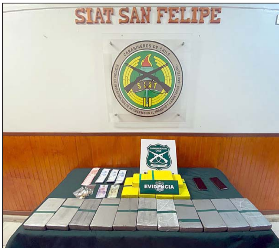
Más de 19 kilos de droga incautó personal de la SIAT de Carabineros en control policial.

El Fiscal de Turno dispuso de la presencia de personal de la Sección OS7 para determinar qué tipo y cuánta droga había encontrado el personal de la SIAT. «Se