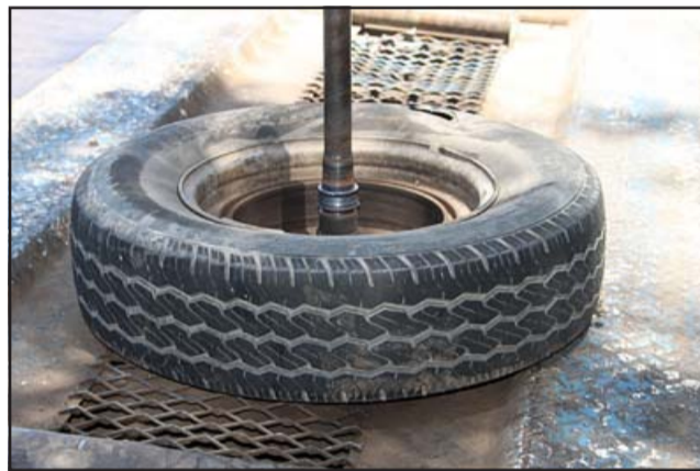
MUY PELIGROSA.- Esta es la llanta que golpeó a mediana velocidad al ciclista que venía hacia San Felipe por la ruta Troncal 601 Panquehue.

PANQUEHUE.- Un motociclista resultó herido tras ser impactado por la llanta trasera izquierda de una camioneta, luego que la misma se desprendiera de su eje la tarde de este viernes a la altura del kilómetro 161 de la ruta Troncal 601 Panquehue. La camioneta se dirigía en dirección a Catemu