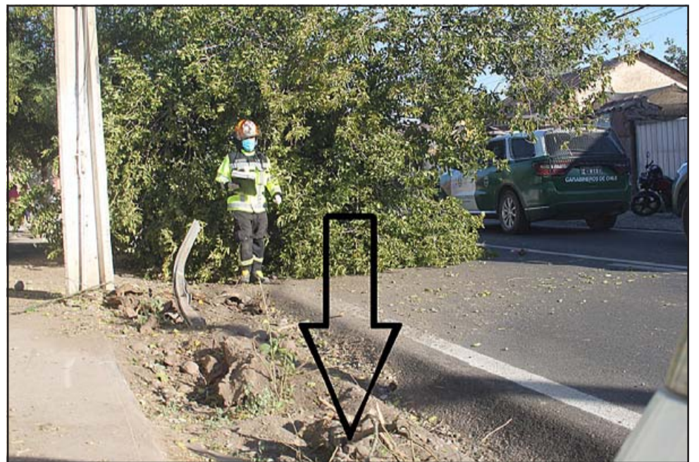
TREMENDA ENERGÍA.- La flecha marca la base donde estaba el árbol. Al fondo, debajo de esas ramas y su tronco quedó el vehículo en sentido contrario al tránsito.