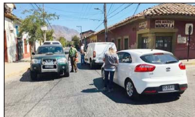
Tanto personal de Carabineros como de la Autoridad Sanitaria efectúan control a conductores en la intersección de calle Coimas con Avenida Chacabuco en San Felipe.

«Hay ciertos servicios básicos que van a estar funcionando, pero tanto las ferias libres como los super-