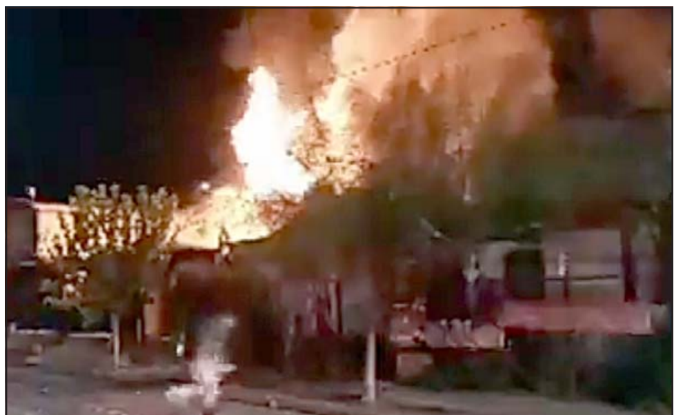
NOCHE INFERNAL.- El dantesco incendio dejó dos casas totalmente destruidas y a tres familias apenas con lo puesto.

También el Cefsam Valle de Los Libertadores hizo envío de medicamentos de reposición a los afectados que presentan patologías crónicas. Además, la Oficina de Fomento Productivo