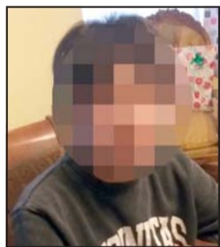
APARECIÓ.- En Curimón fue encontrada anoche la menor.

Gran angustia y honda desesperación vivió toda una familia sanfelipeña luego que su hija menor, V.L.V.B. , de 16 años de edad y estudiante de tercer medio en un céntrico colegio de San Felipe, decidiera no ingresar al establecimiento donde estudia, optando por devolverse de la puerta de su colegio y des-