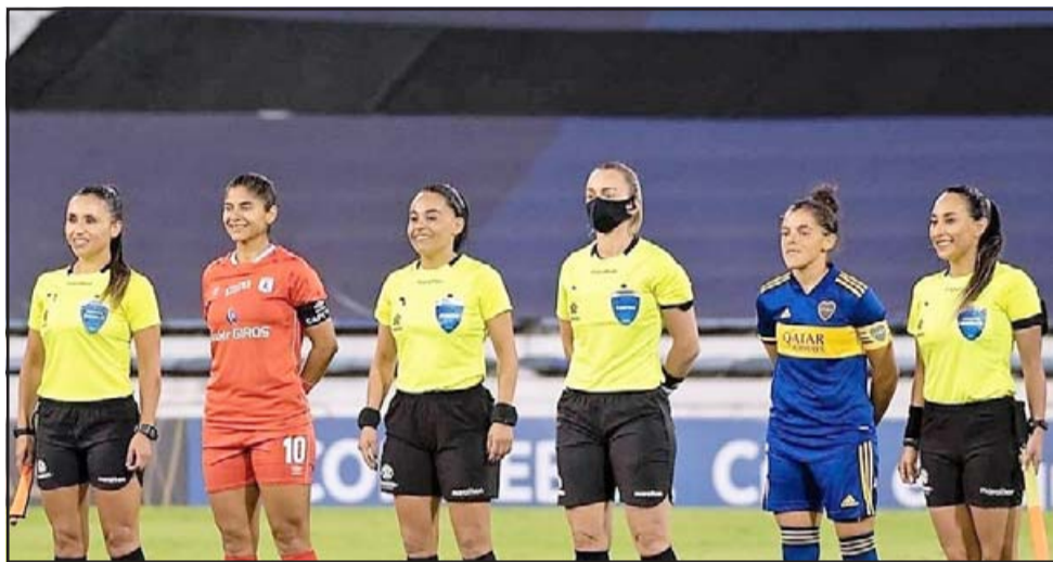
La sanfelipeña (tercera de izq. a derecha) sigue haciendo historia en el referato femenino nacional.