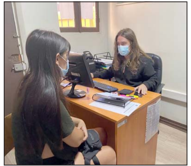
Profesionales de la Dideco estarán brindando apoyo para postular a los programas del Fosis.

Para los interesados que necesiten apoyo en la postulación, pueden dirigirse a Yervas Buenas 330, de 8:30