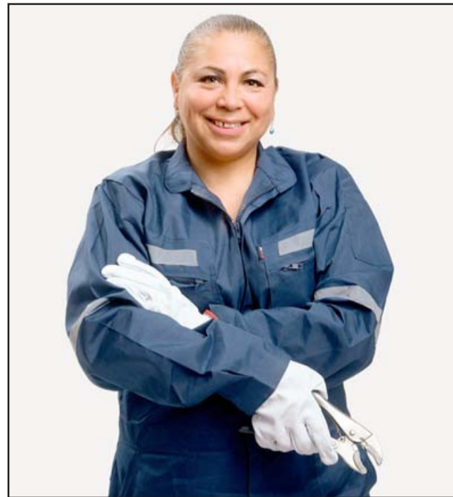
La iniciativa busca fomentar el desarrollo de habilidades de las participantes en un oficio no tradicional, para la mantención y reparación de instalaciones domiciliarias.