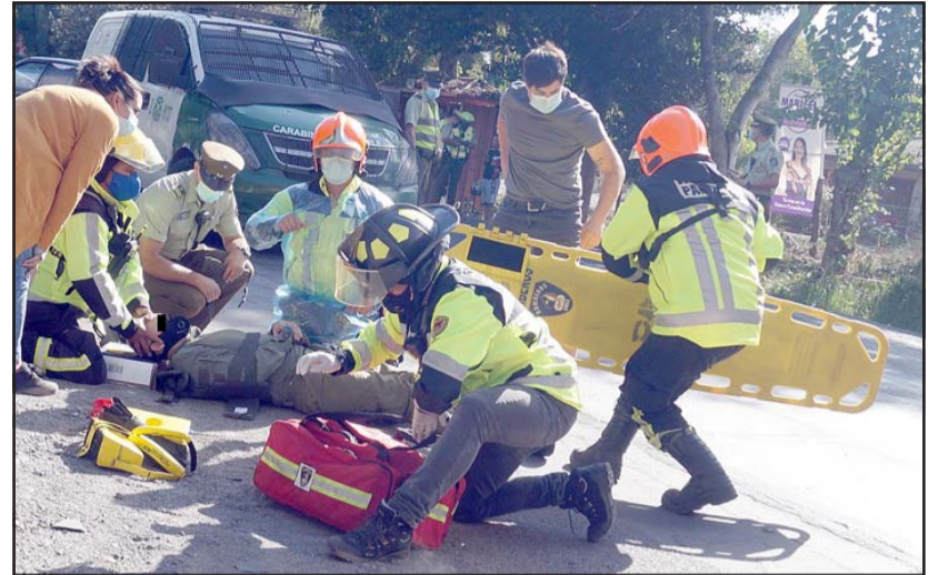
La imagen muestra al funcionario policial en los momentos que es auxiliado por personal de emergencia.

se produjo este domingo en la tarde en la ruta Troncal 601 a la altura del sector La Pirca, comuna de Panquehue.