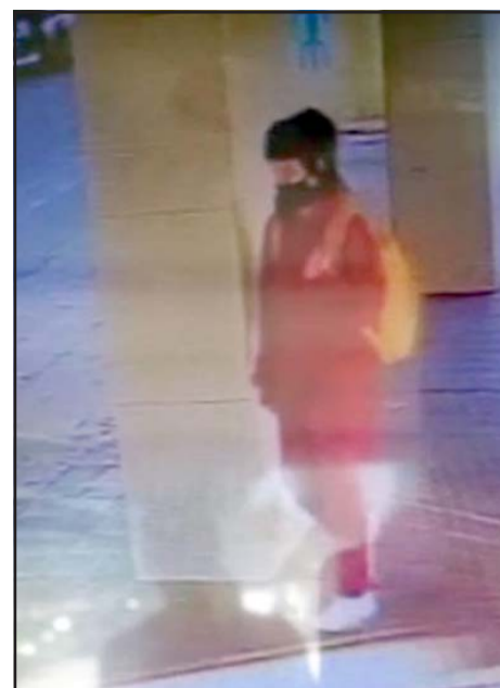
TODO UN MISTERIO.- Las cámaras de un céntrico local comercial en la esquina de Coimas con Merced, registran a la niña caminando sola, sin alguna persona que le obligue a dejar su familia ni a su colegio.

«A las 20:05 horas se recibió una llamada de vecinos, indicando que en Calle Nueva de Curimón, cerca de Discoteque Tres Décadas, había una joven quien coincidía con las descripciones de la niña reportada por Encargo de Presunta Desgracia, y producto de nuestras diligencias policiales del retén, se logró realizar amplios recorridos por nuestro sector, hallamos a la niña que andaba corriendo por ese lugar, haciendo ejercicio al parecer o caminando. Nuestro personal de servicio llegó y la logramos ubicar en Calle San Francisco con Calle El Real. Esta menor coincide en todo con los datos de