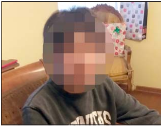
Ayer a eso de las 20 horas apareció la menor.

Niña de 16 años de edad no ingresó a su colegio