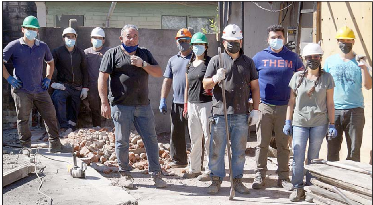
MANOS AMIGAS.- Ellos sólo son parte del gran voluntariado que está apoyando a estas familias con el levantar cimientos para crear un muro.