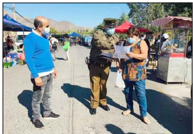
La feria Diego de Almagro fue otro de los puntos claves que se estuvieron controlando el fin de semana.