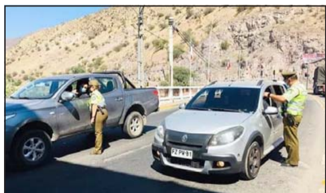
El Puente El Rey también fue uno de los lugares donde se establecieron puntos de control.