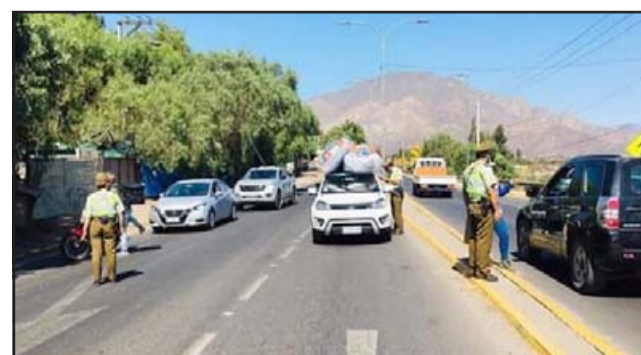
En la imagen, personal de Carabineros controlando en el camino a Putaendo.

En tanto la comuna de Putaendo, que estaba en Fase 3 de preparación, retrocede a Fase 2 de Transición, es decir cuarentena los fines de semana y festivos.