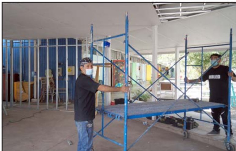
SALA DE PROFESORES.- Aquí quedará instalada la nueva Sala de Profesores en pocas semanas, un recinto más que necesario para los docentes y asistentes.