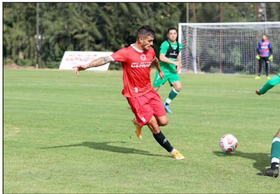
Habrà un descenso en el campeonato donde el Uní Uní debería buscar ser un actor estelar.

que, «esperamos que sea el inicio de decisiones que tengan siempre ética y justicia deportiva como bastión de desarrollo. Se levanta la paralización y agradecemos a la asamblea (de futbolistas) su apoyo incondicional. Nos ponemos a disposición desde ya para generar un trabajo conjunto real que deje la mezquindad y los intereses particulares de lado», expresó la agrupación que reúne a los jugadores de fútbol profesional en el país.