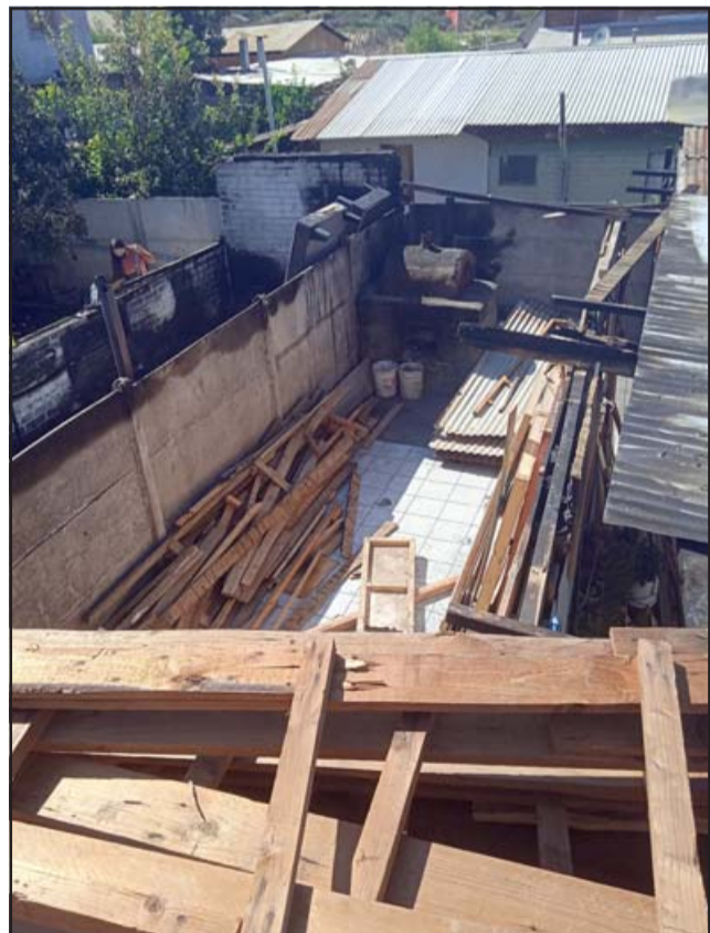
A EMPEZAR DE NUEVO.- Así se ve el escenario desde el techo de una casa vecina.