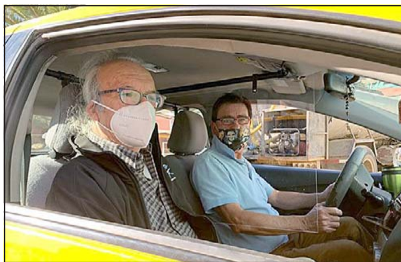
La Seremi de Transporte de Valparaíso sostiene que los taxistas ilegales no deben existir, y que las fiscalizaciones se harán siempre donde ellos estén operando. (Foto Referencial)

estar muy aislados y nosotros como móviles somos ahora una solución para la gente de la comuna, porque los colectivos autorizados hacen el servicio solamente desde la Plaza de Santa María a la de San Felipe, nada más, en cambio nosotros como informales realizamos recorridos a todos los sectores dentro y fuera de la comuna, o sea intercomunales e interregionales también. Señalar que en un colectivo pueden viajar hasta cuatro pasajeros, con un riesgo mayor de contagio, en nuestro caso sólo sube quien solicita el servicio, nadie más (...) En cuanto a los operativos de fiscalización, sentimos que de alguna manera se han ensañado con nosotros porque son muy seguidos en esta comuna, ya son cuatro los autos en el corral, el Estado tampoco nos da la oportunidad para que nosotros los móviles informales podamos llegar a ser