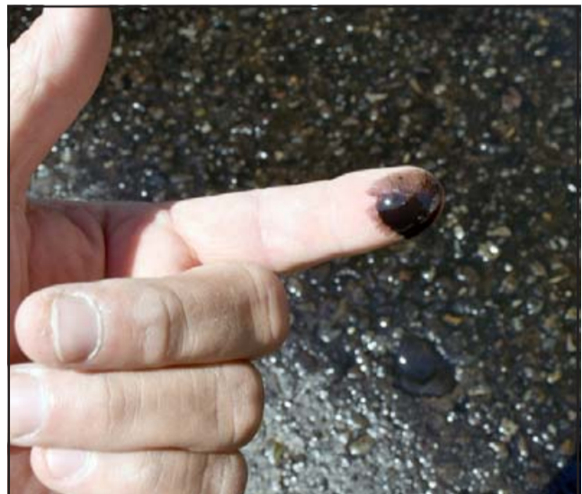
PETRÓLEO.- Diario El Trabajo verificó el estado de la vía, quedó cubierta de aceite quemado al menos unos 500 metros de un carril.