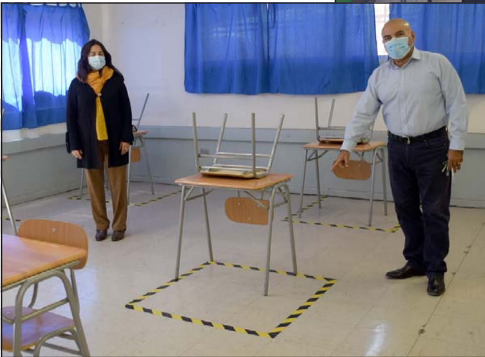
PROTOCOLO.- El director del liceo nos muestra las demarcaciones dentro del aula, la distancia y mascarilla son pautas necesarias y obligatorias.

ca y media, y de seis niños en prebásica. En total somos 75 personas de la planta docente del liceo. El horario presencial es de lunes a viernes de las 8:00 a las 14:00 horas, y como está aplicándose casi en todo el país, el resto de estudiantes reciben sus clases vía Internet desde sus hogares. Cada semana se turnan. Decir también que en las clases presenciales los niños cuentan con tres recreos de 25 minutos