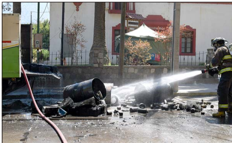
INCENDIO CONTROLADO.- Los bomberos remojaron el material inflamable hasta que no quedaran posibilidades de reincendiarse.