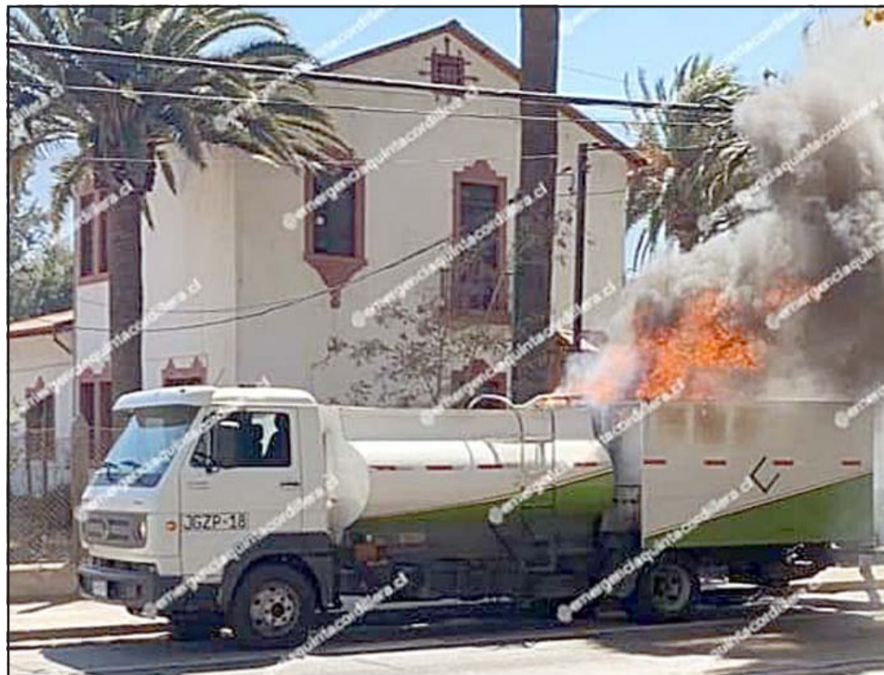
EN LLAMAS.- Las llamas envolvieron rápidamente el camión cargado con aceite quemado, no hubo explosiones.