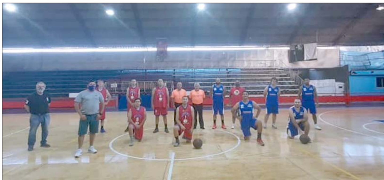
La división de básquetbol del club Arturo Prat cuenta con un nuevo directorio.