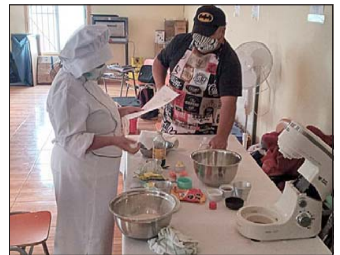
Las alumnas y alumnos siguieron atentamente las instrucciones en esta capacitación que impulsó Codelco Andina.

logo y acercamiento entre División Andina y la comunidad, en la búsqueda de mayores oportunidades de desarrollo.