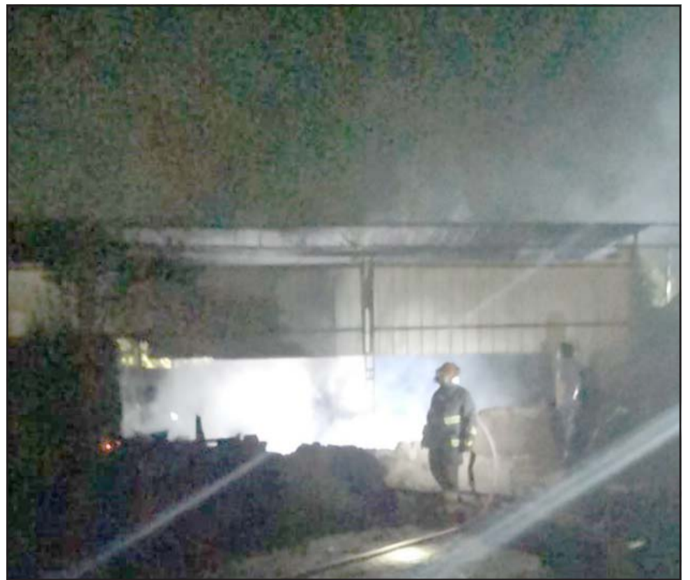
Personal de Bomberos trabajando en el incendio.

En total se quemaron cuatro automóviles y una motocicleta, además de madera aperchada que había en el lugar.