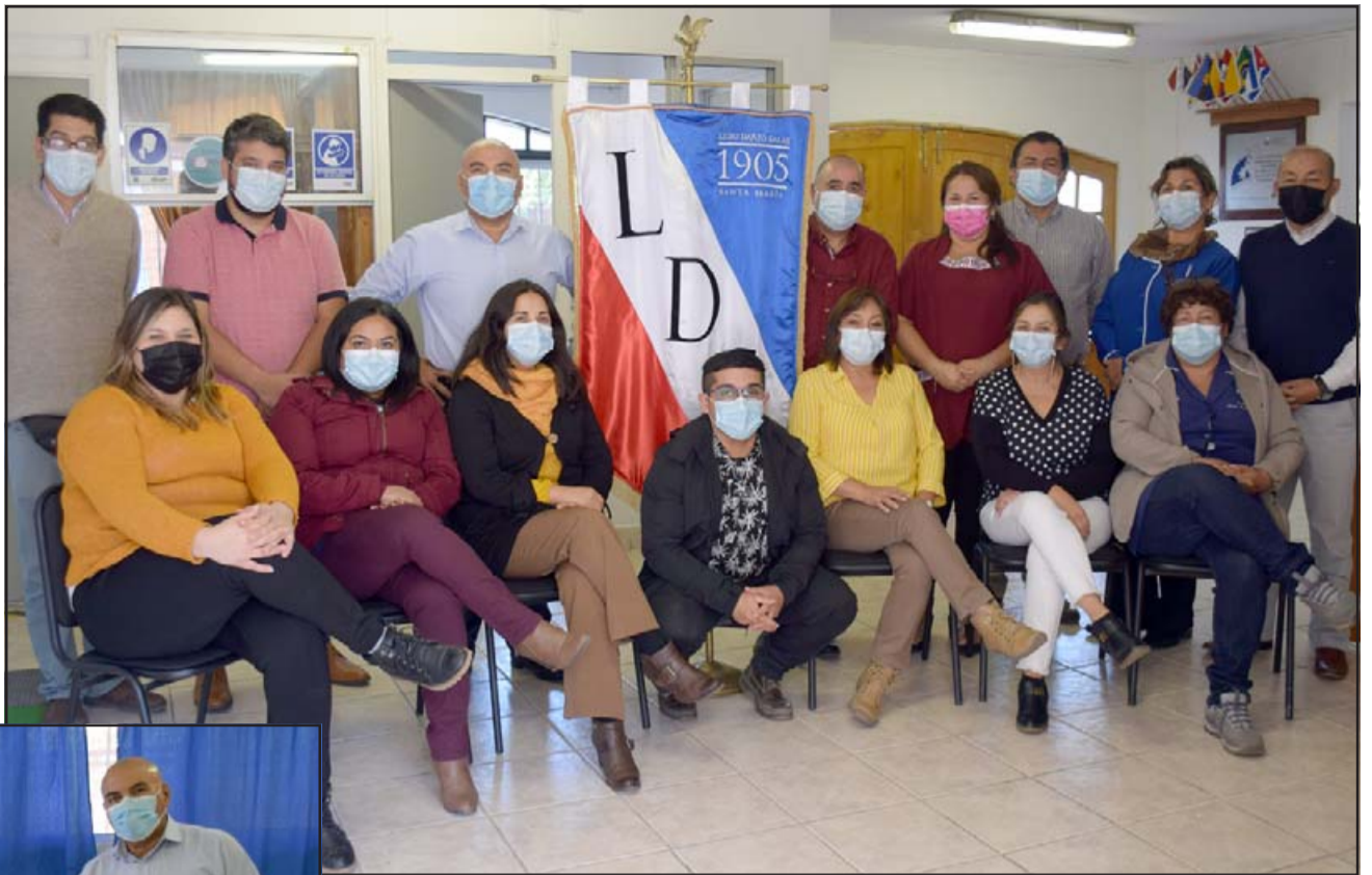
LOS ANFITRIONES.- Ellos son parte del equipo docente que a partir de este lunes 29 de marzo tendrán el deber de recibir y atender a cientos de estudiantes en sus aulas.

«La matrícula de nuestro liceo es de 412 estudiantes desde prekinnder a cuarto medio técnico profesional, por cada sala el aforo permitido es de diez alumnos en bási-