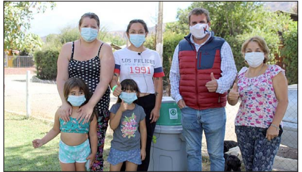
CERCANO A LOS SUYOS. - Este concejal catemino sigue visitando, casa por casa, cada rincón de la comuna de Catemu. Entre sus soluciones está crear un nuevo cementerio para toda la comuna.

- Nobleza obliga. Vamos a apoyar para que la pequeña agricultura no desaparezca. Vamos a asesorarlos para que accedan a proyectos sobre uso eficiente