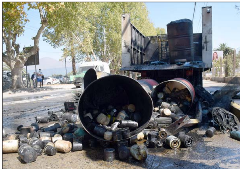
CONTAMINACIÓN.- Muchos litros de aceite se requemaron y el resto se derramó por la calle.