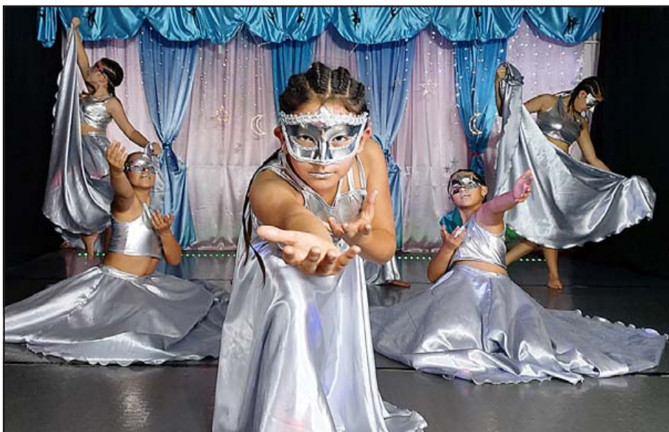
FABULOSAS. - Ellas presentaron la coreografía grupal contemporánea denominada 'El Metal', la que obtuvo primer lugar en la pasada competencia, logrando clasificar a toda la academia para el Internacional en Cancún.