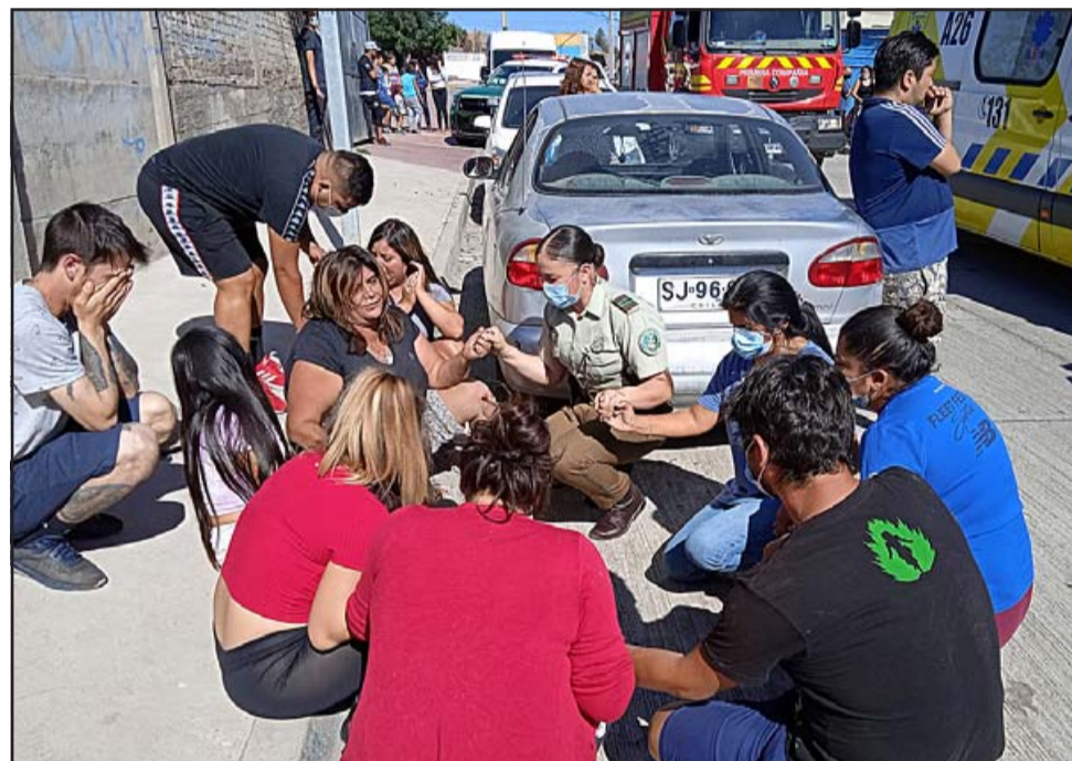
EN ORACIÓN.- En un acto de solidaridad y humanidad, esta oficial de Carabineros y los vecinos del sector se unieron en oración para rogar a Dios no se llevara al pequeño niño.

no de 6 años jugando con una pelota. El oficial señaló que «el menor comenzó a sentirse mal, indicándole a su hermano que estaba un poco mareado y tenía ganas de vomitar, procediendo a apoyarse en la baranda, adoptando una posición con la intención de vomitar hacia abajo, siendo en ese momento en que se desvanece, pierde el equilibrio y cae al vacío», señaló García.