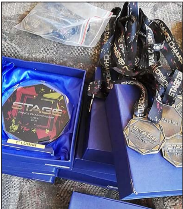
GRAN COSECHA. - Muchas son las medallas y galvanos que esta Academia cosechó en 2020, a pesar de la pandemia.