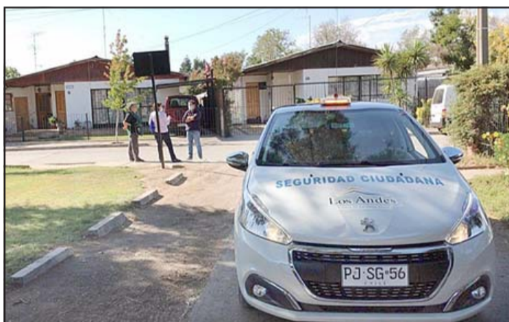
La iniciativa tiene el propósito de brindar una mayor cercanía con los vecinos andinos.

Se espera que estas rondas se sigan realizando en la zona urbana y rural de Los Andes, contando con el apoyo de Carabineros, Policía de Investigaciones y Fuerzas Armadas.