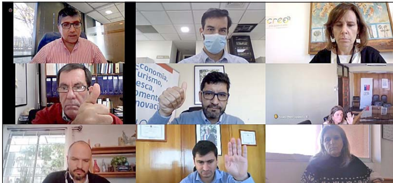
En los próximos días será visto por el Comité de Ministros junto a la postulación de Valparaíso, por lo que la Región podría ver ampliada a cuatro de sus comunas declaradas ZOIT.