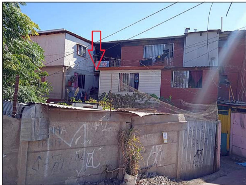
UNA TRAGEDIA.- Desde este tercer piso cayó el pequeño niño, resultando sus heridas incompatibles con la vida.

El oficial descartó la participación de terceras personas en la muerte del menor.