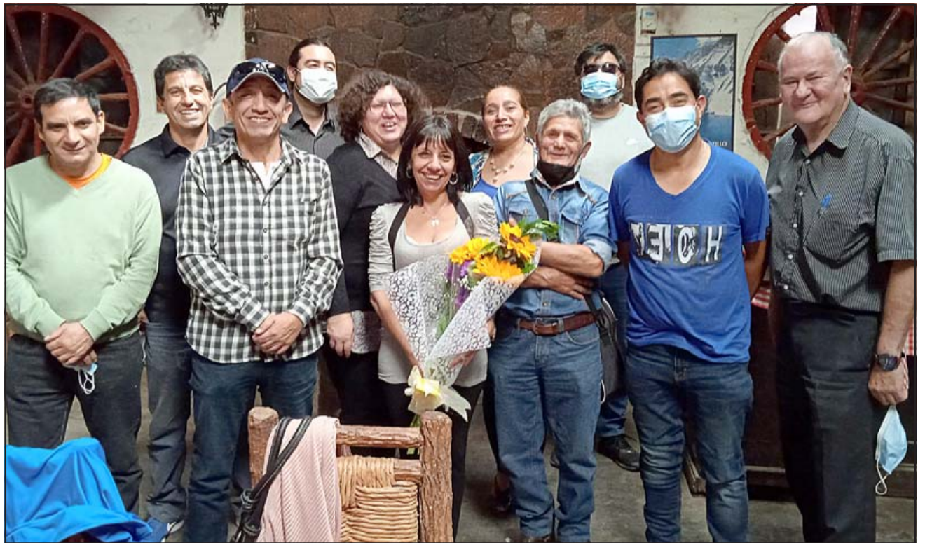
BURBUJA LABORAL. - Ellos son parte de nuestro equipo periodístico, administrativo y gerencial, quienes disfrutaron este viernes de un almuerzo especial en La Ruca.