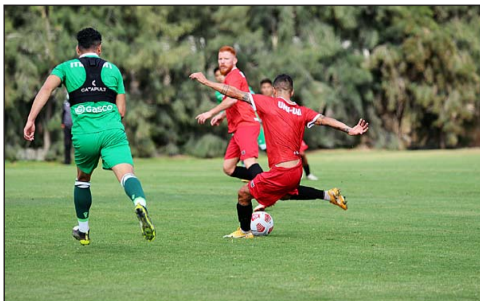
El conjunto aconcagüino durante una de las prácticas futbolísticas de pretemporada.

Sábado 3 de abril 15:00 horas: Puerto Montt – Deportes Copiapó. Domingo 4 de abril. 11:00 horas: Magallanes – San Marcos. 11:00 horas: Temuco – San Luis. 11:00 horas: Cobreloa – Barnechea. 11:00 horas: Iquique – Coquimbo Unido. Lunes 5 de abril 20:00 horas: Santa Cruz – Lautaro de Buin. Martes 6 de abril 20:00 horas: Rangers – Unión San Felipe. Lunes 12 de abril 17:00 horas: Universidad de Concepción – Santiago Morning.