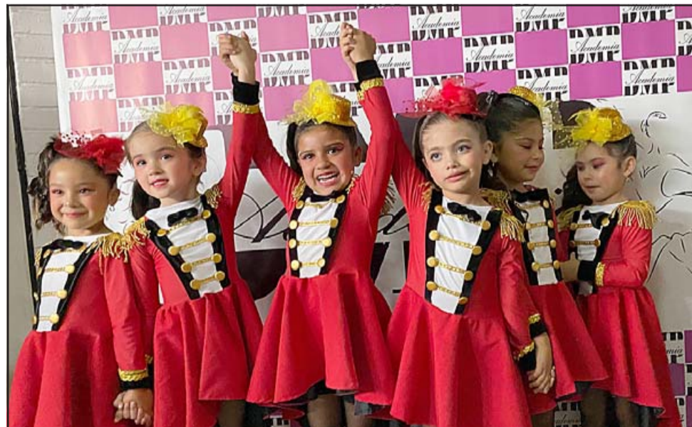
LAS MEJORES DE LA ACADEMIA. - No hay límites de edad para participar en este proyecto artístico aconaguino.