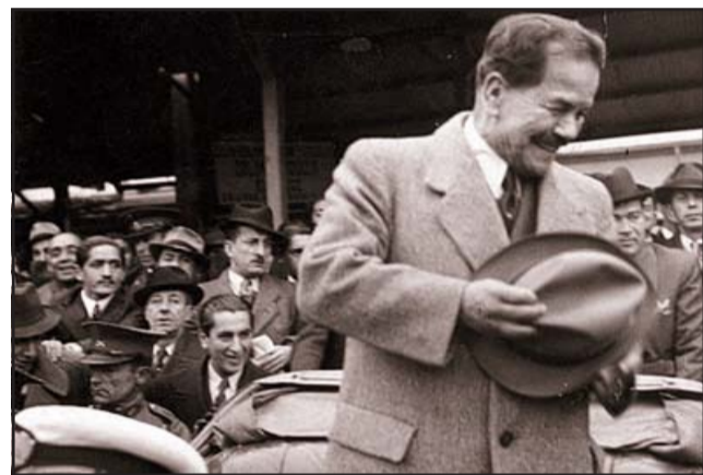
El libro contiene una recopilación de historias y anécdotas del célebre mandatario, recopiladas en una investigación histórico periodística.