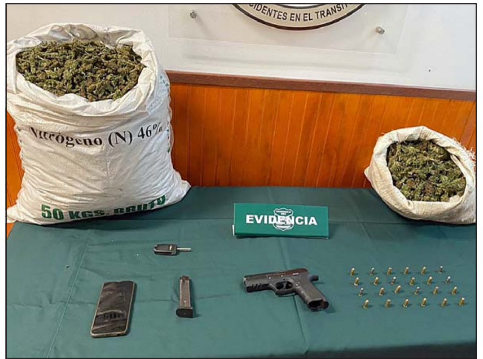
La droga, la pistola modificada y la munición. El arma a simple vista parece a fogeo, y pese a estar modificada para disparar, tiene que ser objeto de una pericia por parte de Labocar.

presentados por la Fiscalía local de San Felipe, el imputado