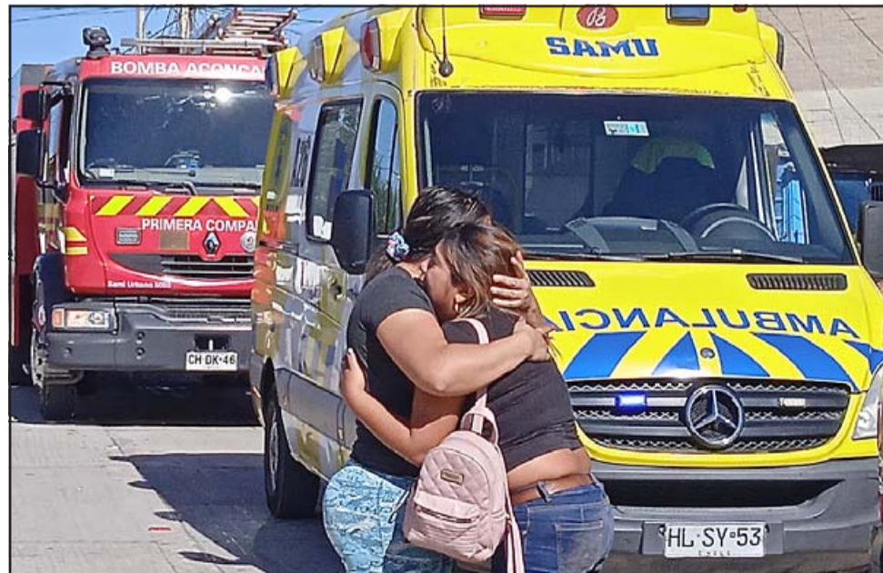
ESTREMECEDOR.- El dolor y desesperanza invadió el corazón de todos en el barrio, nadie podía creer que la vida del menor se apagara en tales circunstancias.