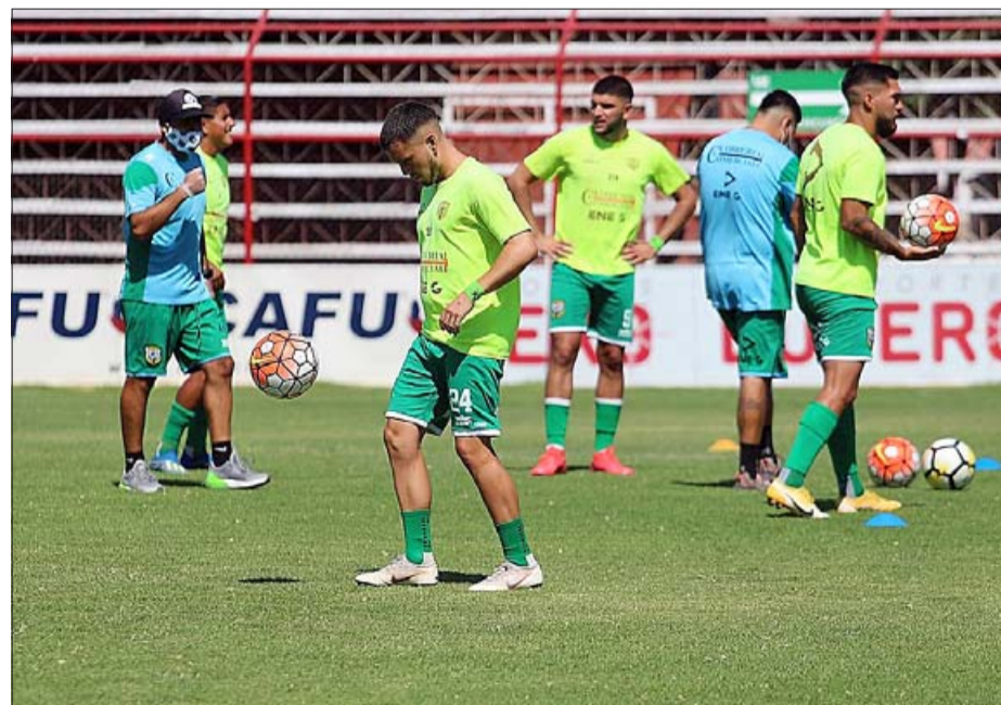
De haber torneo, Trasandino integrará en el grupo centro norte.

Respecto al tipo de torneo, es casi un hecho que se volverá a utilizar el formato de la temporada pasada donde los equipos fueron sembrados en grupos de acuerdo a su ubicación geográfica.