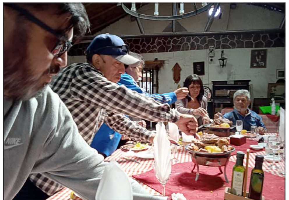
BUEN APETITO. - Cada uno supo disfrutar en grande del banquete ofrecido en este emblemático restaurante.