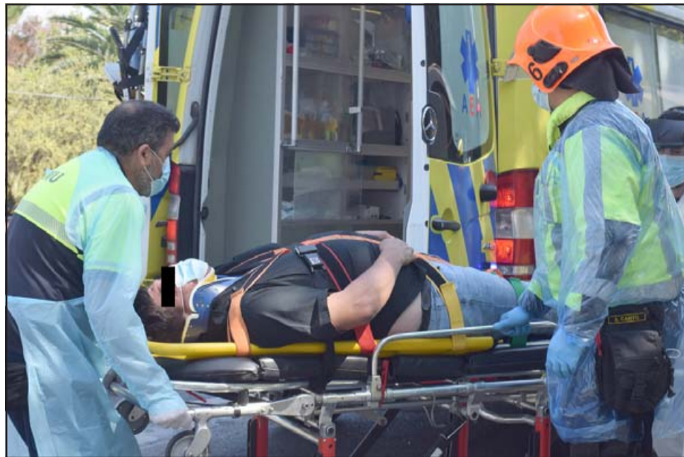
A URGENCIAS.- Este pasajero debió ser trasladado por funcionarios del SAMU al Hospital San Camilo con lesiones de mediana consideración.