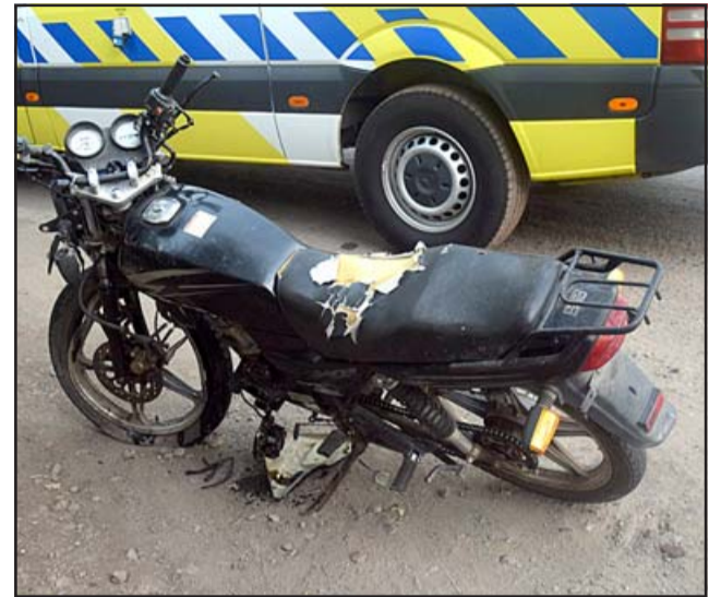
La motocicleta que conducía la joven víctima fatal resultó con serios daños.

Junto con las medidas cautelares mencionadas anteriormente, se fijó un plazo de 120 días para el cierre de la investigación.