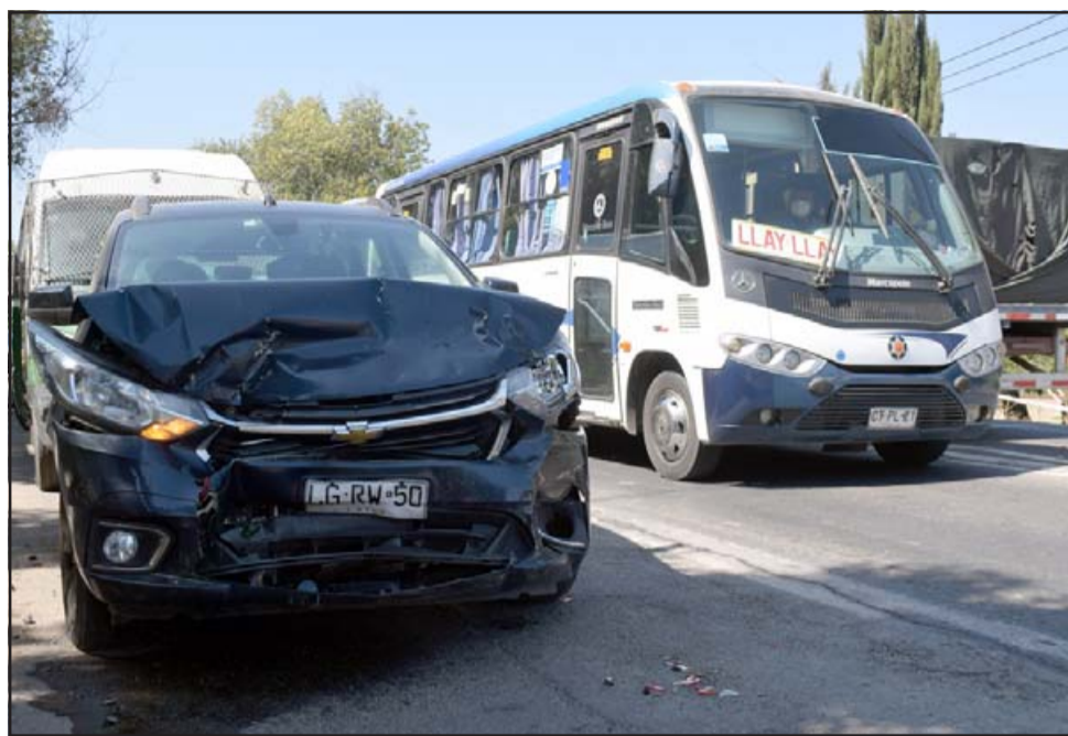
DAÑOS MATERIALES.- si quedó el auto que venía detrás del colectivo tras chocarlo por alcance, finalmente cuatro personas resultaron lesionadas.