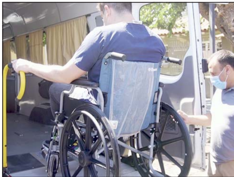
El vehículo cuenta con una rampa que permite el acceso de las personas en silla de ruedas al interior del furgón.

Añadió que a esto se suma la contratación de dos nuevos profesionales, un kinesiólogo y una enfermera: «Se pueden ha-