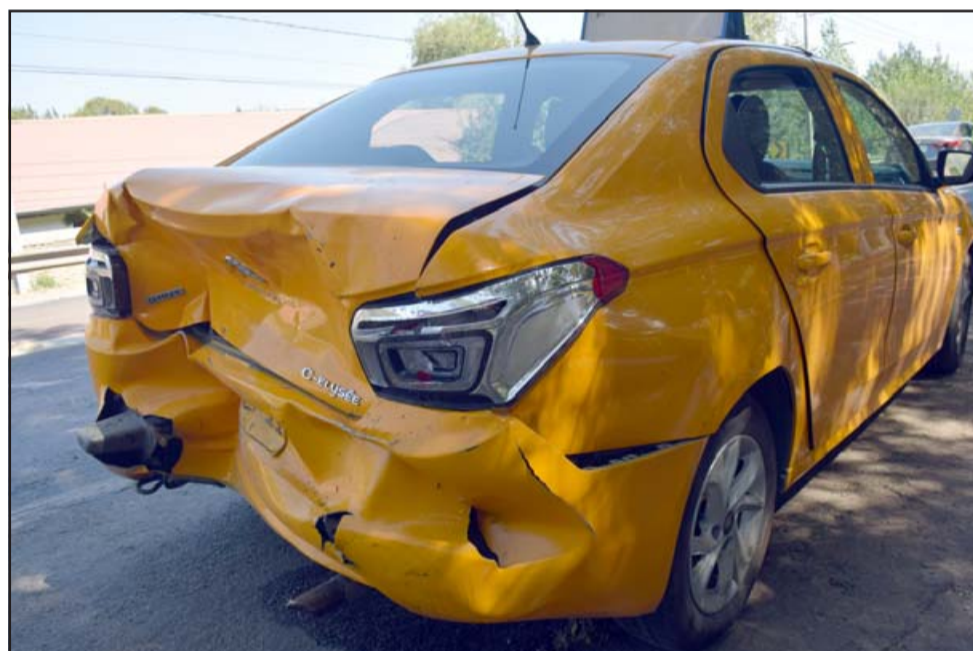
Así quedó la parte trasera del colectivo, el golpe coincide con las versiones de ambos conductores.