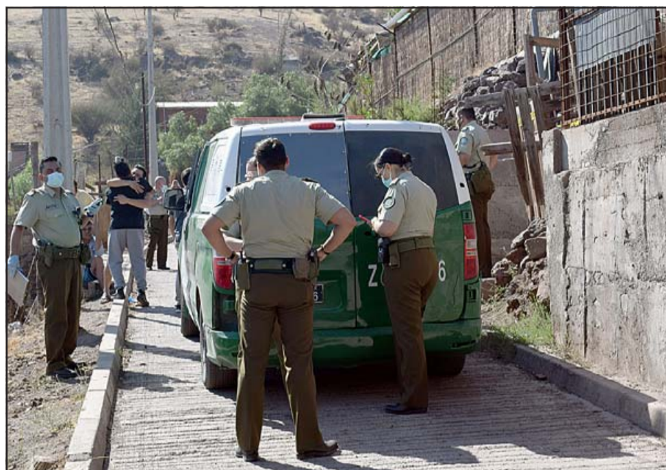
Momentos de dolor se vivieron en el sitio del hallazgo, donde familiares y vecinos no podían creer lo sucedido.