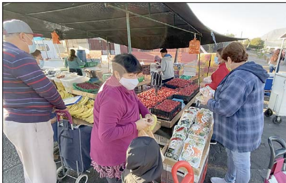
La semana pasada, la Feria Diego de Almagro funcionó el viernes 26 con bastante afluencia de público.