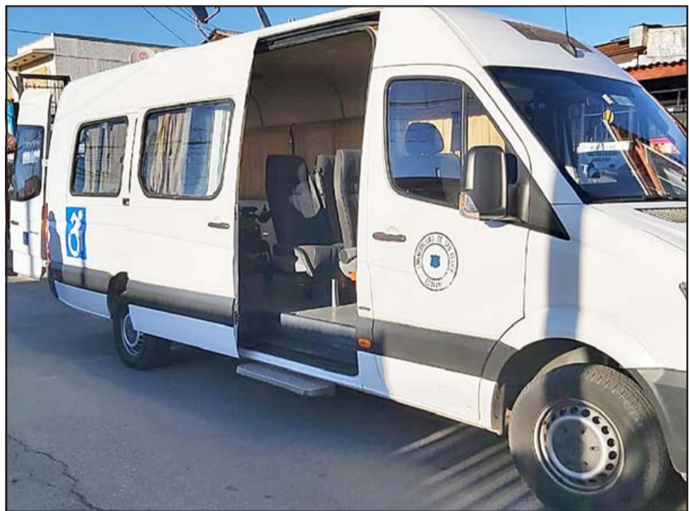
Actualmente este móvil permite el traslado de tres personas en silla de ruedas, además de seis personas sentadas.

cer más visitas domiciliarias y entregar un mejor servicio a domicilio, lo que es un beneficio para nuestros usuarios», concluyó.