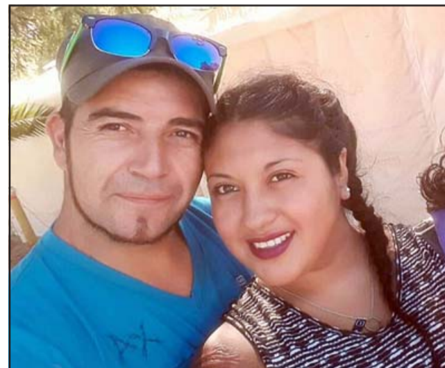
La pareja fue calificada de ejemplar por vecinos del sector que prefirieron no dar su identidad.

El caso causó bastante conmoción en el sector, pues se trataría de dos personas bastante conocidas y a quienes calificaron como una pareja ejemplar.