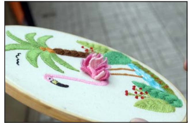
EN 3D. - Aquí tenemos este bello bordado, esta flor es en relieve y pareciera ser verdadera.