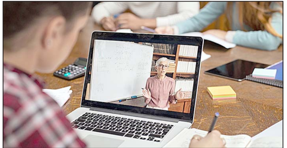
En febrero la Municipalidad de Putaendo tomó la medida comunal de no iniciar clases presenciales en marzo y hacer educación remota, medida que se mantendrá durante el mes de abril. (Foto referencial)

Cabe mencionar que en el mes de febrero, la Municipalidad de Putaendo tomó