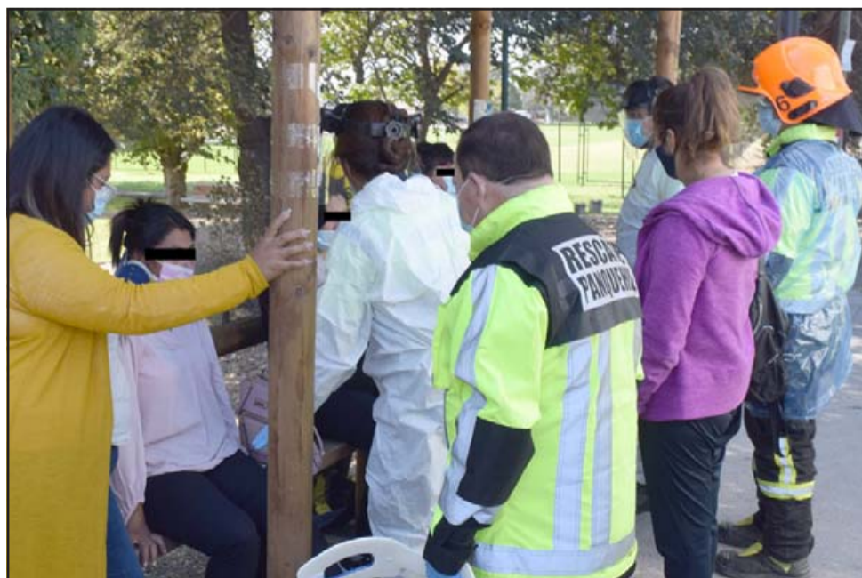
UNA EMBARAZADA.- Mientras la segunda ambulancia llegaba al lugar, estas pasajeras fueron valoradas en el paradero.