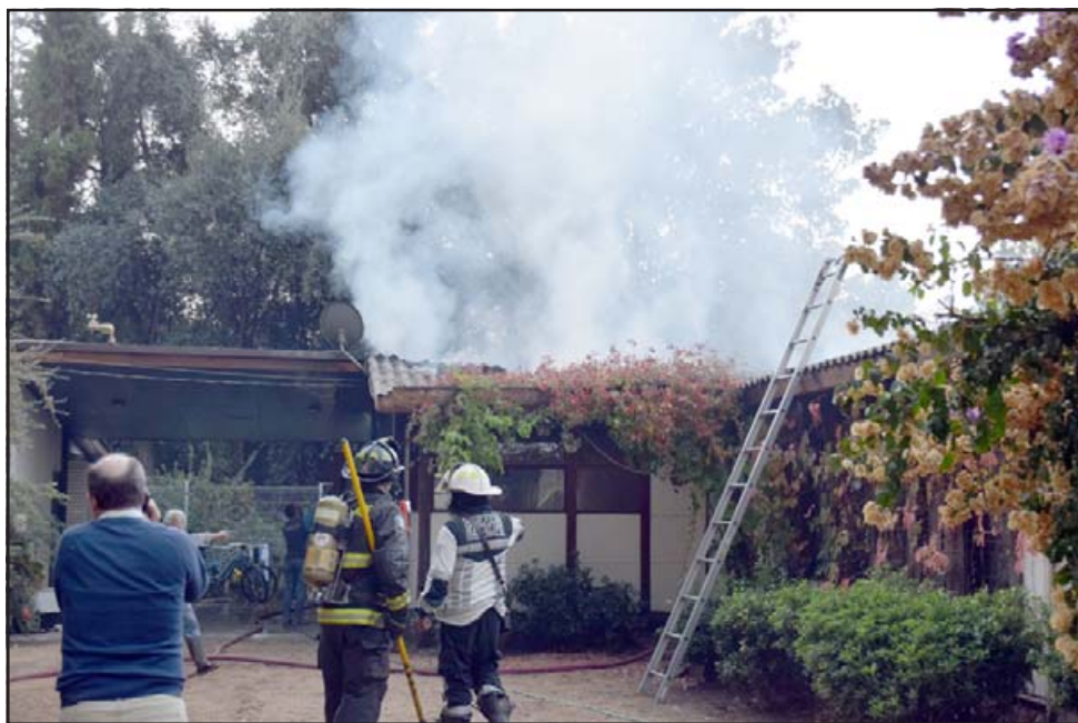
AL FIN CONTROLADO. - Se necesitaron unidades y personal de seis Compañías de Bomberos para controlar el siniestro.

un incendio estructural afectando casi la totalidad de la vivienda. Debimos trabajar arduo para evitar que se consumiera por completo, trabajaron seis Compañías del Cuerpo de Bomberos San Felipe con una gran cantidad de camiones aljibes por el tema del agua. No se registran personas afectadas en su integridad física, será el Departamento de Investigaciones de Bomberos el que dictaminará las causas de este incendio», indicó Herrera. Roberto González Short