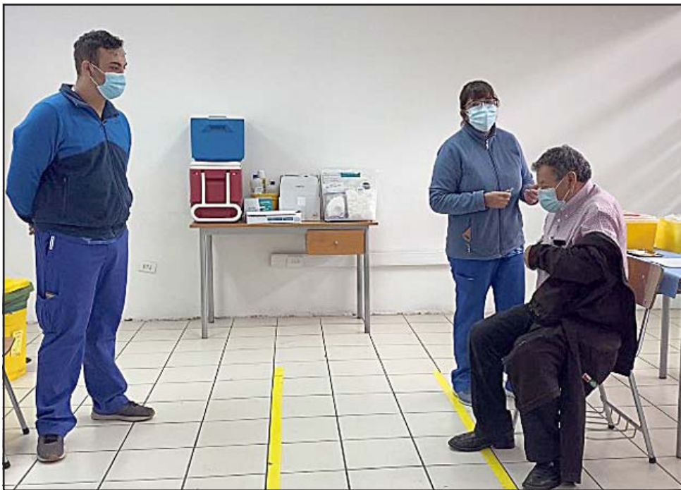
Como dato relevante, es necesario que hayan transcurrido al menos 14 días desde la segunda dosis contra el Coronavirus -sea Sinovac o Pfizer- para recibir la dosis contra la Influenza.

De acuerdo a lo que informa el Ministerio de Salud en la página de la campaña #YoMeVacuno, las personas que viven en comunas en cuarentena no necesitarán permiso para ir a vacunarse, solo deben mostrar su cédula de identidad. Esto siempre que les corresponda recibir la vacuna tanto contra Covid-19 o Influenza según los calendarios publicados.