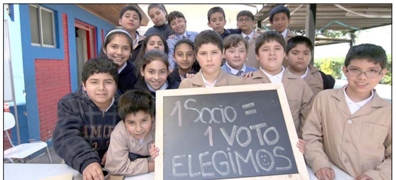
Este proyecto de la Fundación Coopeuch se ejecutará de manera online durante el año escolar 2021.

Las inscripciones para este concurso se podrán realizar entre el 5 y el 19 de abril en la página web www.fundacioncoopeuch.cl y pueden participar liceos técnicos profesionales y li-