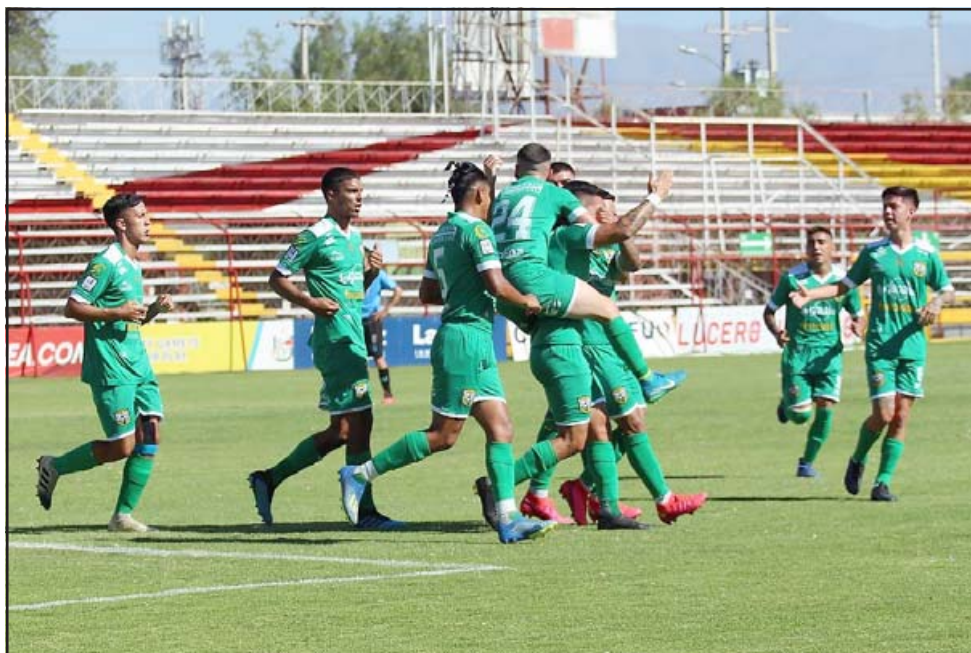
Hasta nuevo aviso y sólo si la Pandemia lo permite, Trasandino y el resto de los clubes de la Tercera quedarán 'congelados'.