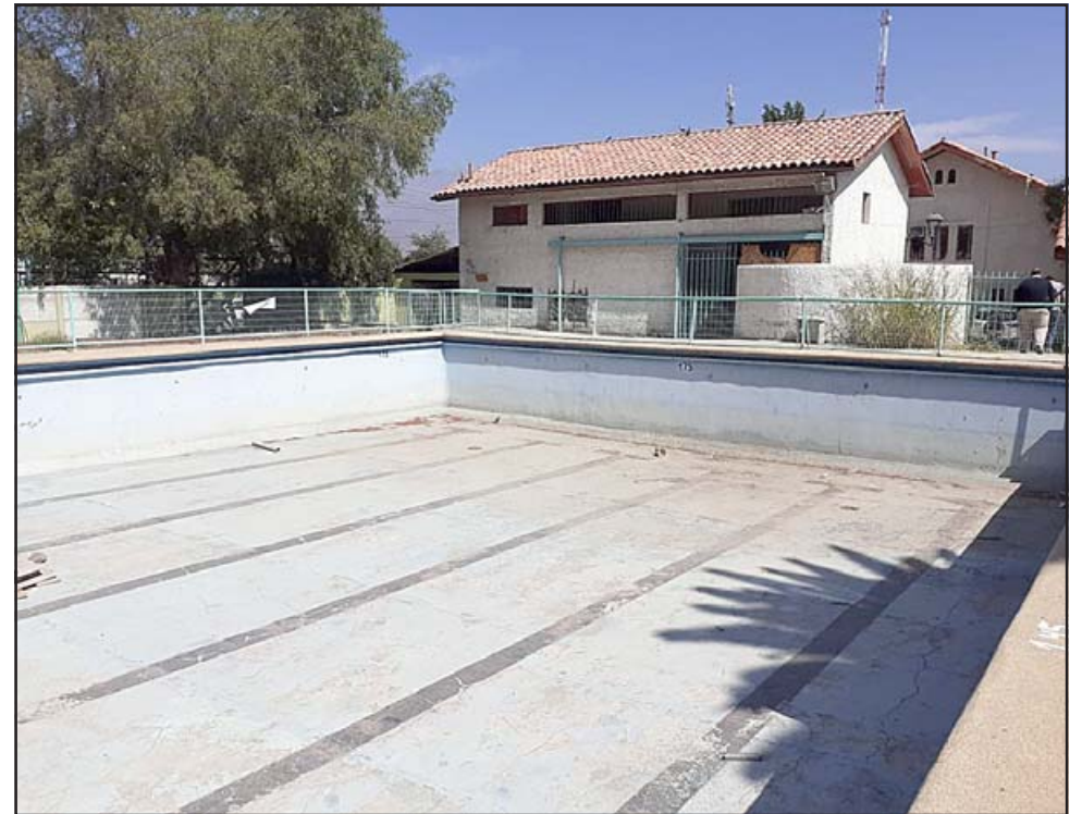
Las malas condiciones en las que se encontraba la piscina llevó al municipio a elaborar un proyecto que permitirá reconstruirla, como también camarines, servicios higiénicos, pavimentos y todas las áreas verdes del lugar.

años contábamos con la aprobación técnica, eran los recursos los que faltaban, así que la aprobación por parte del Gobierno Regional nos pone muy contentos».