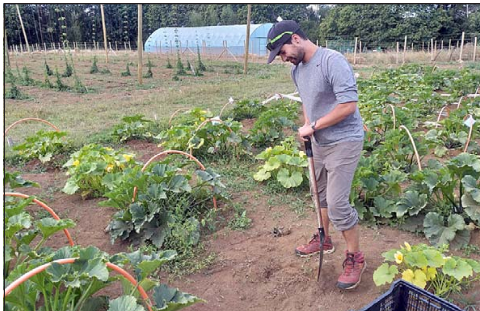
Las propuestas –lideradas por jóvenes entre 21 y 35 años de distintos ámbitos del conocimiento– deben abordar uno de los tres desafíos estratégicos del sector: Eficiencia hídrica y adaptación al cambio climático, desarrollo de mercados y procesos innovadores. (Referencial)

Las postulaciones estarán abiertas hasta este martes 6 de abril y se realizará a través de la plataforma online convocatoria.fia.cl. Las bases y documentos se encuentran en www.fia.cl .