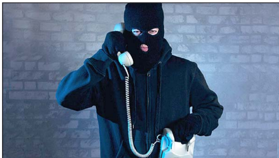
El delincuente, con un tremendo poder de persuasión, casi convence a la joven para que le entregara un código que le habría permitido ingresar a su cuenta Rut.

Recuerda que una vez ya le había sucedido algo similar, por lo mismo se dio cuenta que era una estafa: «A mí ya me había pasado la otra vez lo mismo, pero por otro tema, por una venta de un teléfono, y también me habían llamado, me habían dado un código, pero yo en ese momento me di cuenta que ese código era el código de la APP que uno tiene en el celular, entonces cuando uno da ese código a la persona que la quiere estafar, se mete al tiro a su cuenta y puede sacarle la plata, hacerle de todo a la cuenta de uno, de la cuenta del Banco Estado, entonces ahí me di cuenta cuando me estaba pidiendo mi código, le dije que no se lo iba a dar porque la otra vez ya me había pasado algo similar y que no estafara más a la gente y le corté», señala la joven.