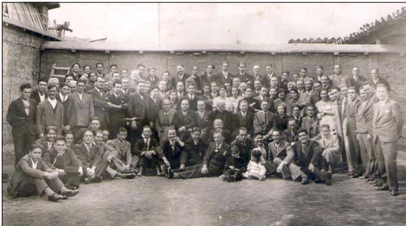
El Club Deportivo y Social de Putaendo fue fundado el 24 de Noviembre de 1934 con el objetivo de promover el deporte entre los habitantes de la comuna.

Durante aproximadamente 76 años (1934 a 2010), fue un lugar referencial asociado al patrimonio inmaterial propio de la cultura popular rural. Actualmente es un lugar en desuso, pero el Club Deportivo mantiene su actividad deportiva y social, congregando a cerca de 280 socias y socios a nivel comunal.