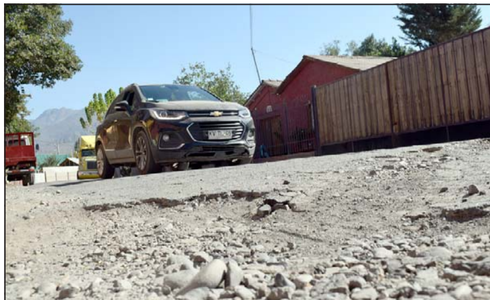
Tampoco estos vecinos pueden postular a Pavimentos Participativos, hasta que reciban su lejano alcantarillado.