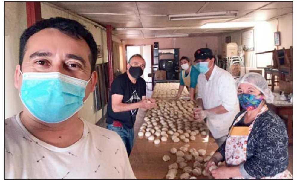
PANADERÍA POPULAR.- Aquí vemos a estos vecinos en plena acción con su Panadería Popular, quienes hacen llegar este pan a las Ollas Comunes totalmente gratis.