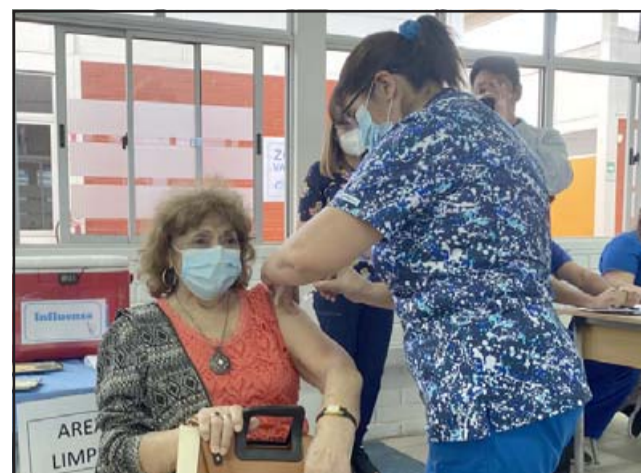
Es importante recordar que la vacuna no protege de desarrollar la infección, sino que ayuda a disminuir el riesgo de enfermar gravemente, de ahí la importancia de vacunarse contra ambos virus.

de los contagios se ve en núcleos familiares o reuniones con amigos. Debemos tomar conciencia, ya vendrán tiempos donde podremos juntarnos con nuestra familia, pero por ahora cuidémonos», sentenció.