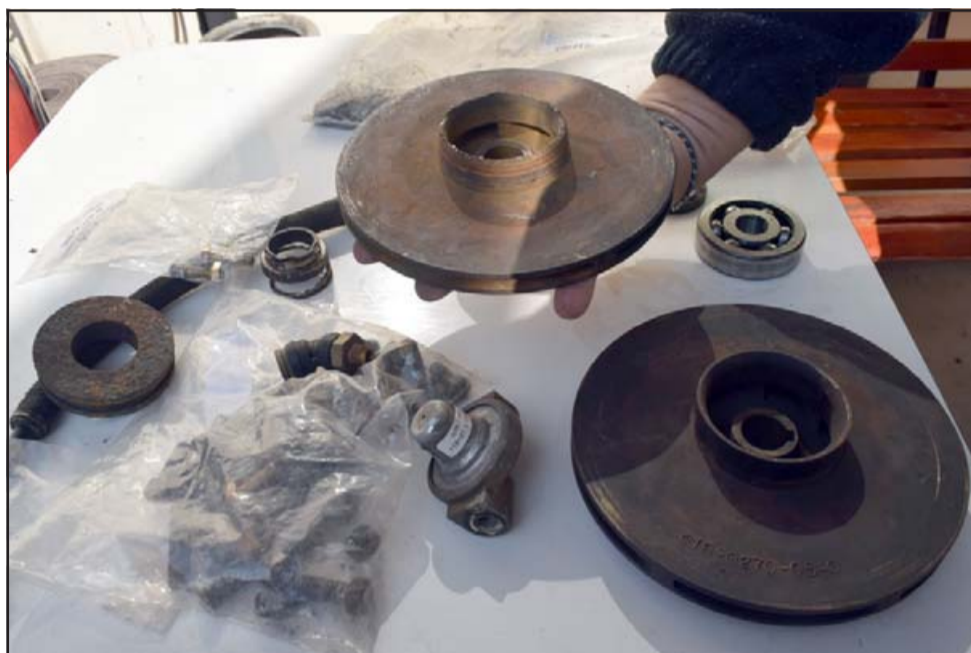
PROBLEMA RESUELTO.- Esta es la compleja pieza dañada, Bomberos pagó más de 7 millones de pesos para traerla e instalarla nueva, desde Estados Unidos.