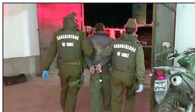
El imputado saliendo del cuartel de Carabineros a constatar lesiones.

El imputado será puesto a disposición del Juzgado de Garantía de Putaendo el día de hoy.