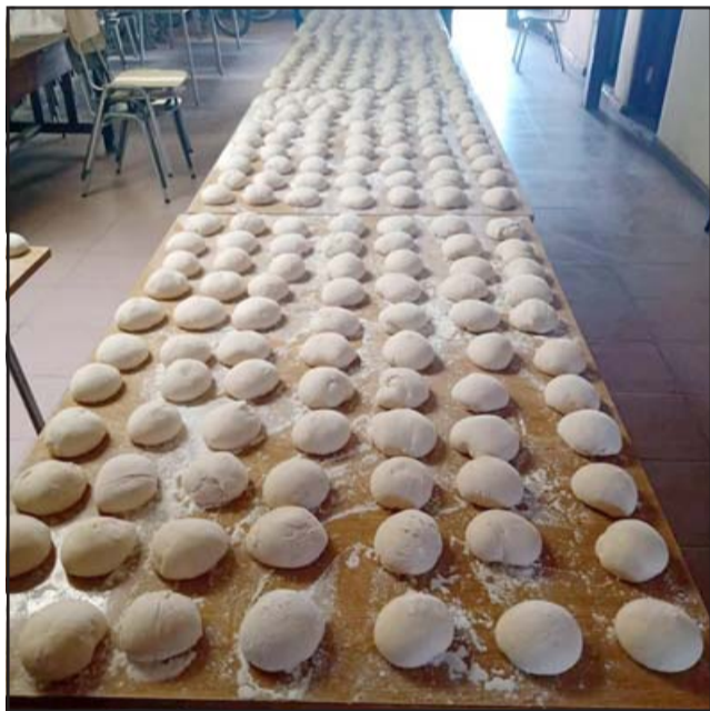
Hasta 1.500 panes por semana han llegado a preparar estos vecinos con su original proyecto.