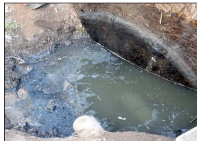
EL SILENCIO POR RESPUESTA. - Esta situación es insostenible, ni en los países más pobres de América se ven, pues en muchos 'países bananeros' se usan drenajes para filtrar aguas.