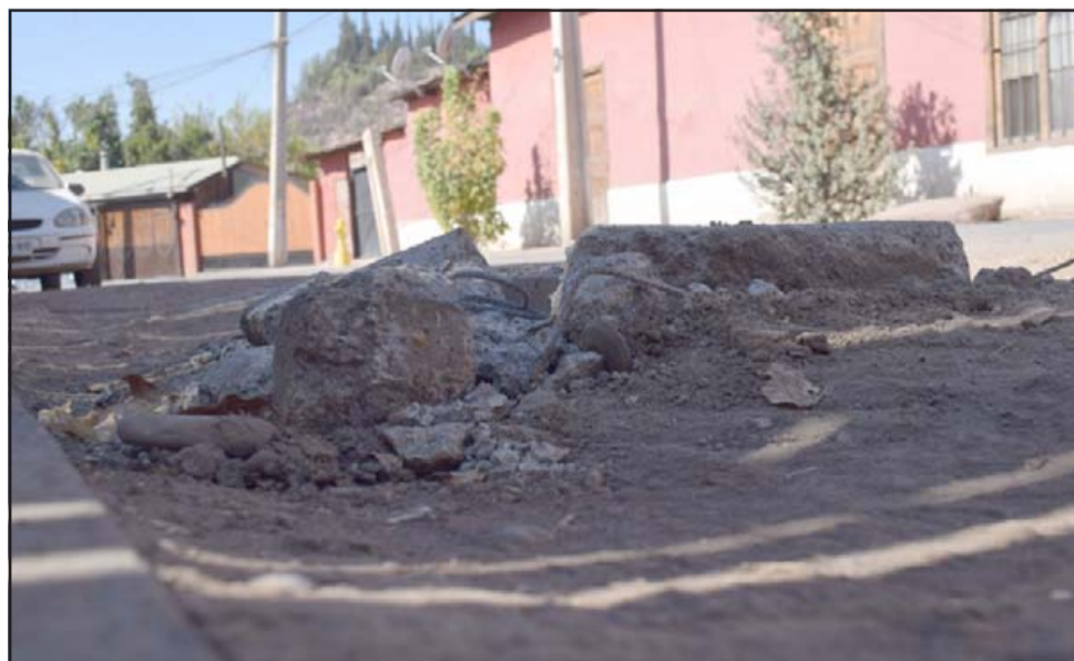
PELIGRO AL PASAR. - La calle principal de Camino del Inca luce así, la constructora Santa Sofía ha dejado cámaras de alcantarillado muy elevadas en media calle.