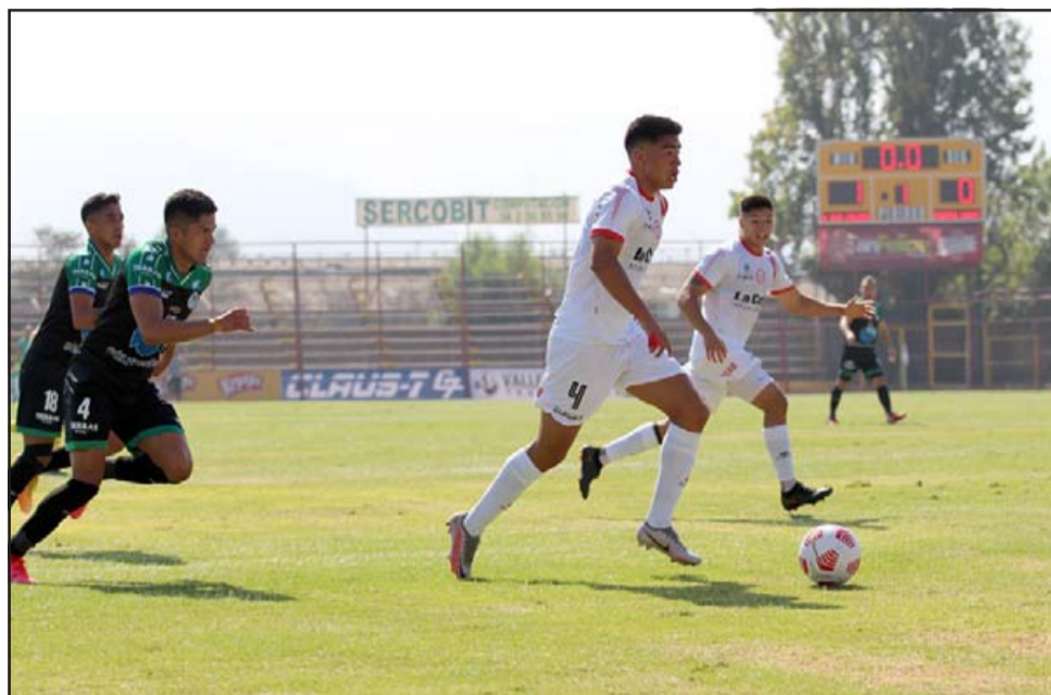
El Uní Uní es el colista del torneo al ser el equipo que más goles ha recibido en las dos primeras fechas.