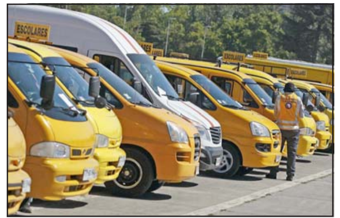
Los dueños y conductores de taxis básicos, colectivos, ejecutivos y de turismo; buses y minibuses urbanos y rurales, y furgones escolares, pueden postular al nuevo bono de $500 mil en apoyo al sector.

Una vez cumplido el plazo de retracto, se enviará un correo a los conductores postulados indicándoles que entrarán a proceso de análisis de antecedentes, el que tiene una duración aproximada de una semana. Una vez finalizada dicha instancia, y en caso de aprobación, se les enviará un mail para que ingresen a la plataforma con su RUN y Clave Única, adjunten una copia de su licencia de con-