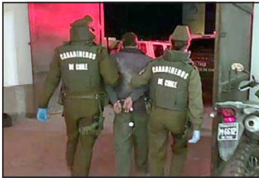
Carabineros lo capturó en tiempo récord

Imputado de 63 años tenía prohibido acercarse a ella