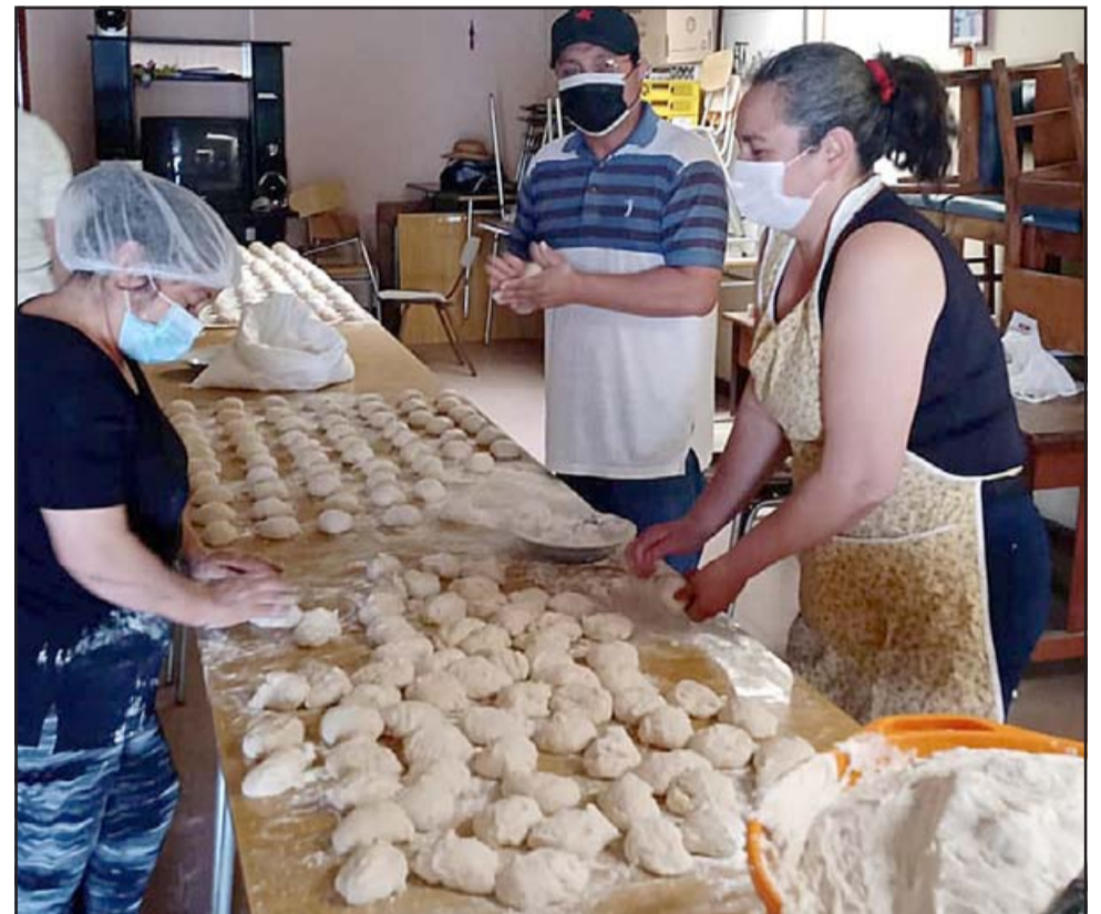
MUY SOLIDARIOS.- Algunos de estos voluntarios pertenecen al Partido Comunista, y empezaron este proyecto como un acto solidario.

- Pueden llamarme al +56 9 6568 5166, también podemos ir a la casa de quienes quieran donar manteca, harina, sal y leva-