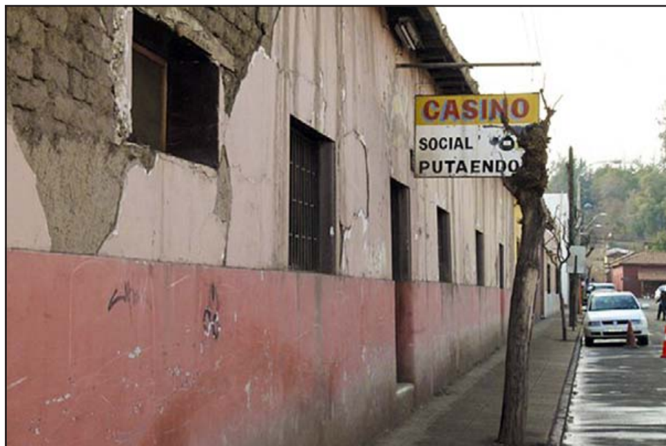
A través del 'Fondo del Patrimonio Cultural', la municipalidad de Putaendo obtuvo $69.852.156 para mejorar preventivamente las actuales instalaciones de la histórica construcción ubicada en calle Camus.

El Club Deportivo y Social de Putaendo (CDSP), fue fundado el 24 de Noviembre de 1934 con el objetivo de promover el deporte entre los habitantes de la comuna, constituyendo una rama femenina de básquetbol y otra masculina de fútbol.