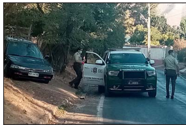
Personal de Carabineros de Putaendo en Rinconada de Silva buscando al sujeto.

Agregó que paralelamente a todo lo anterior, personal de SIP junto a Carabineros de Orden y Seguridad «prosiguieron con la búsqueda del antisocial y agresor, el cual estaba identificado, logrando dar con él en una calle que daba hacia uno de los domicilios que esta persona frecuentaba y logró la detención del mismo, siendo trasladado a la Segunda Comisaría de