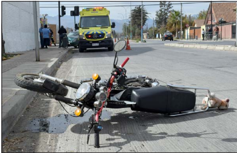
A GRAN VELOCIDAD.- A unos 30 metros del lugar de la colisión fue a terminar la pequeña motocicleta, también con daños.