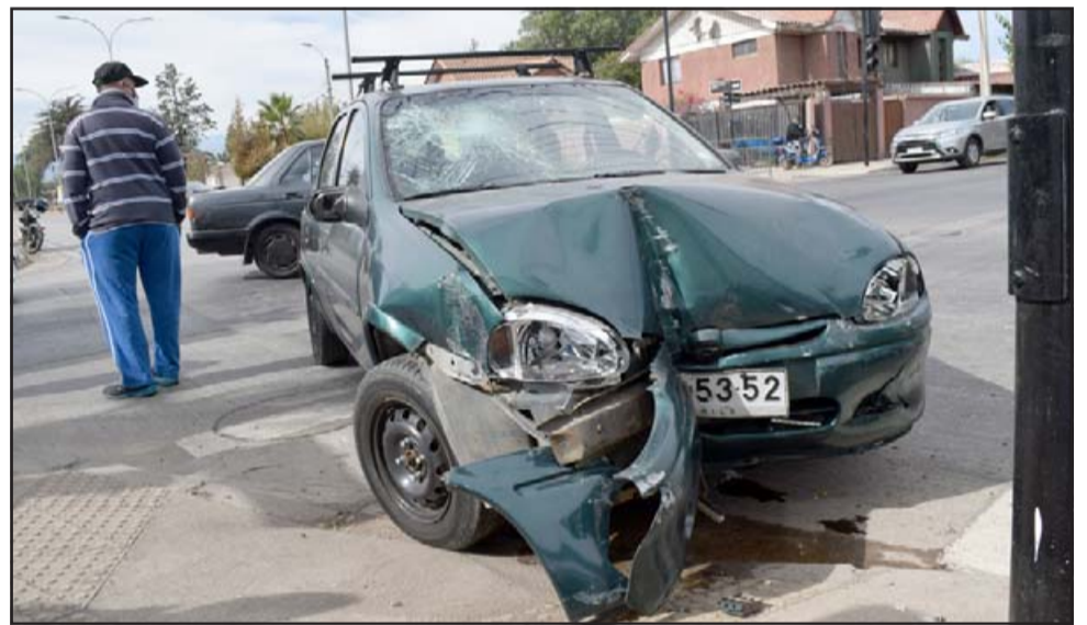
DAÑOS MATERIALES.- Contra este poste del semáforo fue a chocar tras la colisión este auto liviano. Los daños son de consideración.