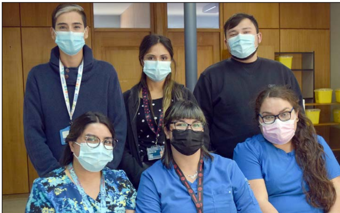
SOLDADOS ANTICOID.- Ellos conforman parte del personal de vacunación que opera en el Cesfam San Felipe El Real.

ra vez, para indicar cuál es la vacuna que se viene a colocar.