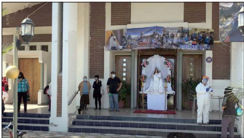
La imagen de la Virgen de Andacollo dándole la bienvenida a los comensales.

Recuerden que a contar de esta semana que viene van a atender de lunes a viernes.