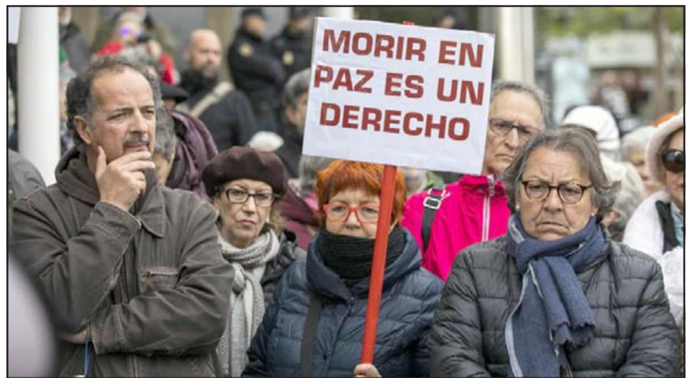
DERECHO A MORIR EN PAZ.- Entre las características de este proyecto se considera necesario recalcar que este derecho será indelegable, es decir, sólo podrá ser solicitado directamente por el enfermo, y sólo optan a él los mayores de 18 años de edad.