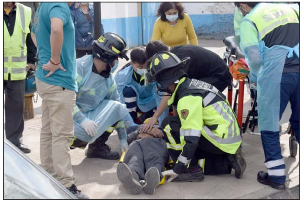
CON HERIDAS SERIAS.- Las cámaras de Diario El Trabajo registran el momento cuando el motociclista fue atendido de urgencia por rescatistas del SAMU y Bomberos de la Primera Compañía.