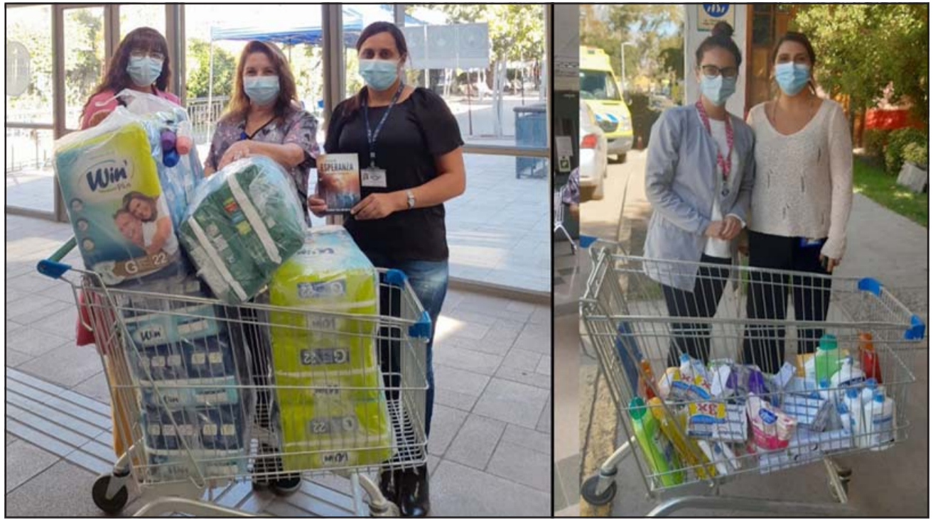
Organizaciones como Clown Sonrisas Aconcagua, voluntariados Damas de Rojo, Pastoral Cáritas Chile, Damas de Rosado, Damas de Blanco, personas naturales y la Agrupación de Amigos del Hospital, han colaborado con la campaña.

La profesional indicó también que todas las donaciones son recepcionadas y organizadas por la Unidad