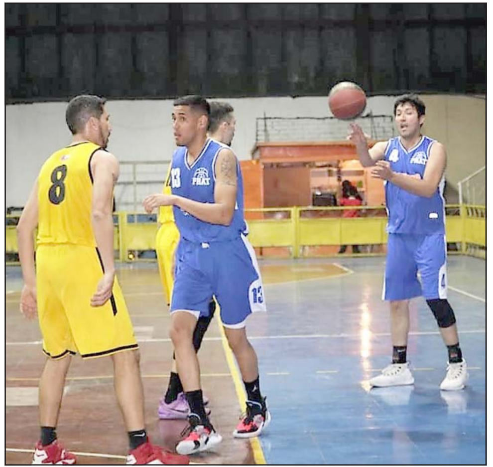
Aunque aún no hay fecha de inicio, está completamente a firme que el Prat competirá este año en la LNB.

Los clubes que competirán en la serie B de la LNB son: Sportiva Italiana, CD Manquehue, Liceo Curicó, Tinguiririca San Fernando, Árabe de Valparaíso, Truenos de Talca, Stadio Italiano y el Arturo Prat de San Felipe.