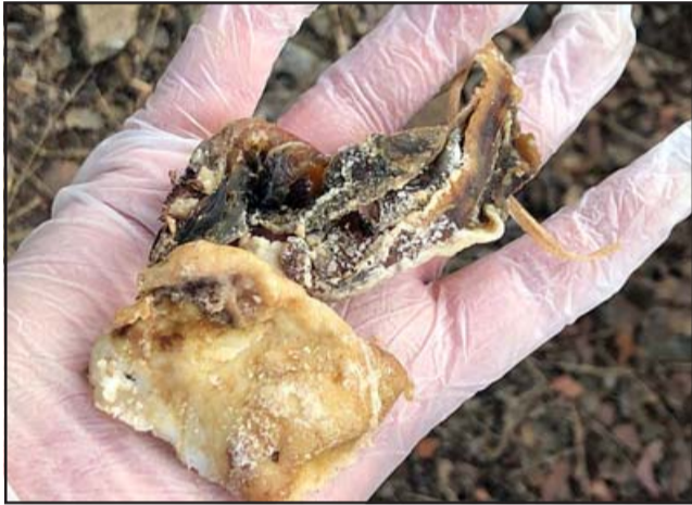
El municipio tomó muestras en el sector buscando indicios de intervención de seres humanos, encontrando restos de carne con una sustancia blanca.