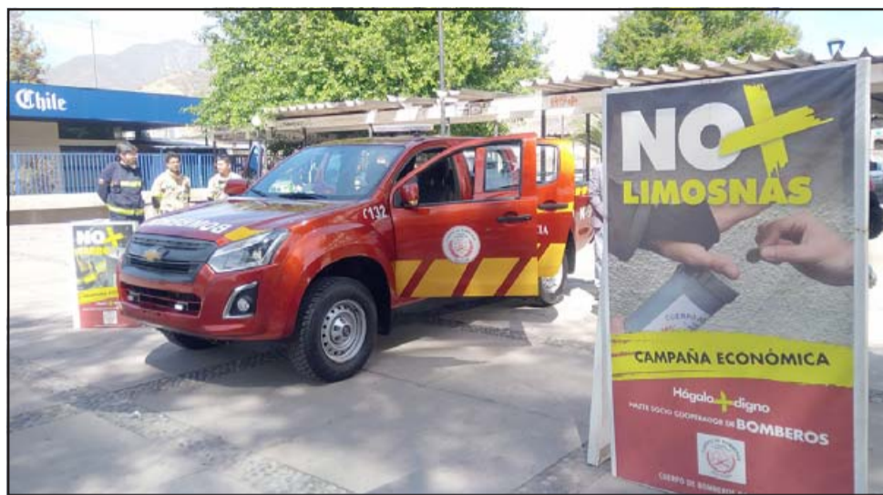
Acá la camioneta de la Comandancia de Bomberos de San Felipe comprada con dinero de los socios cooperadores.

- Nosotros por lo menos cuando partimos en el 2016, 2017, 2018 y 2019, siempre hemos hecho hacia la comunidad y hemos mostrado en que se gasta la plata. La gente debe recordar en su momento cuando compramos la camioneta de comandancia, compramos una ambulancia con esos dineros, se compró material para los bomberos; mangueras, se compraron equipos de trabajo. Se ha invertido en eso y generalmente se invierte y se muestra a la comunidad. En 2020 por temas de pandemia, ustedes saben que con esta campaña la idea era sacar a los Bomberos de la 'Campaña del tarro' de la calle y si bien no se logró 100 por ciento, logramos disminuir que estuviéramos