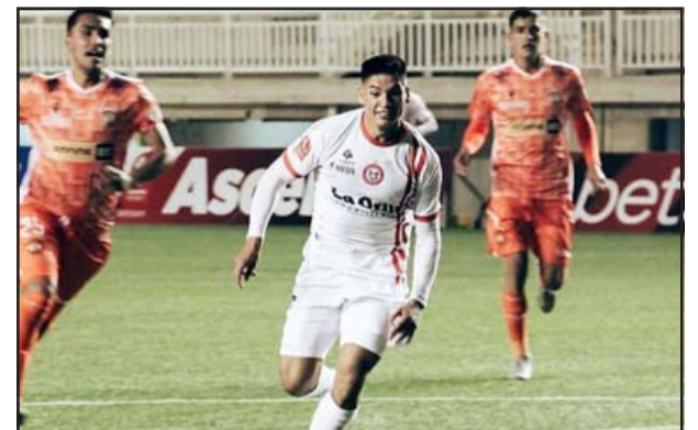
La escuadra sanfelipeña deberá trasladarse hasta la Octava región para medirse con la Universidad de Concepción.