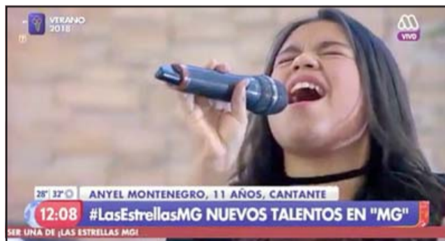
A NIVEL NACIONAL.- Aquí la vemos brillar con luz propia en el matinal de Chilevisión cuando apenas tenía 10 años de edad.