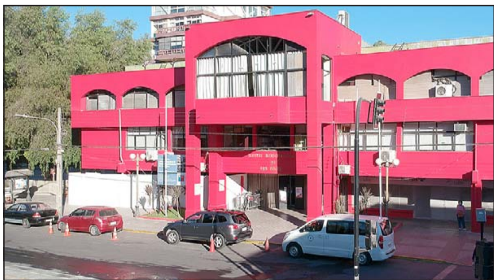
La auditoría no sólo será a las cuentas de la Municipalidad de San Felipe, también a la Dirección de Administración de la Educación Municipal (Daem), a la Dirección Municipal de Salud y al Cementerio Municipal.

En la etapa de consulta se encuentra la licitación para realizar el servicio de auditoría externa a los estados financieros, correspondiente al período diciembre 2012 – abril 2021, con recursos que asigna la Subsecretaría de Desarrollo Regional (Subdere) para estos fines.