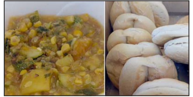
HECHOS CON AMOR. - Son almuerzos básicos, no viene filete ni manjares, pero son almuerzos que le salvan el día a cualquier familia.

¿Qué falta para que los supermercados 'todopodero-