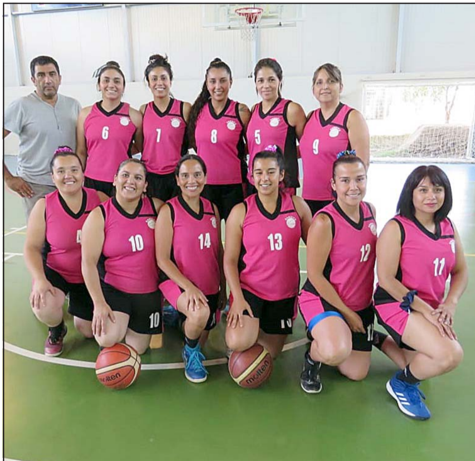
El club Frutexport esperará hasta cuando la pandemia esté controlada para competir en algún torneo local.