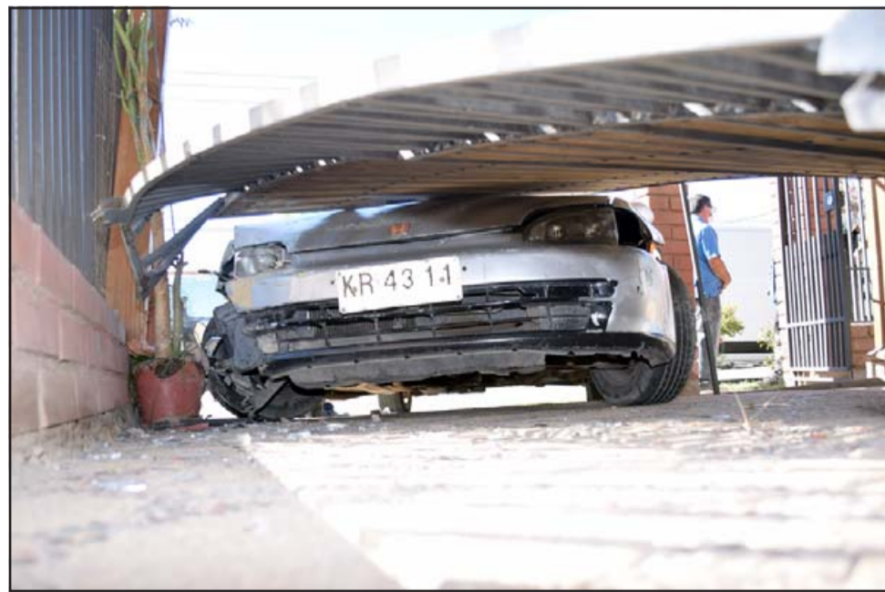
EL PORTONAZO. - Las cámaras de Diario El Trabajo registran cada ángulo de la escena, el portón fue arrancado en su totalidad.