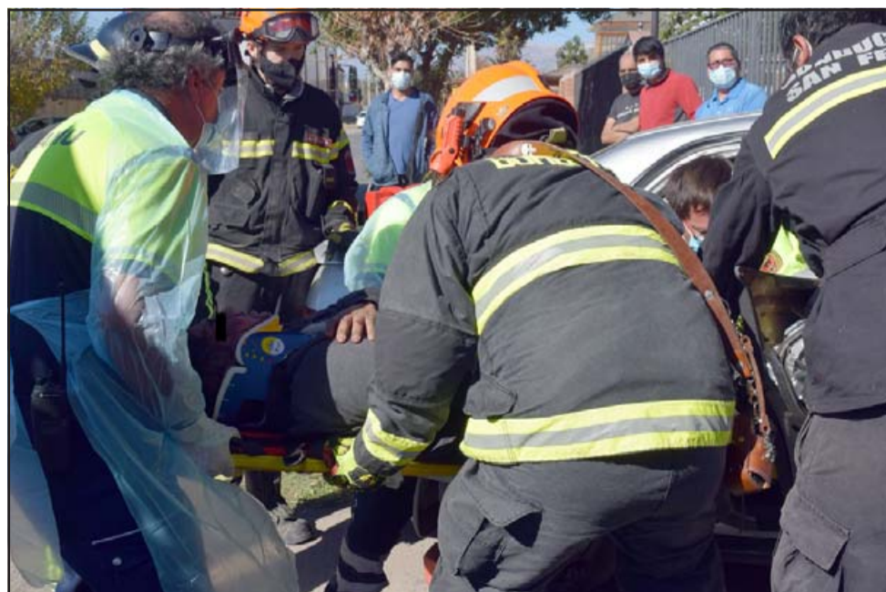
RESCATADO. - Rescatistas del SAMU y de Bomberos realizan el rescate tras varios minutos de remover latas del auto.