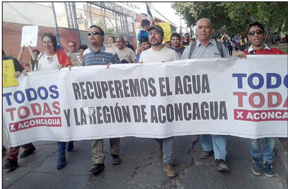
A PASO FIRME.- Aquí lo vemos en una de las tantas marchas desarrolladas en San Felipe durante el estallido social de 2018.

- Confiamos que este fin de semana daremos una grata sorpresa, más allá de que quienes están en el poder seguirán tratando de implementar lógicas retrógradas que la gente ya no quiere y más bien rechaza, esperamos que este fin de semana no veamos tantos furgones escolares llevando gente afín a algunas candidaturas, como ya nos han hecho saber desde la ciudadanía, sus hechos se exponen a que la denuncia formal por los eventuales delitos, en especial del cohecho y de las malas prácticas para tergiversar la voluntad popular.