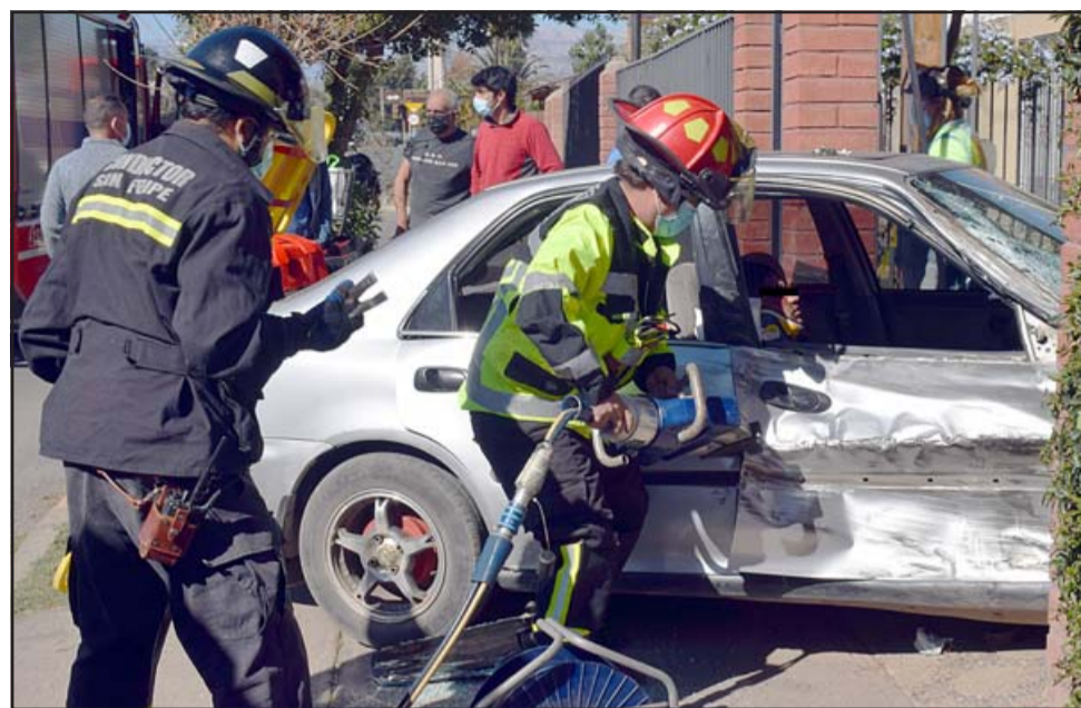
BOMBEROS EN ACCIÓN. - Las cámaras de Diario El Trabajo registran las maniobras de extricación del joven copiloto, quien quedó atrapado en este vehículo.

PUDO SER PEOR.- Así quedaron las latas del vehículo tras la colisión y la extricación que Bomberos hizo al paciente.