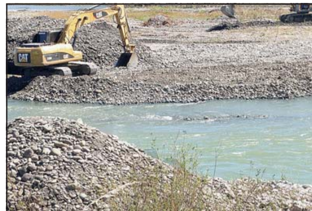
Las empresas que cumplen a cabalidad con las normas ambientales y los informes que solicita la DOH, no tienen problemas para obtener su patente. (Referencial)

- Un daño medioambiental obviamente, y que también lo que solicitamos es que la municipalidad cuente con un funcionario capacitado en lo que es la fiscalización de todas estas plantas de extracción de áridos. Lo importante es que aquellas que cumplen y aquellas que no generan un daño ambiental potente,