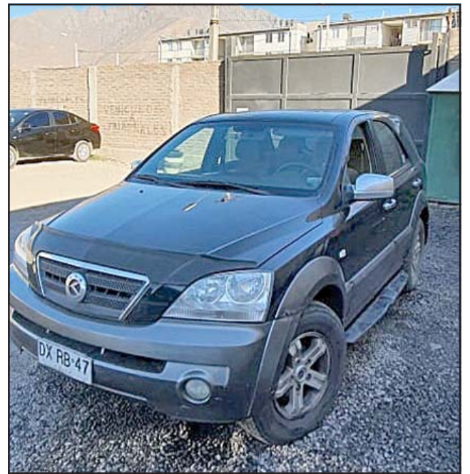
Este es el vehículo que estaba conduciendo el sujeto de 30 años y que tenía encargo por hurto.

Reiteró que el vehículo fue entregado a su dueño por orden del Fiscal de Turismo de San Felipe.