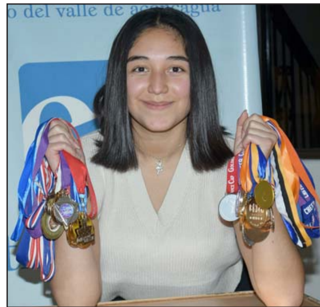
SUEÑA CON BROADWAY. - Aquí la vemos envuelta en magia, textura y color, en una de sus impresionantes presentaciones artísticas.