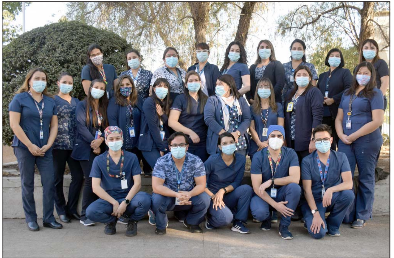
Enfermeras y enfermeros que trabajan en el Hospital San Camilo de San Felipe.

En la provincia existen dos universidades que imparten la carrera, una de carácter privado y una de carácter público: la Univer-