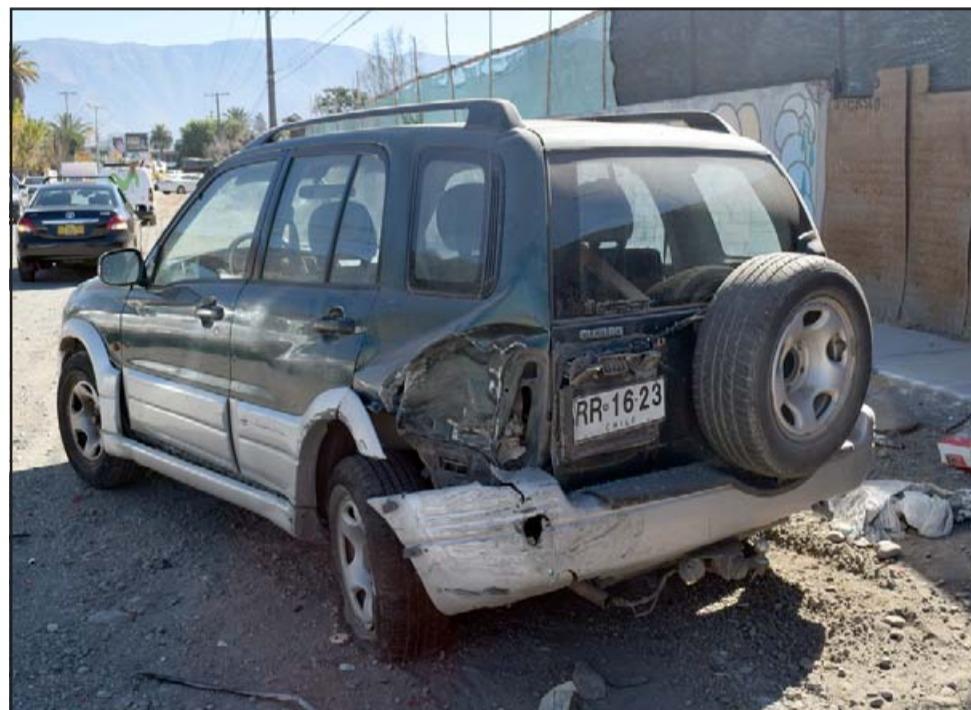
DAÑOS MATERIALES. - Este es el otro vehículo involucrado en el violento accidente en calle Michimalongo.