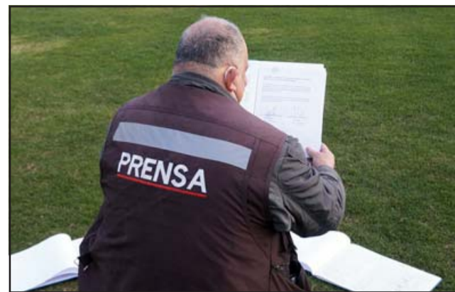
REVISANDO ACTAS.- Diario El Trabajo pudo revisar documentos y libros de actas del Club, pero no logramos que se nos permitiera hacer fotografías de los mismos.

- ¿Para qué son esas reglas que ustedes crearon con el tema del uso de la cancha?