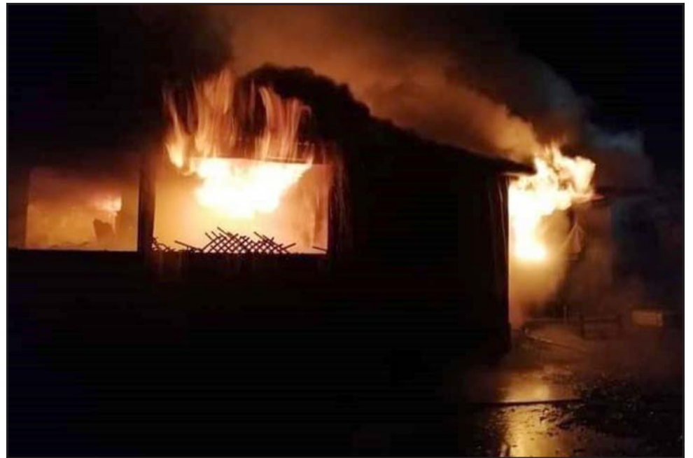
SIN PRESIÓN DE AGUA. - Un verdadero infierno es el que se desató la madrugada de este domingo en calle Latorre, en Santa María.