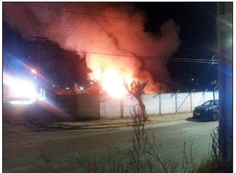
PÉRDIDAS TOTALES. - Este fue el escenario que los bomberos encontraron al llegar al lugar del siniestro.