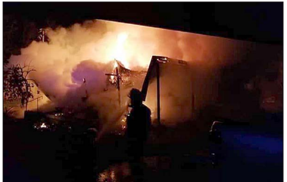
ARDUA JORNADA. - Hasta las 7 de la mañana las llamas fueron controladas por los bomberos.