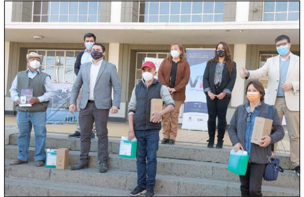
Este jueves se realizó la entrega de kits sanitarios a los servicios turísticos que hubiesen finalizado las capacitaciones avanzadas en el marco del Programa Turismo Seguro y Confiable.

En el mismo sentido, el Gobernador Provincial quien se hizo parte de esta actividad, destacó « la expectativa que se vienen ahora al inicio de una nueva temporada invernal, donde vamos a necesitar el apoyo de todas las organizaciones del turismo y este nuevo impulso