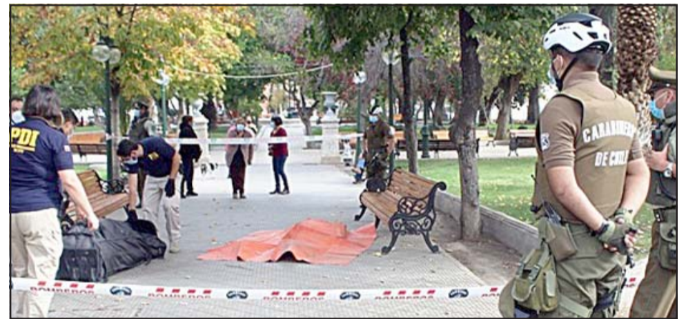
La Policía de Investigaciones (PDI) efectuaron los peritajes respectivos que confirmaron que el deceso había ocurrido a consecuencia de la insuficiencia cardíaca.

Del fallecimiento informaron al Fiscal de Turno que instruyó la concurrencia de detectives de la Brigada de Homicidios de la Policía de Investigaciones (PDI) de esta ciudad, que después se hicieron presentes y efectuaron los peritajes respectivos que confirmaron que el deceso había ocurrido a consecuencia de la insuficiencia cardíaca.