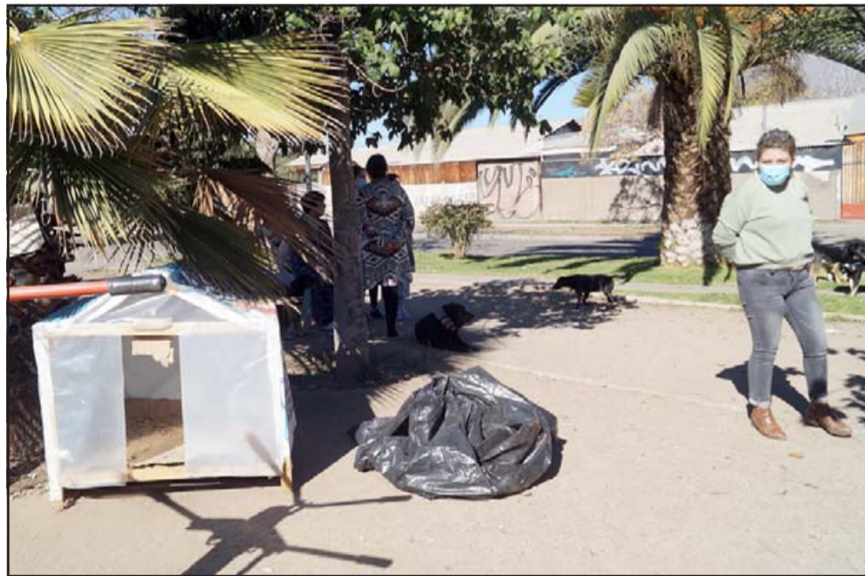
SIN JUEGOS EN PLAZOLETA.- Así luce la plazoleta de Pedro de Valdivia, los juegos infantiles debieron ser quitados, para que los perros callejeros reinen en el lugar.