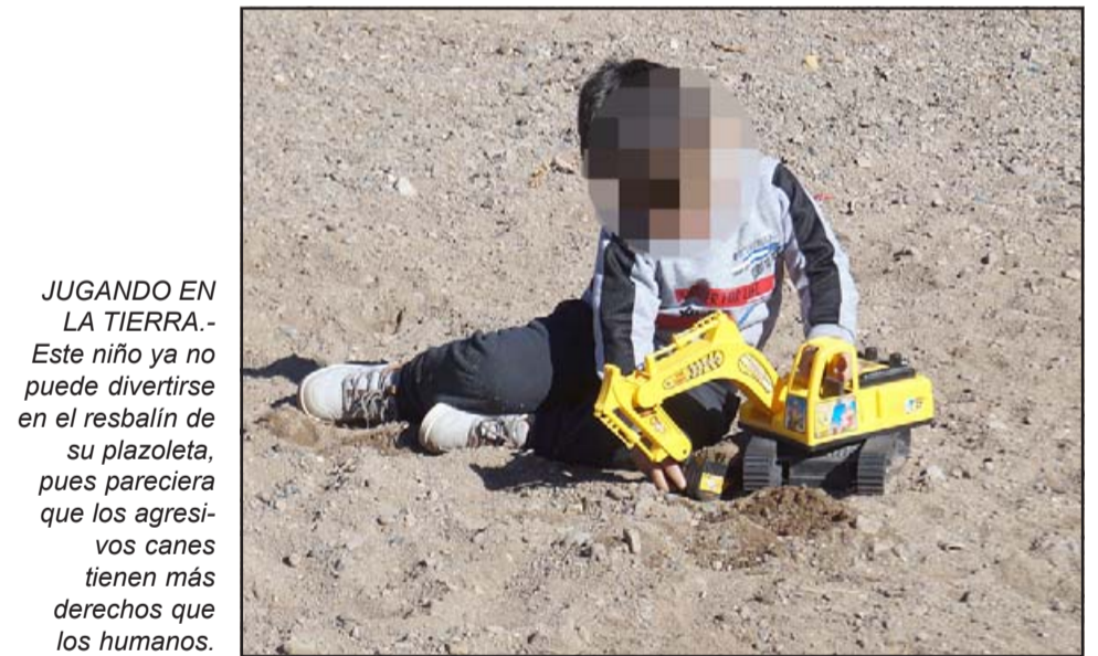
JUGANDO EN LA TIERRA.- Este niño ya no puede divertirse en el resbalín de su plazoleta, pues pareciera que los agresivos canes tienen más derechos que los humanos.