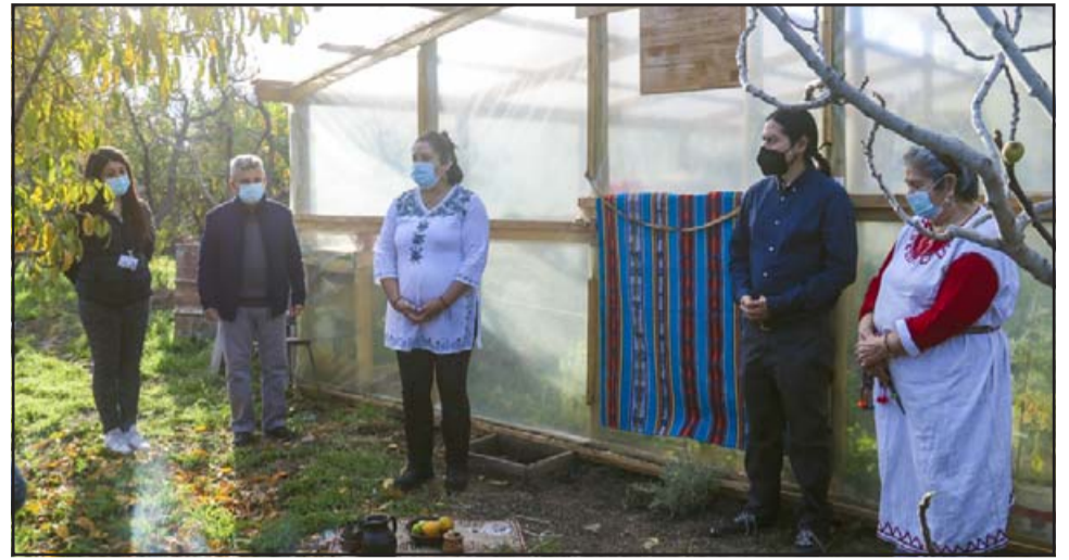
La iniciativa tuvo permanente asesoría de la municipalidad de Putaendo y fue financiada por el Fondo de Protección Ambiental del Ministerio de Medio Ambiente.