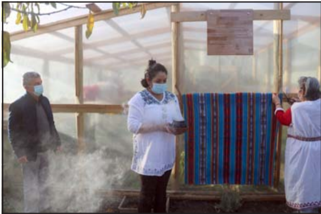
El objetivo es entregar hierbas medicinales a todos los vecinos de Putaendo que lo requieran.