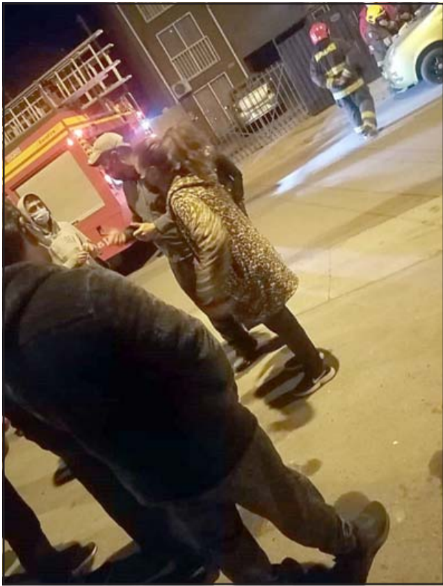
Los vecinos tuvieron que llamar a Bomberos este martes en la noche por la emergencia.

Molestia, preocupación y emergencia están provocando entre los vecinos del Condominio Peumayén, los gases que salen desde unos respiradores de descarga del servicentro Shell ubicado en la Avenida Encón, ubicado al costado del conjunto residencial. El martes en la noche tuvieron que llamar a Bomberos para que concurriera al lugar. Por eso piden a las autoridades buscar alguna solución. Aunque ellos dicen que el arreglo podría ser elevar los cañones.