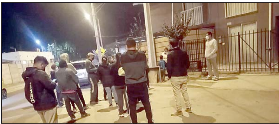
La emergencia de este martes en la noche provocó bastante inquietud entre los vecinos del sector.

El condominio Peumayén está ubicado en la Avenida Encón y está compuesto por 92 familias en su mayoría las que fueron estafadas por la Ex - Egis Daniela.