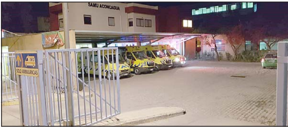
El problema se originó en la morgue Covid del Hospital San Camilo.

«Esta Dirección acompañará durante todo el proceso a las familias afectadas, brindándoles todo el apoyo que sea necesario en los diversos ámbitos, ya sea, legal, administrativo o psicológico», indica el comunicado.