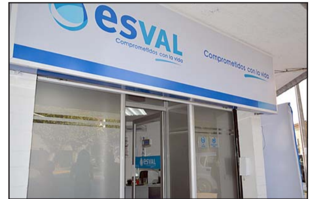
La sanitaria llamó a preferir los canales de atención remota para realizar diversos trámites debido al cierre de las oficinas en San Felipe y Los Andes.

Esva mantiene a disposición -las 24 horas del día- su línea telefónica 600 600 60 60 , el whatsapp +569 99000336 y el twitter @esval_chile , para brindar atención a sus clientes en las comunas mencionadas.