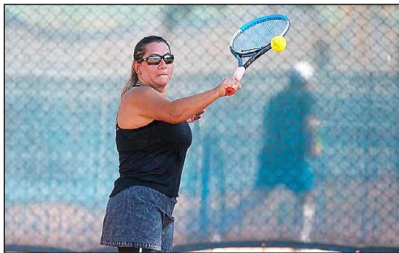
Las mujeres serán protagonistas de los próximos torneos Relámpagos del Club de Tenis Valle de Aconcagua.

cionar e inscribir a los participantes. « Todos quedaron contentos con el campeonato que hicimos, y es por eso que hemos decidido no parar, ya que queremos darles la oportunidad a todos, y es por eso que los que se vienen (eventos) integraremos a las mujeres y a los sénior que también quieren sentir la adrenalina de jugar de manera competitiva », comentó Julio Muñoz a El Trabajo Deportivo , destacando también la actitud de los jugadores al respetar el protocolo sanitario que se ha dispuesto para