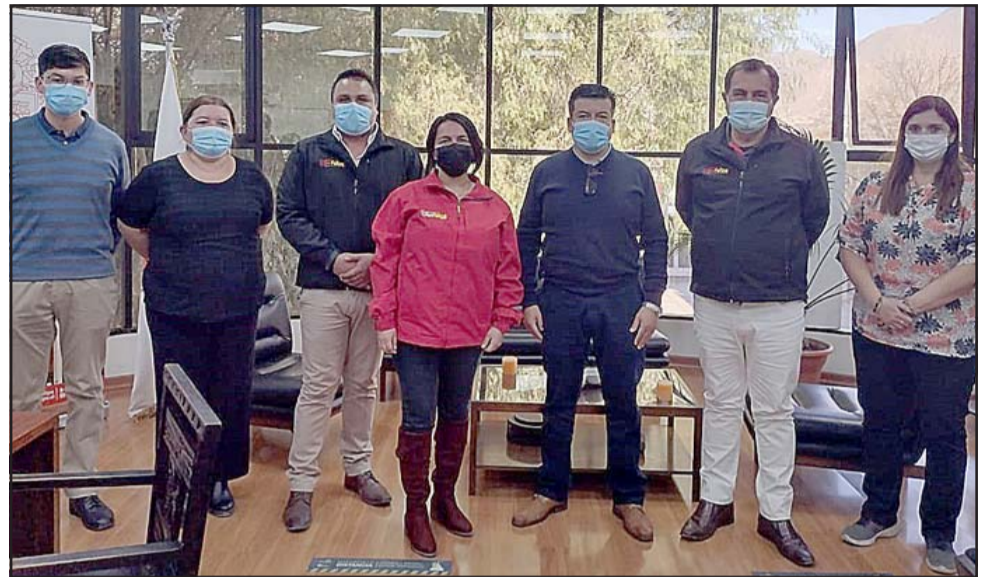
En la imagen los seis nuevos cargos de directivo, jefes de servicio y profesionales que fueron completados con el concurso público, todos ellos funcionarios de carrera que pudieron ascender de grado y/o pasar a ser funcionarios de planta.

ceso. «Antes que nada me siento muy orgulloso de poder determinar a través de un concurso, aquellos funcionarios que durante años esperaron el mejoramiento de sus carreras. Hemos destinado 6 cargos que estaban dentro de las posibilidades de planta, y aquí hay una transparencia absoluta y cualquiera lo puede ver, son los funcionarios mejores calificados y me enorgullece por aquellos funcionarios que esperaron durante 18 años una posibilidad de ascenso. Hoy se completan seis cargos de directivos, jefes de servicio y profesionales. Eso debería hacer el municipio, transparentar y hacer concursos como éstos, y que alguien sepa que al ingresar tenga las posibilidades cumpliendo con las funciones propias que se les encomienda», afirmó el edil sanfelipeño.