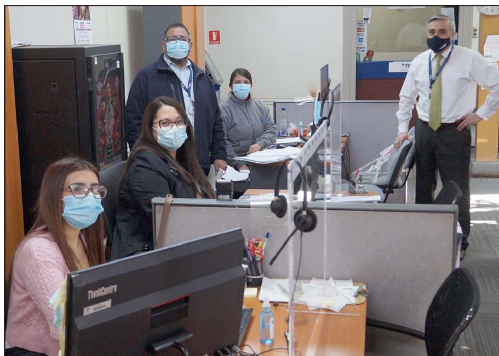
TESORERÍA SAN FELIPE.- Estos funcionarios de la Tesorería General de La República atienden tanto de manera presencial como online.

lidad de postergar el pago de contribuciones de este año para 2022?