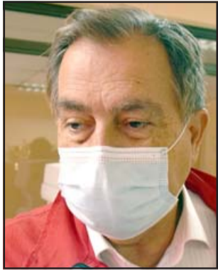
El alcalde Christian Beals se mostró muy conforme con lo realizado por la comisión evaluadora y destacó la transparencia de dicho proceso.

Un total de 90 profesionales de diversos puntos de la provincia y la región, fueron partícipes activos de este concurso público realizado por la corporación edilicia local, para cubrir cargos disponibles en la planta municipal destinada a directivo,