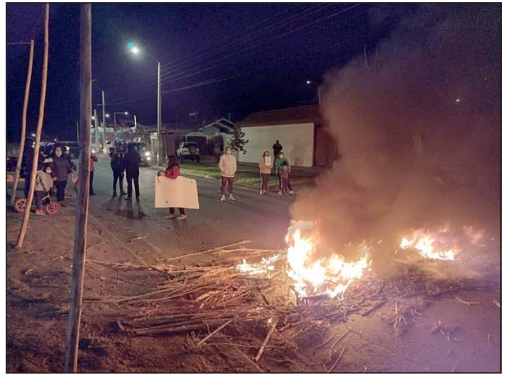
Los vecinos protestando el lunes en la noche, pidiendo lomos de toros.

- Ahora último lo que desató todo esto fue la muerte de unas mascotas de unas vecinas, que las altas velocidades a estos animalitos (gatos) les pasó la rueda y los reventó. Los niños quedaron súper impactados, desmayándose uno de ellos. Hace medio año creo, dos motociclistas justamente en la misma esquina donde nos tomamos, hubo un motociclista que lo chocaron también por las altas velocidades, y lo que fue como lo más impactante que igual hace más rato yo creo que unos 4 años atrás, que se volcó un vehículo a mitad de cuadra de Volcán Llaima, y si no es por el árbol afuera de la casa, el auto ingresa al interior de la casa, o sea eso