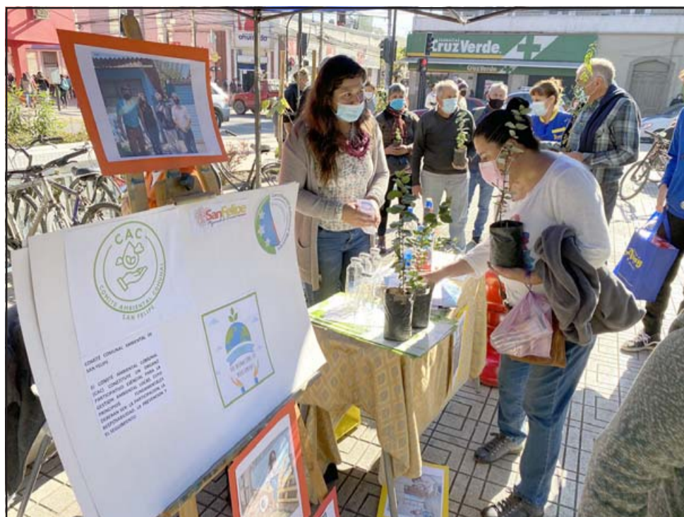
Por el paso a Fase 1 desde hoy jueves, la Dipma adelantó la celebración del Día del Medio Ambiente con un stand ecológico en la Plaza de Armas, entregando información, orientación y donando árboles nativos a los transeúntes.

na el próximo 5 de junio, y destacó el significado que se le otorga al medio ambiente a nivel mundial. «Entrar en cuarentena nos hizo adelantar esta actividad para que toda la comunidad reciba un mensaje sobre el cuidado del medio ambiente, sobre todo con lo que es reciclaje, los huertos comunitarios, la adopción y cuidado de un árbol y sobre todo con la eficiencia hídrica y energética, ofreciendo esta mañana un voluntariado para gente que se anote pueda ser parte de las próximas actividades a desarrollar, en materia de limpieza,