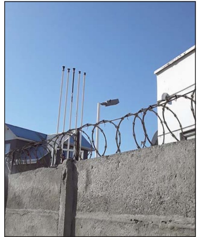
Estos son los respiradores de descarga que estarían provocando el problema por su escasa altura.

Comenta que llevan más de un año con este problema, donde han hablado con los jefes de la empresa de combustibles: «Los jefes de la bomba nos apoyan... están apoyando y todo, pero el problema son los jefes de arriba los que no vienen, vienen para acá y dicen que está todo bien, pero no han venido con una maquinita cuando tiran todos los ga-