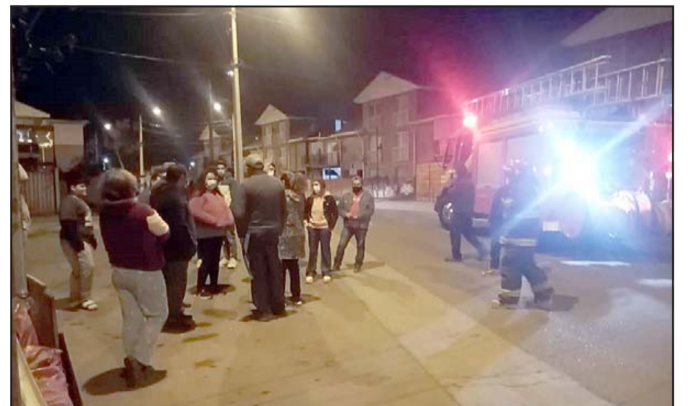
Un grupo de vecinos conversan con Bomberos sobre el problema que les afecta.