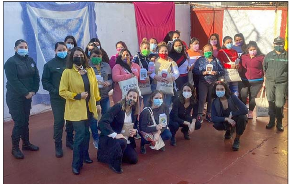
Las mujeres privadas de libertad en el Centro de Cumplimiento Penitenciario (CCP) de Los Andes recibieron kits con diversos artículos de aseo.