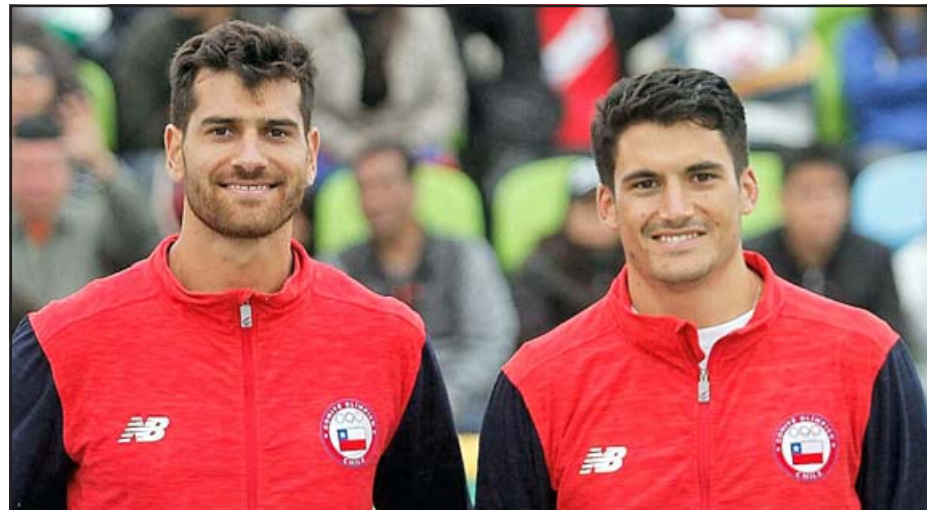
Premio al esfuerzo.- Los primos Grimalt estarán en los Juegos Olímpicos de Tokio.

Fue mediante las redes sociales en que los deportistas mostraron su alegría y satisfacción por este nuevo logro en sus carreras deportivas, señalando lo siguiente: «Ningún camino es corto y todo esfuerzo tiene su recompensa, el objetivo se cumplió, Nos vemos en Tokio 2021. Gracias por todo el apoyo que nos brindaron en este camino, a nuestro entrenador por el gran trabajo que ha venido haciendo con nosotros, también a nuestro preparador físico, y como no, al Ministerio del Deporte, Team Chile, Fevochi y el IND que hacen esto posible, y las marcas que confiaron en nuestro proceso».