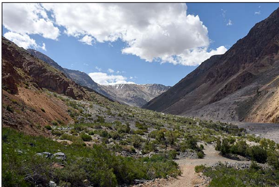
El evento se enmarca en la conmemoración del Día Mundial del Medioambiente y es organizada en conjunto por el Municipio y la empresa Simbiosis bioconsultora, que evalúa el proyecto.

AFORO LIMITADO Atendidas las limitaciones de aforo que impo-