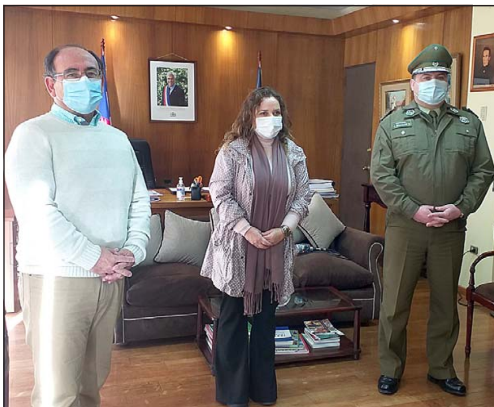
PASE DE MOVILIDAD. - En la jornada de trabajo este viernes participaron el gobernador de la provincia de San Felipe, Claudio Rodríguez Cataldo; junto a representantes locales del Ejército, Carabineros y Seremi de Salud.