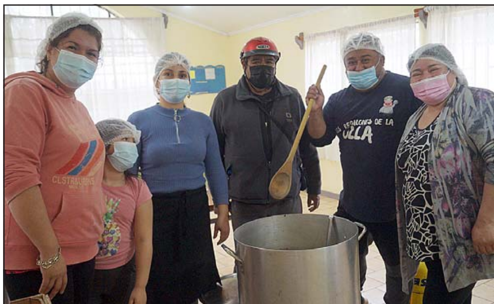
LOS REGALONES. - Ellos son parte del equipo Regalones de la Olla, quienes cada sábado preparan y reparten más de 150 almuerzos en la sede comunitaria de Santa Brígida.

coordinar entrega de productos para cocinar. Roberto González Short