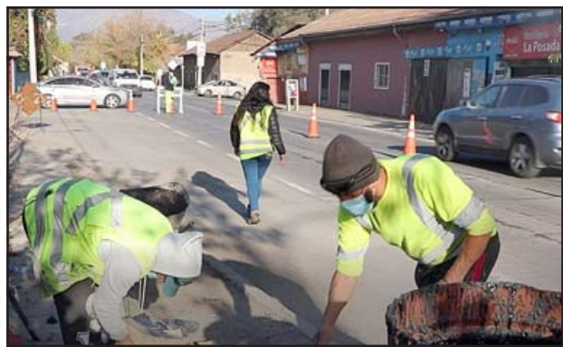
Las obras a ejecutar consistirán en bacheos y sello de grietas, colocación de capas asfálticas, construcción de bermas por sectores, saneamiento y seguridad vial.

Debido a la ejecución de los trabajos, camiones y maquinarias estarán en la ruta, por lo que en algunos tramos de la vía habrán angostamientos de la pista, por esta razón paleteros regularán el paso de vehículos.