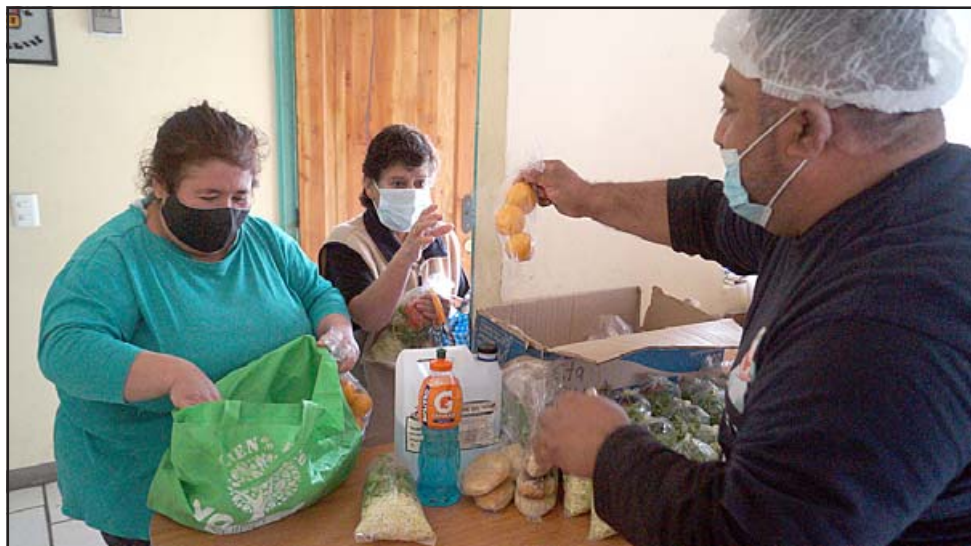
OLLA COMÚN. - Cada jefe de familia llega con sus recipientes para llevar almuerzo a todos en casa, el proyecto sigue siendo un alivio para muchos.