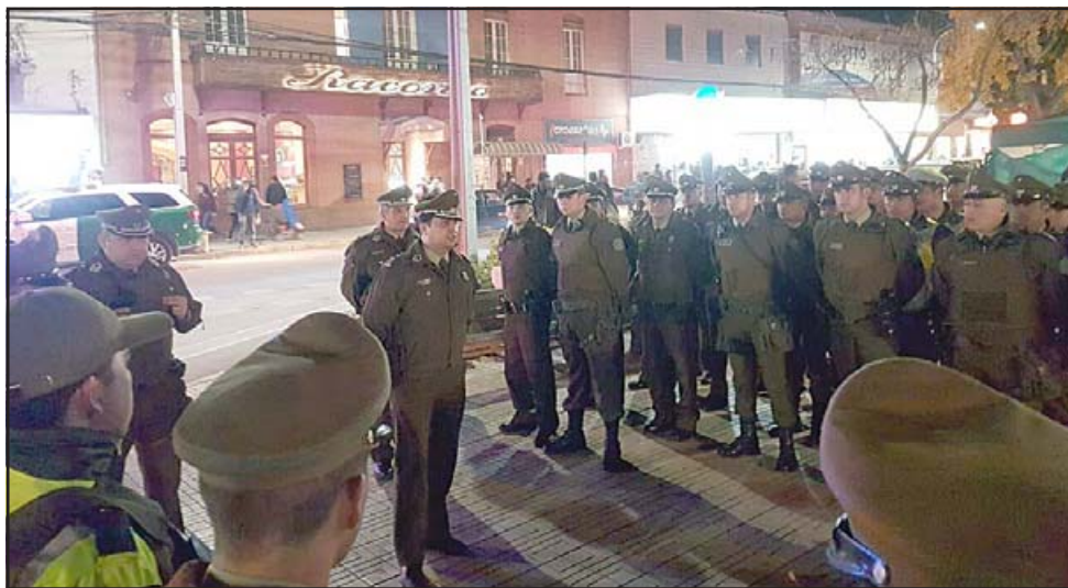
Acá el coronel imputado entregando instrucciones en una de las tantas rondas efectuadas por Carabineros.

res, indicar que el coronel Paul Oliva Yáñez quedó con Arraigo Nacional y Prohibición de comunicarse con los otros tres imputados por el plazo que dure la investigación, que fue establecido en octubre de 2020, cuando fueron imputados cargos a los subalternos. Actualmente el imputado es Prefecto de Carabineros en Talcahuano.