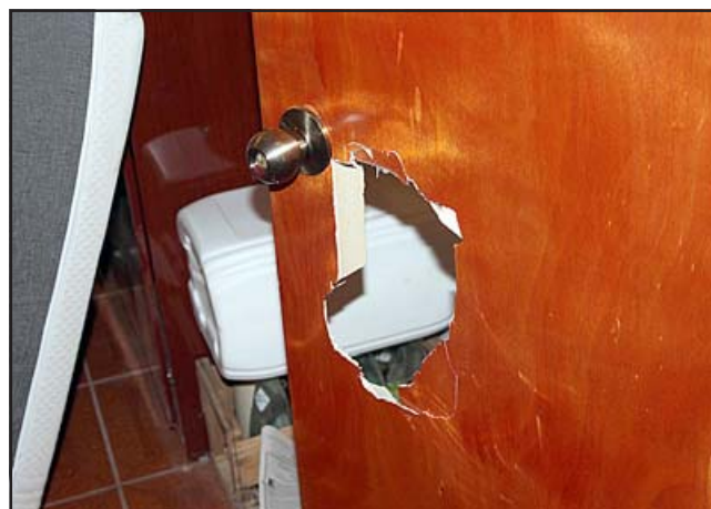
Acá se precia la puerta dañada luego que 'amigos de lo ajeno' la violentaran.