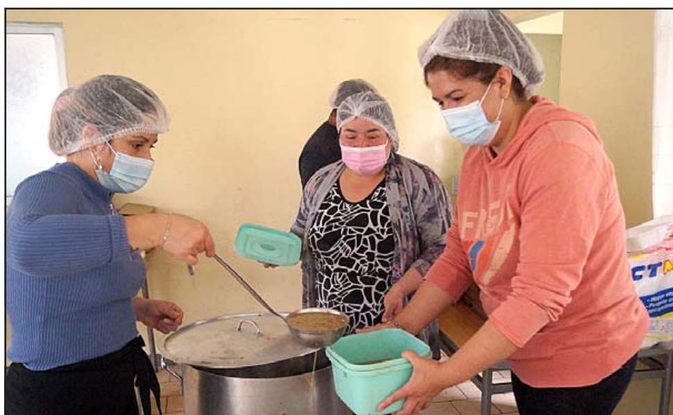
RICAS LENTEJAS. - Este sábado hubo lentejas con huevo duro, ensalada y pan fresco de la Panadería Popular, cada sábado el menú es diferente.