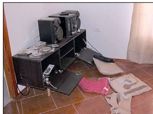
El desorden al interior de una de las habitaciones quedó registrado en esta gráfica.

sustraídas se encuentra una antigua e invaluable colección de relojes y lámparas, mismas que se programaban para su encendido y apagado, lo que fue denunciado a Carabineros que adoptó el procedimiento de rigor, donde se esperaba que en las próximas horas el servicio técnico pueda revisar con detalle las cámaras de seguridad para intentar ver alguna pista antes que las mismas cámaras fueran desviadas de los puntos de grabación por el o los delincuentes.