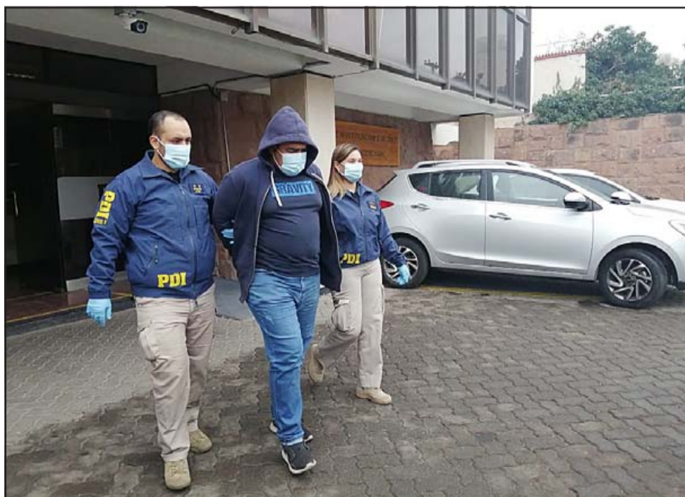
El imputado fue capturado por personal de la Policía de Investigaciones a raíz de una denuncia por abuso sexual a mayor de 14 años.

ñoz , jefa Brisex Los Andes, quien destacó que « este hombre el año 2020 fue denunciado por el abuso sexual de una mayor de edad en la locomoción colectiva de la ciudad. Esta persona, un hombre que estaba como NN, fue identificado posteriormente gracias a la investigación realizada por la Policía de Investigaciones, con el empadronamiento y testigos presenciales del hecho. Esta persona fue detenida en su domicilio particular y será puesta a disposición de Gendarmería ».