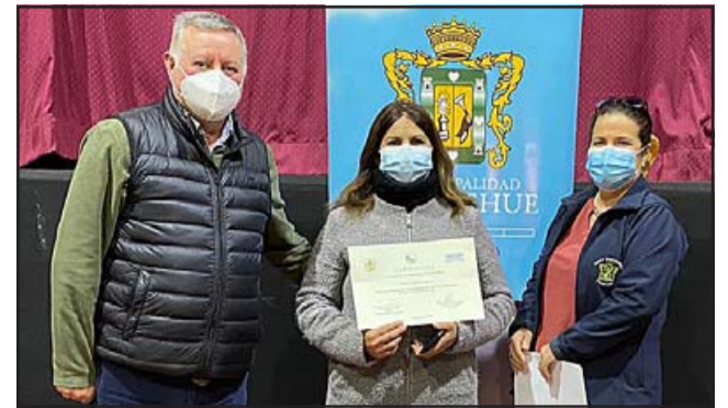
En total fueron 13 los usuarios del Prodesal de Panquehue los favorecidos en el tercer concurso IFP 2021 del Indap.

El programa Prodesal a la fecha cuenta con un total de 67 usuarios en la comuna de Panquehue, que en sus distintos rubros tales como flores, hortalizas, follaje, crianza de bovinos, ovinos, han logrado desarrollarse recibiendo las técnicas necesarias para mejorar sus em-