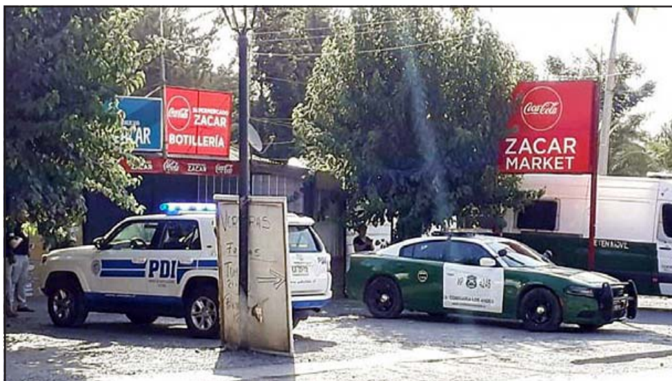
El frontis del supermercado Zacar, en Los Andes, donde ocurrieron los hechos