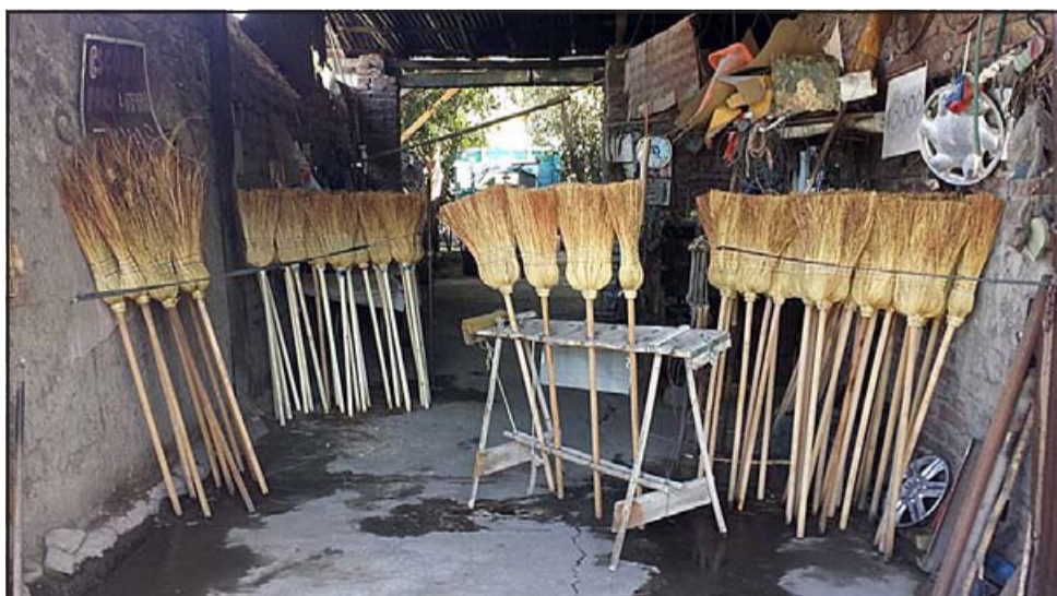
LISTAS PARA VENDER.- Muchas escobas dejó listas para la venta este artesano escobero en su casa en Avenida José Manso de Velasco 41.