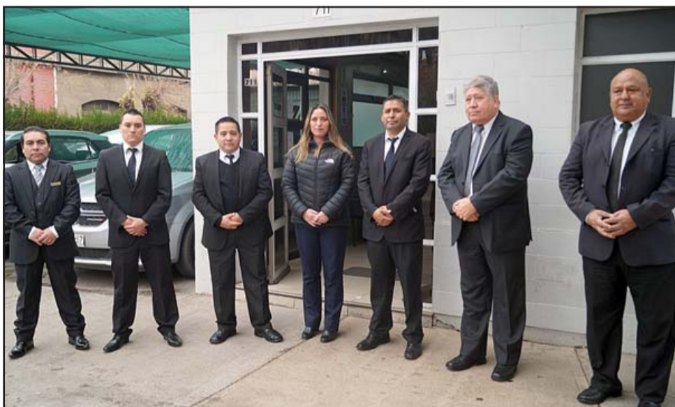
SUS APRENDICES.- Estos son empleados de la citada funeraria, algunos de ellos trabajaron muchos años con doña Inés.