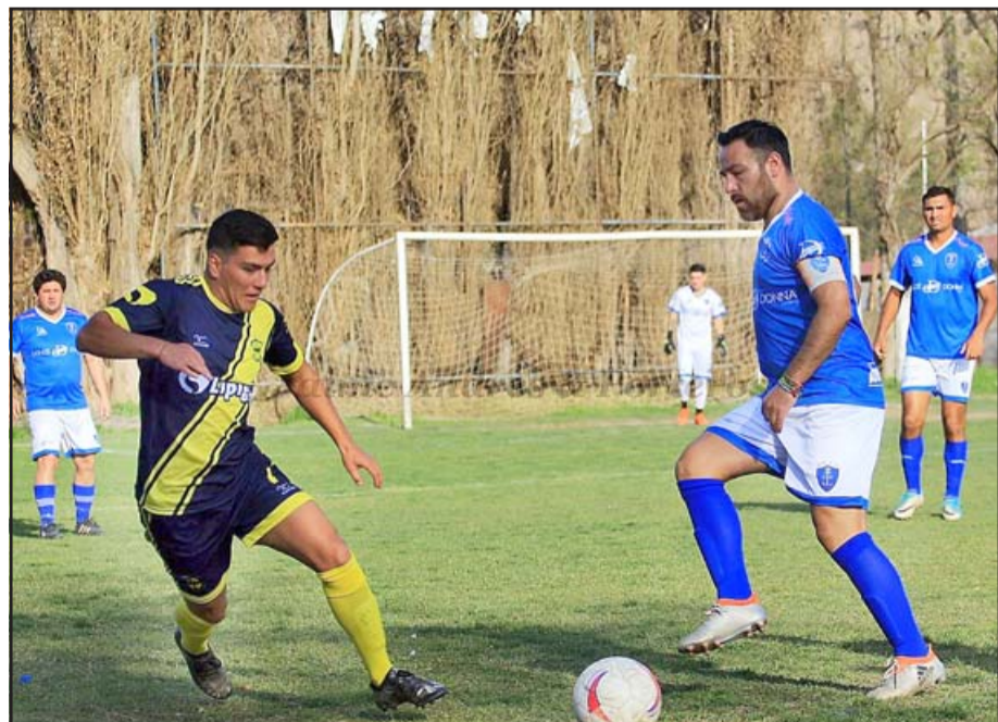
San Felipe no tendrá problemas para que vuelva el fútbol aficionado.

Una fuente altamente confiable dijo a El Trabajo Deportivo, que pese a todas las dificultades que ha causado la pandemia, los clubes están saneados y con muchas ganas de comenzar a jugar.