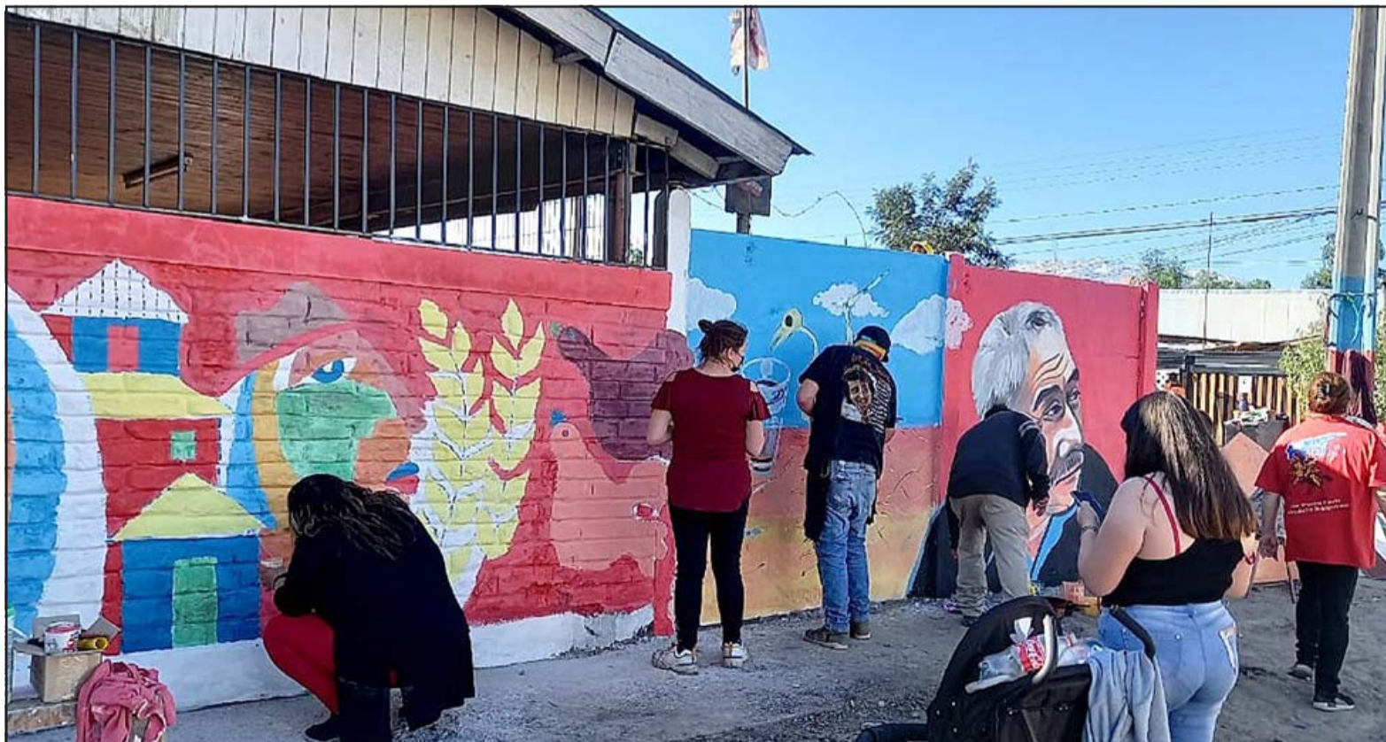
TODOS UNIDOS. - Muchas personas continúan motivados, y con estos murales desean también solicitar al gobierno los terrenos fiscales para viviendas.

- Mira, nosotros estamos en este minuto proponiendo un proyecto de 300 viviendas, podemos crecer si tenemos que hacer un proyecto más grande no tenemos ningún problema, porque la cantidad de gente sin vivienda en San Felipe es alarmante. Nosotros no tenemos ningún problema si tenemos que crecer y si hay más paños ningún problema, nosotros hacemos un proyecto 500 casas, pero es un proyecto que no lo va a hacer el Serviu, es un proyecto que lo haremos nosotros los pobladores, de hecho tenemos la EGIS, tenemos la constructora, y de los