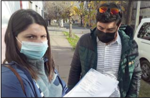
Nuevas víctimas de clonación de tarjetas.

Siguen apareciendo casos de retiros fraudulentos