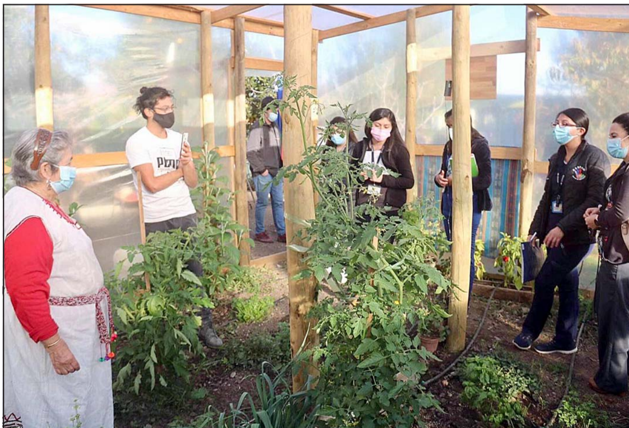
GRATIS PARA TODOS.- Vecinos siguen llegando diariamente a solicitar algunas plantas para usarlos medicinalmente.