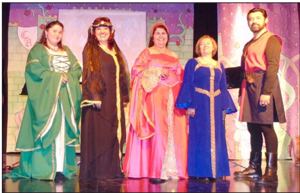
EN LAS GRANDES LIGAS.- Camerata Aconcagua estará también participando en esta jornada internacional de coros por la vía Internet.

Este fin de semana se llevará a cabo la edición virtual del mundialmente conocido Encuentro Internacional de Coros Federación Coral, que en esta ocasión cuenta con 60 coros de todas partes del mundo. Están representados países tan variados como Argentina, Perú, Uruguay, Bolivia, Paraguay, Colombia, España, Venezuela, Uganda, Brasil y Chile. Como ya es costumbre, de los locales estarán presente el Coro de Adultos Mayores y Camerata Aconcagua.