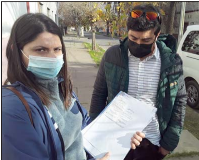
La afectada muestra el documento donde bloqueó su tarjeta en San Felipe.

- Que siga insistiendo, que siga insistiendo, siga (Pasa al frente)