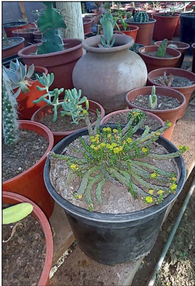
MIL VARIEDADES.- Este es un ejemplo de las plantas que regularmente se cultivan en este proyecto de la Asociación Indígena Paillacar de Putaendo.