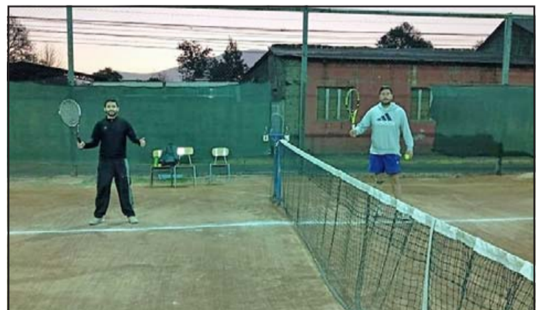
Entusiastas tenistas participan del torneo Aniversario de San Felipe.

Los organizadores del evento confirmaron a El Trabajo Deportivo que es muy probable que esta tarde o a más tardar mañana se llevará a cabo el sorteo para determinar las llaves en las series que restan por comenzar, que son: Primera, Segunda y Honor.