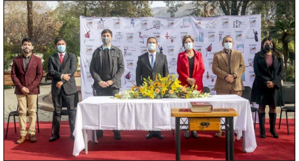
El alcalde y el Concejo Municipal de Putaendo rechazaron una vez más el inicio de trabajos de Minera Vizcachitas.

ramos públicamente en su oportunidad, la Municipalidad de Putaendo hará valer el derecho a oponernos a este proyecto, ejerciendo nuestro rol fiscalizador e interponiendo acciones legales con el objetivo de impedir la destrucción de nuestro patrimonio ambiental y cultural.