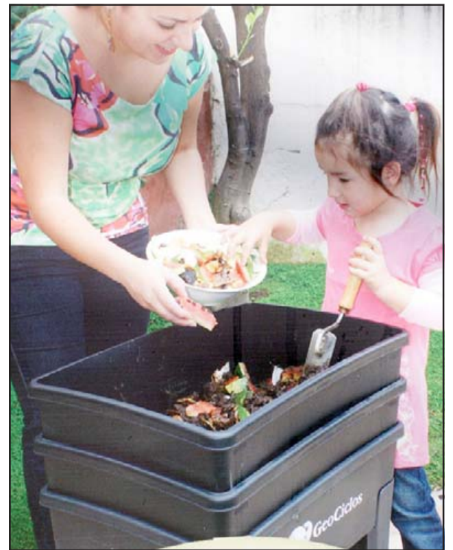
MARCAR LA DIFERENCIA.- Todas las familias pueden hacer el cambio que nuestro medioambiente necesita para recuperar el planeta. (Referencial)