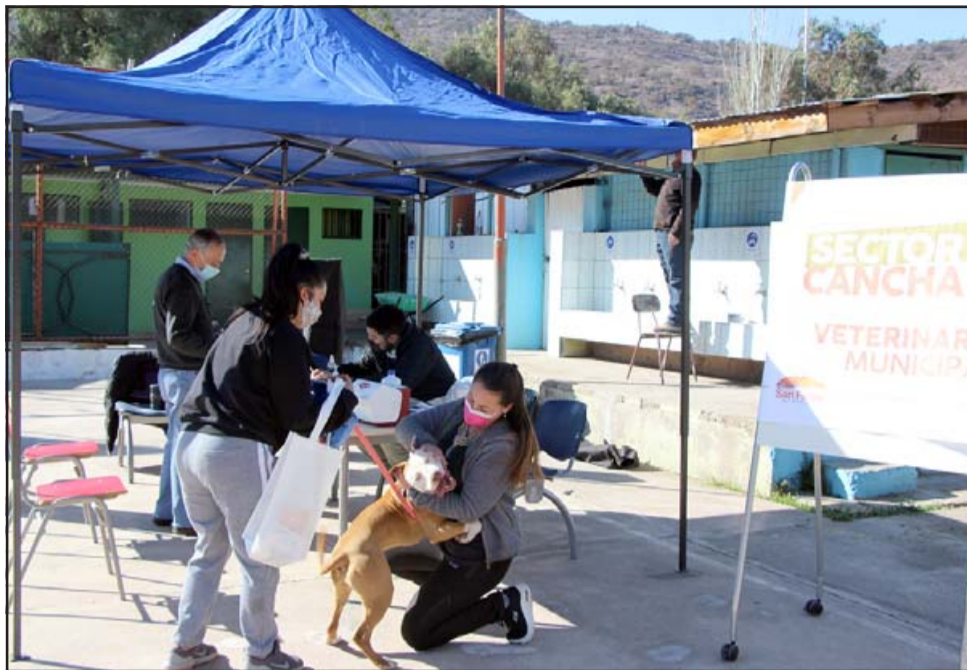
Diversos servicios que presta el municipio, como la veterinaria municipal, se hicieron presentes en Algarrobal.