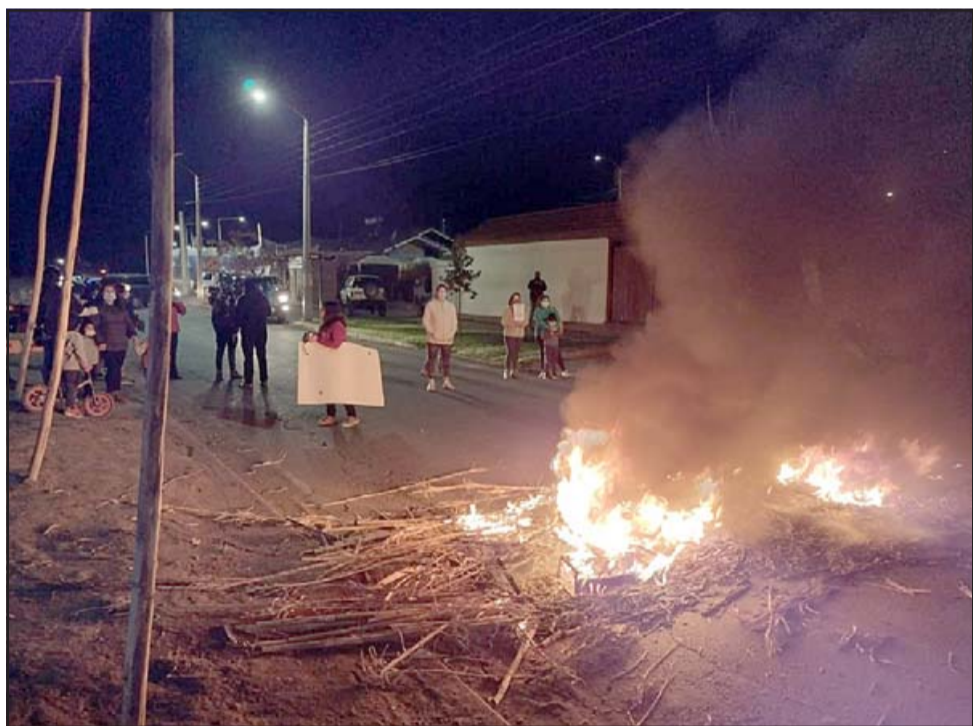
Vecinos el día de la protesta por allá en el mes de mayo de este año.

En general un lomo de toro tiene un costo aproximado de 1 millón de pesos.