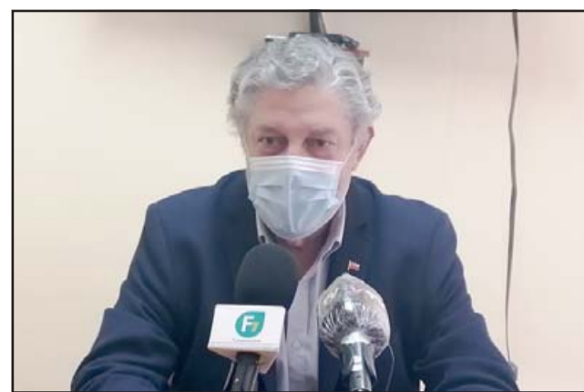
Boris Luksic, delegado presidencial provincial de San Felipe.

La comuna que lidera en proyectos adjudicados en la provincia es San Felipe con un total de 22 organizaciones por el monto total de $ 19.327.428, siguen Catemu y Santa María con 16 proyectos por cada comuna, y las cifras entregadas corresponden a $15.912.500 y $14.065.000 respectiva-