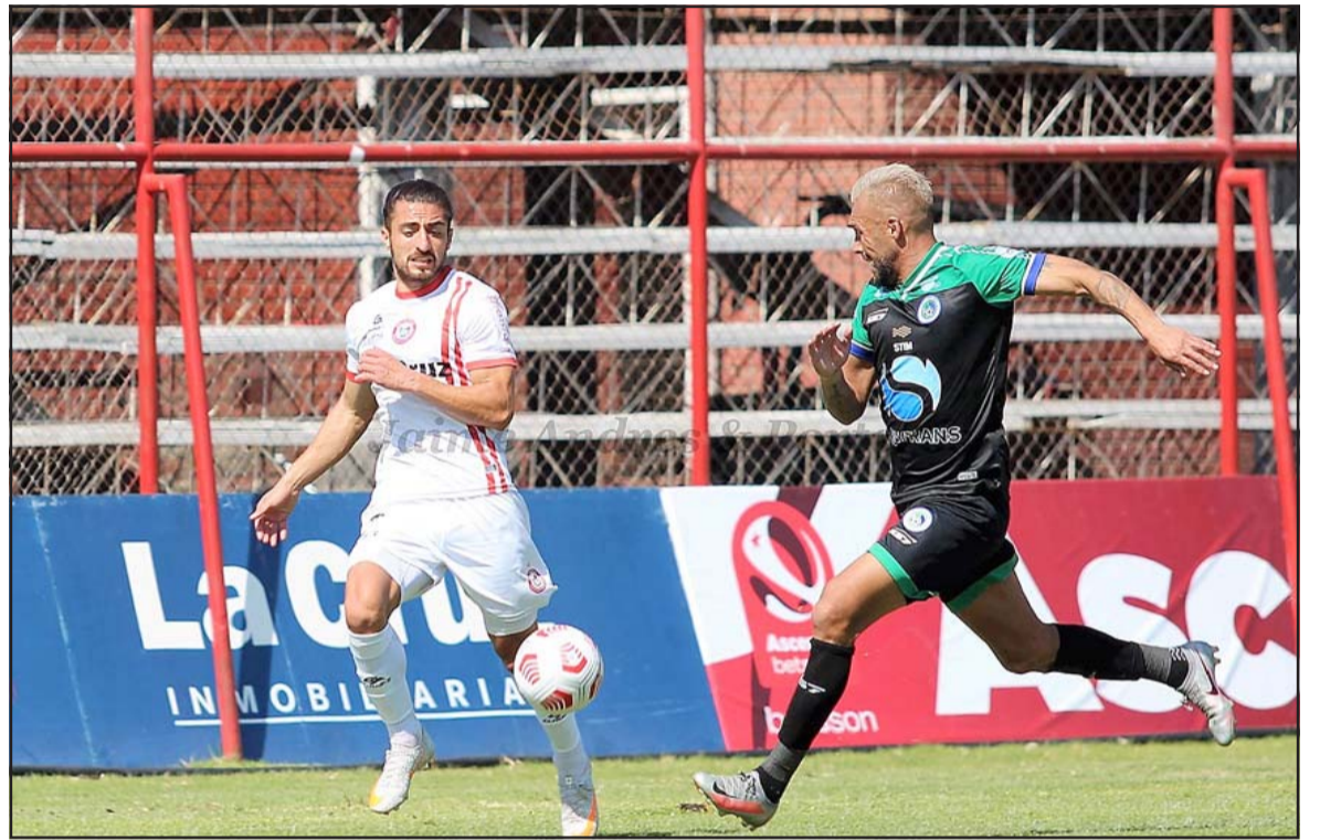
Frente a Santiago Morning los sanfelipeños deberán dejar por obligación los tres puntos en casa.