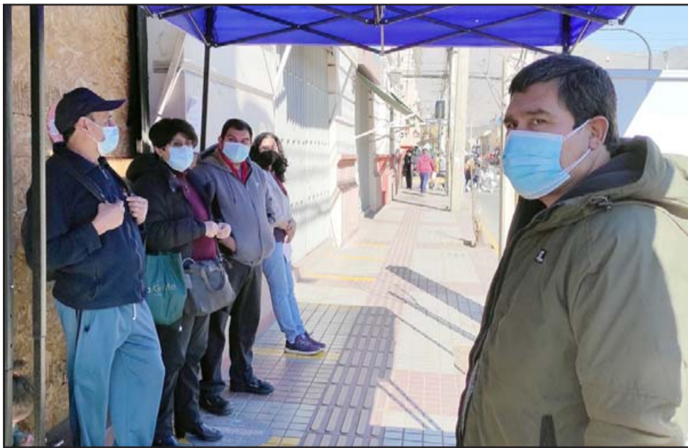
ESPERAN MEJORAS. - En Coopeuch nos aseguran que este fue un caso puntual, esperamos que las condiciones mejoren para sus clientes, su razón de ser.

Coopeuch es muy mala la atención, hay mucha gente reclamando, se ha ido gente, sobre todo de la tercera edad, ya casi desmayada con el calor (...) No están atendiendo como corresponde los ejecutivos, lo que pasa es que pasan a la caja, y de la caja pasan directo a realizar otros trámites, lo cual debería ser directo, deberían tener una caja preferen-