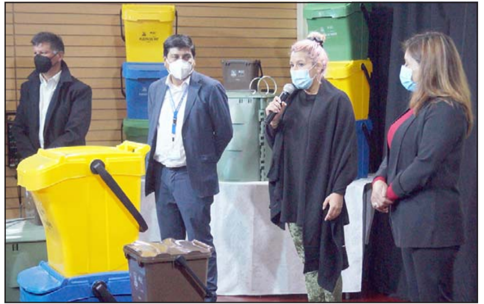
ENTREGA SIMBÓLICA.- Este martes sólo se entregaron tres composteras a estas familias, en los próximos días el resto recibirán las suyas.

Así también la primera autoridad comunal tuvo palabras para ampliarnos sobre este importante programa: «Estoy muy contento de hacer esta entrega de estos tres kits que son simbólicos respecto a la cantidad total que son 600 familias que van a ser beneficiadas, especialmente del sector urbano con las composteras de reciclaje, lo cual es muy importante para mí como alcalde, para este Municipio, pero principalmente para el medioam-