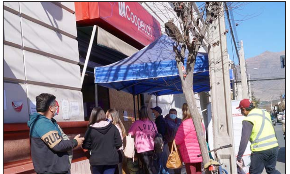
NO FUERON ATENDIDOS. - Cuando las cámaras de Diario El Trabajo registraron esta gráfica, aseguran los usuarios, ya había menos gente en la fila, pero algunos abuelitos prefirieron regresar a sus hogares.

cial para la tercera edad, hay gente que viene con coche, con niños, no saben ni dónde dejarlos para hacer sus trámites, pasan y pasan las horas y la fila no se mueve, no avanza. Lo que pedimos es que los ejecutivos tengan más conciencia, sobre todo con nuestra gente de la tercera edad y respeten la fila», comentó Reinoso a Diario El Trabajo .