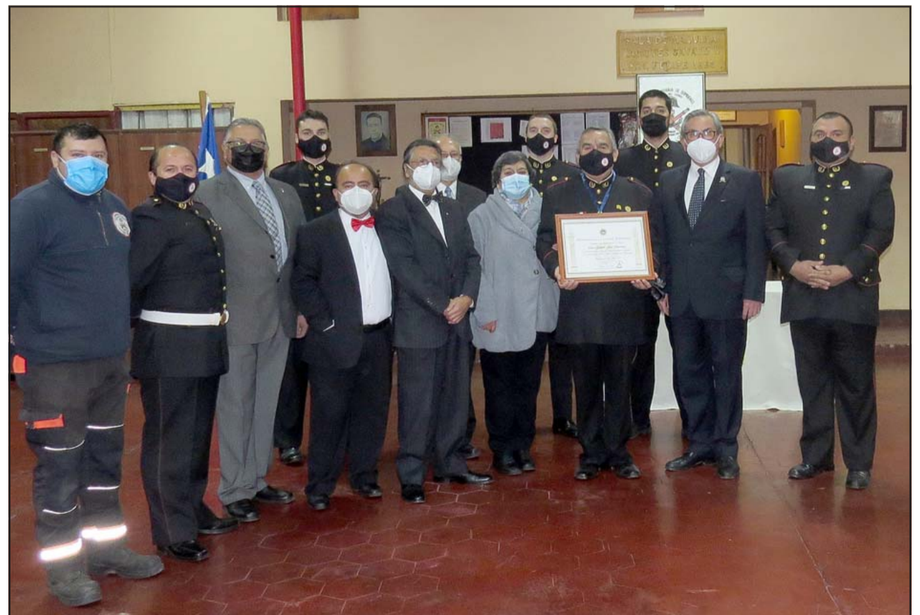
RECUPERANDO ESPACIOS.- Aprovechando que ya estamos en Fase 3, el aforo en esta ocasión fue mayor, pero siempre con la distancia requerida.