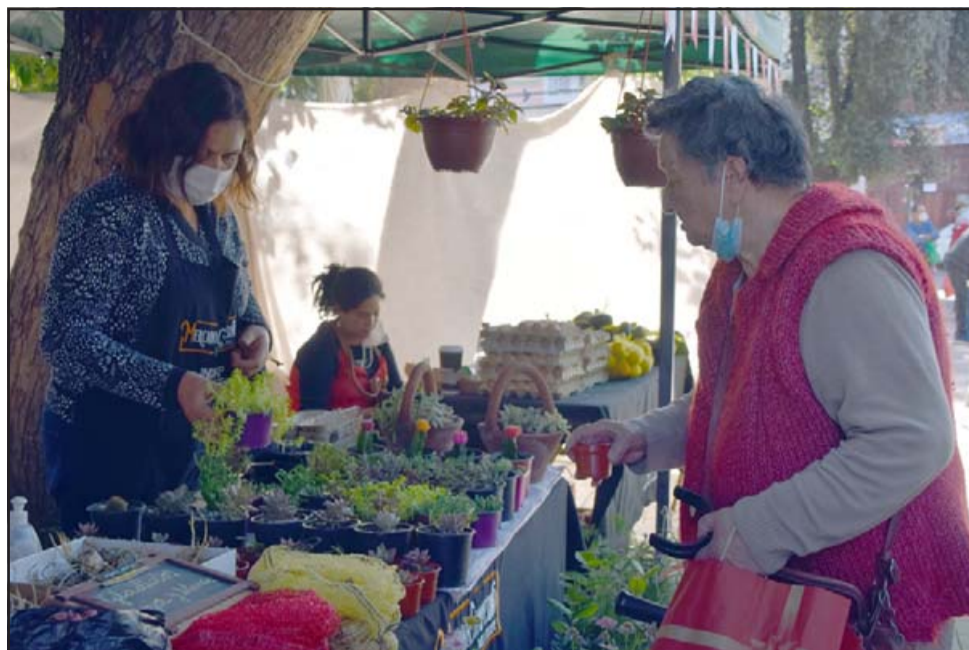
PLANTAS PARA EL HOGAR. - Los sanfelipeños tienen en esta propuesta la oportunidad de comprar productos de excelente calidad directamente de sus productores.