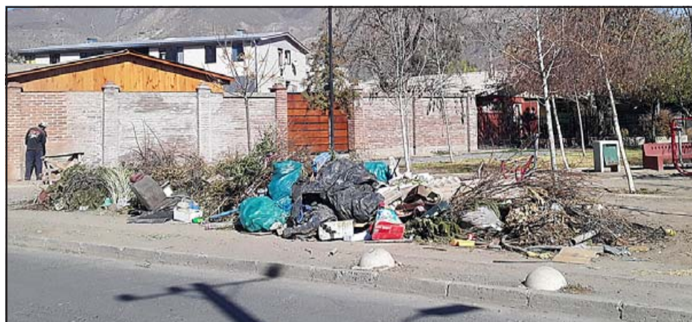
La basura en calle Justo Estay al llegar a Julio Figueroa.

- Pero qué sacamos, si no se saca nada, tener conciencia. Aquí no hay conciencia, se terminó, es penoso, si uno no es autoridad no les puede decir nada, les mandan los garabatos y ahí quedaste... son 'choros'.