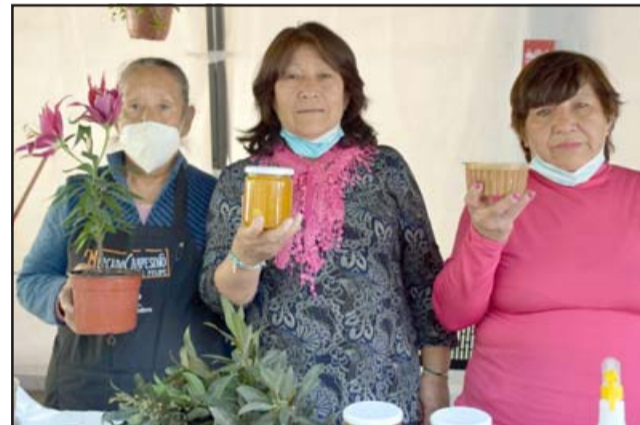
TODOS APORTAN. - Ellas tres son productoras campesinas, y cinco días al mes promocionan sus productos en este Mercado Campesino en nuestra Plaza de Armas.