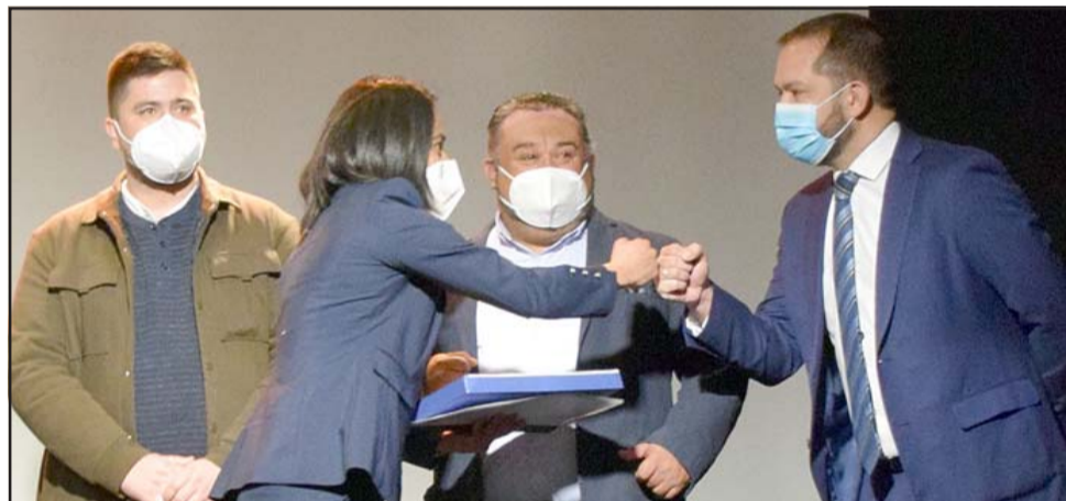
ACTITUD POSITIVA.- La árbitro internacional FIFA e Hija Ilustre saludó con energía a los concejales tras recibir la alta distinción.