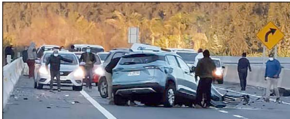
En la imagen se aprecia a los dos vehículos que chocaron de frente, y más atrás la camioneta del SML.

A consecuencia de este accidente el conductor de la camioneta del SML sufrió fractura en una de sus extremidades, específicamente en el fémur. De la mujer no se supo qué lesiones tuvo, pero sí voluntarios de Bomberos debieron trabajar ar-