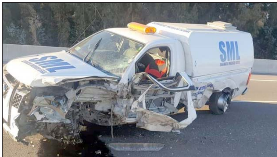
Así quedó la camioneta del SML, con daños en el costado izquierdo.