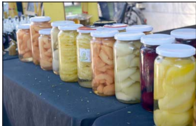
DELICIAS DEL CAMPO. - Las frutas en conserva y jaleas artesanales son parte del amplio surtido de productos del campo, elaborados por estos agricultores.