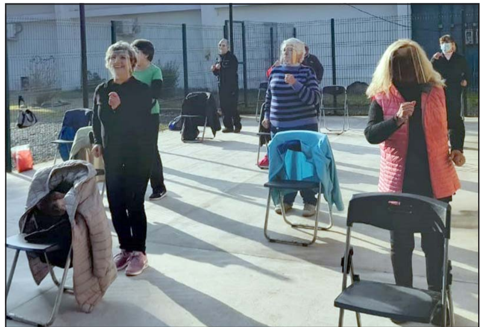
TRAS AÑO Y MEDIO.- Con limitado aforo pero con mucho entusiasmo, los adultos mayores van recuperando espacios para reactivarse de nuevo.