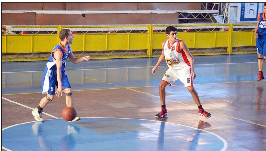
Los clubes aconcagüinos ya se preparan para iniciar su participación en los distintos torneos del básquet chileno.