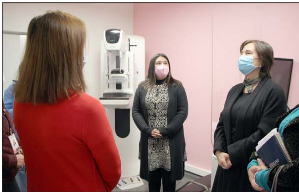
El mamógrafo del Cefsam Segismundo Iturra es el único de atención primaria que se encuentra operativo en la Región de Valparaíso.

Torres afirmó que actualmente están priorizando la atención de mujeres de 50 a 69 años, que resulta ser