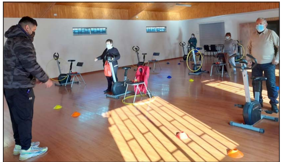
UN TALLER POR PERSONA.- También la gimnasia cardiovascular ya está activa en la Oficina del Adulto Mayor, pronto habrá más talleres funcionando.