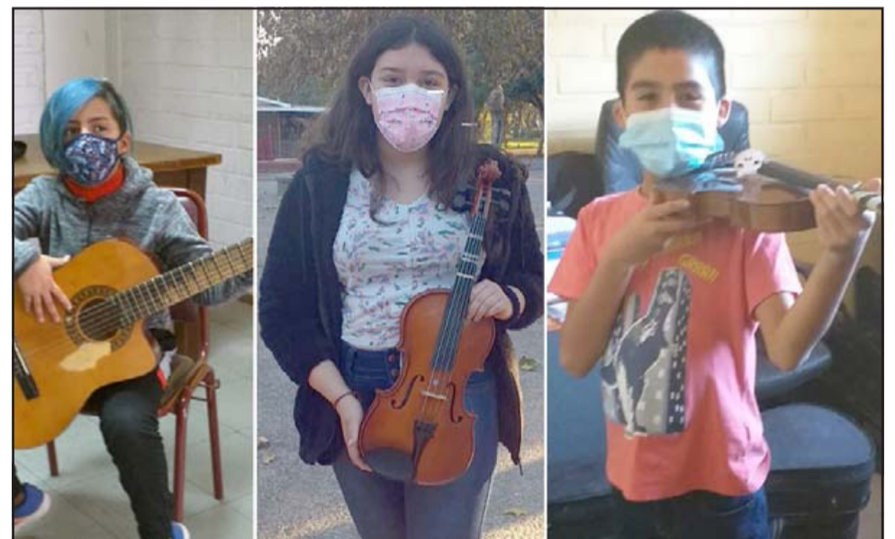
Durante la convocatoria del primer semestre, que se realizó entre abril a julio, hubo inscripciones en violín, viola, flauta y guitarra.

un programa que les permite aprender a tocar un instrumento como asimismo, si están las condiciones, seguir una carrera a nivel superior.