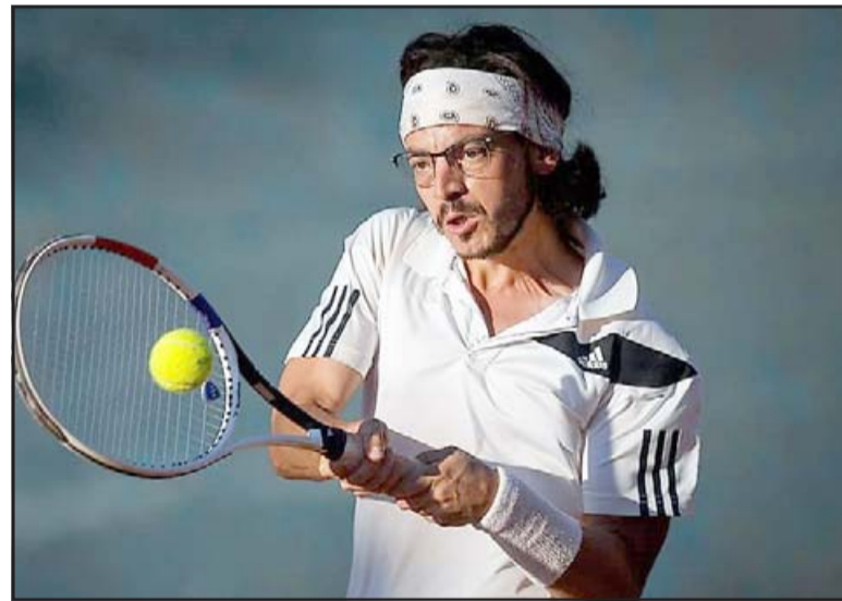
En Los Andes se levantará el telón del Tour Aconcagua 2021.