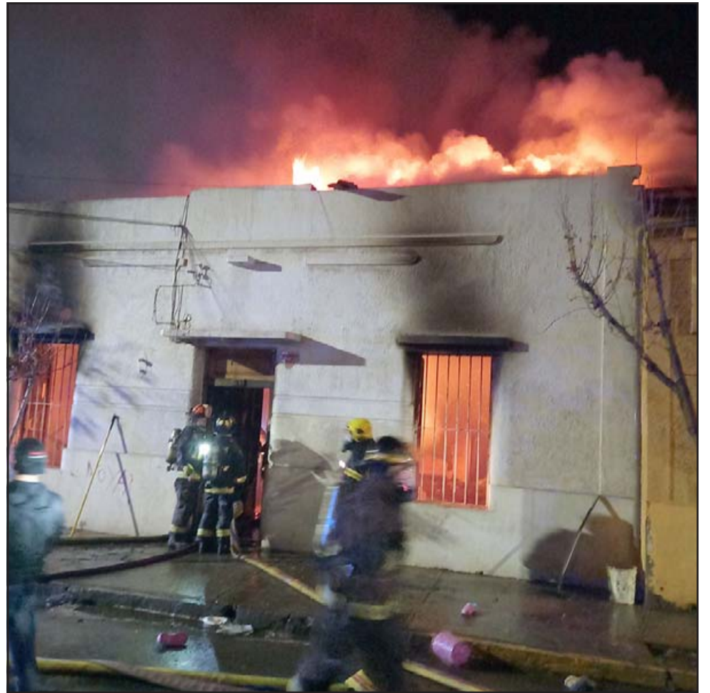
UN MISTERIO.- La mortal tragedia ocurrió la noche del 29 de julio en este hogar ubicado en calle Carlos Condell casi esquina Portus.

- ¿Cuáles son las causas basales de esta tragedia, cómo se declara