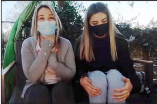
Valientes mujeres contaron su experiencia en RS

Salvaje ataque a plena luz del día, a eso de las 14 horas