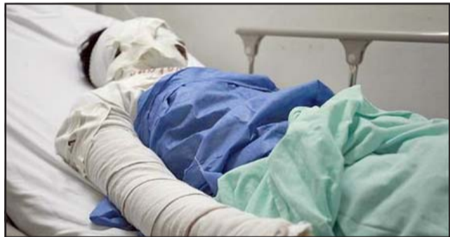
SIGUEN LUCHANDO.- Los dos pacientes un hombre y una mujer, siguen en estado de extrema gravedad en la Unidad de Cuidados Intensivos del Hospital San Camilo. (Referencial)