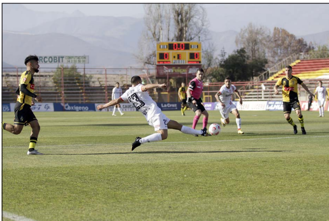
Los albirrojos buscarán como forasteros el primer triunfo bajo el mando del nuevo cuerpo técnico.