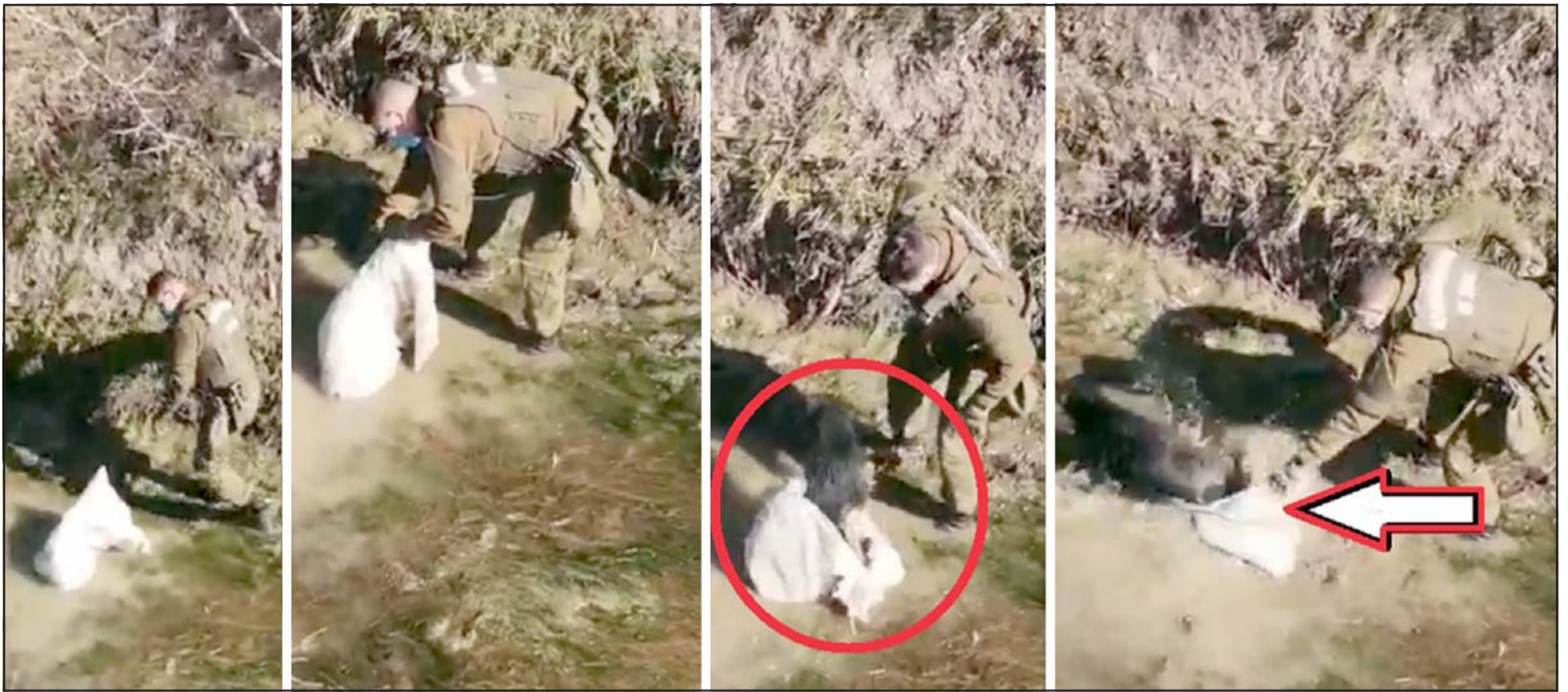
RESCATE ANIMAL EN LLAY LLAY.- Esta secuencia gráfica registra el accionar del carabiniero, quien libera finalmente al angustiado animal sentenciado a muerte.