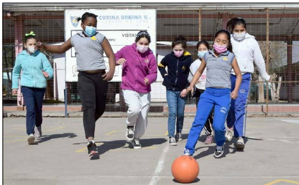
A LA CARGA CHIQUILLAS.- La magia y alegría de las niñas del Corina Urbina se sienten de nuevo en esta prestigiosa casa de estudios.

- Alrededor de 40 en cada especialidad, de hecho el viernes 27 de agosto vamos a tener la ceremonia de 35 niñas del año anterior que se van a titular de ambas especialidades; o sea, hemos seguido trabajando igual, esto no puede parar, las estudiantes saben que si bien es cierto van bajo una modalidad diferente, con mucho más cuidado, quizá con menos tiempo, pero también nosotros tenemos el Consejo Empresarial y hemos conversado con los encargados en el caso de