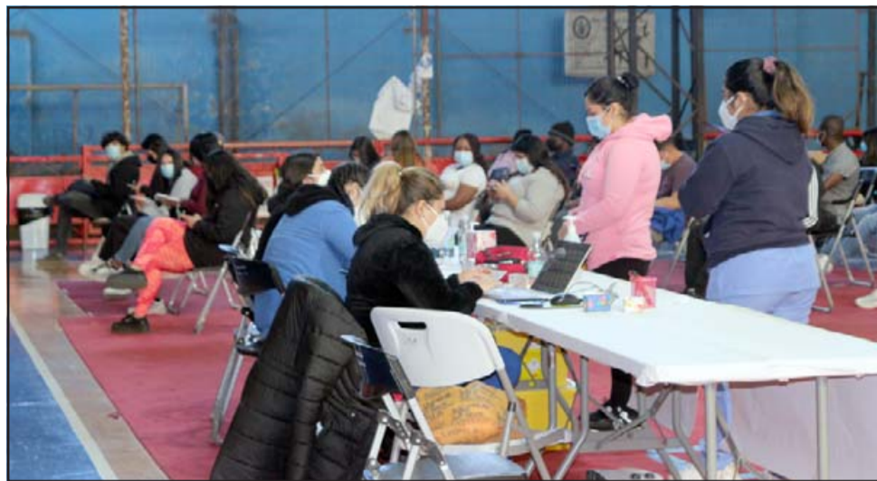
A partir de hoy comienza inoculación de la tercera dosis de refuerzo en el Fortín Prat, donde toda personas mayor de 45 años recibirá la polémica vacuna Astrazeneca.

«La dosis que se la va a administrar a todo hombre mayor de 45 años es Astrazeneca y 55 años mujer también Astrazeneca, si tiene patologías inmunocomprometidas como cáncer u otra similar, la dosis de refuerzo será Pfizer, pero esto debe