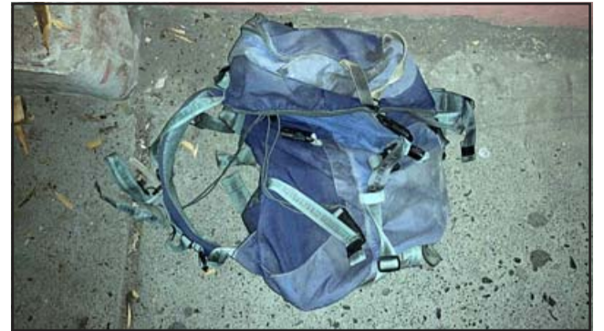
Esta especie de mochila fue encontrada en el lugar.

El sujeto fue identificado con las iniciales R.E.F.P., 31 años de edad, domiciliado en San Felipe.