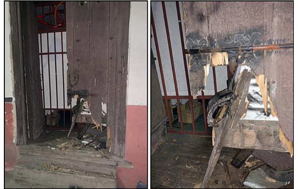
En la imagen se puede apreciar los daños a la puerta del taller de bicicletas.