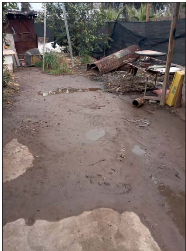
El patio de la vivienda quedó convertido en un lodazal por el agua que salió del canal.