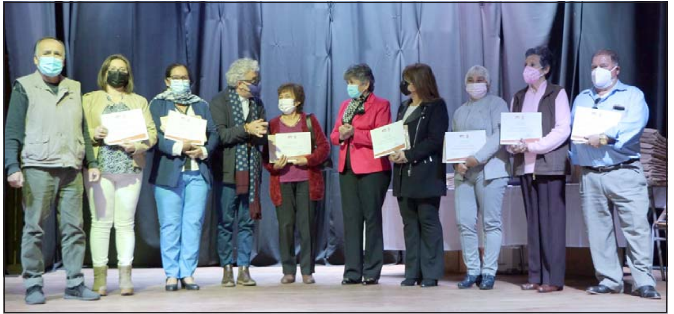
En total fueron 18 los egresados de la Escuela del Dirigente, no obstante se entregaron diplomas y obsequios a un total de 90 personas que participaron de la ceremonia de certificación este sábado.