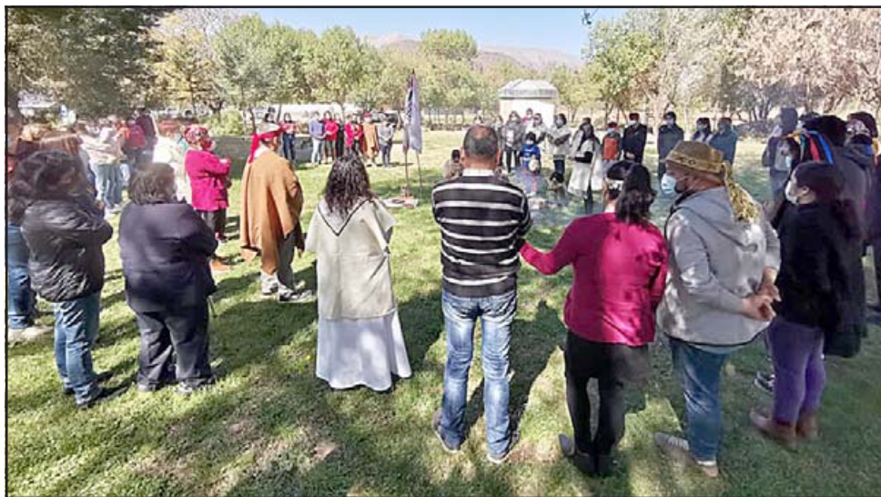
Durante la actividad se reconoció la labor de mujeres que con su trabajo y gestión apoyan la labor de los pueblos originarios.