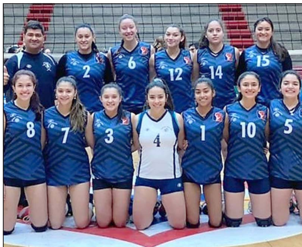
En otra gran actuación el juvenil equipo de Unión Volley llegó a la final de la Liga A – 2.

muy fuerte al tener varias seleccionadas en sus filas. Desde el inicio se nos complicó porque sacaron muy duro, además de tener variantes importantes en su juego. Se notó al final la experiencia, pero yo estoy muy contento por lo que están haciendo las niñas, porque están jugando contra equipos adultos y ellas aún son muy jóvenes, así que el haber podido jugar la final es todo un logro, y de esa forma lo vemos; ahora iremos a jugar todo al cuadrangular del próximo fin de semana para poder subir a la Liga A-1 », afirmó el director técnico.