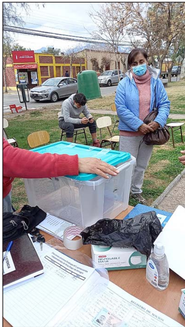
Una socia yendo a participar en el proceso eleccionario del Sindicato de Trabajadores Independientes.