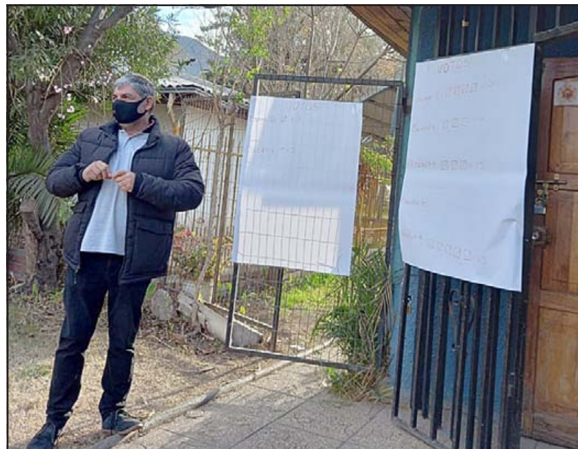
En pleno conteo de votos en el Sindicato de Trabajadores Independientes.

fuera porque me sacaron pa' fuera. Por eso se hicieron dos sindicatos, ellos lo que hicieron mal, ahora estamos en sindicato, tenemos también poder y no vamos a perder antigüedad, no vamos a perder nada porque vamos a estar con los verduleros y vamos a estar con todos, así es que estoy contento que se haya arreglado este problema», dijo.