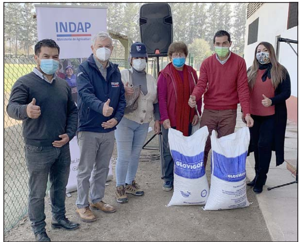
Cuatro toneladas de alimento para aves y dos toneladas para caprinos y bovinos recibieron un total de 17 pequeños productores de Panquehue, todos ellos forman parte del programa Prodesal.

Los recursos para esta entrega forman parte del Fondo de Operación Anual (FOA), que forman parte de las herramientas que tiene Indap para potenciar el desarrollo de la Agricultura Familiar Campesina.