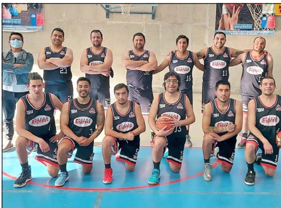
Llay Llay Basket hizo pesar su condición de local ante los Espartanos de Aconcagua.

Dentro de las cosas interesantes y a destacar de lo que va corrido de competencia, se encuentra la hasta ahora buena performance del representativo de