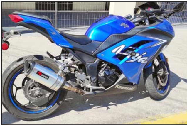
UNA GANGA.- Esta es la flamante motocicleta Kawasaki Ninja 300cc, año 2017, valorada en 3.8 millones de pesos. Cada número cuesta sólo $10.000.