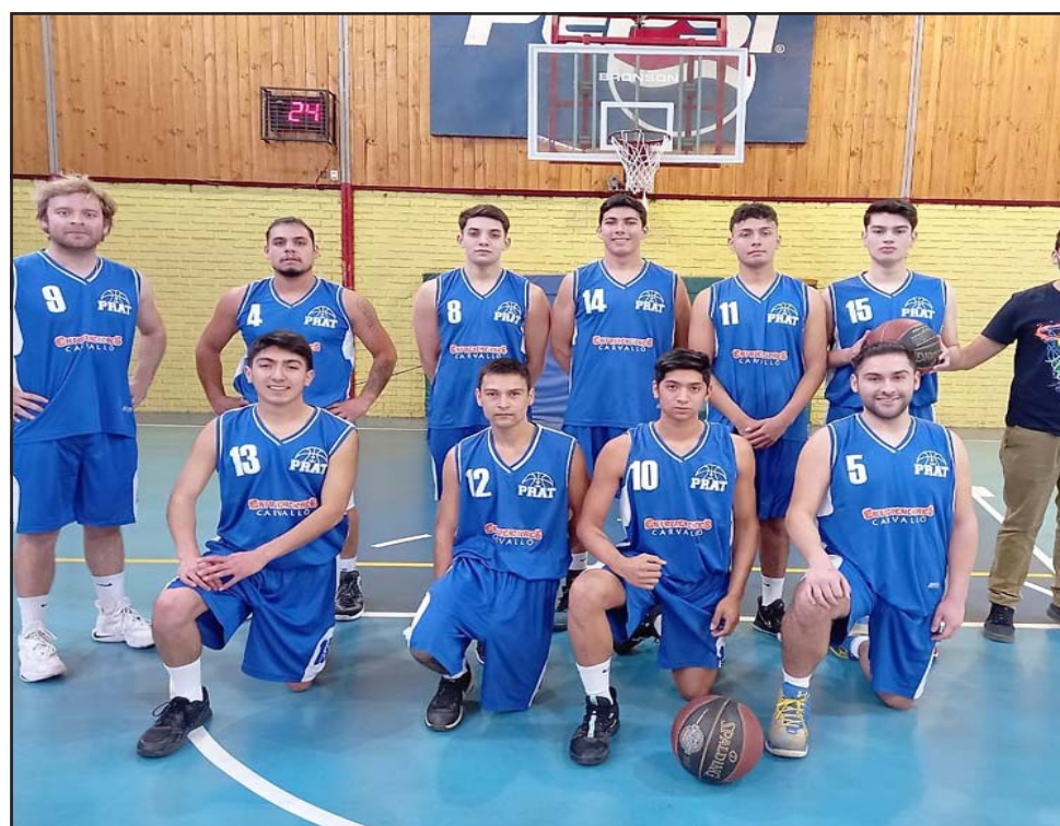
El novel equipo del Prat se está convirtiendo en el equipo a vencer en el Transición de la ABAR.

Prat, quinteto que tiene una campaña perfecta, convirtiéndose en uno de los cuadros a vencer en el campeonato.