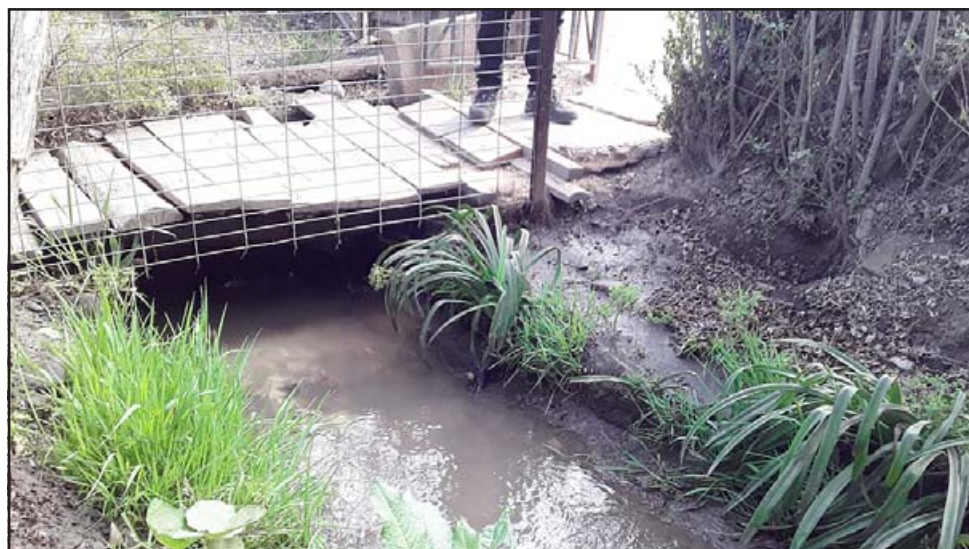
En este lugar fue donde el canal se rebalsó, causando el justificado malestar de los vecinos.