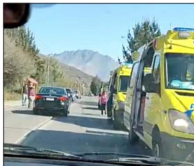
Ambulancias del SAMU afuera del lugar de la tragedia, el personal médico nada pudo hacer para revertir la tragedia. (www.putaendoninforma.com)

Desde Diario El Trabajo nuestras sinceras condolencias a su familia.