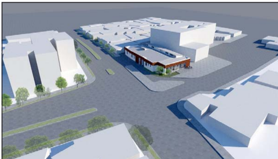
Esta unidad estará adosada al Cesfam Segismundo Iturra y representa una inversión pública de 1.400 millones de pesos.