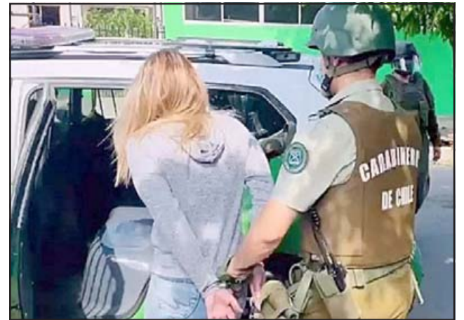
La fémina pasó a disposición del Juzgado de Garantía de Los Andes donde fue requerida en Procedimiento Simplificado por el delito de Tráfico en pequeñas cantidades. (Referencial)