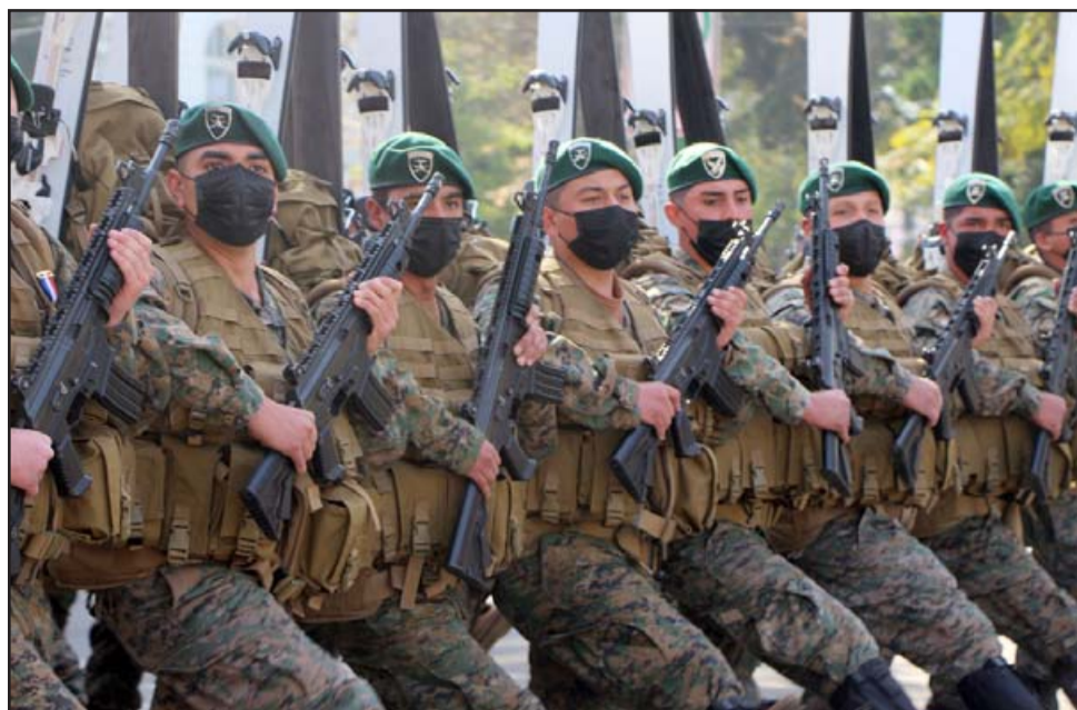
FUERZA Y VIGOR.- Los jóvenes militares desfilaron con hidalguía frente a las autoridades, el público aplaudió y celebró con ellos las Glorias del Ejército.

Por su parte el General del Ejército Juan Rojas Edwards , se refirió a la celebración con las siguientes palabras: «Bueno, nostalgia, siempre me recuerda cuando era joven y aquí en las cuatro alamedas uno iba trotando con sus soldados y mi corazón se encoge cuando paso por estas calles de donde estuvo uno hace decenas de años, yo la verdad es que estuve tres años acá, pero me moví mucho, entonces la gente que estaba acá partió a Los