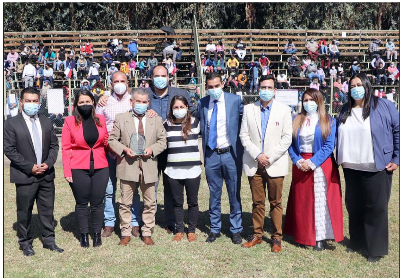
Con una serie medidas sanitarias, la ceremonia se realizó en el estadio Los Libertadores de la localidad de La Pirca.

DÍAZ VERGARA & ASOCIADOS ESTUDIO JURÍDICO