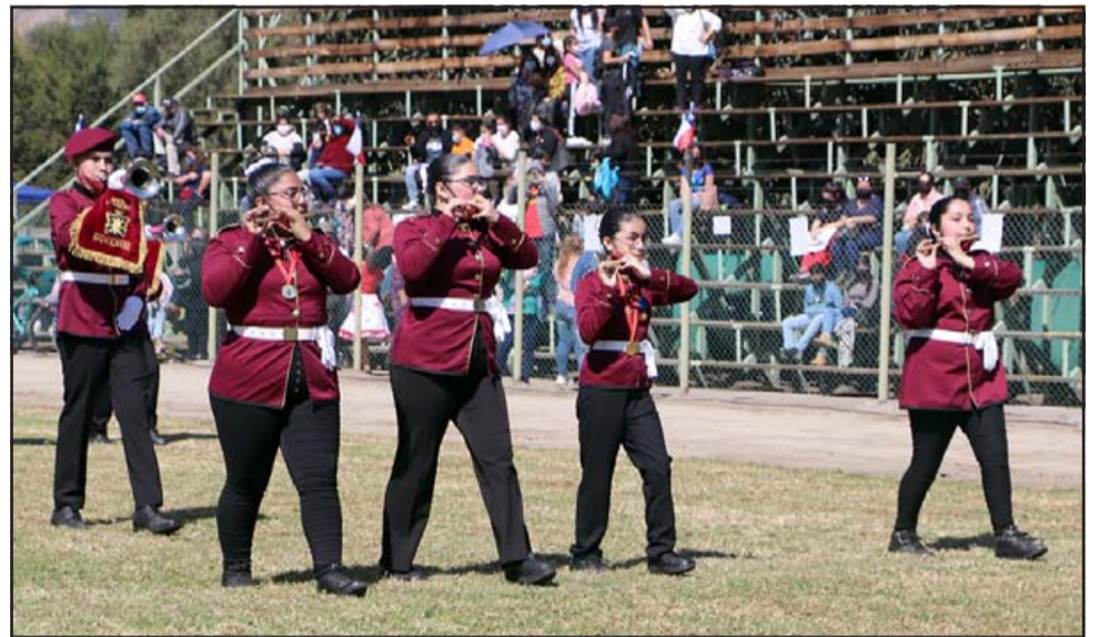
La Banda Municipal de Panquehue dio ritmo y fuerza musical a la jornada de las Fiestas Patrias.