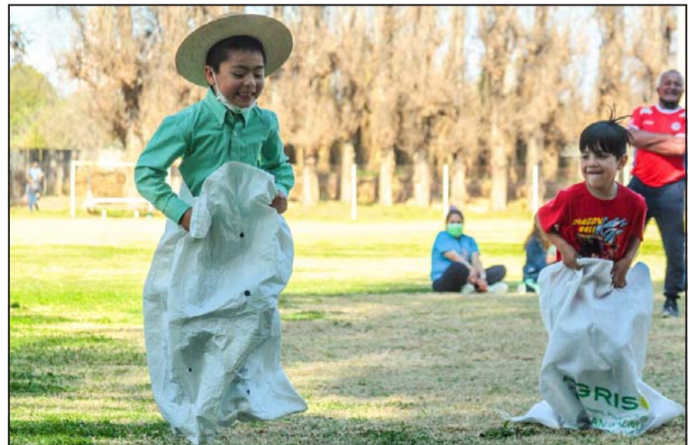
Estos pequeñitos corren a más poder en sus sacos, fue un fin de semana en familia.