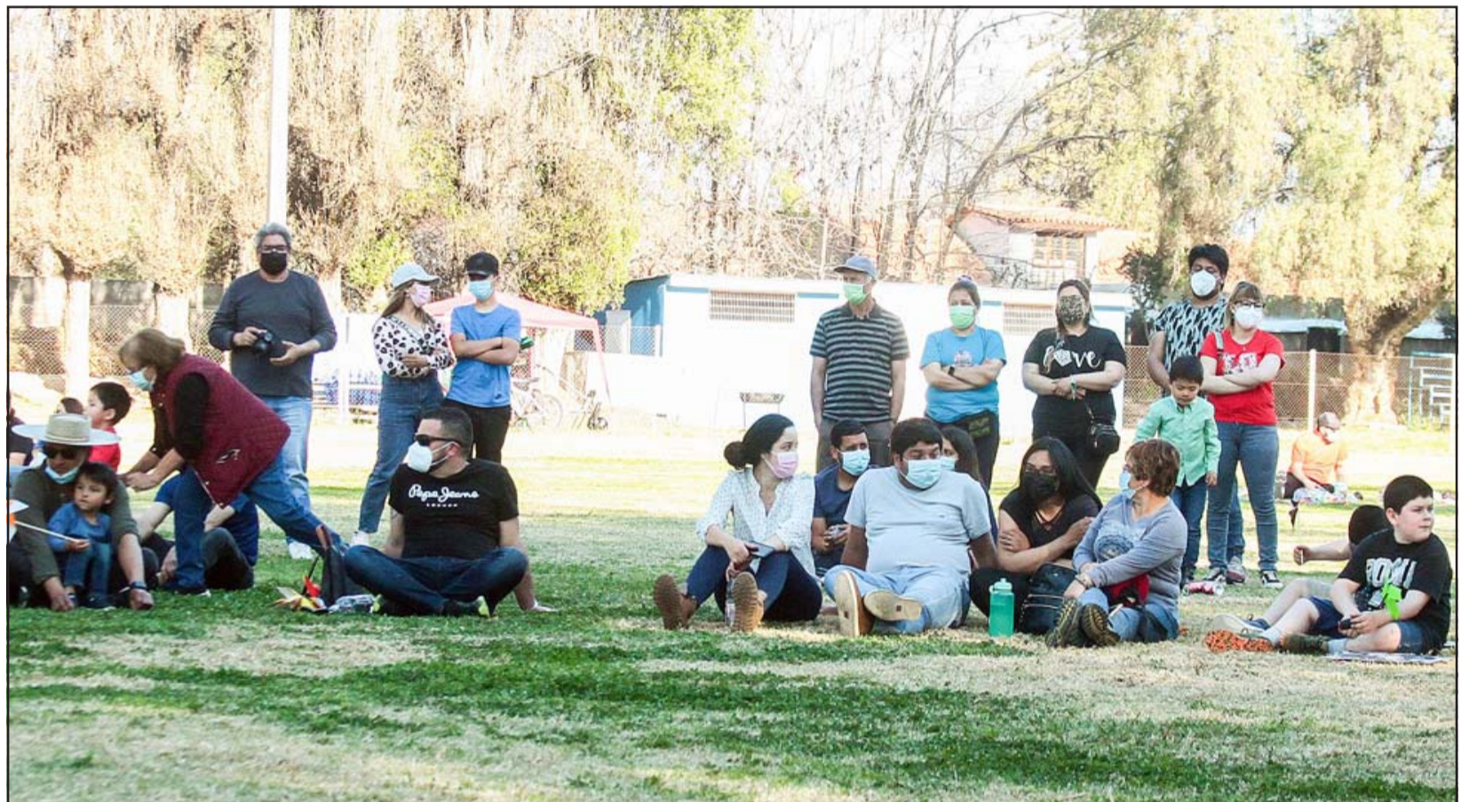
El evento, organizado por la Unión de Juntas de Vecinos de Curimón, ofreció diferentes actividades, con algunos juegos típicos, música, bailes, feria de emprendedores y una volantinada.