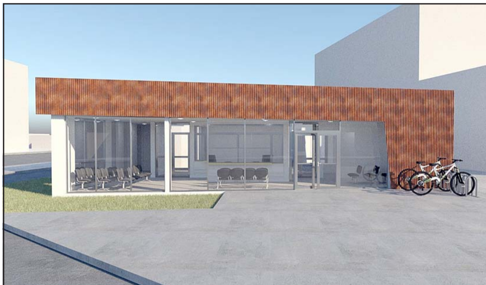
Este edificio permitirá descongestionar las atenciones de urgencia de menor complejidad en la comuna.