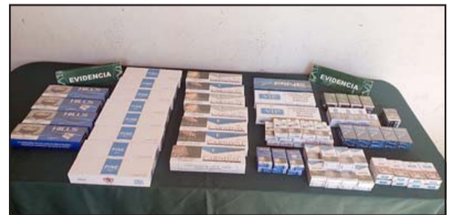
La mercadería incautada en Feria Diego de Almagro por personal de la SIP de San Felipe.

El mayor Ramírez Galdámez agradeció la información proporcionada por los vecinos y locatarios de la feria «para confiar en nosotros, entregarnos la información y también destacar en este caso el profesionalismo de la SIP, los cuales rápidamente dieron con el paradero de esta perso-