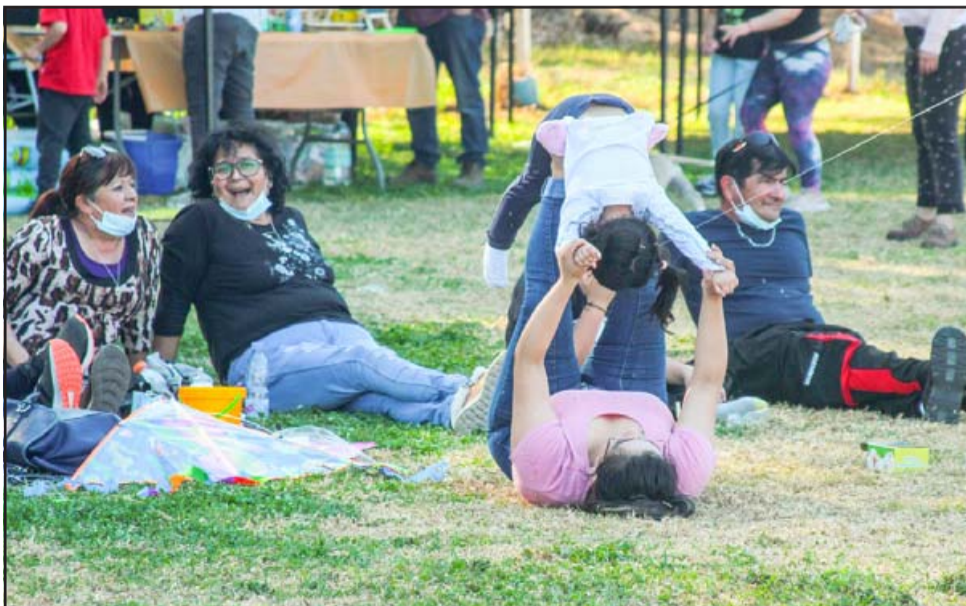
Las madres jugaron con sus hijos y nietos, primera fiesta familiar en Curimón desde que se instaló la pandemia en el mundo.