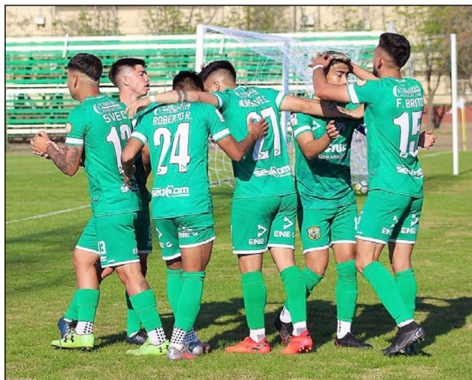
Parte del once verde que jugó el viernes pasado celebra uno de los goles sobre Rancagua Sur.

Jugadas ya cinco fechas de la fase de grupos, Trasandino sólidamente está a la cabeza del grupo Centro con 13 puntos, seguido muy de lejos por Municipal Santiago que tiene 9.