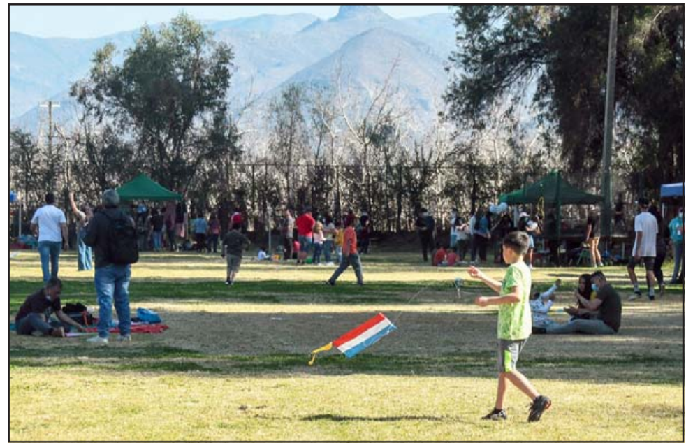
Con un entretenido día para compartir, entretenerse y disfrutar en familia, así se vivieron las Fiestas Patrias en Curimón.

Fiestas Patrias de nuestro pueblo, realizando actividades muy bonitas, como la volantinada donde se regalaron y encumbraron volantines junto a las familias que asistieron; además muy agradecidos por la gran asistencia, por la presencia de emprendedores y sobre todo por las ganas de compartir de nuestra comunidad de Curimón».