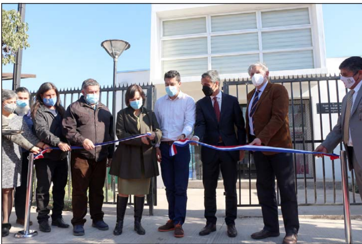
El embajador de Argelia estuvo presente en la ceremonia, en la cual se formalizó la conclusión de un proyecto de larga data que finalmente llega a manos de la comunidad.