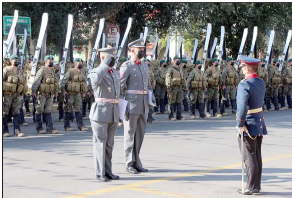
FRENTE A PLAZA CÍVICA.- Los honores y saludo a las autoridades e invitados especiales los realizaron los mismos militares.