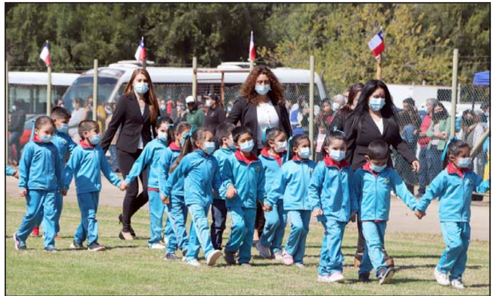
Estos pequeñitos engalanaron la jornada, pues para algunos de ellos es su primera vez juntos y desfilando en público.