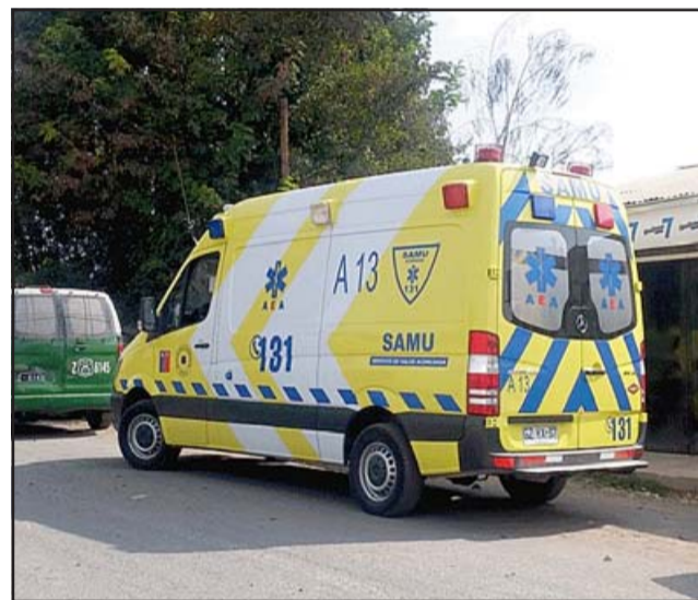
Esta triste noticia enluta todo el sentido de las Fiestas Patrias para la comunidad de Putaendo y de Aconcagua toda.