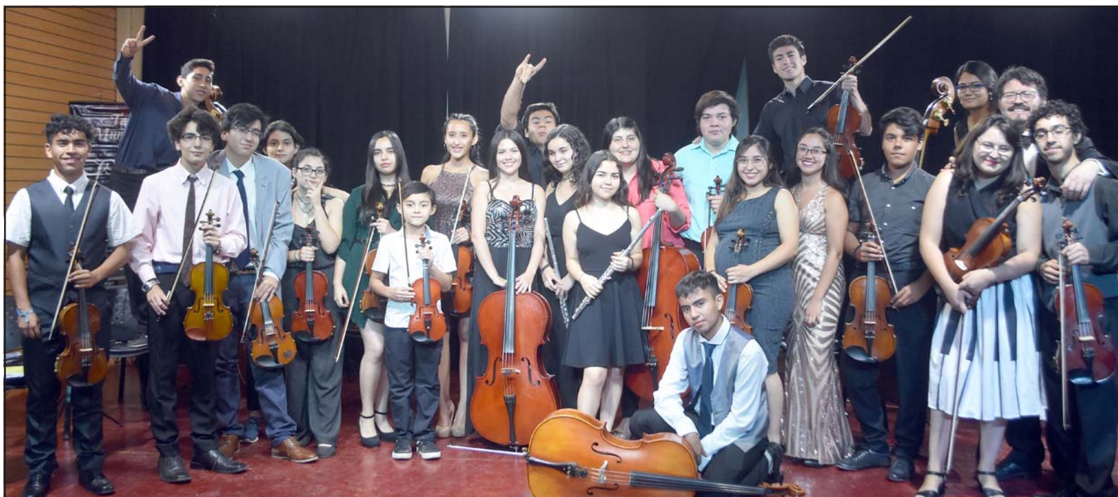
Estos jóvenes conforman la flamante Orquesta Juvenil Municipal, talentosos jóvenes con mucha proyección artística.

La cultura en la comuna, quiere fomentar el aprendizaje de diversas disciplinas artísticas, integrando contenidos teóricos y prácticos, con enfoques en creación, producción y participación, ciudadana. Si necesitas más información te puedes comunicar al celular +56981779121 , de lunes a viernes de 08:15 a 13:00 horas y de 13:45 a 17:30 horas, viernes hasta las 16:30 horas, o al mail teatrosantamaria1@gmail.com . La invitación es a participar de esta amplia gama de talleres, la Municipalidad de Santa María, Teatro Municipal y oficina de Cultura. Vania Oyarzún López Periodista.