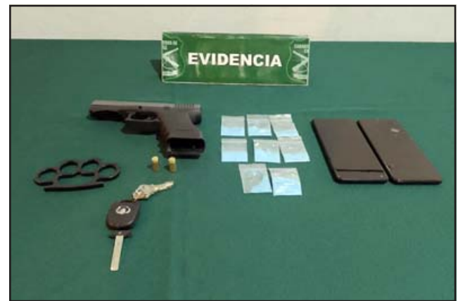
Pistola modificada, droga, manopla y los celulares encontrados al interior del automóvil.

«Hoy (ayer) pasó a control de detención en el Juzgado de Garantía de San Felipe, un sujeto de 18 años de edad que el día de ayer (miércoles), en horas de la noche junto a otros sujetos, se movilizaban en un vehículo con la placa patente oculta y procedieron a interceptar a un joven de 16 años que caminaba por calle Ignacio Carrera Pinto junto a otros dos menores, y luego de requerirles sus pertenencias, uno de los autores derribó a la víctima, golpeó con una manopla en la cabeza, mientras que el otro, que resultó detenido, le sustrajo el teléfono celular mientras lo intimidaba con un arma de fuego. Tras ello ambos sujetos volvieron a subirse al auto huyendo del lugar, instante en que pasó una patrulla de Carabineros quienes fueron alertados por uno de los testigos so-