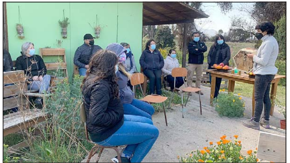
El municipio llayllaíno está trabajando estrechamente con representantes de la apicultura local para la protección de las abejas.

DÍAZ VERGARA & ASOCIADOS ESTUDIO JURÍDICO