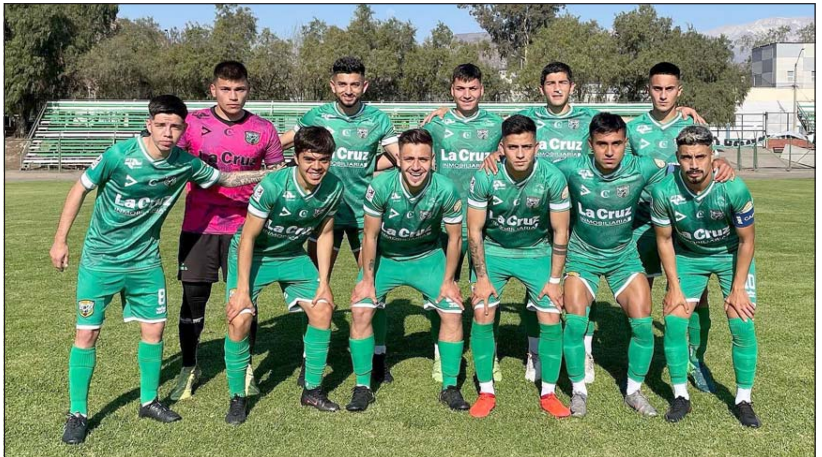
Trasandino ha dominado sin contrapesos el grupo centro de la Tercera A.