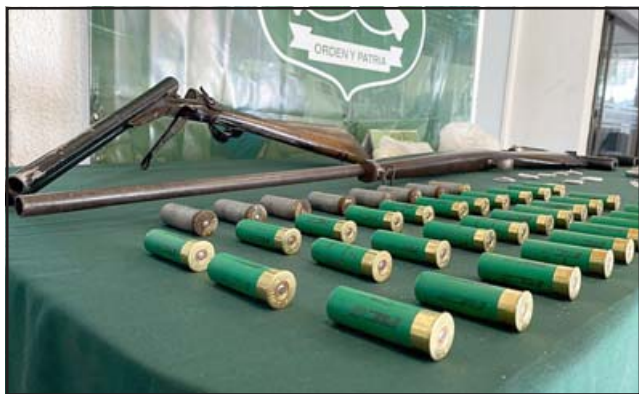
Acá se aprecia la gran cantidad de municiones que fueron encontradas en poder del imputado.

Importante señalar que de los tres que aparecen en el video, ya hay dos detenidos en prisión preventiva, faltando sólo un tercero que estaría plenamente identificado.