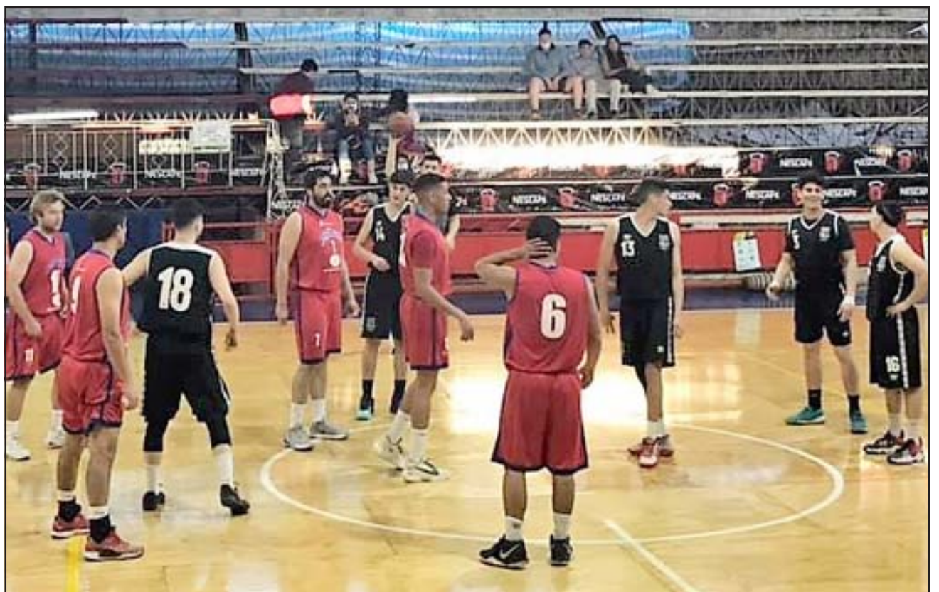
El Prat hará este fin de semana su debut en la Liga Nacional 2 y la Liga de Desarrollo.

Como duelo preliminar se contempla el encuentro por la Liga de Desarrollo (U23) entre el Prat y Quilpué Básquetbol.