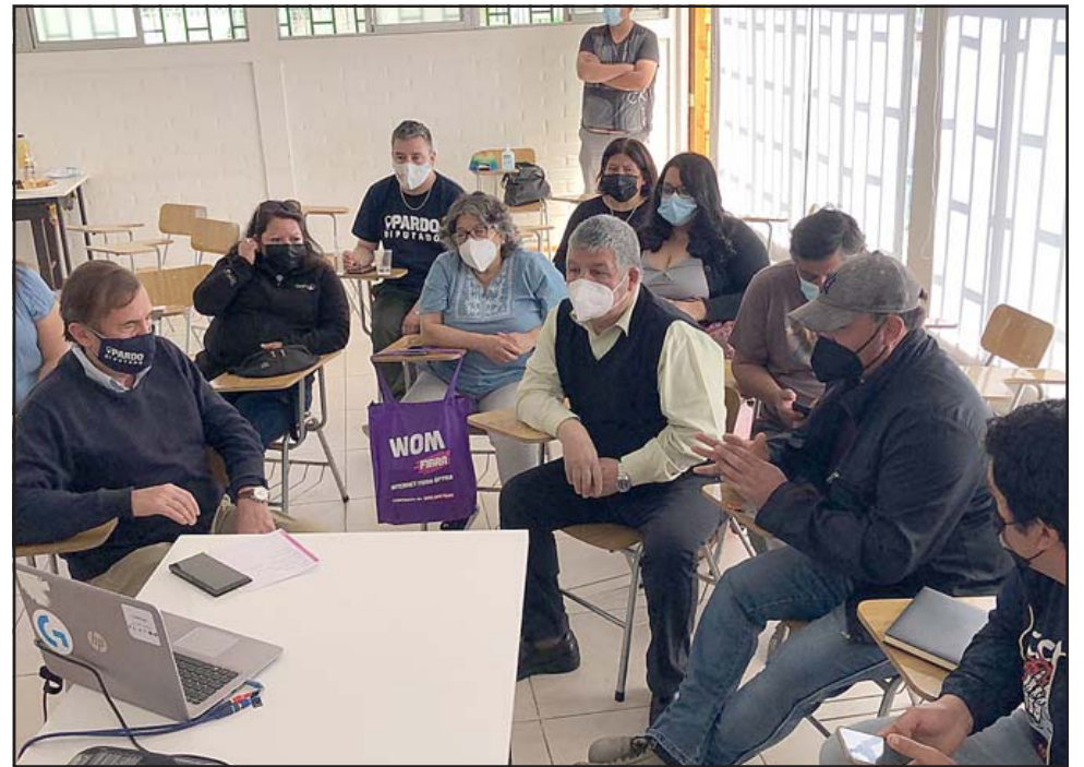
La reunión fue bien valorada por los asistentes, quienes recalcaron al ministro la importancia que el Estado realice un buen trabajo en el monitoreo del material particulado y de la calidad del aire.