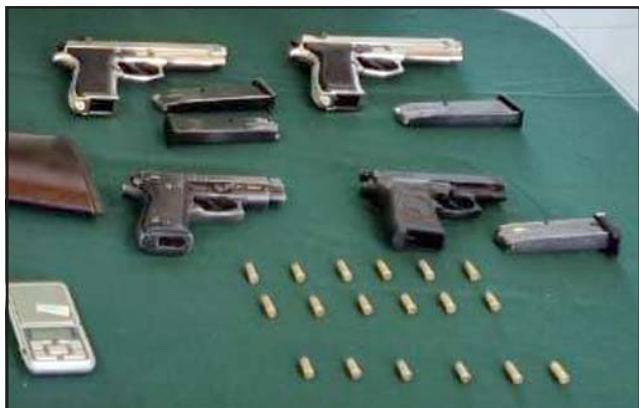
Cuatro pistolas, de las cuales 3 son a foguero y que fueron modificadas para usar munición verdadera.