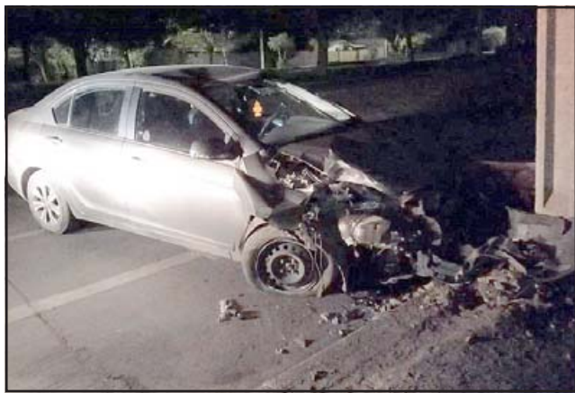
El automóvil, con sus placas patentes cubiertas, terminó estrellándose contra un árbol al intentar escapar.

Se otorgó un plazo de investigación de 80 días.