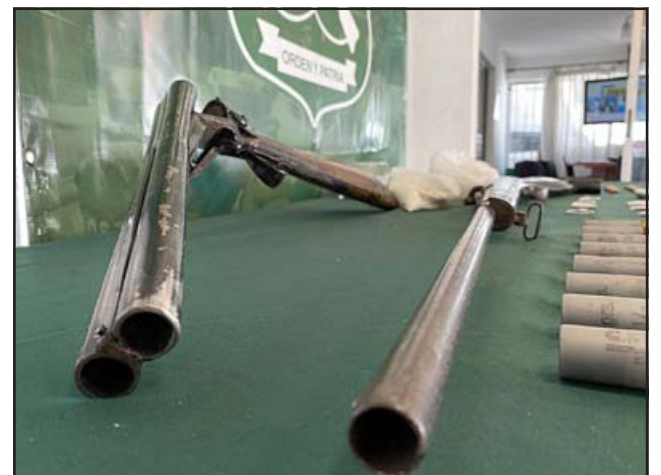
Acá las escopetas de grueso calibre que estaban en poder del imputado.