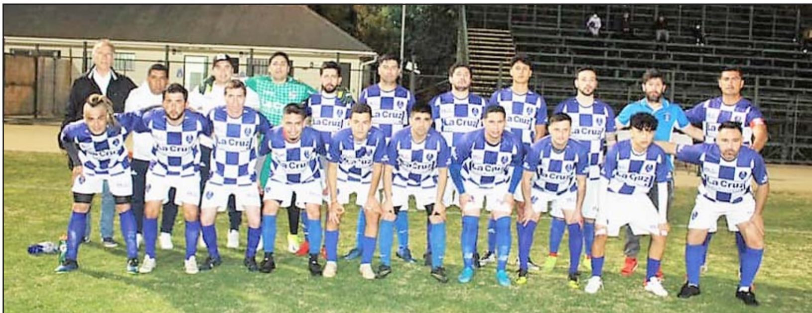
La localía le otorgará a Juventud La Troya de San Felipe una buena chance de avanzar a las semifinales de la Copa de Campeones.