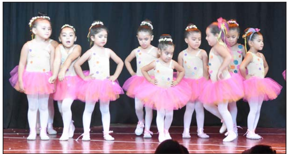
Las más pequeñitas de la casa también podrán aprender y mejorar su ballet clásico.

el de Danza Árabe , dirigido a mujeres desde los 18 años de edad, que quieran aprender en forma dinámica y entretenida este maravilloso y milenar baile, tie-