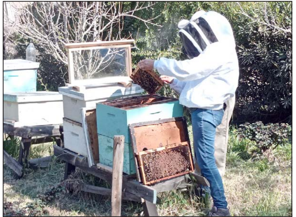
Las abejas realizan una labor vital para la supervivencia de la humanidad, situación que fue entendida por el municipio de Llay Llay que inició una fuerte campaña en su defensa.

Otro punto importante en este proceso de protección, es la unidad dedicada al rescate de abejas que se encuentran en la vía pública, y que muchas veces por temor son destruidos por los vecinos. Es por ello que si la comunidad llayllaína ve un panal de abejas, es importante que no lo intente tocar, dañar, ni mucho menos quemar. Debe llamar al número +56 9 6477 6159 y los equipos de emergencias irán a retirar el enjambre, para posteriormente trasladarlo a un lugar seguro donde podrán continuar su importante proceso para la vida.