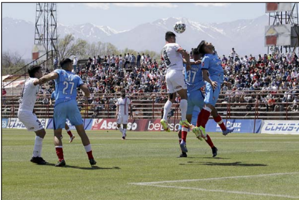
Unión San Felipe intentó de manera desordenada y por todos los medios llegar al gol en el pleito de ayer.