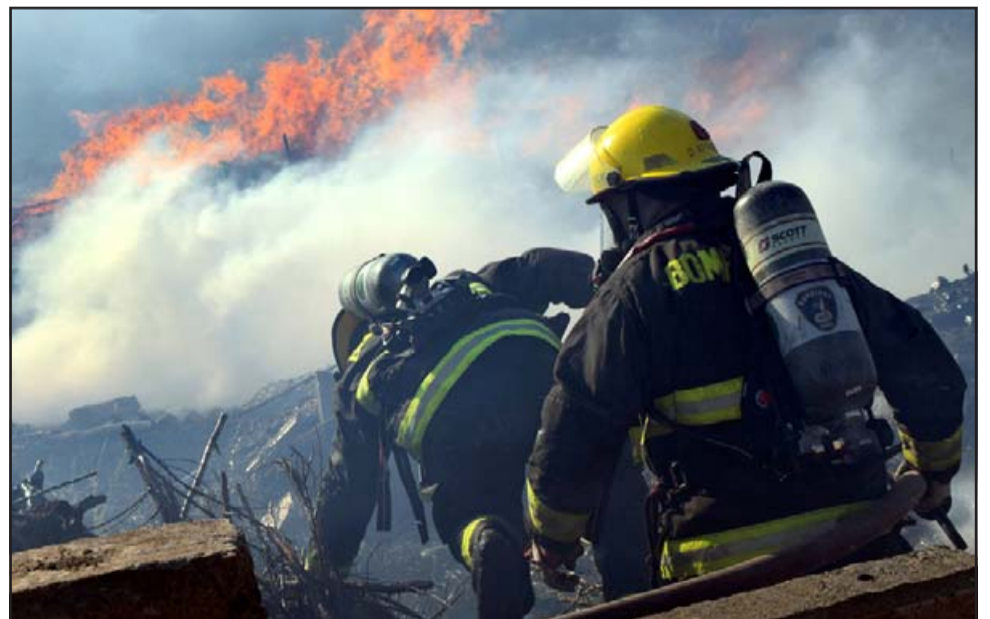
EN PLENA ACCIÓN. - Algunos de ellos cayeron al suelo en pleno escenario en llamas, debían de cargar también el pesado equipo en medio del terreno agreste.