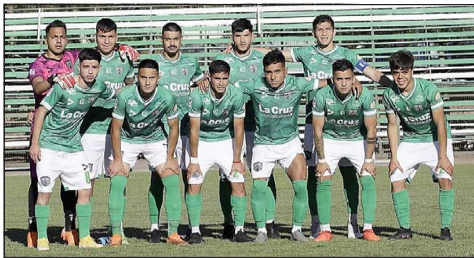
El equipo andino no ha podido convertir el estadio Regional en una fortaleza inexpugnable.