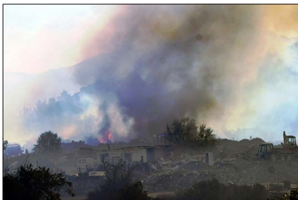
PUEBLITO EN PELIGRO.- Estas humildes viviendas por poco fueron consumidas por las llamas, los bomberos evitaron que fueran consumidas.