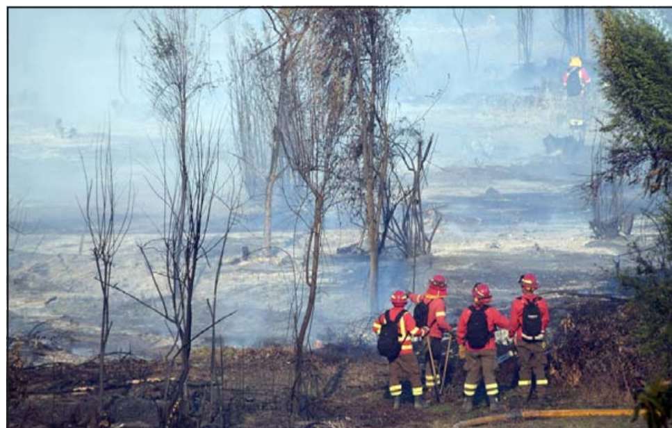
BOSQUE DESTRUIDO.- Nuestra lente registra lo que fue del bosque entre las rutas 60CH y troncal 601 En el sector callejón San Luis.