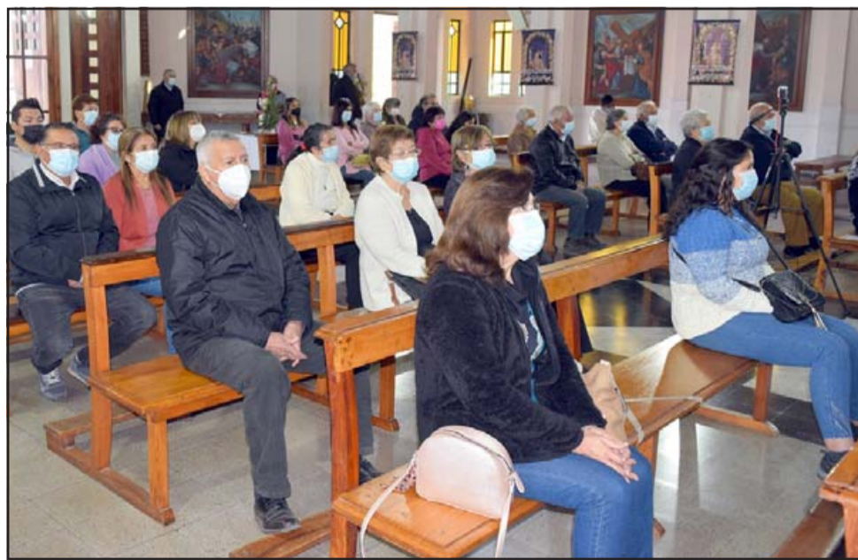
AFORO REDUCIDO.- La actividad religiosa se realizó siempre aforos limitados, pues pese a que estamos en Fase 4, la pandemia sigue latente.