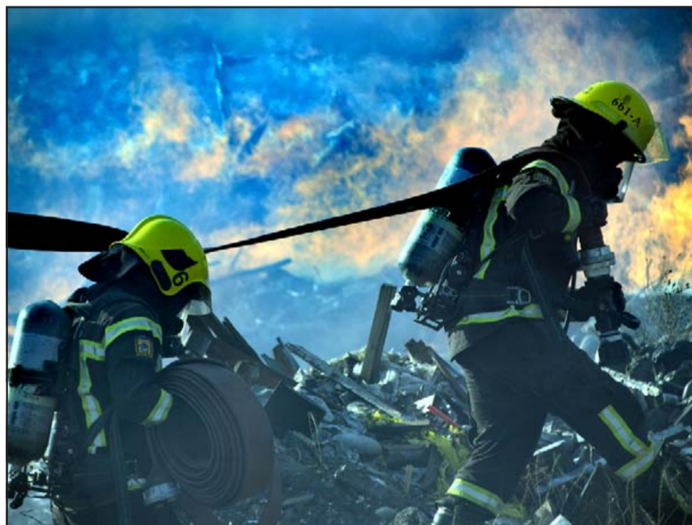
ENTREGA TOTAL.- Pareciera la escena de alguna película pero no lo es, son nuestros bomberos aconcgüinos haciendo su labor.