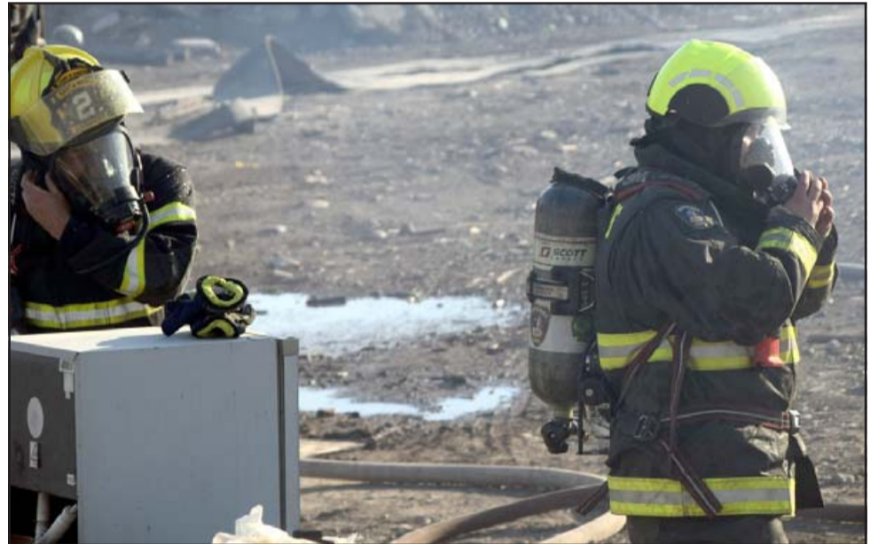
IMPOSIBLE RESPIRAR. - Cada uno de los bomberos debió usar equipo especial y tanque de oxígeno para enfrentar este desafío.