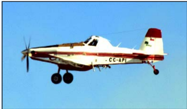
DESDE LOS AIRES. - Importante destacar que varios aviones de la Brigada Conaf y en colaboración con el Club Aéreo de San Felipe, entidades que mantienen un convenio para estas emergencias, brindaron apoyo hídrico desde los aires.