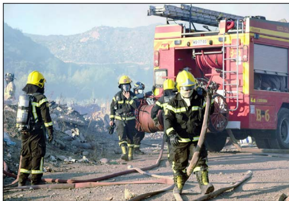
MÁS DE 200 BOMBEROS.- Los carros bomba llegaban llenos de agua, pero en pocos minutos se agotaba la misma.