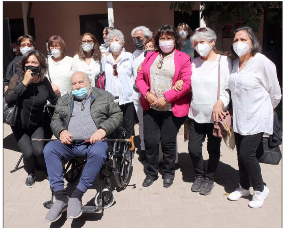
Usuarios de los distintos centros de atención de personas mayores festejaron en el Conjunto Patrimonial Buen Pastor.