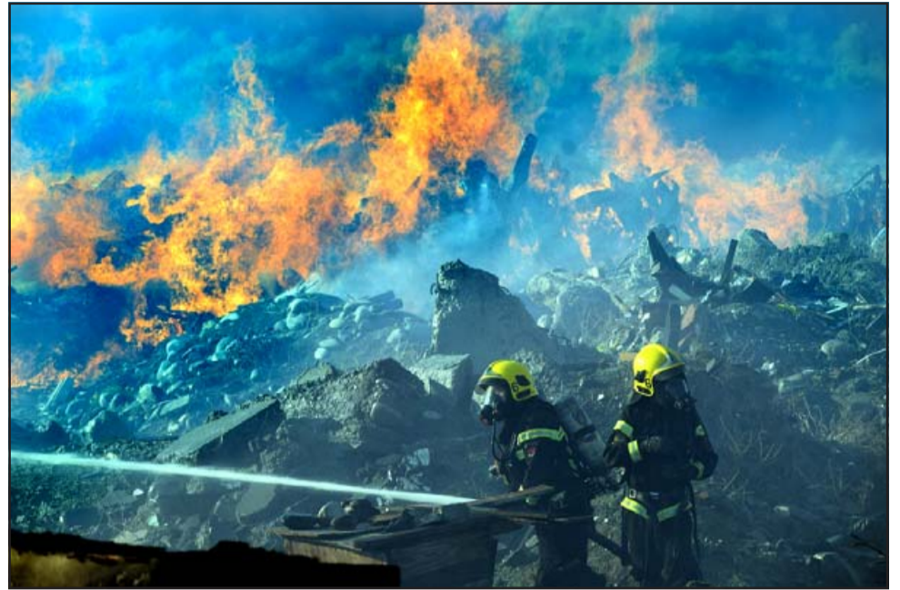
DAVID CONTRA GOLIAT. - Por casi 30 horas consecutivas los bomberos del Valle de Aconcagua debieron emplearse a fondo para controlar las llamas que devoraban todo a su paso.

En total habrían sido más de cinco hectáreas las consumidas en su totalidad en la parte de los cerros, y otras más en el bos-