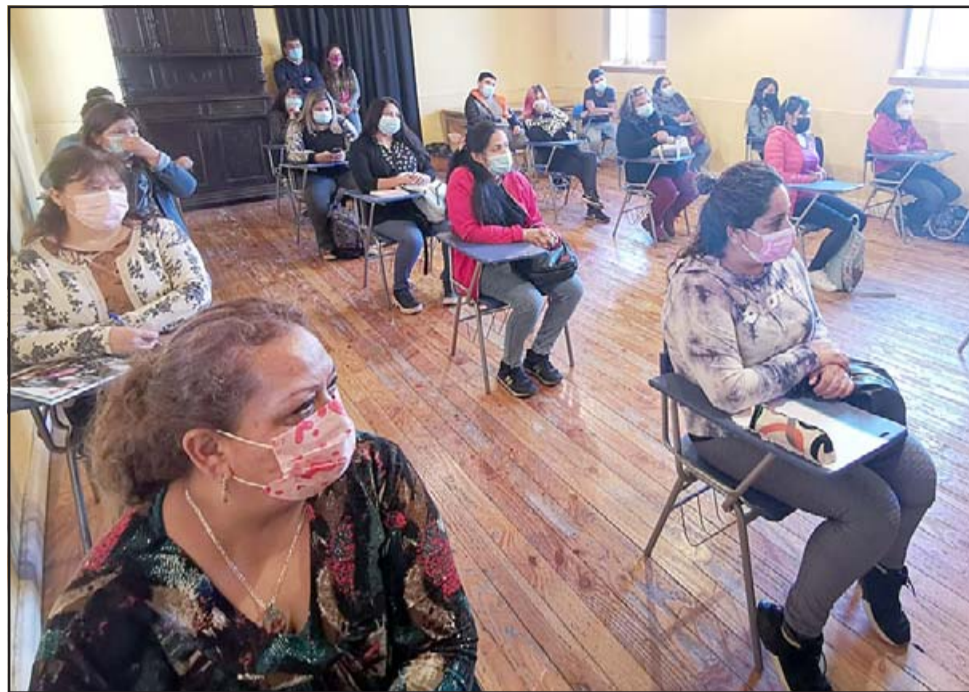
Fundación Luksic encabeza esta iniciativa en la comuna y cuenta con el apoyo de la Municipalidad de Calle Larga.

«Esta iniciativa surgió de una reunión que tuvimos con la Fundación Gastronomía Social quienes nos plantearon poder desarrollar emprendimientos gastronómicos en el país a raíz del surgimiento de las ollas comunas. En ese sentido quisimos ir más allá y decidimos desarrollar instancia en las que las personas pudieran desarrollarse en el rubro gastronómico tanto emprendiendo como adquiriendo habilidades para desarrollar algún empleo en el rubro gastronómico y nos acercamos a Calle Larga por el trabajo en conjunto que la fundación Luksic