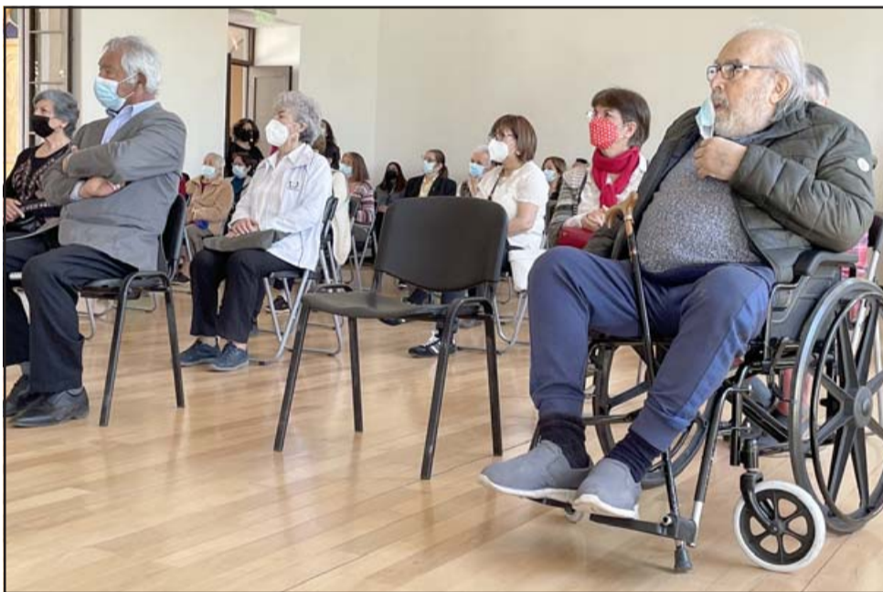
No importaron las limitaciones físicas para pasar un buen rato compartiendo con sus pares.