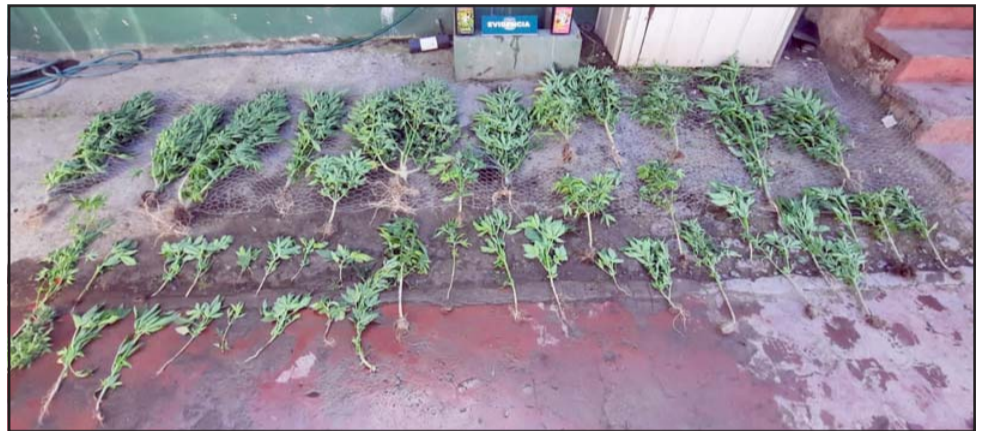
Las 45 plantas de marihuana decomisadas por Carabineros de Catemu.