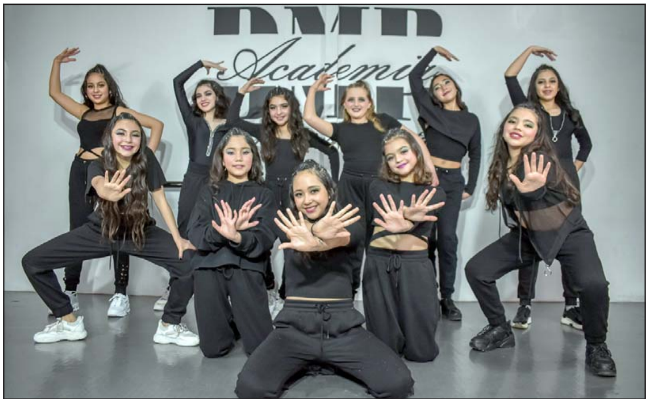
CALENTANDO MOTORES.- Estas jovencitas están más que entusiasmadas, seguirán en campeonatos en Chile, y foguearse así para Cancún 2022.

- Actualmente nos encontramos trabajando para variadas participaciones virtuales en las que participan 120 bailarines en el Certamen Nacional de Danza Los Andes 2021, a México están confirmados 106 miembros, y pronto nuestra primera participación de manera presencial en Santiago en el mes de diciembre We Just Dance. En este momento nos encontramos preparando de manera muy ansiosa nuestra gala y con muchas expectativas para que se pueda desarrollar de manera presencial en el