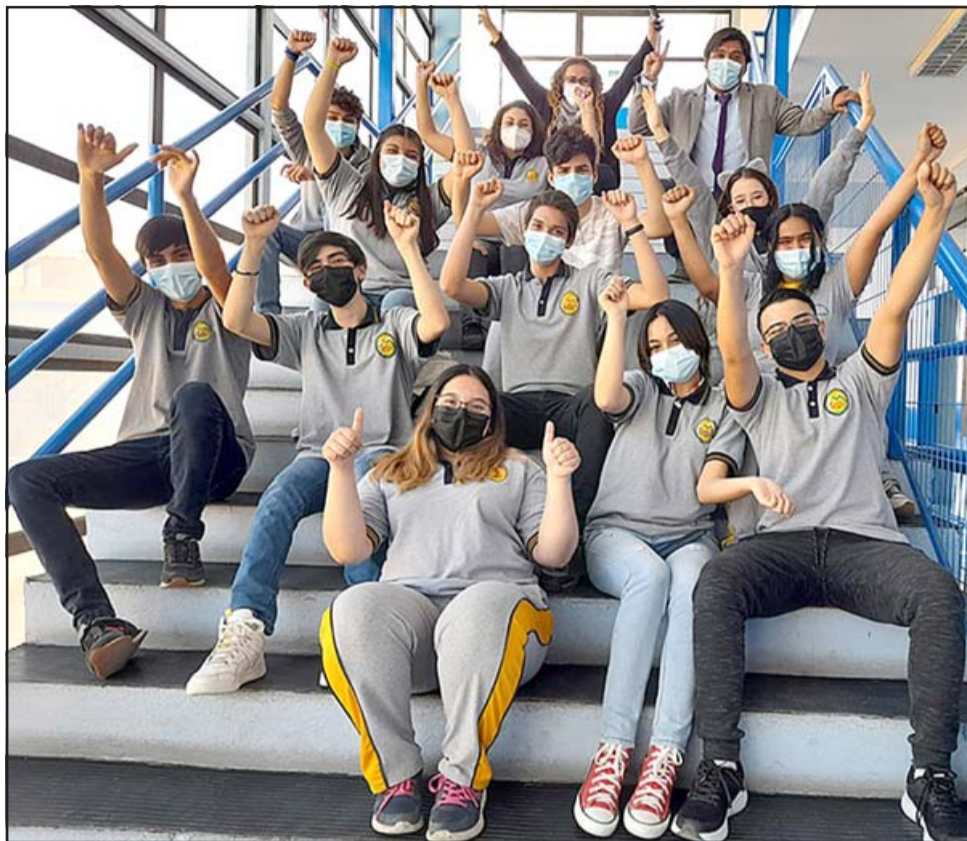
El primer puesto del Torneo Académico Interescolar quedó en manos del equipo 2 del Liceo Cordillera (en la imagen), en tanto el segundo lugar fue para el equipo 1 del mismo establecimiento.

«La idea es que a través de una herramienta lúdica como este torneo, y viviendo la experiencia de poner a prueba sus conocimientos, se puedan empapar y cono-