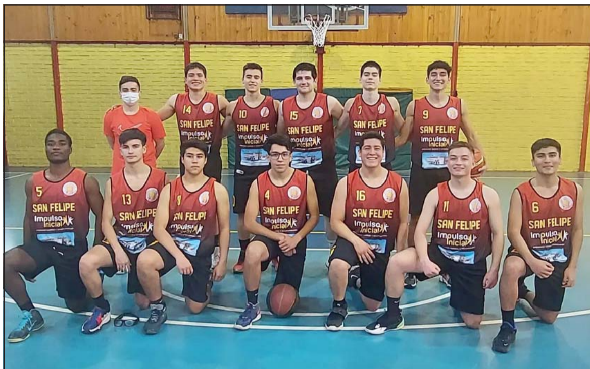
San Felipe Basket irá por el título en el torneo de Transición de la ABAR.