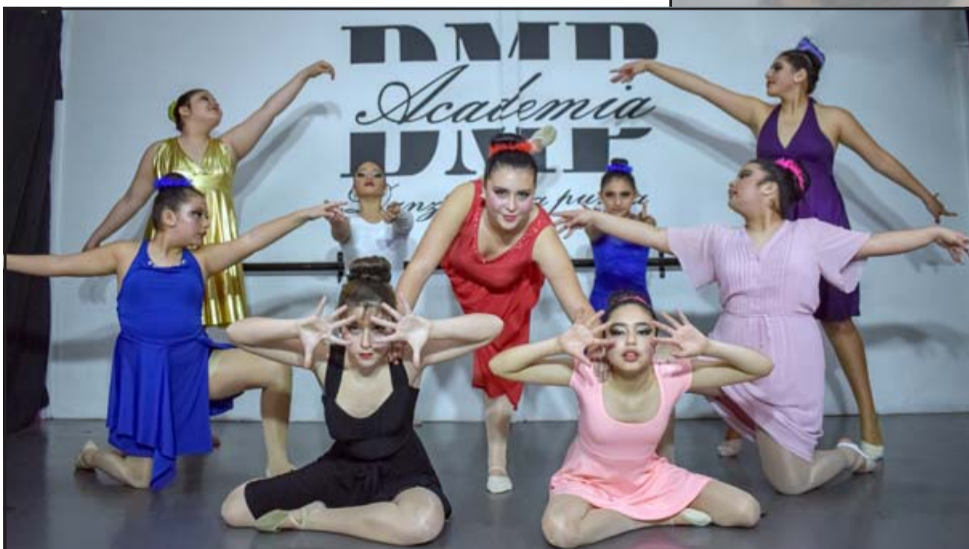
EXPERTAS EN ACCIÓN.- Las más grandes llevan años en esto, saben que las competencias son duras y la satisfacción muy grande.