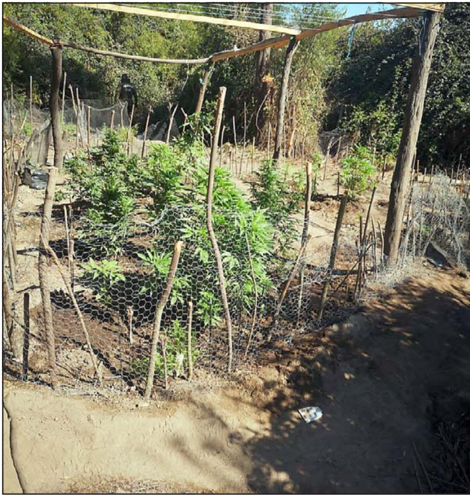
Así estaban las plantas de marihuana encontradas en el sector de San José, en Catemu.