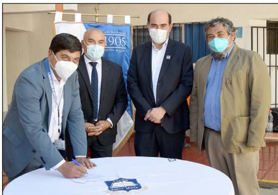
HECHO ESTÁ.- Las cámaras de Diario El Trabajo registran el momento de la firma de este importante documento.