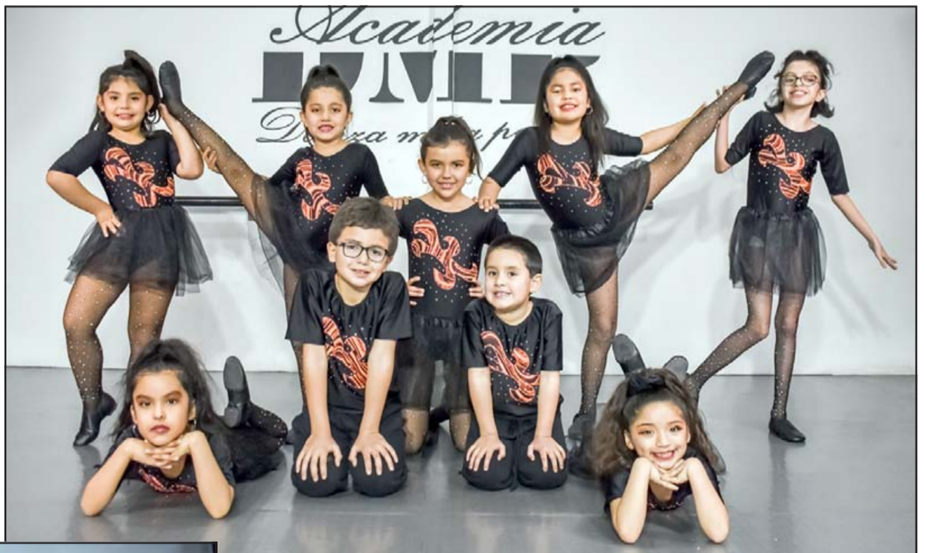
PEQUEÑOS CAMPEONES.- Estos pequeñitos también venían ensayando online, ahora regresan a sus prácticas presenciales.