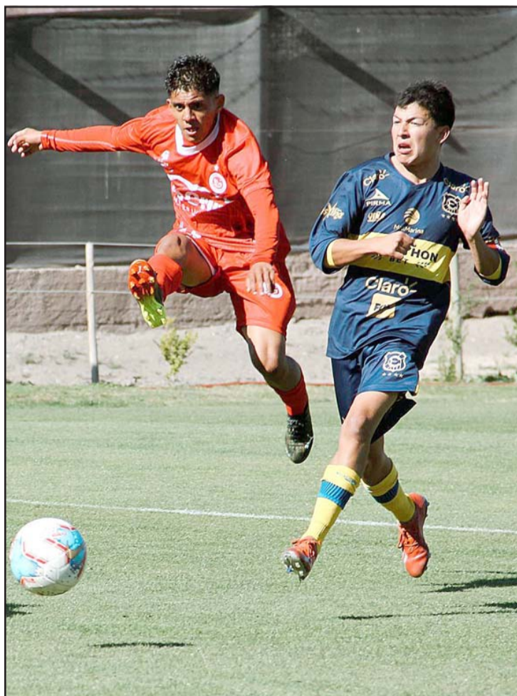
Los cadetes de Unión San Felipe están destacando en el Grupo 3 en el torneo de Fútbol Joven de la ANFP.

Llay Llay Basket 50 – Cangurros 60 San Felipe Basket 99 – Árabe 70