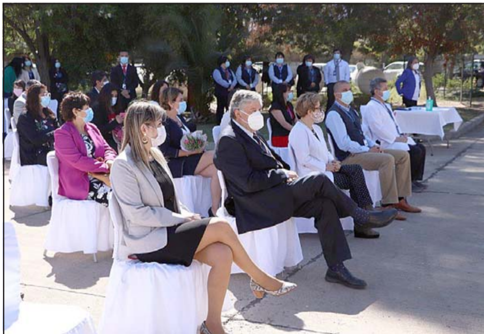
El Hospital San Camilo celebra un nuevo aniversario en medio de todo su trabajo para dar la mejor atención a quienes son víctimas de la pandemia del Covid-19.

yecto liderado desde el Servicio de Salud Aconcagua denominado Estudio Pre-Inversional , que busca determinar qué es lo que se requiere para construir el nuevo hospital.