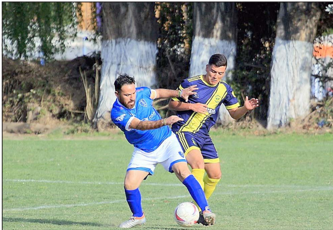
En pocas semanas más volverá a rodar la pelota en las canchas sanfelipeñas.

Durante la conversación con nuestro medio, el directivo ratificó la medida que por esta vez el 'Amor A La Camiseta' se jugará de manera exclusiva con clubes de San Felipe, lo que podría cambiar el próximo año, siempre y cuando las condiciones sanitarias lo permitan.