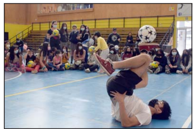
EL QUE SABE... El profe se lució mostrando sus habilidades a sus estudiantes, pronto de seguro vendrán competencias en la comuna.

«Este es un deporte que se está haciendo más famoso cada día acá en Aconcagua, aún así son pocas las personas que lo están haciendo. En la costa se practica mucho, en Santiago también se ve harto, pero bueno, acá el joven colega nos vino a mostrar y a enseñar también este depor-