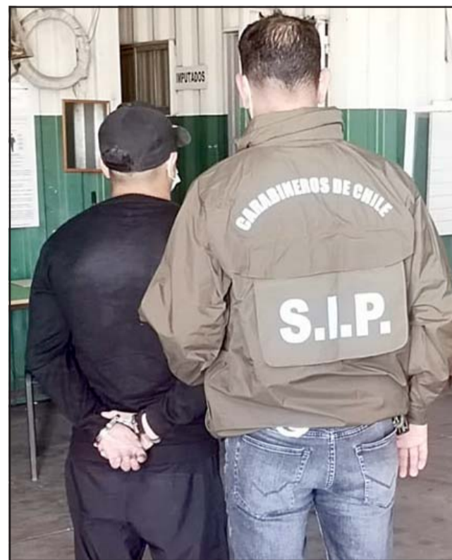
El imputado en el cuartel de Carabineros de San Felipe.

Se dio cuenta al fiscal de turno quien dispuso que