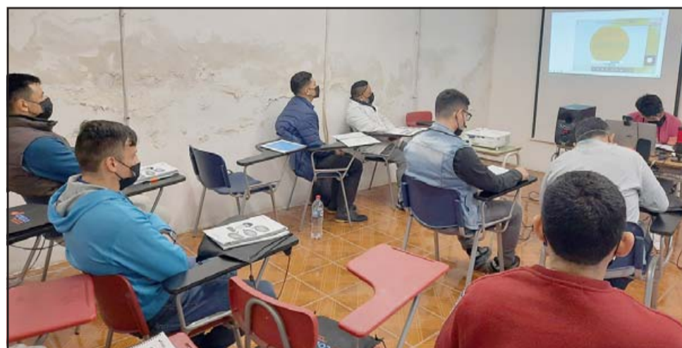
Diez internos del CCP de San Felipe están participando en el taller de manipulación de alimentos.

«El día de hoy dimos comienzo a un curso on-line de manipulación de alimentos. Este curso está siendo extendido a diez usuarios de la unidad, quienes realizan los cursos los días miércoles, jueves, viernes y sábados. Son 50 horas cronológicas que debiese estar terminando a fines de octubre. Ellos (la población) fascinados, la verdad que les hacía falta retomar