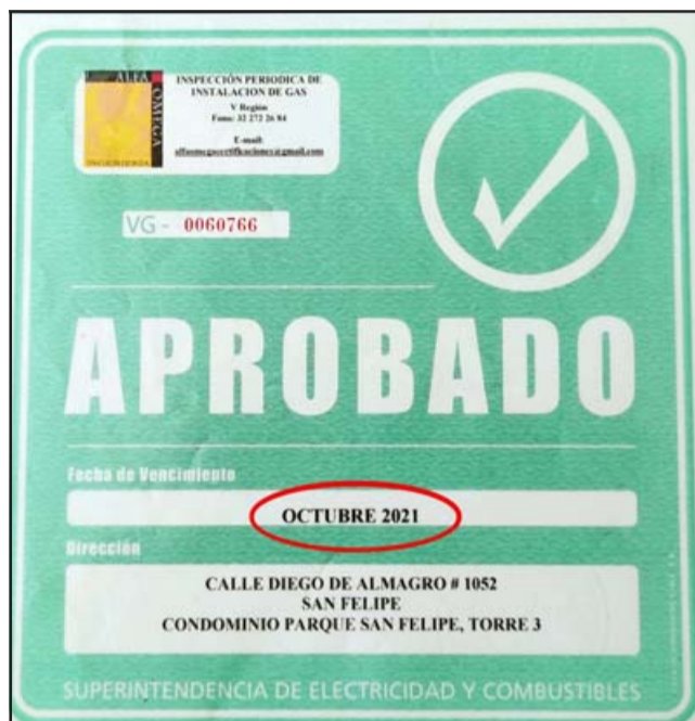
EL TIEMPO CORRE. - Este es el Sello Verde emitido por la Superintendencia de Electricidad y Combustibles, mismo que se vencerá en pocos días.