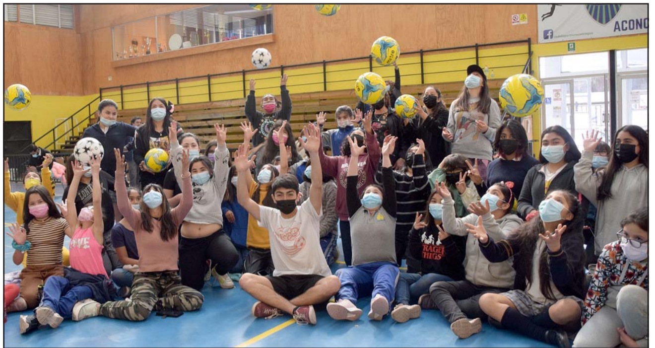
VIVA LA AVENTURA.- Con gran energía estas niñas empiezan a dominar el balón en el Fútbol Freestyle, de momento es el único liceo de la región apuntando a tal disciplina recreativa.

- Sí, pues siempre que sea un descontrol del depor-