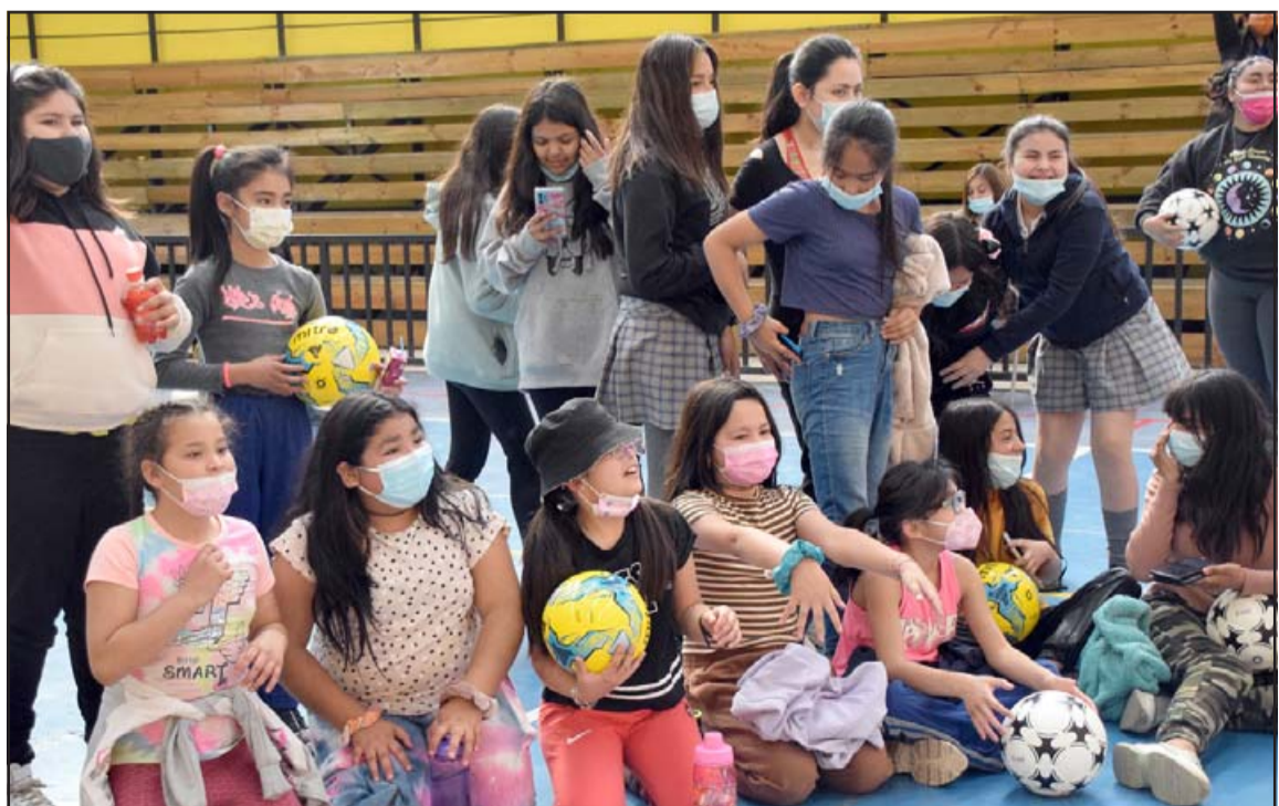
LOCURA POR EL FREESTYLE.- Las más pequeñas ansiosas estaban por tener la pelota y mostrar sus destrezas.