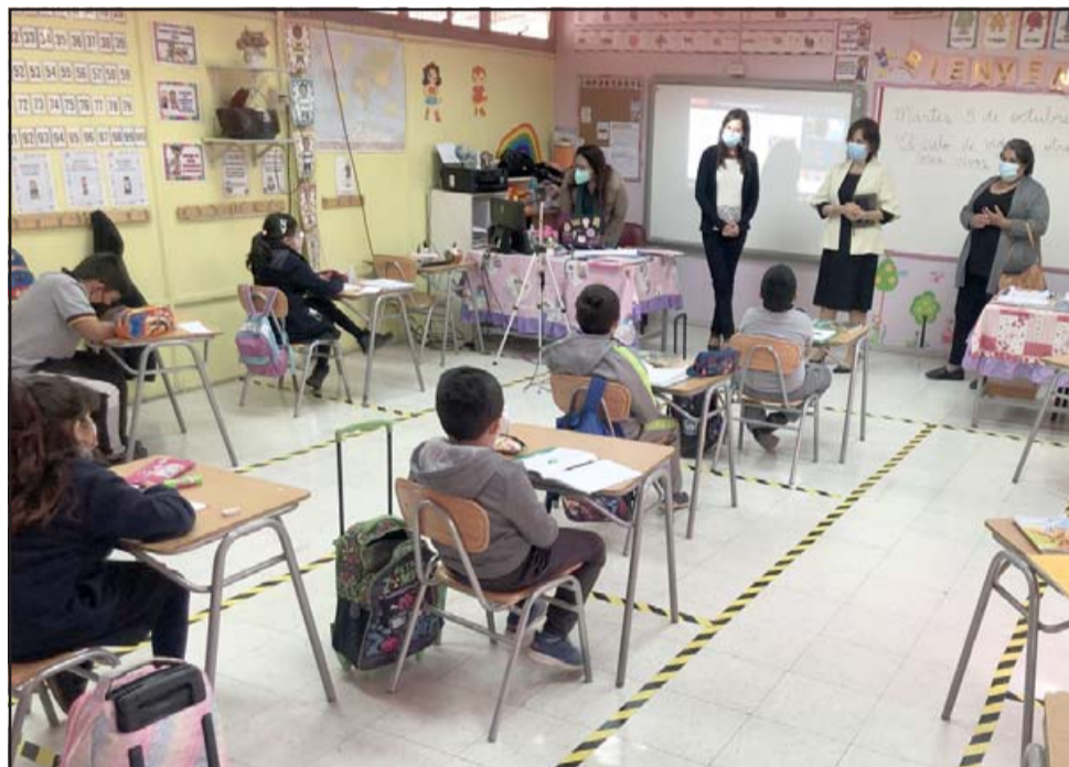
Las autoridades también recorrieron algunas de las salas donde se están efectuando clases presenciales.