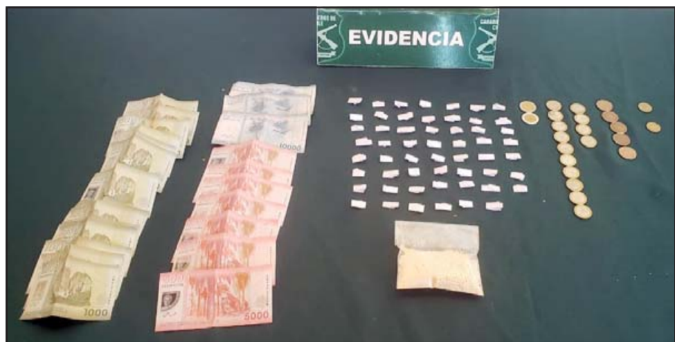
En la imagen se aprecia el dinero y la drogada decomisada.

da por este medio, el imputado quedó en libertad, con firma mensual y arraigo nacional.