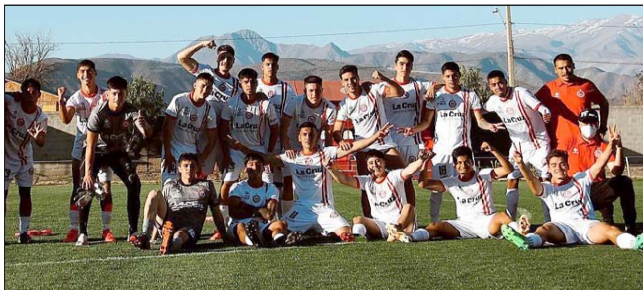
Los equipos de Unión San Felipe enfrentarán a sus similares de Unión La Calera.

de este fin de semana, en el que deberán desafiar a sus similares de Unión La Calera, los que hasta ahora vienen cumpliendo campañas menos que discretas en ambas categorías. Estadio Pueblo Nuevo Artificio Sub 18; 10:00 horas: Unión La Calera – Unión San Felipe