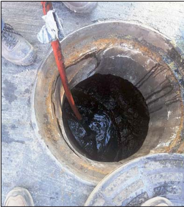
Los funcionarios de la sanitaria realizaron una labor de limpieza preventiva, según aseguraron desde la empresa, descartando que los malos olores vinieran de la red.

En nuestra edición de ayer dimos a conocer el drama que está viviendo un grupo de comerciantes de calle Coimas producto de la hediondez que hay prácticamente en toda la cuadra.