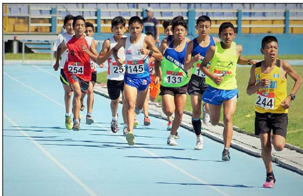
TODO GRATIS.- Esta será la primera Mini Olimpiada Ofelia Vicuña que se realizará en Aconcagua el 1º de noviembre en el Estadio Fiscal. (Referencial)

- Este Cuadrangular de fútbol formativo de ocho equipos infantiles estará dividido en: Sub 7 (años 2013-2014); Sub 5 (años