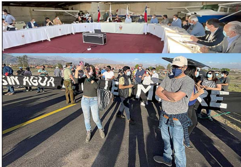
Mientras el ministro Moreno se reunía con los ediles y el gobernador regional en el Club Aéreo, afuera un centenar de manifestantes expresaban el rechazo al decreto de intervención del Río Aconcagua.

alcalde de Rinconada, quienes participaron de la reunión convocada por la alcaldesa Carmen Castillo , oportunidad en la que también participó el gobernador regional Rodrigo Mundaca , para abordar la problemática y acordar que exigirán que esta medida se revierta, entendiendo que en caso de ser materializada, generará un perjuicio enorme al valle, situación que fue expuesta al ministro de Obras Públicas, Alfredo Moreno , en una reunión que se realizó en horas de la tarde de ayer en el aeródromo de San Felipe, en la que participaron los nueve ediles y el gobernador Mundaca. Dicha reunión no estuvo exenta de polémica, ya que un centenar de manifestantes llegó con pancartas hasta el Club Aéreo