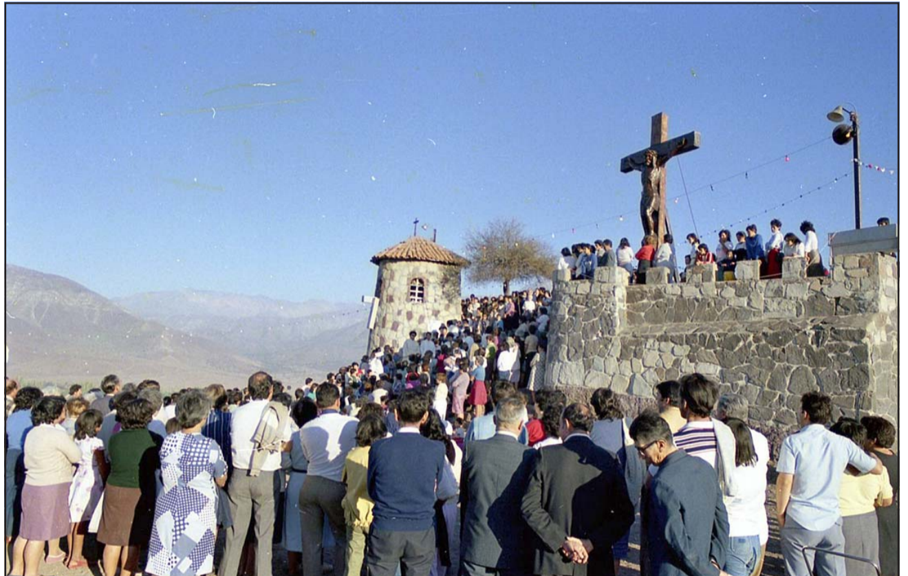
HISTORIA RELIGIOSA.- Esta histórica postal registra las actividades religiosas que a lo largo del tiempo se han realizado al pie del Cristo de Rinconada.