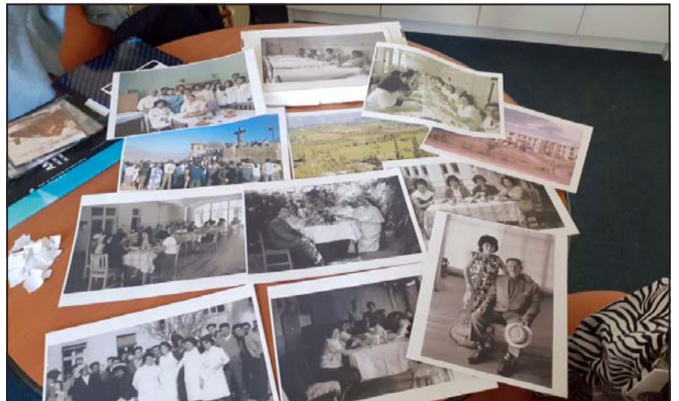
RECUERDOS EN PAPEL.- Aquí tenemos más fotografías antiguas, muchas de ellas facilitadas por familias de Putaendo.