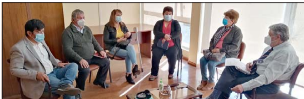
Los dirigentes de las UNCOS en reunión con el delegado presidencial provincial Boris Luk-sic Nieto.