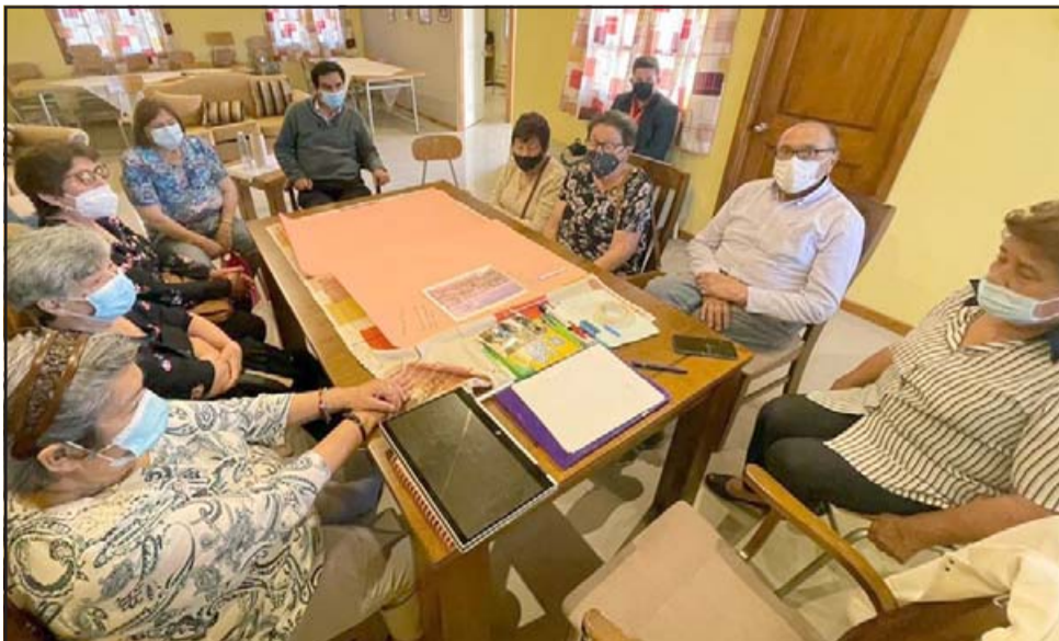
TODOS APORTANDO.- Ellos realizaron este Taller de Socialización del fondo fotográfico Rolando Videla Olguín en la sede de la Unión Comunal de Adultos Mayores de Putaendo.