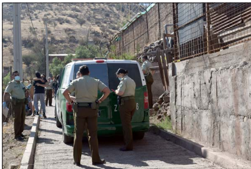
EL CRIMEN.- El martes 30 de marzo fue hallada sin vida la joven madre de 22 años de edad en su casa de habitación.

- Le dieron todo el favor a ella, aunque yo expliqué todo mi sufrimiento, pero igual nada. Igual yo los días sábado los voy a buscar a las 12 hasta las 7 de la tarde, el día domingo también voy a