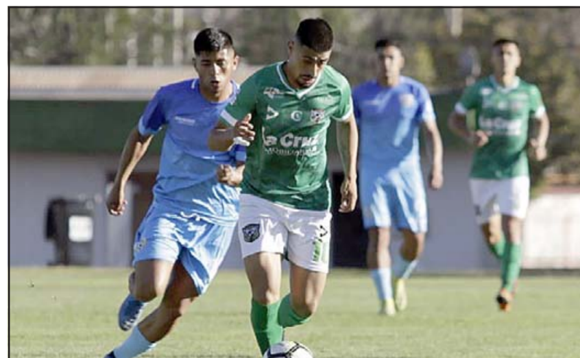
Trasandino ya siente la presión de dos equipos en su grupo.