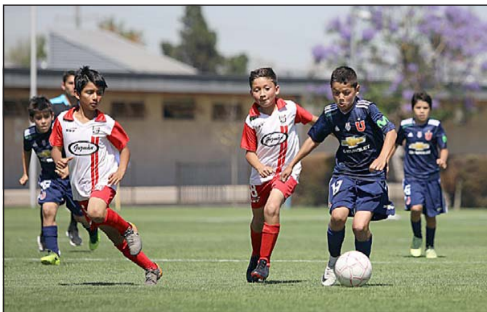
Para los amantes del fútbol en todas las edades, esta es la oportunidad para correr un rato tras la pelota. (Referencial)