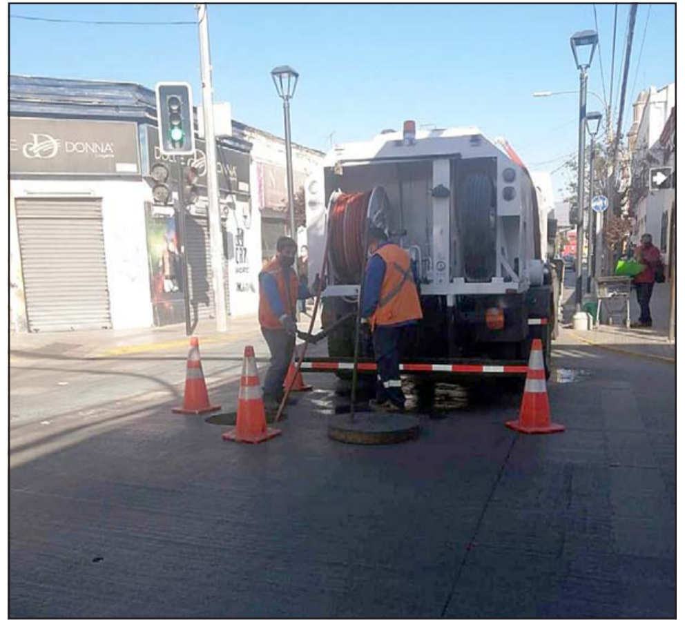
Personal de Esvál llegó hasta el sector de Coimas con Portus donde revisaron las cámaras de alcantarillado.

«Además, preventivamente nuestro camión jet operó en el lugar, ratificando que no hay obstrucciones o rebases. Ello, nos per-