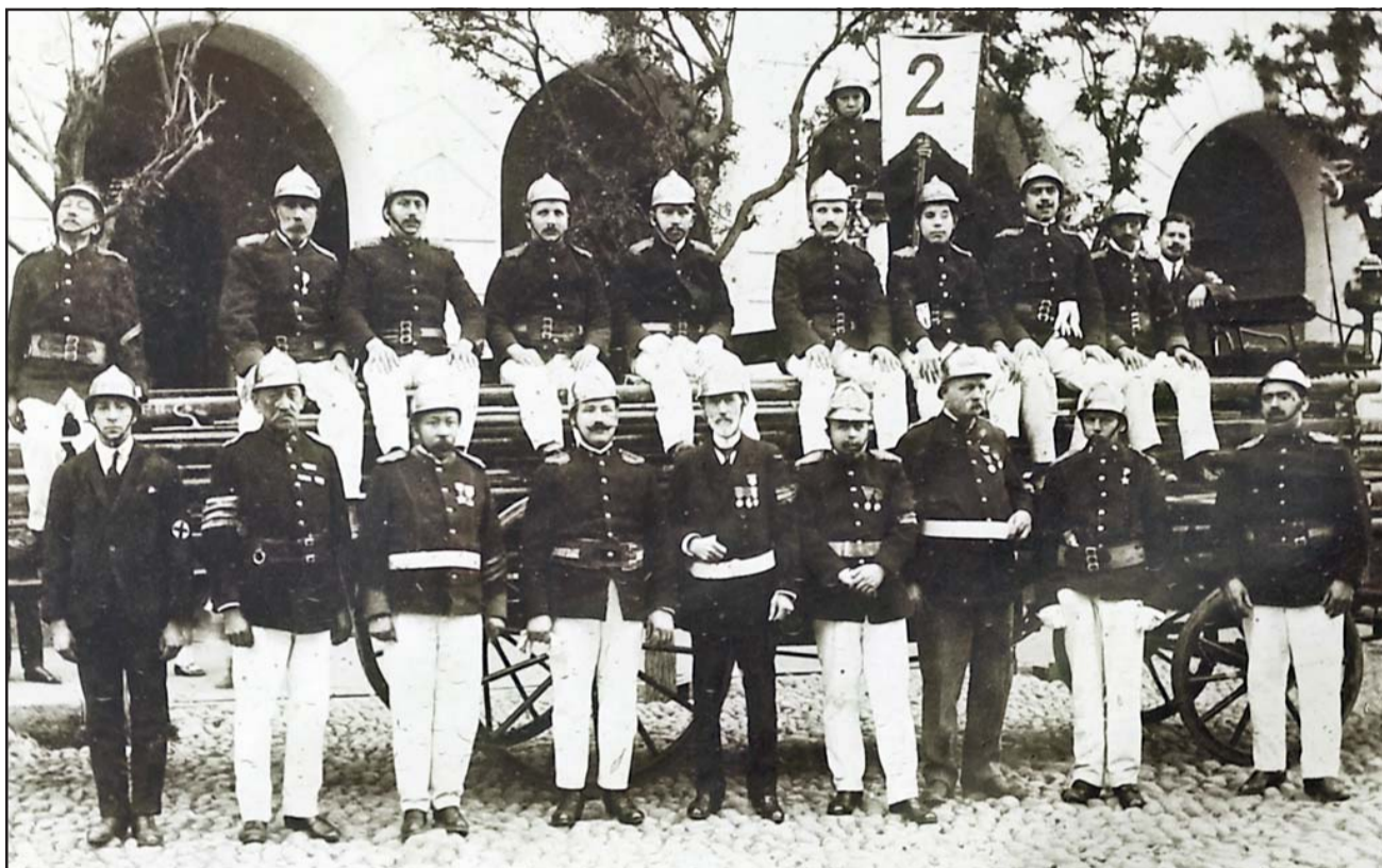
CONSAGRADOS A SERVIR.- Ellos son una de las primeras generaciones de la Segunda Compañía de Bomberos de San Felipe, a principios del siglo XX.

- Actualmente contamos con 49 bomberos en total, de los cuales seis son Honorarios, 43 activos, en las brigadas juveniles hay doce cadetes. En referencia a nuestro equipo, contamos con unidades MX-2 escala