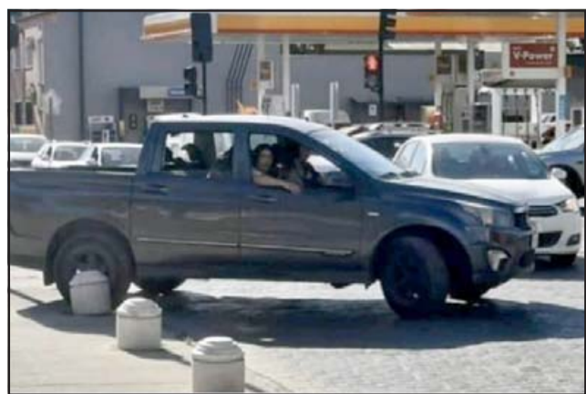
Acá los sujetos en la camioneta que dice la afectada habrían agredido a su yerno.

- Como a las 4 ó 5 de la tarde. Yo estaba trabajando cuando me avisaron que estaban en el hospital con el joven. Porque llamaron a Carabineros, no se hizo presente,