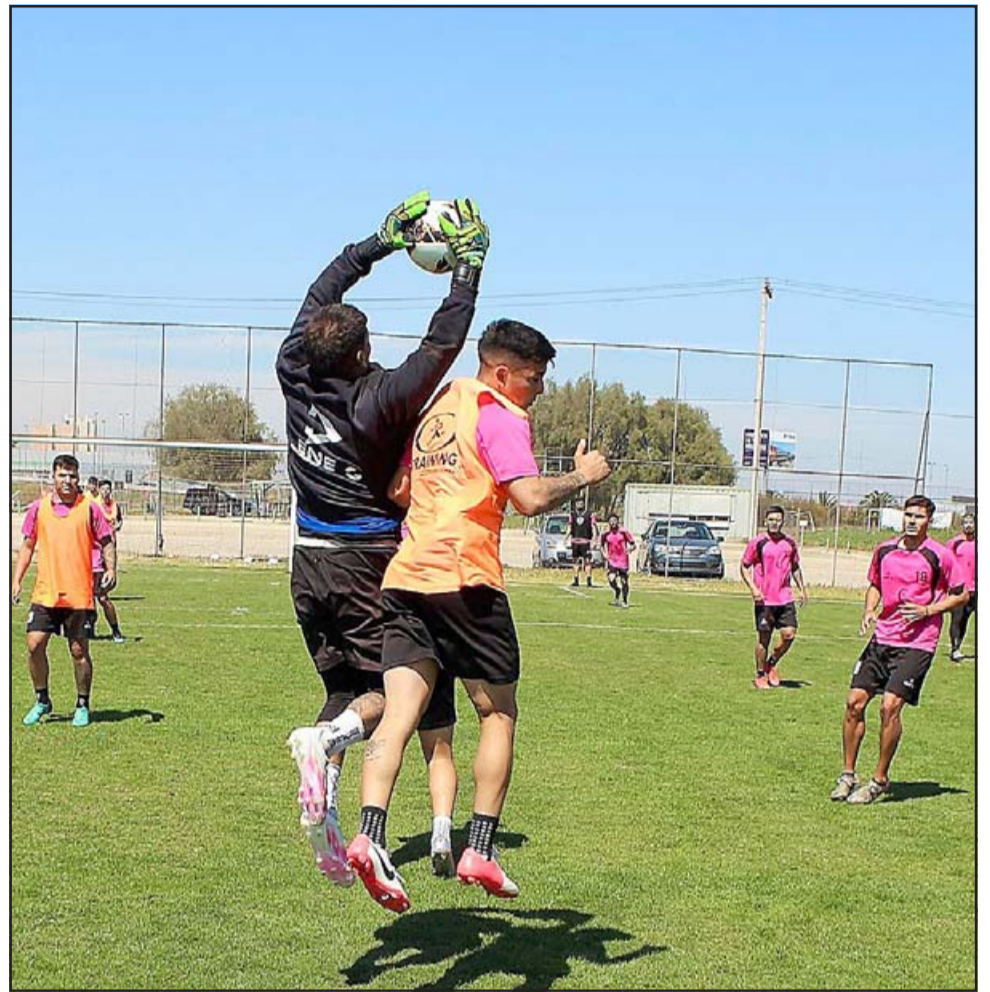
La escuadra de Los Andes viene en caída libre en la actual competencia de la Tercera A.