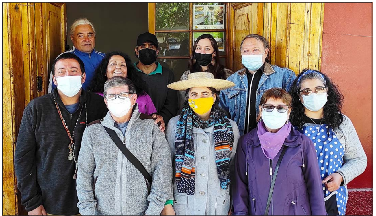
FERIA EL RASTRO.- Ellos son sólo algunos de los integrantes de Feria El Rastro Almendral, son 28 en total y llevan ya 18 años potenciando la cultura y el turismo en el Valle.