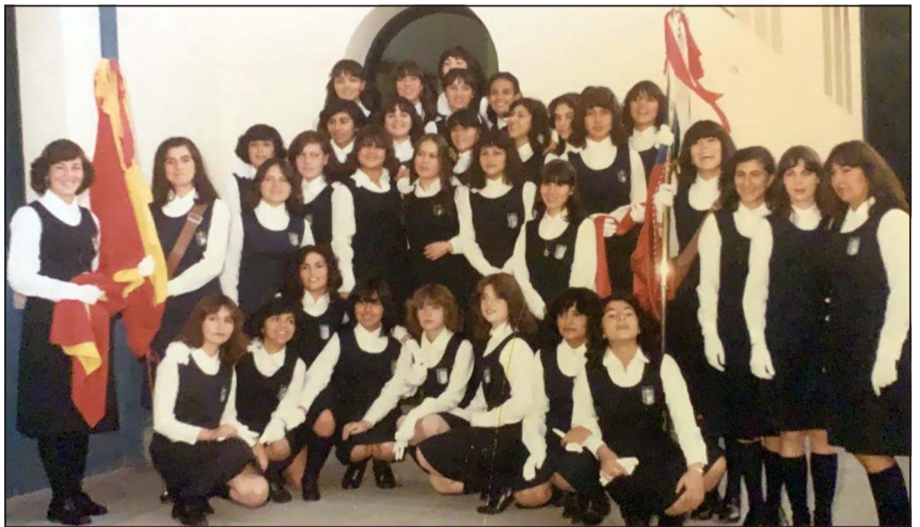
Y EL TIEMPO PASÓ.- Así lucían estas chicas cuando apenas eran lolitas en el Colegio Religiosas Carmelitas, actual Colegio Vedruna.