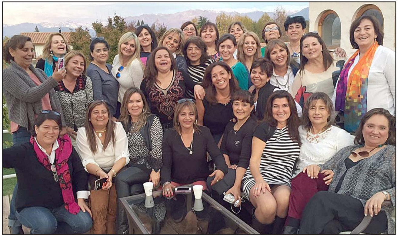
LA PANDILLA COMPLETA.- Estas damas se reencontrarán en el Club San Felipe este sábado 23 de octubre.