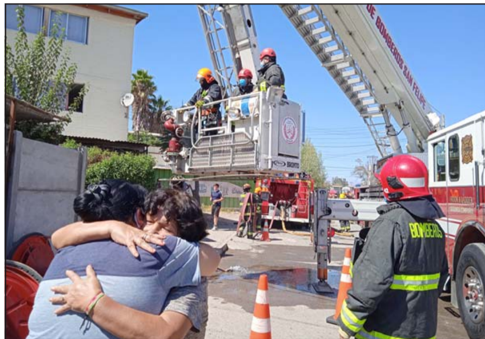
UNIDAD DE LUJO.- Gracias a la Unidad MX-2, carro a escala mecánica, ya se ha salvado varias vidas en nuestra comuna.