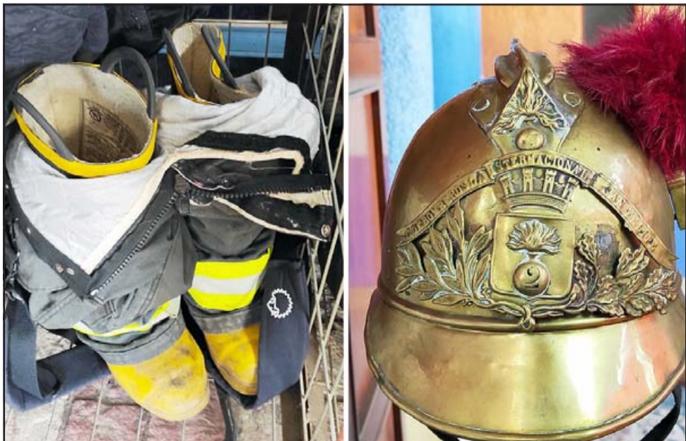
HERRAMIENTAS DE TRABAJO.- Aquí vemos 'el mono', traje bomberil con sus botas, listos para ser usados, y uno de los cascos originales de esta emblemática Compañía.