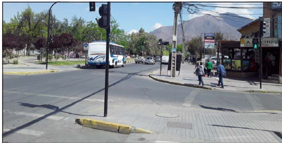
Intersección de la Avenida Yungay con Merced, donde ocurrieron los hechos este miércoles en la tarde.

- Sí, tenemos la patente, la foto del vehículo donde se ven los dos jóvenes... Uno se ve. Eso nos mandaron gente porque yo lo subí a funarlos y mucha gente mandó información, fotos de gente que sacó foto ahí en el momento. In-