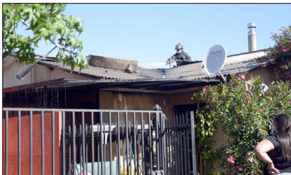
APOYEMOS TODOS.- Esta es la vivienda siniestrada, todo el pizarreño está destruido, esta familia necesita ollas, ropa de niña, alimentos, dinero, muebles y lo que corresponda.