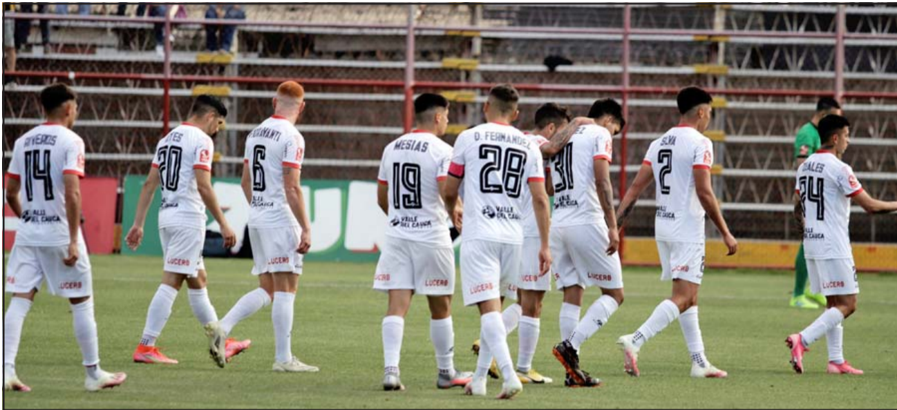
A LEVANTAR CABEZA.- El cuadro albirrojo debe sumar de a tres si quiere seguir pensando en la liguilla por el ascenso.