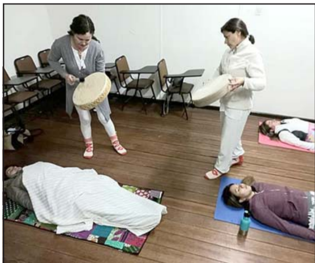
YOGA Y SONOTERAPIA.- Aquí tenemos a varias personas en su Taller de Sonoterapia y Yoga.