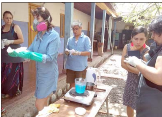
ORFEBRERÍA.- Este es el Taller de Orfebrería, hay cupos para peques y grandes.