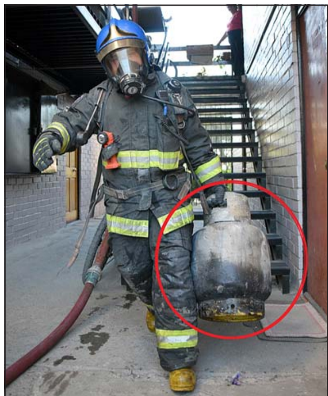
JUSTO A TIEMPO.- Las cámaras de Diario El Trabajo captan los instantes cuando estos bomberos retiran del inmueble los cilindros de gas, visiblemente afectados por el fuego.