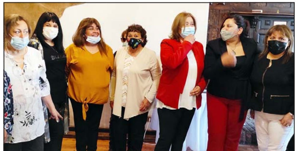
ELLAS RESPALDANDO.- Nunca antes un caballero recibió tantas atenciones y cariño de tantas damas, compañeras de trabajo que hicieron equipo para sacar adelante a diez generaciones de estudiantes en el Liceo San Felipe.