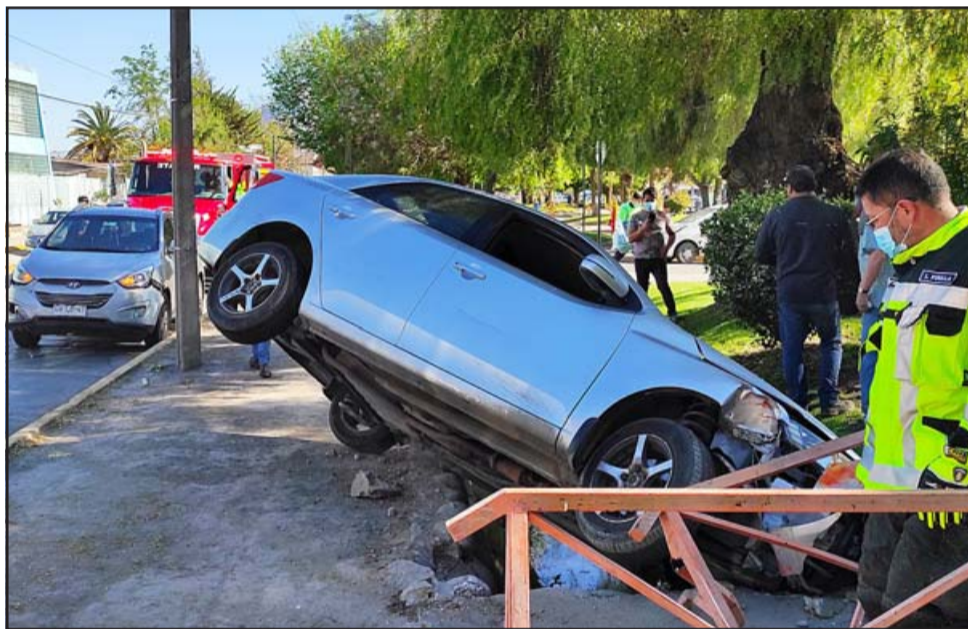
SIEMPRE BOMBEROS.- Bomberos sanfelipeños lograron rescatar a la conductora y ponerla a salvo.