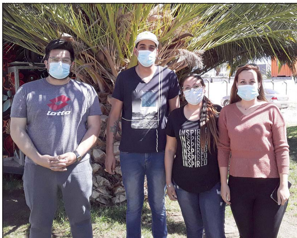
Vecinos de Avenida Chile en Villa El Canelo Uno, piden mayor presencia policial y camionetas de seguridad ciudadana.

- Sí, ya estamos súper protegidos, no puedo comentar lo que estamos dejando dentro de la casa, pero sí ya estamos tomando todas las medidas nece-