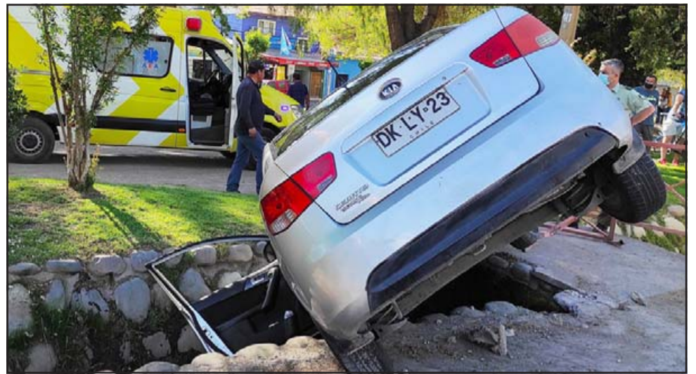
PELIGRO EN EL CANAL.- Así quedó el KIA patente DK LY 23, con su conductora dentro y sin poder salir.