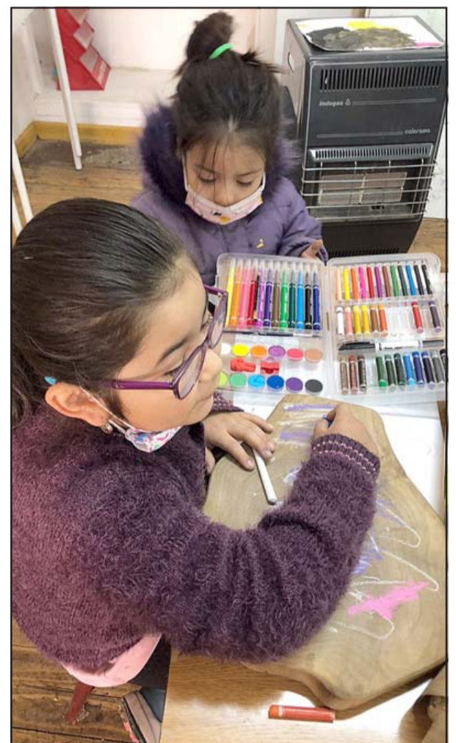
A PINTAR CHIQUILLOS.- Los más pequeños también pueden aprender a dibujar y colorear.