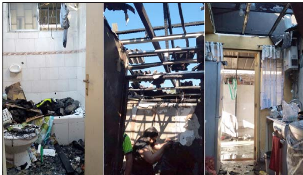
NECESITAN DE TODO.- Los daños materiales en la casa de doña Verónica son totales, dependen ahora de la solidaridad de sus vecinos y de nuestros lectores.