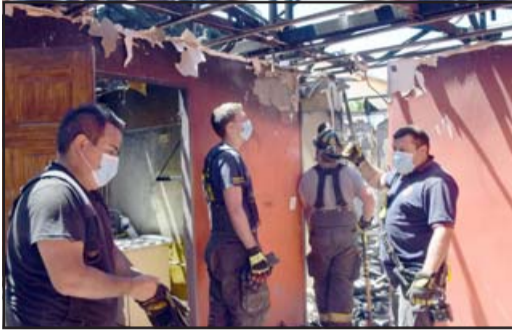
Voluntarios de la 4ª Compañía de Bomberos ayudando a la familia víctima de este incendio.