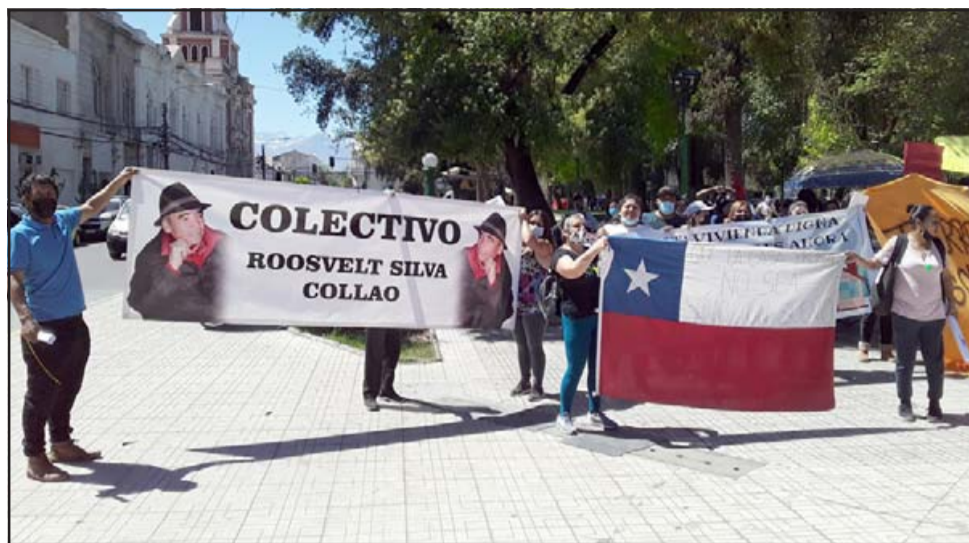
Las personas en la plaza de armas una vez terminada la manifestación frente a la municipalidad de San Felipe.

Por lo que pudimos apreciar no se produjo ningún tipo de desorden. Incluso Carabineros se retiró tranquilamente del lugar.