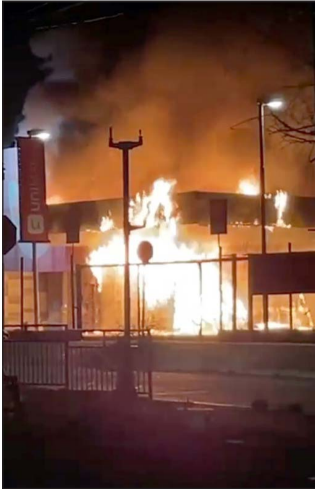
Aquí vemos la zona del supermercado Unimarc, en donde los bomberos debieron emplearse a fondo para controlar los incendios.

Varias han sido las marchas que se desarrollaron de manera pacífica por calles y avenidas tanto de Los Andes como de San Felipe, pese a ello se registraron varios ataques a la propiedad privada, por ejemplo la