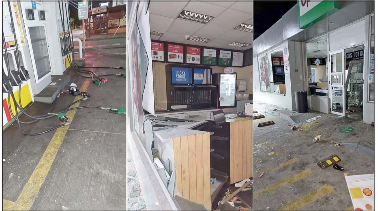
UNA FECHA TRISTEMENTE CÉLEBRE.- Aquí vemos los daños generados en la bencinera Shell de calle Merced en la ciudad de San Felipe.

lizaron unas pocas personas, mientras que la mayoría marcharon en familia y hasta con sus hijos de manera pacífica, recordando el 18-O, también remarcado como el 'Estallido Social'.