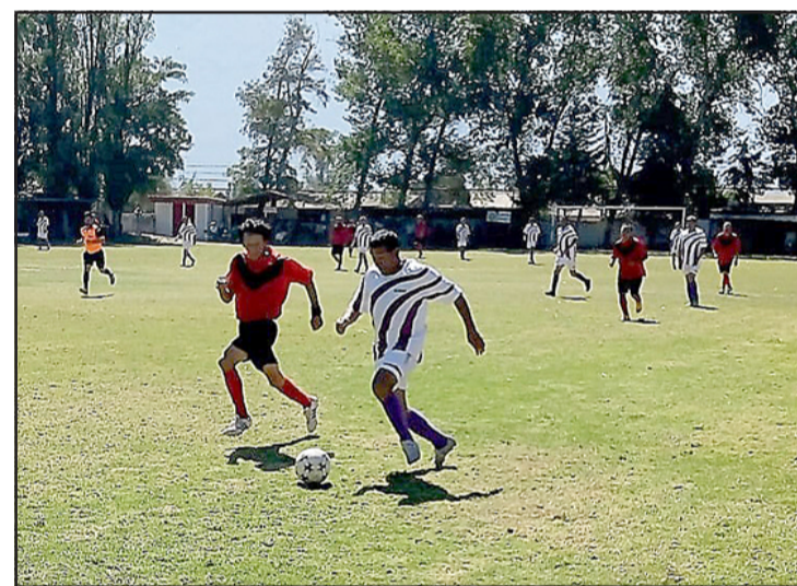
La Liga Vecinal ya comienza a preparar su retorno.

Si bien es cierto que existe un amplio consenso respecto a que se debe volver a la competencia, aún queda por dilucidar si se retomará el torneo que debió suspenderse cuando llegó la pandemia del Coronavirus Covid 19, ó si se hará el ejercicio de hacer un torneo de transición, que sirva como un ensayo general para afinar cosas importantes, como lo serán los aforos en la cancha Parrasía y el correspondiente Protocolo Sanitario que se aplicará para el retorno de una competencia que se echa de menos, que es ejemplo de camaradería y respeto deportivo.