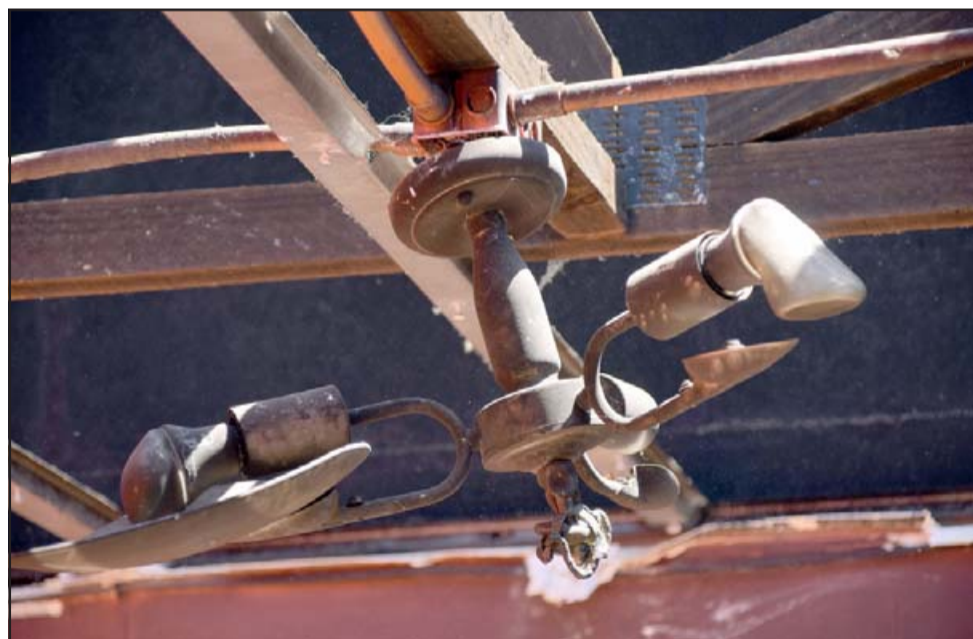
APOYEMOS TODOS.- Esta era una de las lámparas de esta familia, todo quedó inservible.

ella se ha puesto a nuestras órdenes para apoyar en lo que sea necesario, a ella también le doy las gracias.