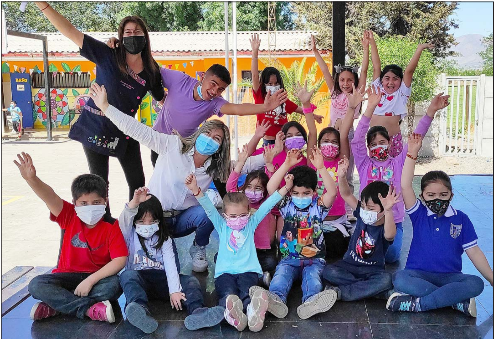
LOS DUEÑOS DE LA ESCUELA.- Estos pequeñitos ya están ensayando para las actividades de aniversario que se realizarán en su escuela esta semana.