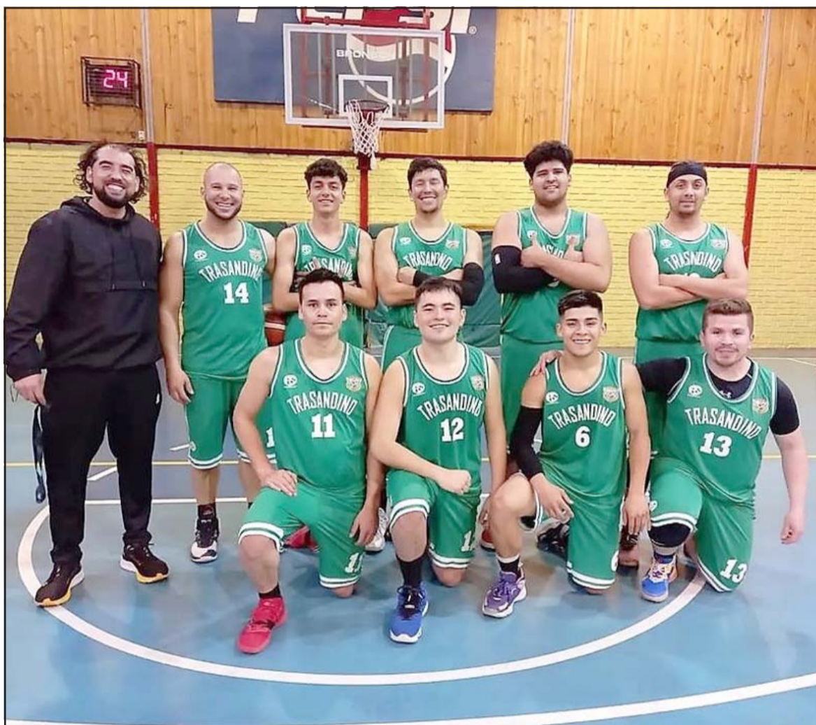
Trasandino de Los Andes fue el último conjunto en sumarse a la fase final del Transición de la ABAR.