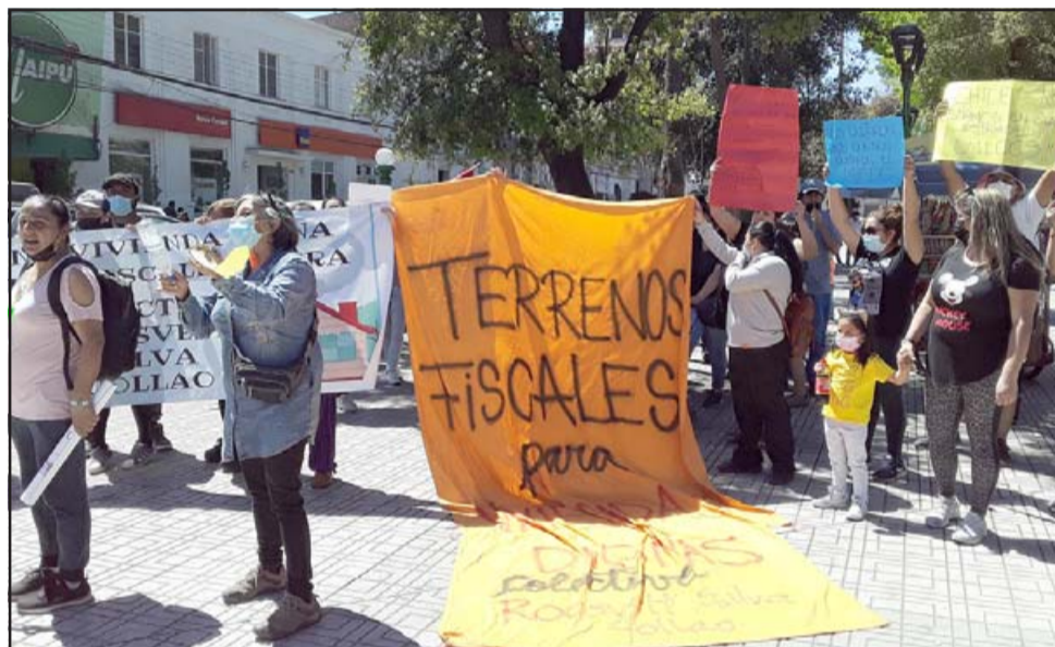
El colectivo por medio de letreros indicando que sí hay terrenos fiscales para construir viviendas.