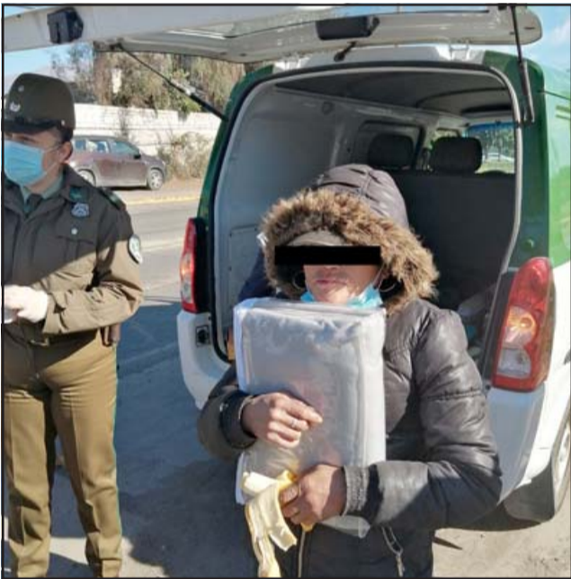
SIN FRÍO. Esta vecina recibió también cobijas para su uso personal, trabajo desarrollado entre Cruz Roja y Carabineros.