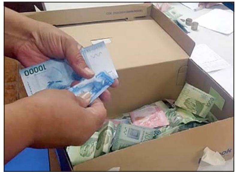
TRANSPARENCIA.- Todo el dinero fue contado en la sede vecinal, sumó $715.750, y pronto realizarán un Bingo Solidario para la misma causa.