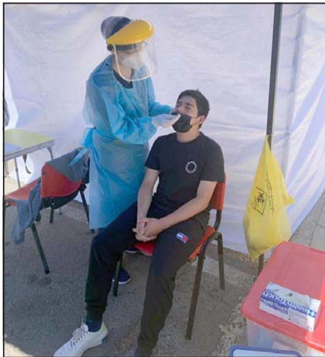
Del mismo modo se han redoblando los esfuerzos para realizar testeos diarios a funcionarios municipales y a la comunidad.