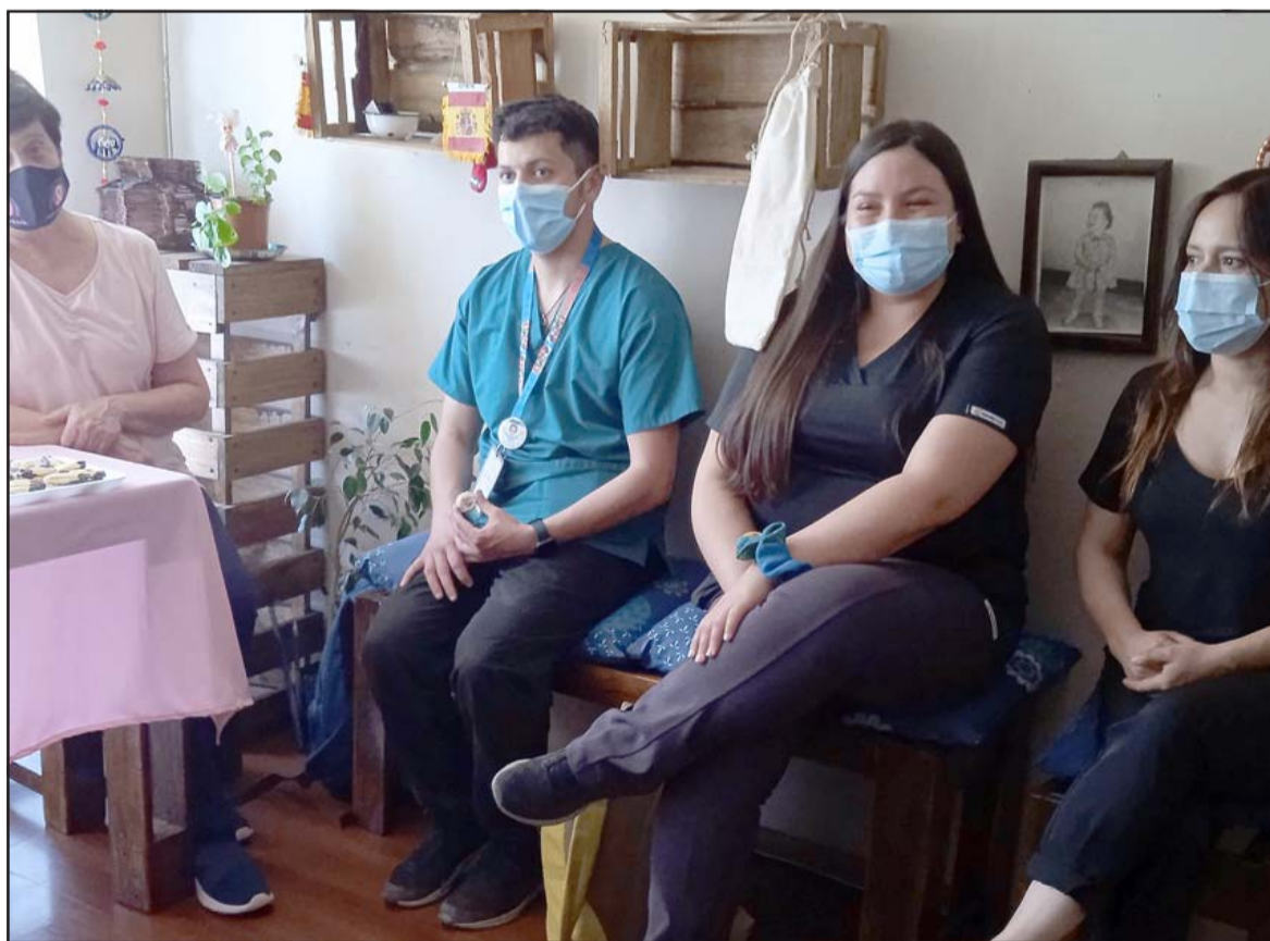
TODO SALUD.- Los temas a desarrollarse en esta emisora digital contarán con el aporte de médicos con sus programas de salud y consejos útiles para toda la familia, también se sumó un dentista, un psicólogo, psiquiatra, oncólogo y Medicina General, además de medicina naturista también.