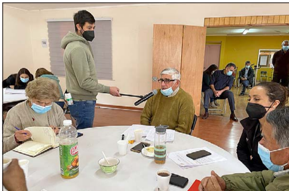
Medicamentos, seguridad, asociatividad, espacios donde poder participar y opinar, y sobre todo el mal servicio de la locomoción colectiva, fueron los principales problemas esgrimidos por los participantes.