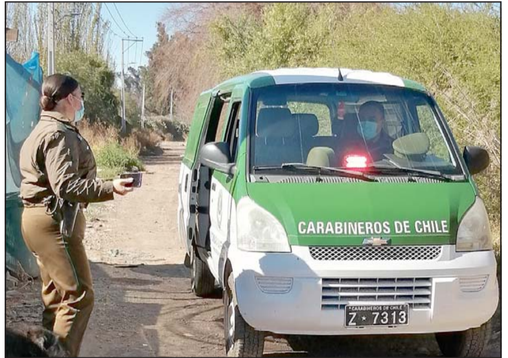
EN TERRENO. - A cada rincón de nuestra comuna la Cruz Roja y Carabineros llegan para llevar alimentos, abrigo y acompañamiento.