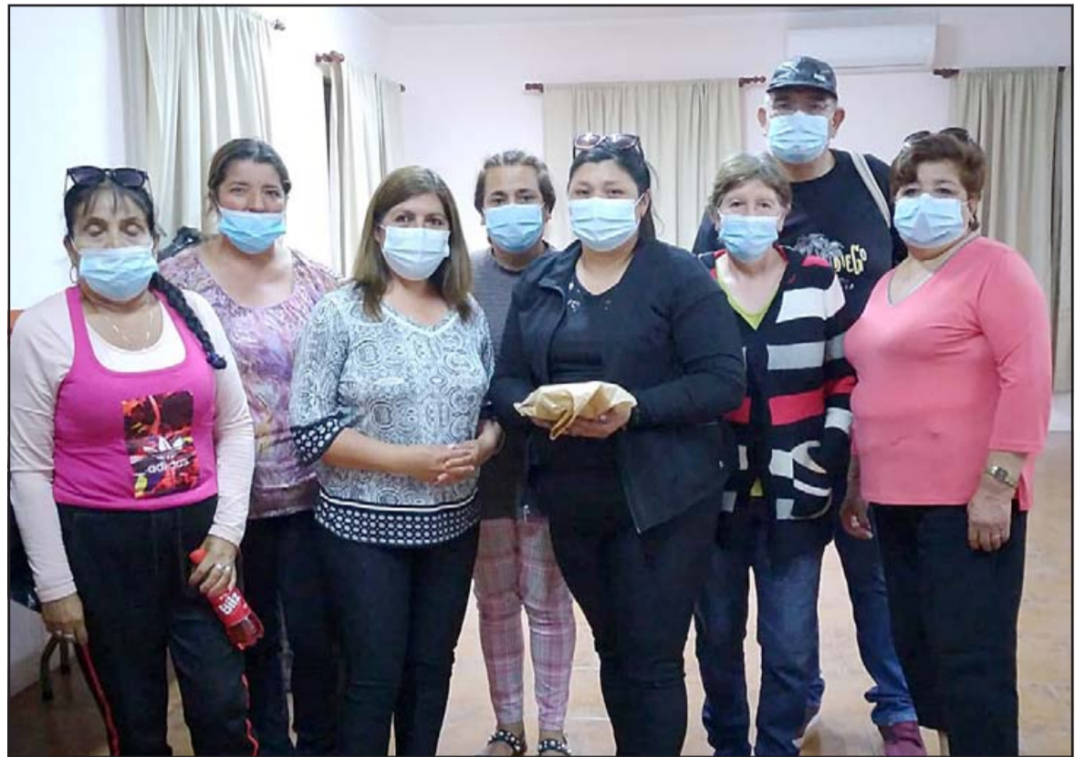
MANOS SOLIDARIAS.- Ellos son parte del voluntariado de Villa El Señorial que la tarde noche de este martes recorrieron el barrio para coleccionar dinero para esta familia.