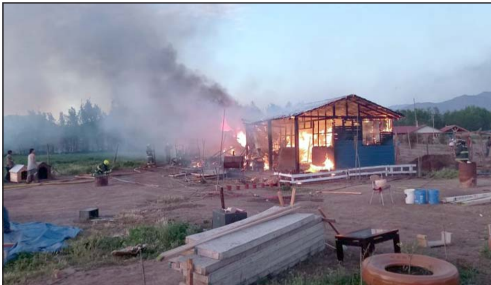
Las llamas destruyeron por completo la casa de Patricia Muñoz el pasado lunes 11 de octubre.

El cartón tiene un valor de 2 mil pesos y se pueden comprar por teléfono celular al número +56 9 8320 2690. Patricia Muñoz.