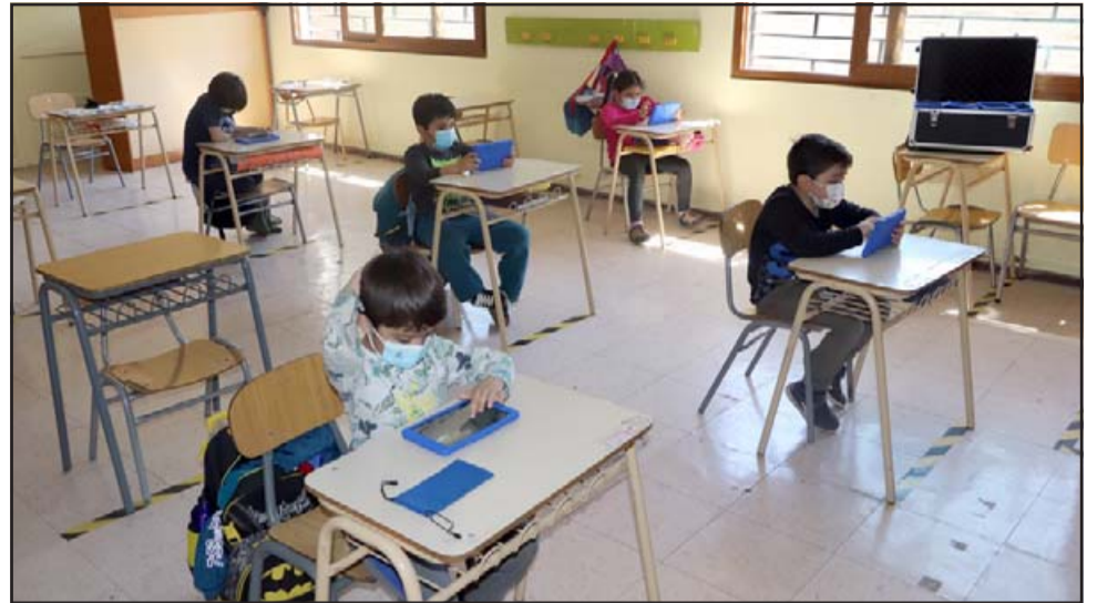
El municipio de Panquehue ha incrementado las medidas preventivas para evitar los contagios, como por ejemplo en los colegios, donde las clases presenciales se siguen desarrollando en forma parcial.

«Se están tomando todas las medidas preventivas, se están incorporando planes de trabajo, la sanitización se realiza en los colegios, por lo tanto, estamos entregando la seguridad necesaria a nuestros alumnos como a los con-