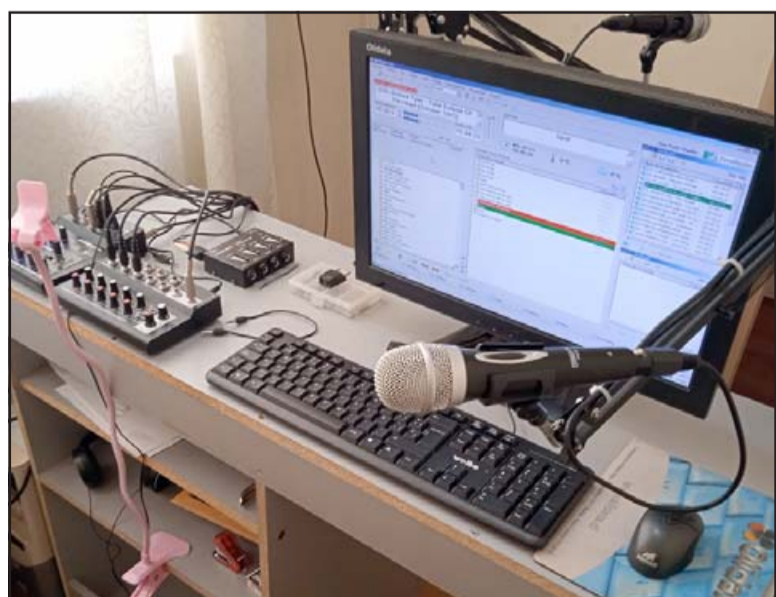
PASO A PASO.- Este es el equipo con el que inicia sus transmisiones Radio Ser Feliz, con el tiempo se irá agregando más equipo técnico.