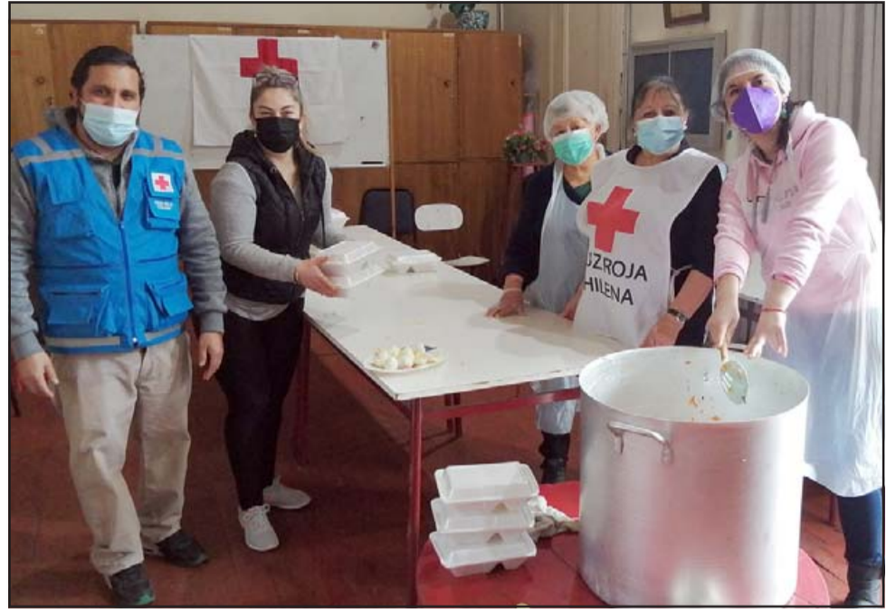
OLLA COMÚN. - Ellos son voluntarios de la Cruz Roja San Felipe, preparando las colaciones de la Olla Común que funciona los sábados en la sede.