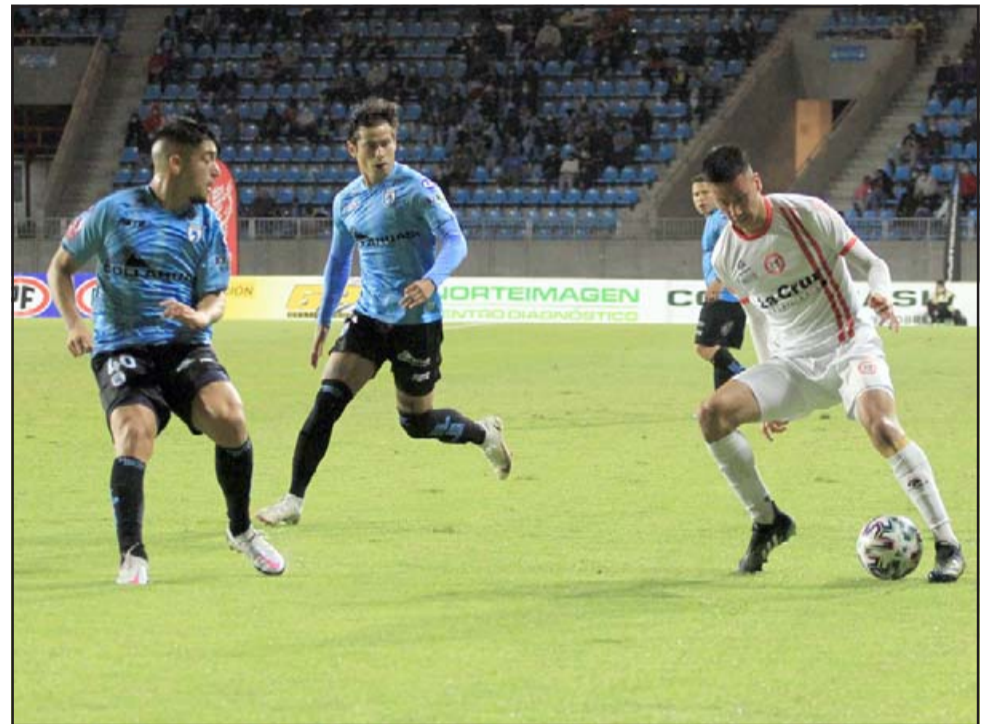
Tras caer por la mínima con Iquique, el Uní Uní tiene mínimas chances de llegar a la liguilla.