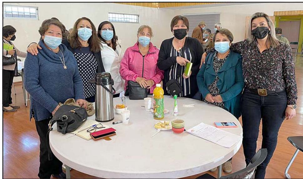
A la cita acudieron cerca de 50 dirigentes, quienes dieron a conocer cuáles son las principales inquietudes que aquejan a este grupo etario y de qué forma la comuna puede resultar más acogedora y empática con ellos.

«Esto ha sido muy importante porque exponemos nuestros temas, nadie nos dijo qué debíamos decir, está bien que haya varias propuestas porque muchas coincidieron, pero tampoco se le puede exigir tanto a la alcaldesa por-