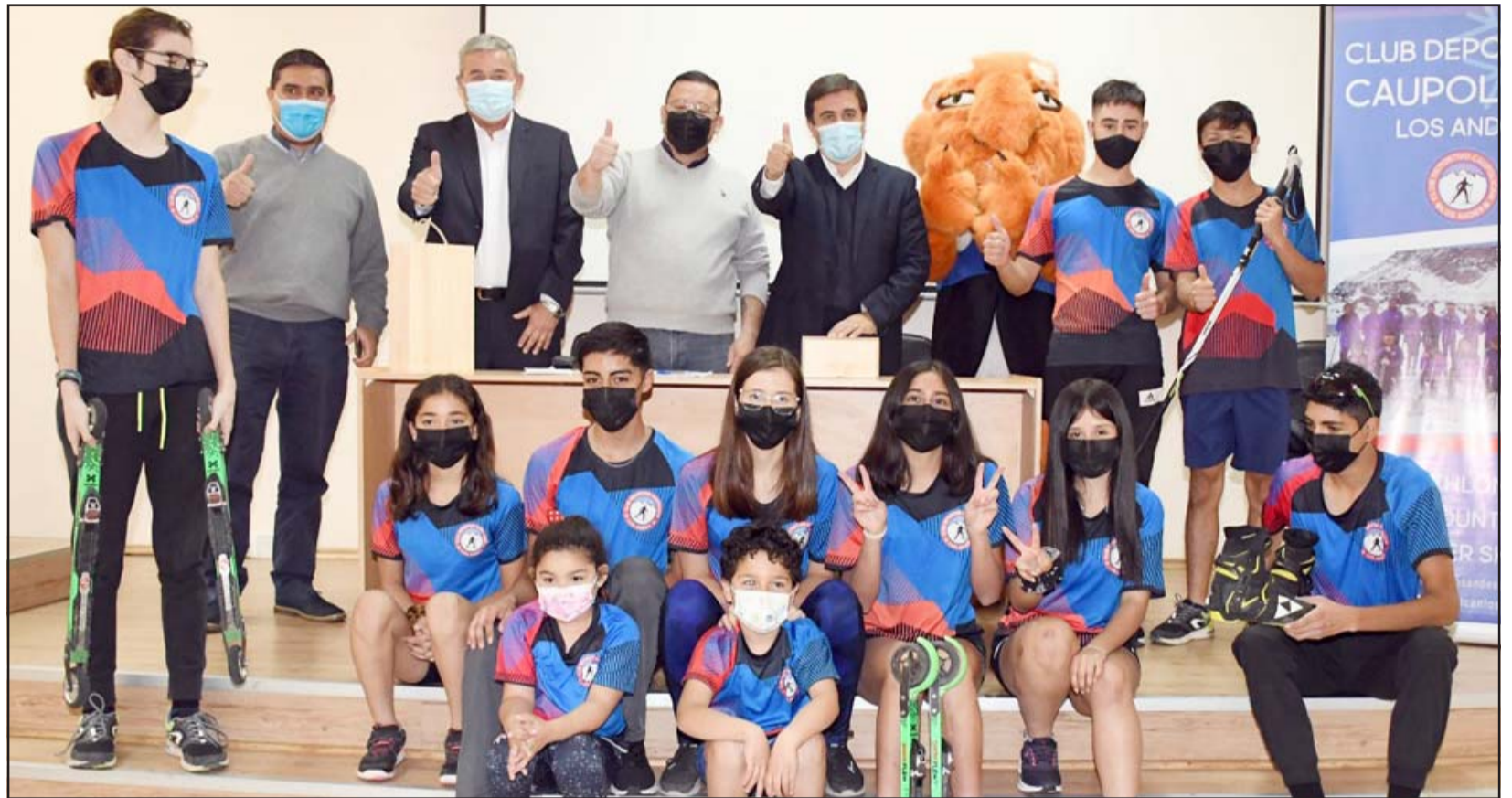
En sus últimas horas en Los Andes, la delegación participó de una despedida organizada por la Municipalidad de Los Andes a través de su Corporación Municipal de Deportes.