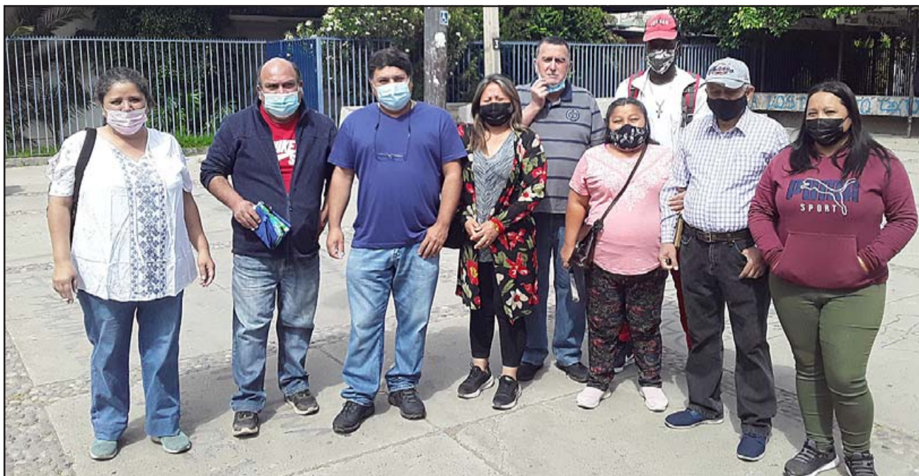
Los ex trabajadores de parquímetros reunidos en la Plaza Cívica de San Felipe.

- No, nosotros la otra vez tuvimos una reunión con la municipalidad, con el administrador, pero lo que pasa