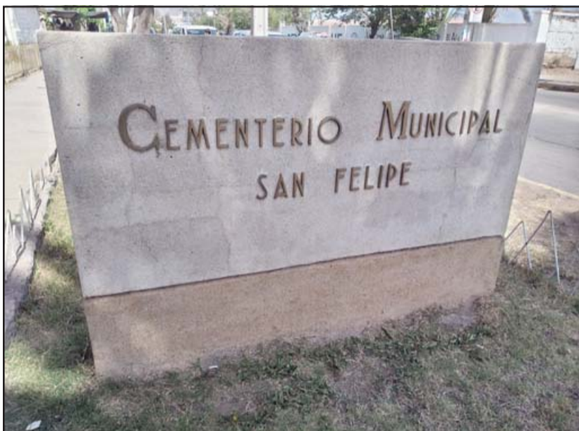
Tradicional 'Misa de la Luz' se llevará a cabo el domingo 31 del presente a partir de las 21:00 horas en el Cementerio Municipal.

haber coordinación con Carabineros para el estacionamiento y no entorpecer el tránsito».