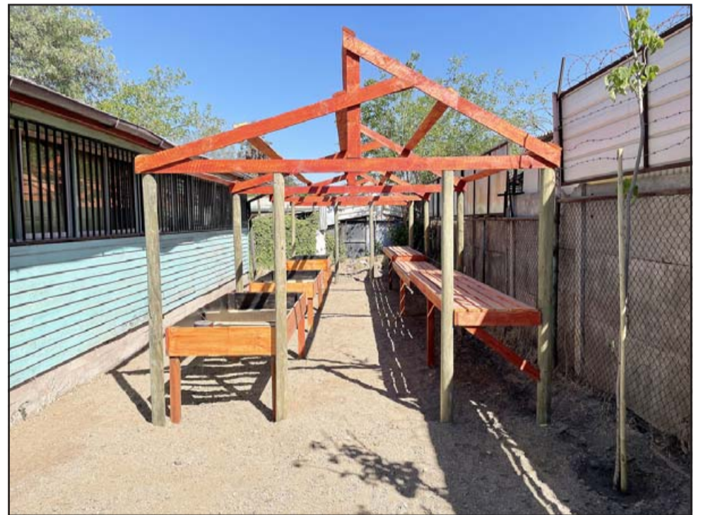
En plena construcción se encuentra el invernadero, el que está adaptado para niños y niñas con dificultades de desplazamiento.

Enfocado en la temática ‘Mis Residuos, mi responsabilidad’, el proyecto pretende que tanto estudiantes como cuerpo docente, aprendan a trabajar en torno al buen manejo y la reutilización de materiales derivados del hogar.