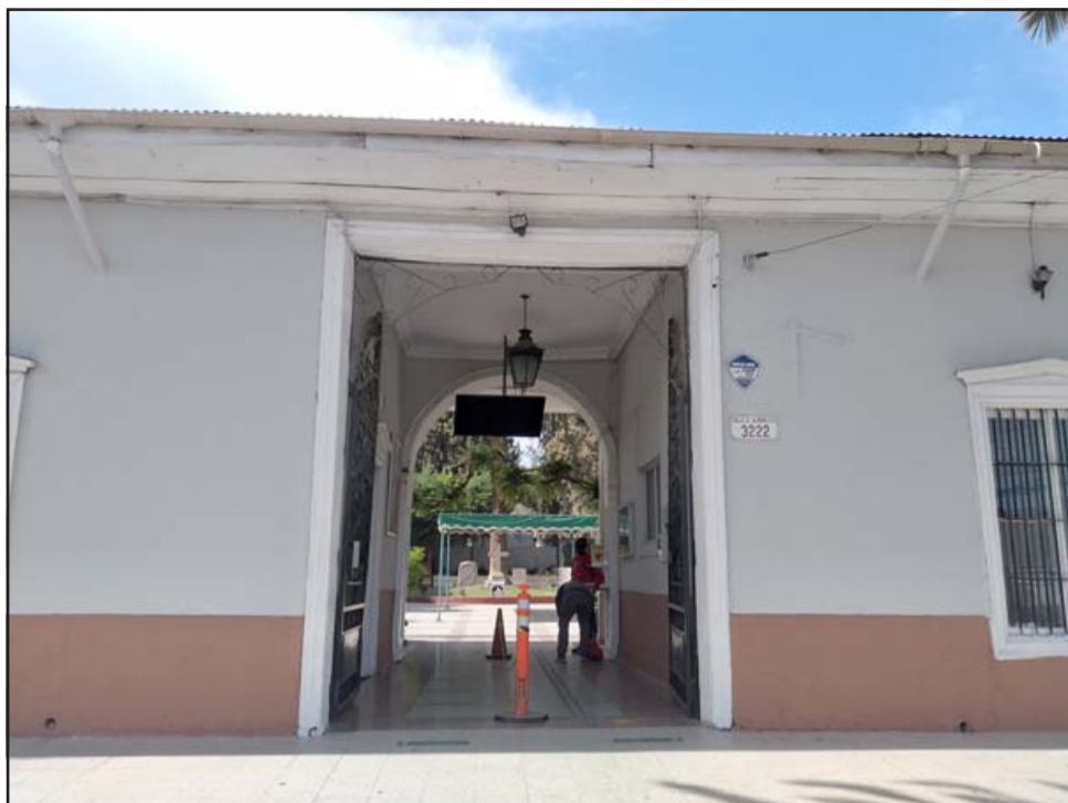
El Cementerio Municipal abrirá sus puertas desde las 7:00 y hasta las 19:00 horas este lunes 1 de noviembre.

Consultada si habrá corte para el tránsito vehicular en el sector de la rotonda Miraflores, la alcaldesa aseguró que «más que el cierre de la calle que se ve dificultado porque entendemos que tiene que transitar locomoción, va a