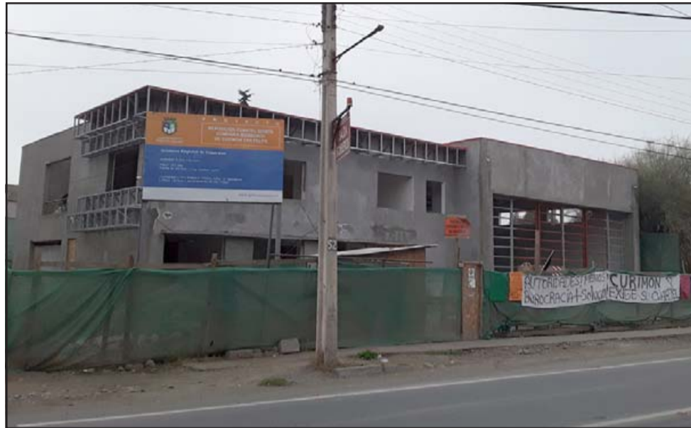
Así luce actualmente el cuartel de la Quinta Compañía del Cuerpo de Bomberos de Curimón.

«Ese proyecto quedó paralizado en la administración anterior en el año 2020, no lo volvieron a potenciar el 2021 y quedó paralizado por malas gestiones», finalizó.