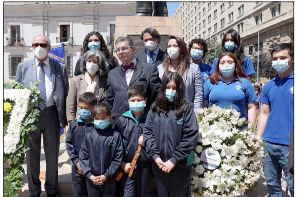
La alcaldesa de Calle Larga junto a una delegación de estudiantes del Liceo y de la Escuela Pedro Aguirre Cerda, entregaron una ofrenda floral en este homenaje al ex mandatario callelarguino.

«Estar en esta importante fecha frente a La Moneda tiene gran relevancia. Este ha sido un homenaje muy bonito que mira la perspectiva histórica de