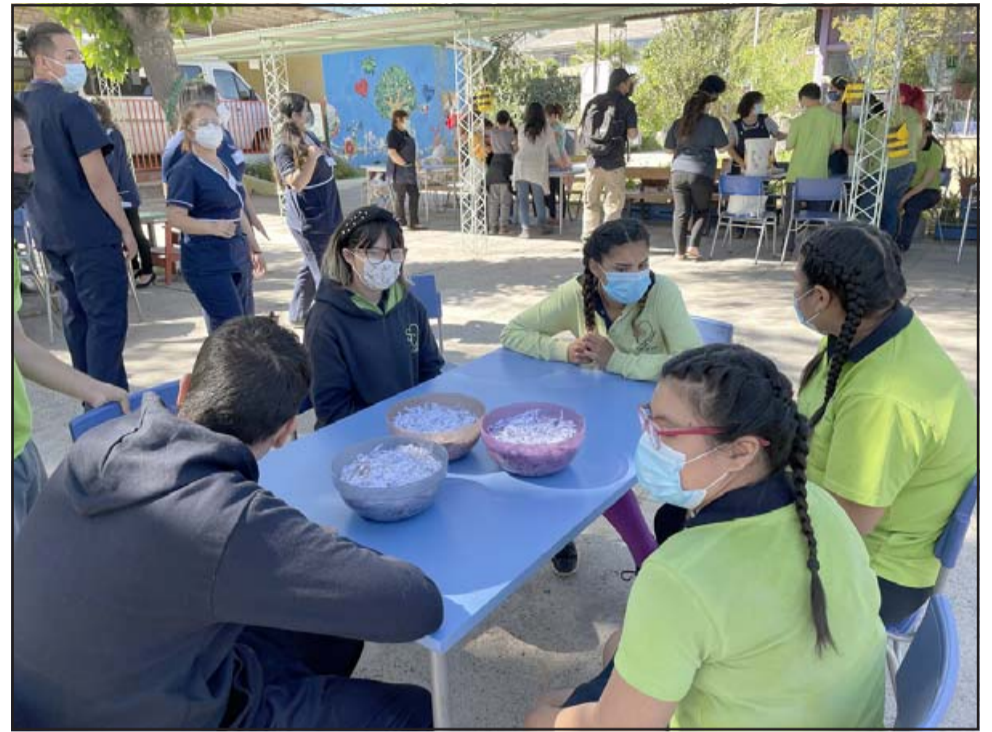
El establecimiento se encuentra impartiendo talleres de Educación Ambiental, Reciclaje y Técnicas de Cultivo, como parte del proyecto de ‘Invernadero Inclusivo’.

La directora del establecimiento agregó que el invernadero podría estar terminado la próxima semana, mientras que la ejecución de los talleres se extiende hasta el mes de noviembre.