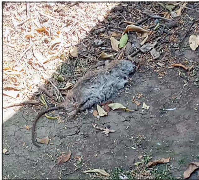
En la imagen, que se ha hecho recurrente en el sector, se puede divisar un roedor muerto en población Yungay.

una plaga que no hallaban para dónde tirarse y quedó aterrorizada la gente, más encima los niños. Más encima saliendo de las tazas del baño, que uno va a sentarse y el guarén que lo está esperando para que muerda los genitales, hay que hablarlo así. Con una mordida lo perjudica a usted nomás.