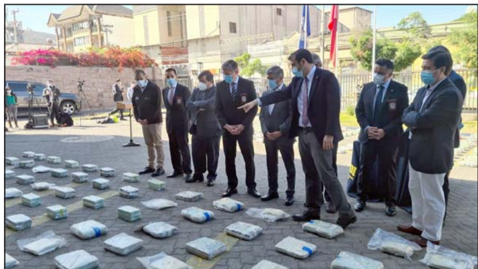
Autoridades nacionales y locales dan cuenta del gran operativo de la PDI de Los Andes.