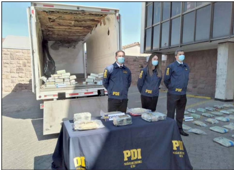
Un duro golpe al narcotráfico a nivel nacional dio la Brigada Antinarcóticos y Contra el Crimen Organizado ( Brianco ) de la Policía de Investigaciones de Los Andes.