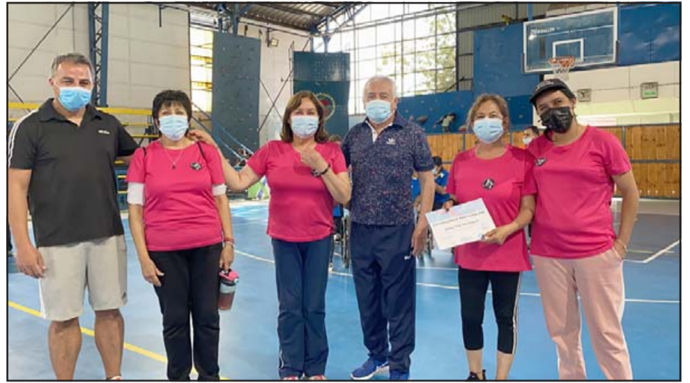
Ellos son los representantes del equipo 'Adultos Mejores' que también participó del torneo amistoso realizado recientemente.