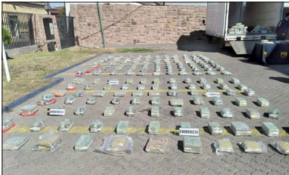
Setecientos cincuenta kilos de marihuana 'Cripy' fueron incautados por la Brianco de la PDI de Los Andes.

La marihuana tipo 'Cripy' es una especie de la cannabis que se cultiva y genera en Colombia, por lo que tanto la PDI como la Fiscalía de Los Andes, trabajan para esclarecer por dónde ingresó esta gran cantidad de sustancia ilícita y quién o quiénes son los responsables de este acto.