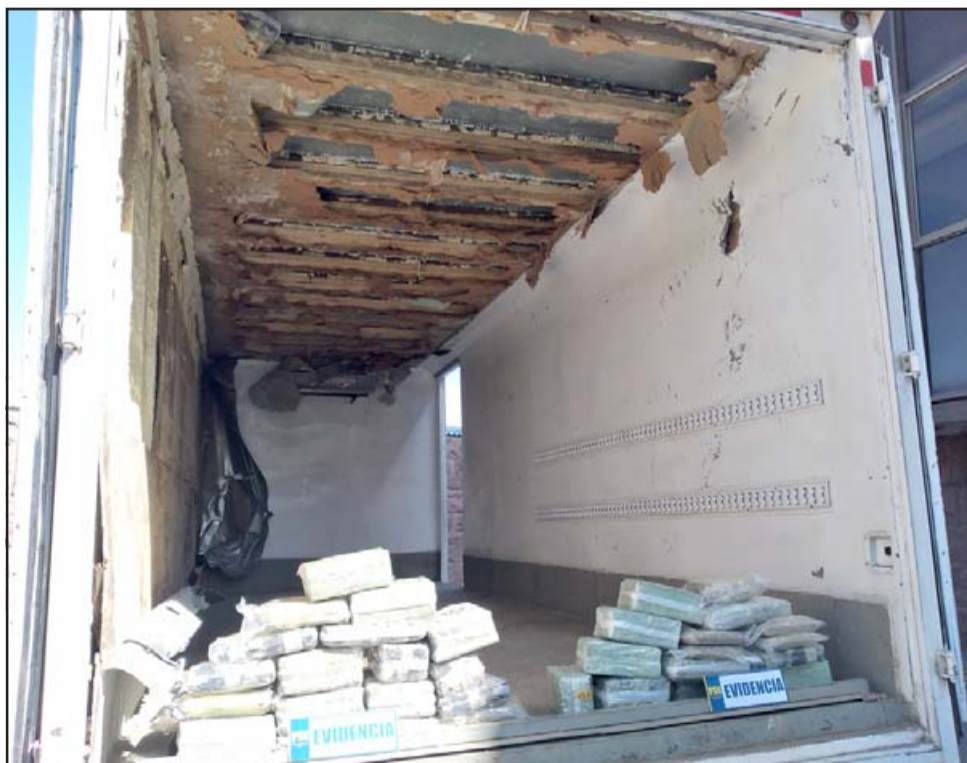
Ocultas en el cielo y en las paredes del camión venía más de media tonelada de droga.