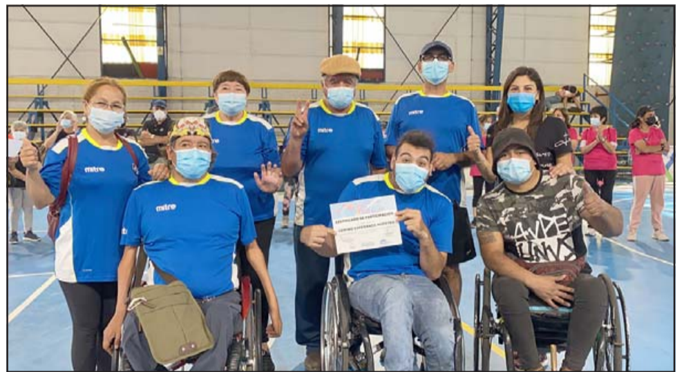
El equipo de Esperanza Nuestra, otro de los animadores del amistoso preparatorio para el comunal que se realizará en noviembre.

marse a clases y talleres de esta disciplina, pueden acercarse al Gimnasio Centenario, los días martes y jueves desde las 14:30 horas.