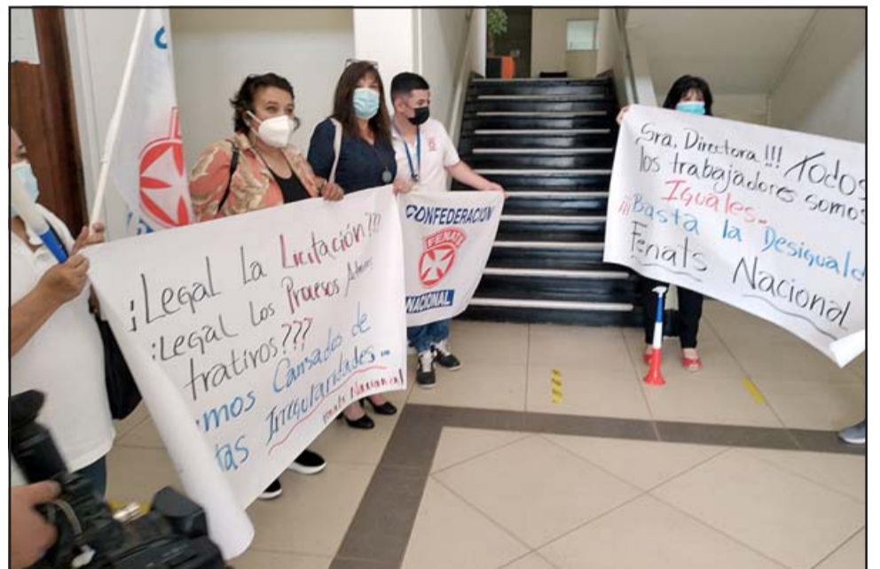
Los funcionarios están pidiendo la anulación de la licitación para la mantención del área de cuidado infantil del Cefsam San Felipe El Real.