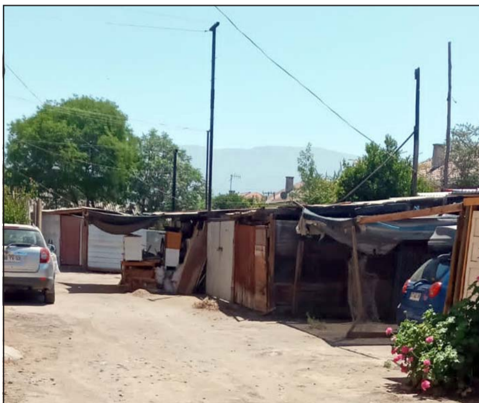
Estos son los cuartos donde presuntamente se origina el problema de la presencia de roedores.