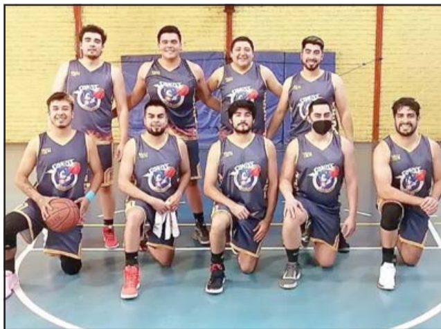
Los equipos del Sonics y San Felipe Basket definirán al nuevo campeón de los cestos locales.

La jornada partirá a las cuatro de la tarde con el pleito por el tercer lugar entre el Mixto y Trasandino de Los Andes. Inmediatamente culminado ese encuentro vendrá el turno del partido más importante de todo el certamen y en que serán protagonistas los dos mejores equipos de toda la temporada.