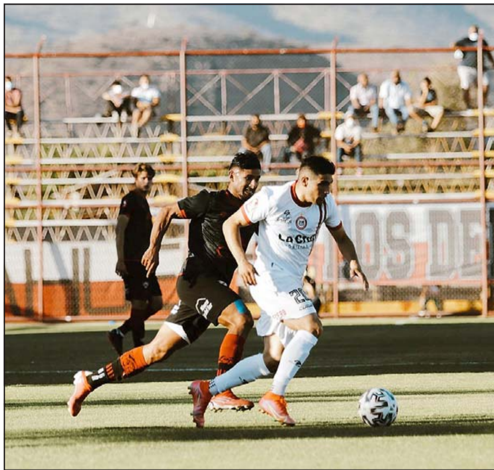
Unión San Felipe jugará el lunes uno de sus últimos partidos de la temporada.

Domingo 31 de octubre 15:30 horas: Fernández Vial – Puerto Montt 16:00 horas: San Mar-