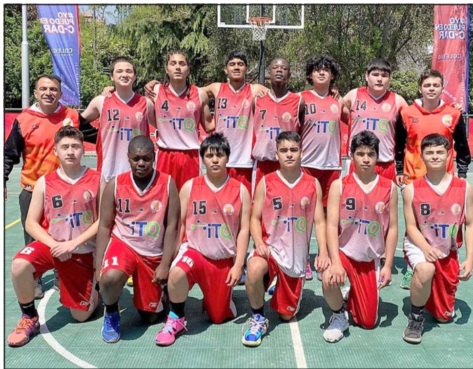
Tres equipos de San Felipe Basket y uno del Árabe serán parte de un evento cestero muy importante en la capital.

Grupo C: Universidad Católica, Alma Azul, Estudiante de Santiago, Alemán de Concepción