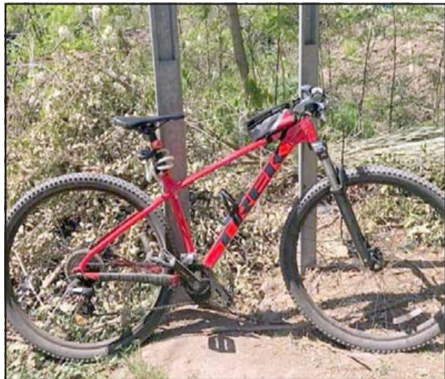
La bicicleta Trek robada fue adquirida en 500 mil pesos, pero su valor actual es de alrededor de 600 a 700 mil pesos.

En caso que alguno de nuestros lectores sepa algo, se puede comunicar al celular 9 90002006, con Alanis.