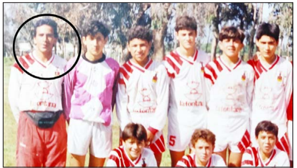
MISIÓN CUMPLIDA.- Aquí lo vemos con las ligas menores del Uní San Felipe, entregando a los jóvenes sus conocimientos, cariño y dedicación.

pude servir a los demás, guiar a los niños de aquella época, encaminarlos a los