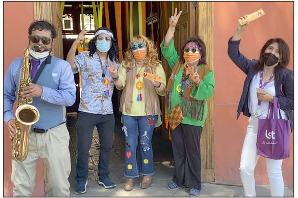
A TODO DAR.- Ellos son funcionarios municipales de San Esteban, quienes fueron regalados por personal del IST en su día.