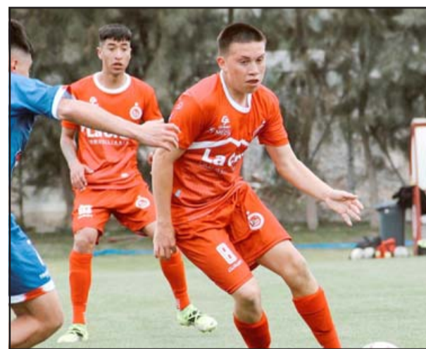
PROMESAS ALBIRROJAS.- Este sábado se definirán los dieciseisavos de final en el torneo de Fútbol Joven de la ANFP.

y por lo mismo decisivos entre las series juveniles de Unión San Felipe y Cobresal, se jugarán durante la jornada sabatina en los siguientes horarios.