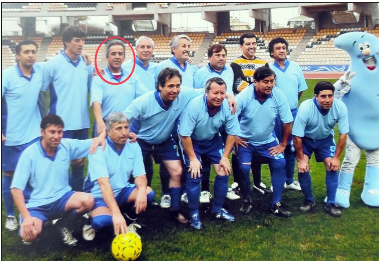
AMANTE DEL FÚTBOL.- Aquí lo vemos con el equipo de fútbol de la sanitaria para la que laboró durante casi medio siglo.

ARRIENDO OFICINAS CON ESTACIONAMIENTO INCLUIDO