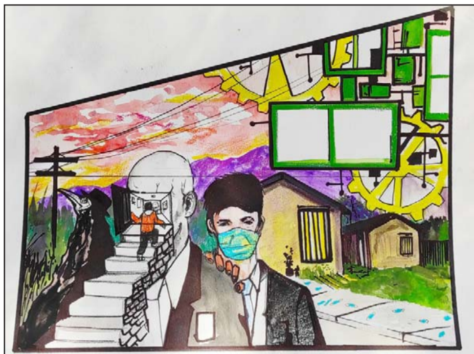
HUELLAS PARA EXPRESAR. - Este es el boceto del mural que están creando tanto los estudiantes que dibujaron con apoyo y guía de muralistas profesionales del Muros Flotantes.

Departamento de Orientación, pues sabemos que todos los niños han tenido vivencias fuertes en estos dos años y hemos tenido muy poco espacio para conversar y para que ellos se expresen. Así que fue una manera de darles un espacio para expresarse y esa expresión va a ser un mural que va a quedar en la escuela como testimonio de esa experiencia, de esa vivencia, de esas emociones que ellos vivieron durante la pandemia, y el próximo año probablemente vamos a llevar a distintos cursos a conversar frente al mu-