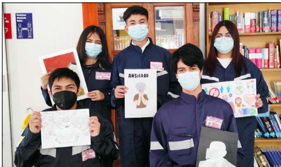
JÓVENES ARTISTAS. - Estos jóvenes son varios de quienes lograron crear la base para el gran mural de la pandemia.

ral, y que así todos los alumnos nos cuenten cómo lo vivieron ellos», comentó Vargas a Diario El Trabajo .