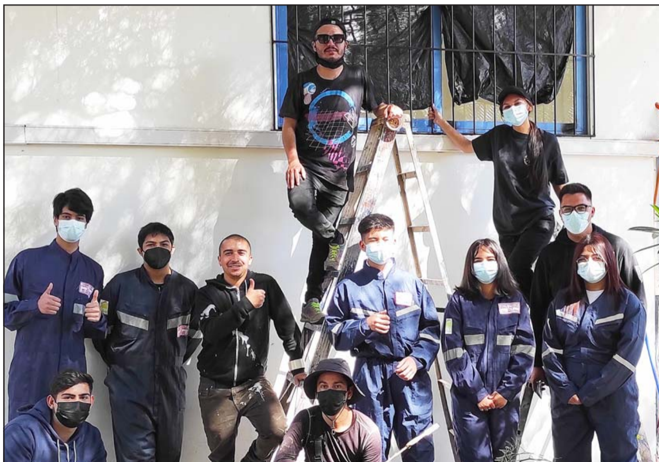
MURAL EN DESARROLLO. - Ellos son los muralistas sanfelipeños y algunos de los estudiantes que ganaron el concurso de dibujo.