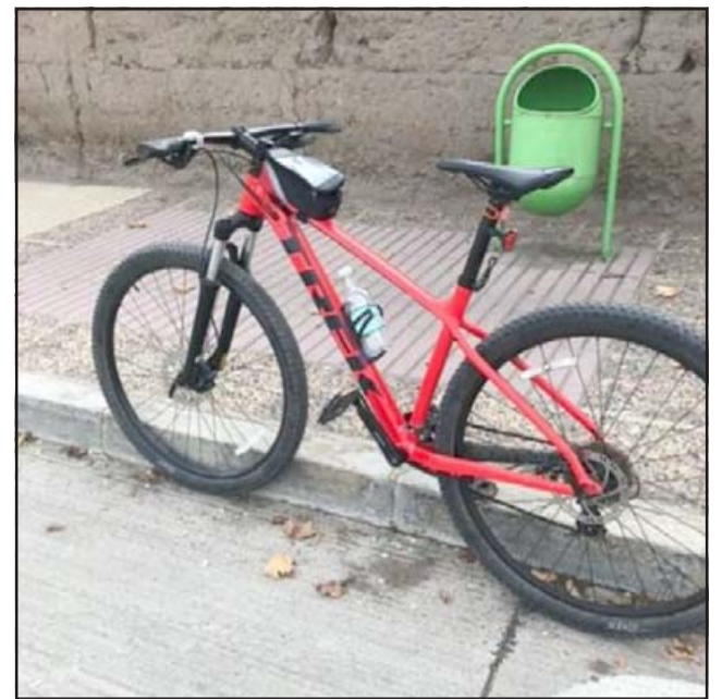
Acá la bicicleta que robaron el martes en la mañana en Almendral Bajo.

- Sí, está hecha la denuncia, ya me llamó fiscalía para ver si aportaba más datos, si sabía más información también. Así es que tengo que acercarme a fiscalía a dar más datos, las grabaciones, todas esas co-