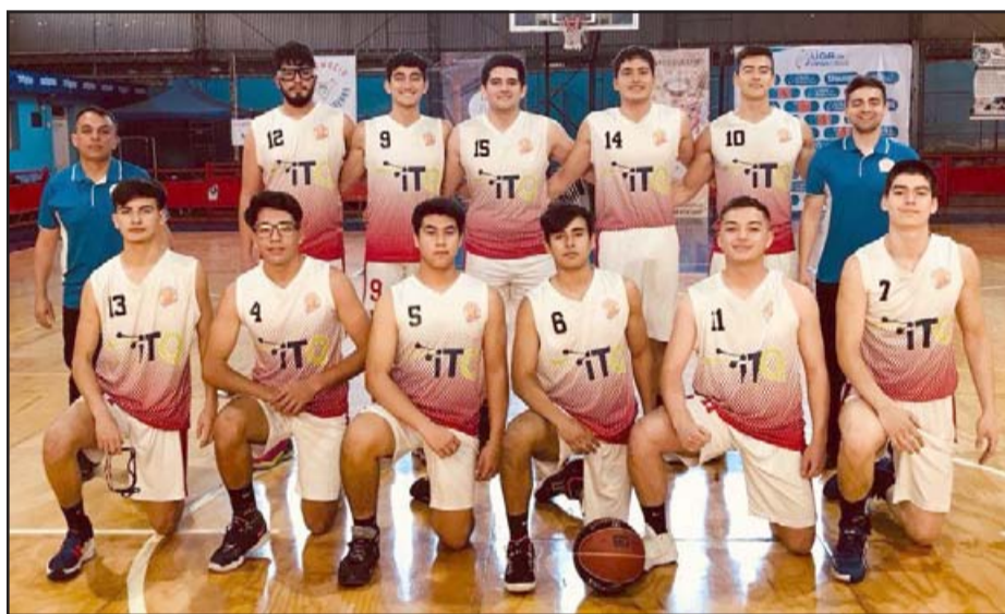
El representativo de San Felipe Basket dominó su grupo en la primera fase de la Liga de Desarrollo.

10:00 horas: Unión San Felipe – Coquimbo Unido