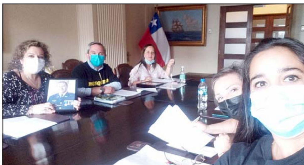
Familias de algunos fallecidos al interior del Ministerio de Defensa este miércoles en la tarde.

- Claro, lo que pasa es que el 28 de enero del 2020 al ministro Espina también nosotros le exigimos que