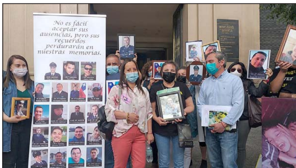
Familiares de los fallecidos afuera del Ministerio de Defensa hasta donde llegaron a reunirse con el ministro Prokurica.

Reitera que las familias están muy unidas y que la causa penal continúa.