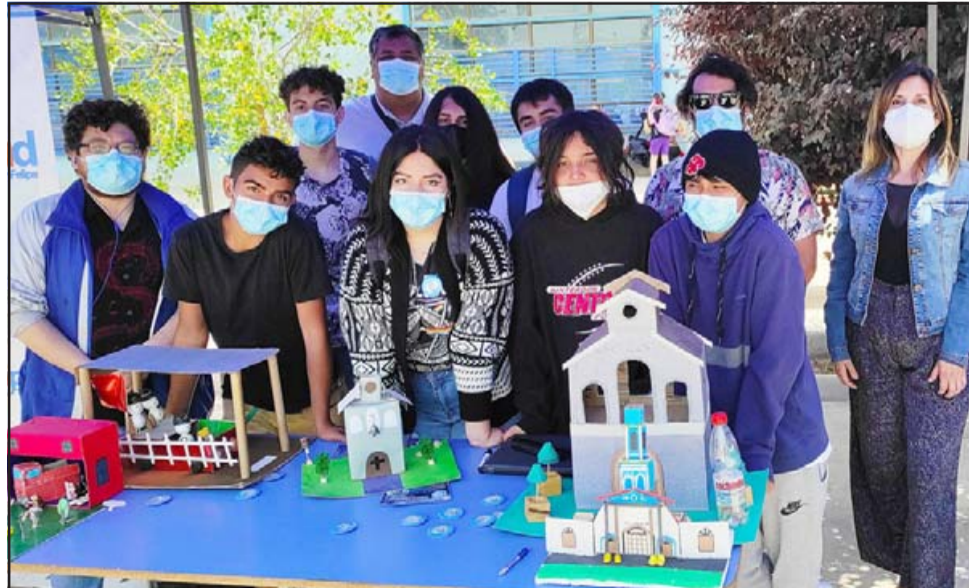
ESCUELAS INVITADAS. - Acá tenemos a estudiantes y profesores de la Escuela Artística El Tambo, participando con sus iniciativas.