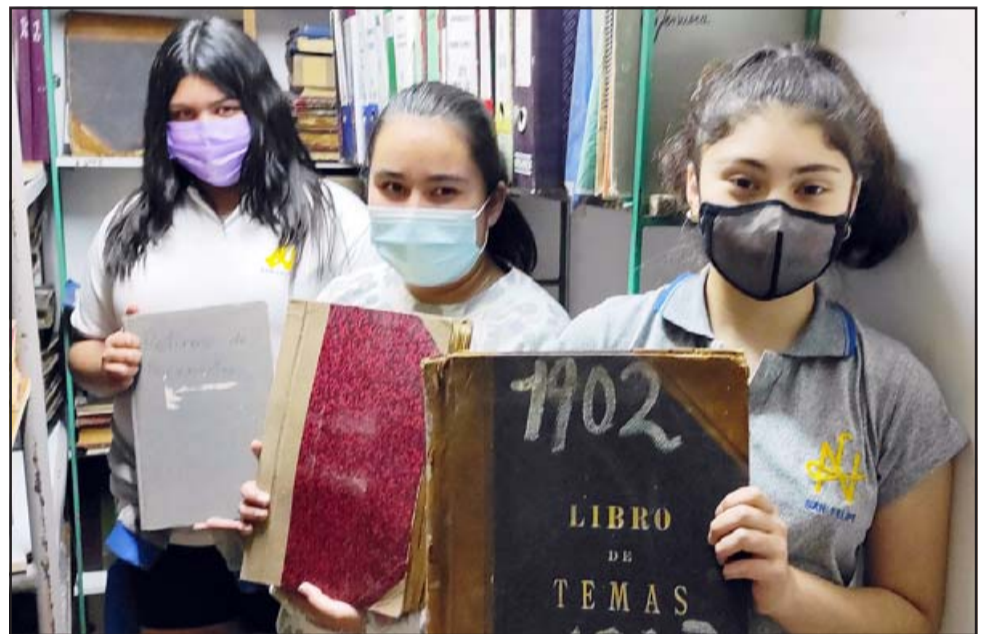
ELLAS AL FRENTE. - Acá las vemos en el archivo del Liceo Bicentenario Corina Urbina, en San Felipe, nos muestran algunos documentos históricos.