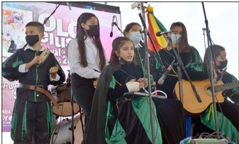
PRECIOSA ESTUDIANTINA. - Ellos son los integrantes de La Estudiantina de la Escuela Mateo Cokljat, de Tierras Blancas, quienes alegraron musicalmente el festival.