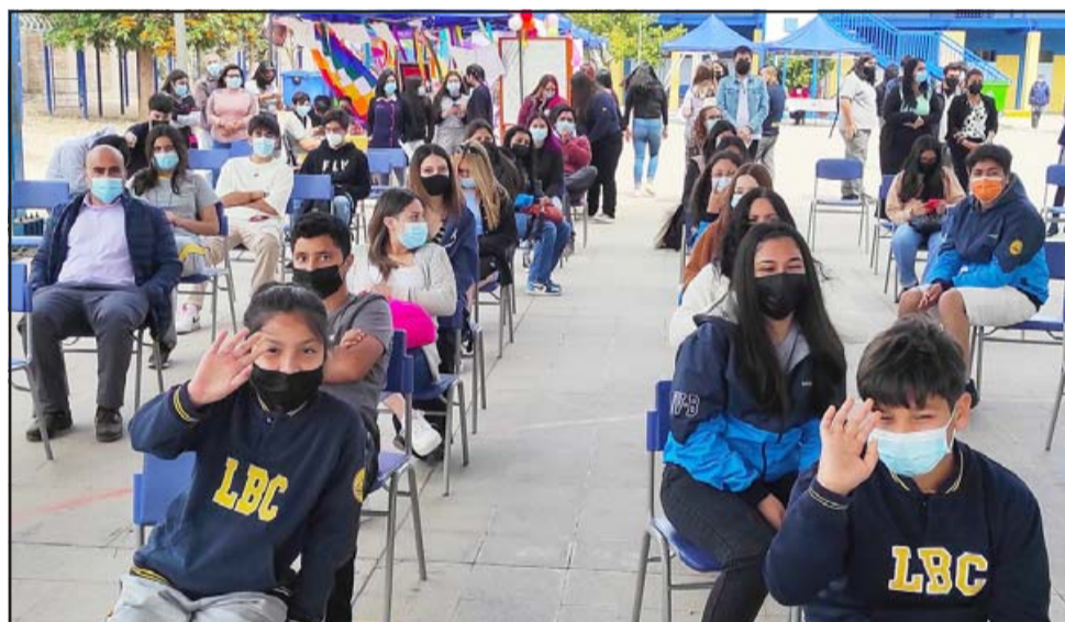
AFORO ABIERTO. - Aquellos que no participaron, apoyaron con entusiasmo a sus artistas favoritos.