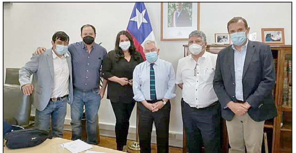
El parlamentario junto a dirigentes sociales se reunió con el ministro Enrique Paris en Santiago para hacerle ver esta necesidad imperiosa de contar con una sala de quimioterapia en el Valle del Aconcagua.

A su vez, el parlamentario agradeció doblemente al ministro Paris, ya que por un lado siempre se mostró dispuesto a resolver favorablemente la solicitud de la sala de quimioterapia para Aconcagua, y por otro, por sumarse al trabajo que él ha liderado para revisar la situación medioambiental de Catemu y observar las posibles consecuencias para la salud de los vecinos.