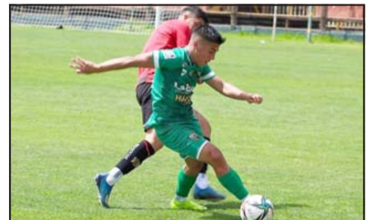
Trasandino abrirá los cuartos de final del torneo A de la Tercera División.

El encuentro quedó agendado para las siete y media de la tarde de hoy, y es muy claro que si los andinos quieren optar a seguir soñando con volver al profesionalismo, tendrán la obligación de ganar para