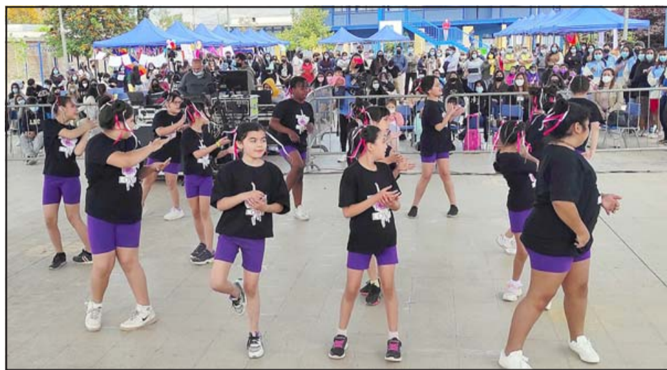
VUELVEN A BRILLAR. - Ellas se robaron el corazón y aplausos del público, bailaron con alegría y se lucieron en grande.

conjunto con el Liceo, por lo cual obviamente es un trabajo en conjunto de traer la producción y obviamente también los grupos artísticos», comentó Lobos.