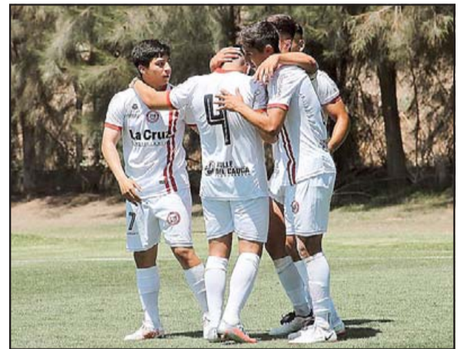
El cuadro juvenil del Uní Uní tiene una gran posibilidad de seguir avanzando en el torneo de Fútbol Joven.

El estratega se mostró muy satisfecho y conforme por lo que vienen haciendo sus dirigidos, que hasta ahora vienen exhibiendo un gran nivel en el juego, lo que se está reflejando en una gran campaña: «Esperábamos mantener frente a Cobresal el buen rendimiento que habíamos tenido en la fase regular; fue una llave difícil en la que pudimos marcar diferencias al concretar las ocasiones que nos creamos y el gran compromiso defensi-