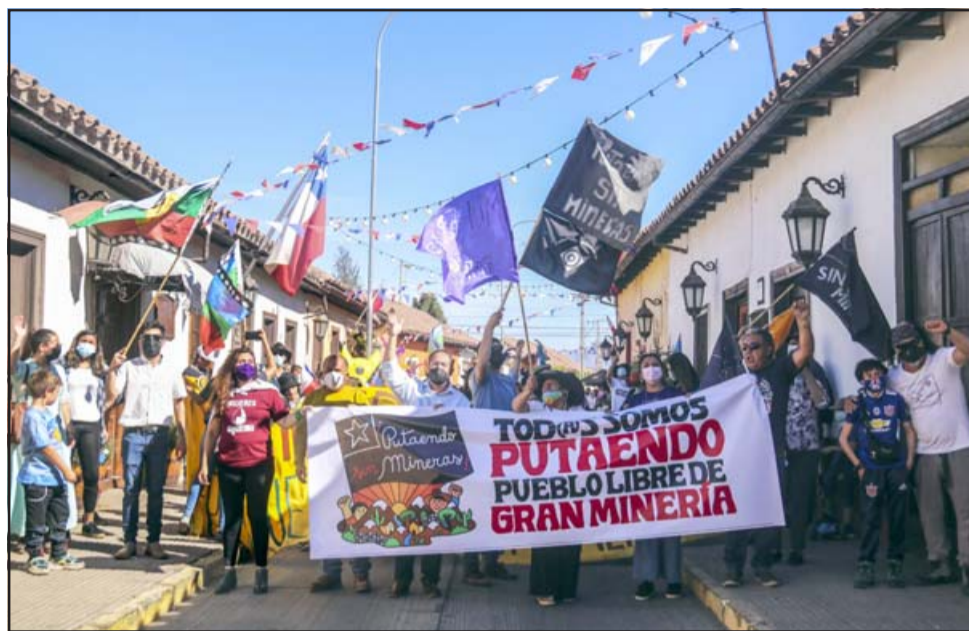
Pese al rechazo generalizado de la comunidad de Putaendo, el nocivo megaproyecto que impactará a todo el Valle de Aconcagua continúa adelante.

La lucha de los/as putaendinos/as contra este megaproyecto, que pretende ser una de las minas a cielo abierto más grande del país, viene de años. En efecto, en agosto de 2020, la comunidad llegó hasta la Corte Suprema y logró que se anulara la aprobación que el Servicio de Evaluación Ambiental (SEA) le había dado a esta campaña