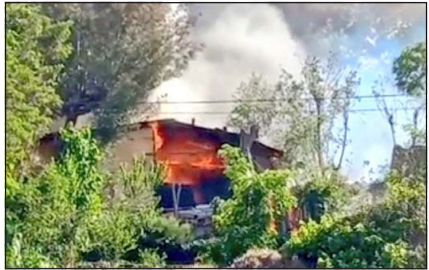
Una de las tres viviendas en los momentos en que está siendo consumida por el fuego.

Agregó que el día jueves había estado recorriendo el lugar, porque intuía que en el lugar había una problemática «no menor por todo esto que le describo, entonces ahora ya se está trabajando en todo eso, en mejorar. Aquí la única solución que sea definitiva, es tomar el canal que cruza por la medianía del cerro, entubar y hacer una calle de acceso de emergencia, pero sabes, la burocracia lamentablemente en nuestro país qui-