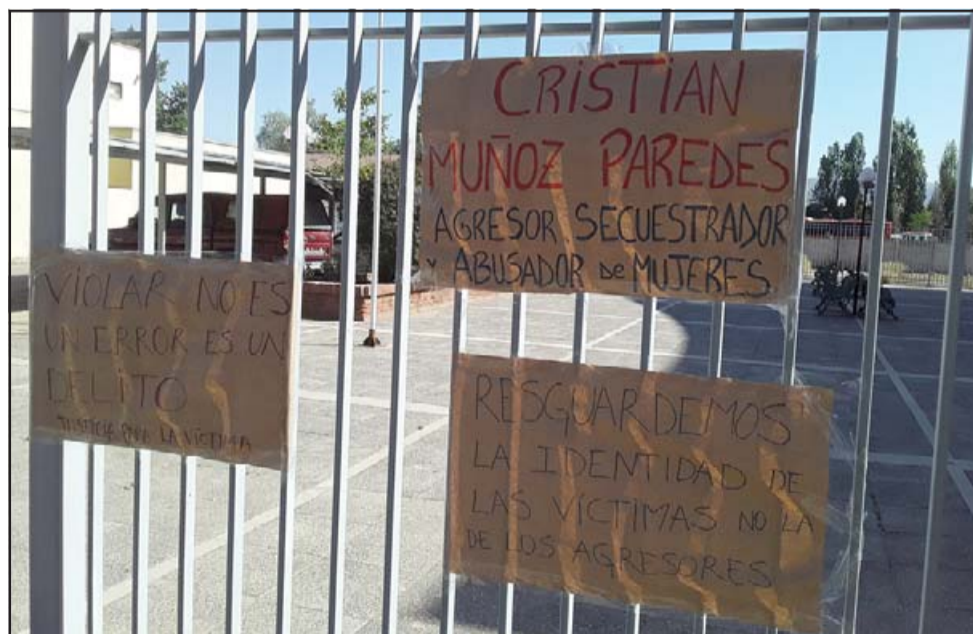
Letreros que colocó el grupo de Mujeres Apañadoras, como dicen llamarse, en la reja del Juzgado de Garantía de San Felipe.

Practiquemos el querernos y protegernos, fortalezcámonos física y mentalmente, defendámonos de los machos, con valentía y coraje construyamos nuestra propia realidad.