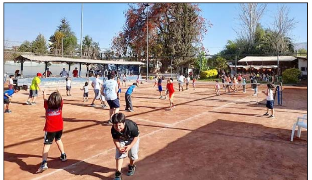
Muchos son los niños y niñas que integran la Escuela de Tenis del Club Valle de Aconcagua.

Más de 50 son las niñas y niños que integran la Escuela de Tenis que organizó el directorio de la institución deportiva sanfelipeña, que con esta iniciativa busca abrir espacios para