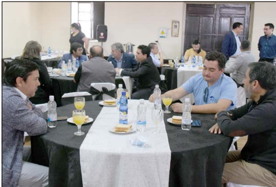
ES LA ESPERANZA.- Muchas ideas afloraron y buenos proyectos vendrán a convertirse en realidad.