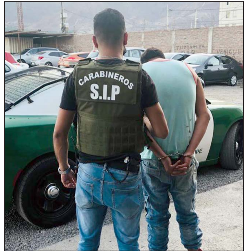
El detenido en el cuartel de Carabineros de San Felipe a cargo de la SIP.