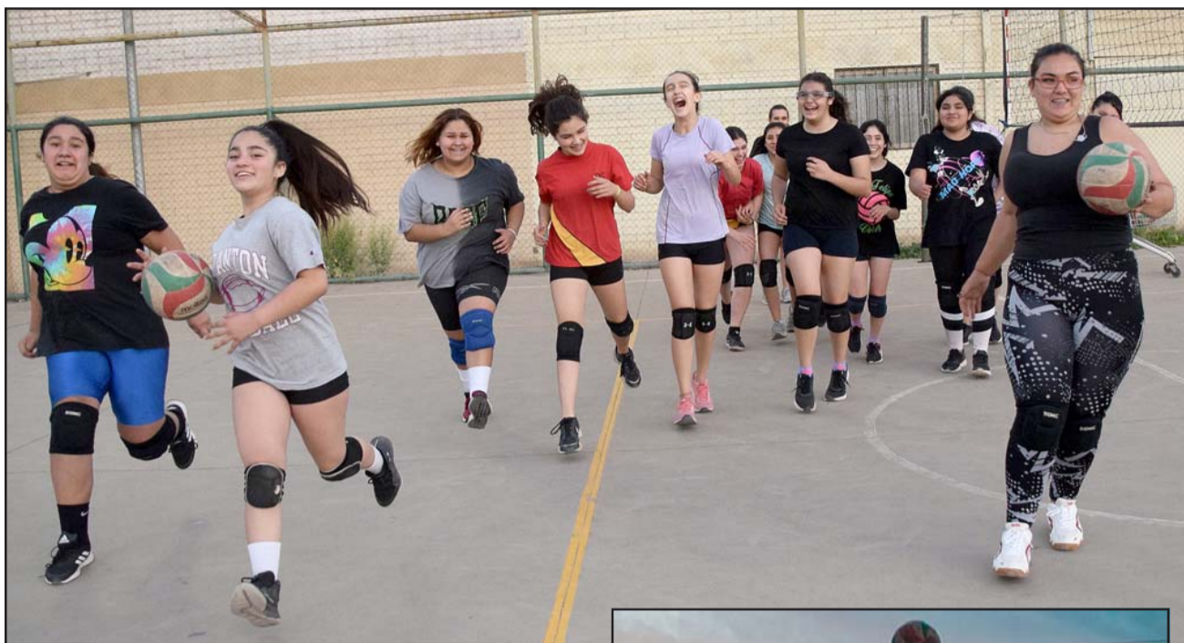
IMPARABLES.- Estas jóvenes deportistas realizaron un largo entrenamiento para ellas mismas y para las cámaras de Diario El Trabajo.