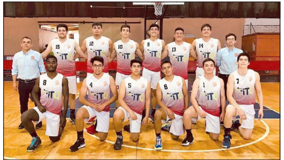
San Felipe Basket demostró todo su poderío al ganar al Prat en la Liga de Desarrollo.

El Prat deberá mejorar mucho para poder dar vuelta la llave ante un rival que se muestra muy fuerte.