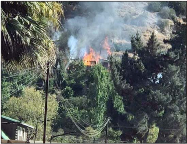
Desde lejos se podía divisar el dantesco escenario que terminó con tres viviendas destruidas, una mujer mayor herida grave y cinco damnificados.

de San Felipe debió concurrir también a apoyar labores de los voluntarios de Catemu.