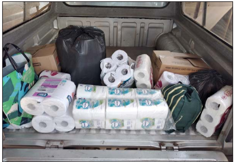
CAMPAÑA SCOUTS.- En esta camioneta transportaron los donativos a quienes por edad o salud no pueden trabajar y tener recursos económicos.