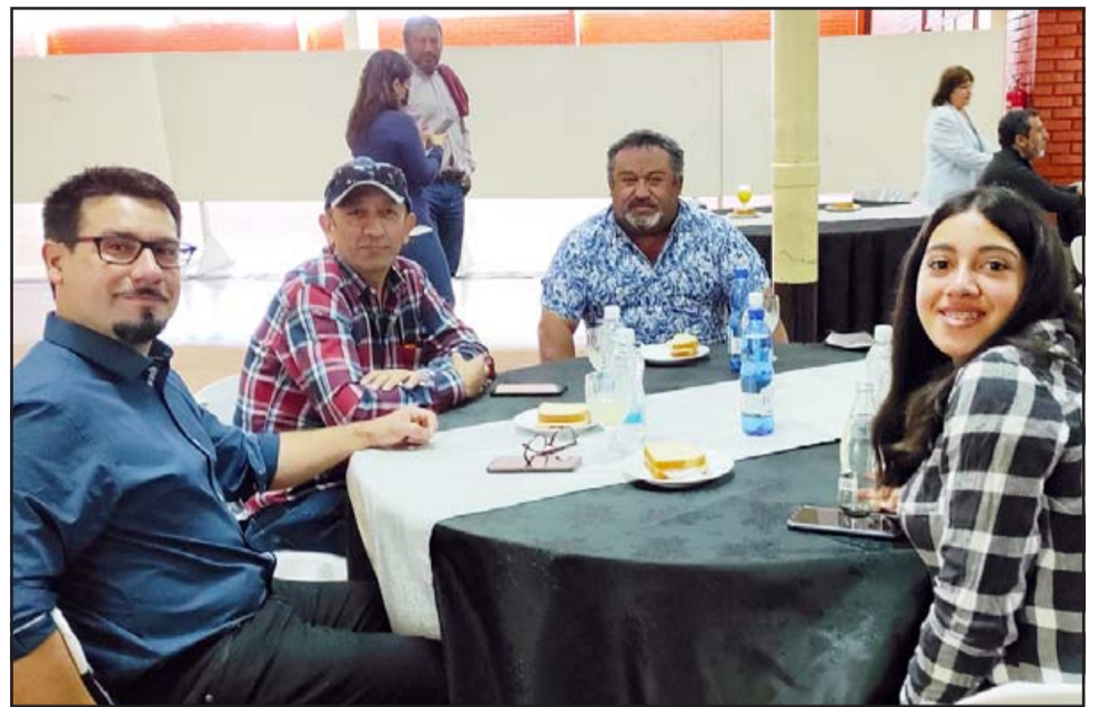
AMENO COMPARTIR.- Periodistas, empresarios y comerciantes locales disfrutaron amablemente del desayuno ofrecido por la Cámara de Comercio y Turismo de San Felipe.

- Mire, yo voy a hablar de la Cámara de Comercio de Llay Llay, yo mismo fui quien forjó esa Cámara de Comercio allá, no sé en qué condiciones esté funcionando, no sé si habrán hecho algo, la verdad eso lo desconozco, pero sí puedo decir que existen cámaras de comercio. En Catemu también existe una Cámara de Comercio que también se encuentra quizá con un poco de pérdida de interés, pero aquí estamos nosotros para apoyarlos, para crear actividades, para que los comerciantes se in-