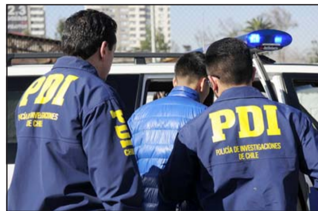
El imputado fue detenido por personal de la PDI Los Andes.

6º Enfrentar a funcionarios y funcionarias en diversos organismos del Estado como hospitales, policías y tribunales, que no tienen las capacidades para enfrentar este tipo de procedimientos. Acompañamientos distantes, con cuestionamientos constantes, opiniones innecesarias, prejuicios discriminadores que aíslan y des-