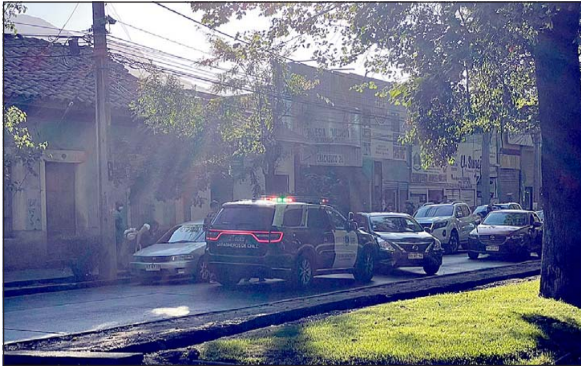
Acá se aprecia el furgón policial en el procedimiento de este lunes en la tarde en Avenida Chacabuco.

ron que se trata de un sujeto de 25 años, de iniciales M.A.Q.L. , quien deberá entrar a cumplir condena de inmediato. El condenado era buscado desde hace unos dos meses, pero siempre se daba a la fuga.