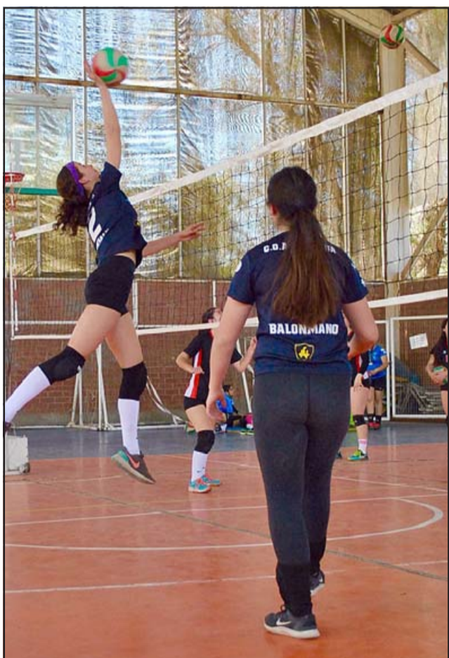
CON ALAS PROPIAS.- La estatura, condición física, agilidad y entrenamiento son las mejores herramientas para sacar lo máximo del vóleybol.

del Club Deportivo Aconcagua. Nos estamos preparando específicamente para el Torneo Copa Lincoln en Santiago, en el Colegio Lincoln de Las Condes, en la categoría Sub-14, categoría a nivel nacional de proyección, en donde podemos ver las futuras voleibolistas que quizás puedan llegar a la Selección en alguna de ellas, pero esta es la categoría donde se potencia a nivel escolar y donde se potencia a nivel del club, para poder proyectar el futuro de ellas, y en este minuto nos preparamos específicamente con la categoría para este torneo y