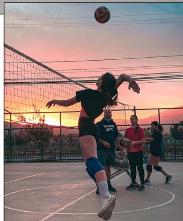
LA JUVENTUD SE IMPONE.- Así cayó la noche, sudando y corriendo por la cancha en busca del perfeccionamiento físico y mental que les permita ganar el torneo.