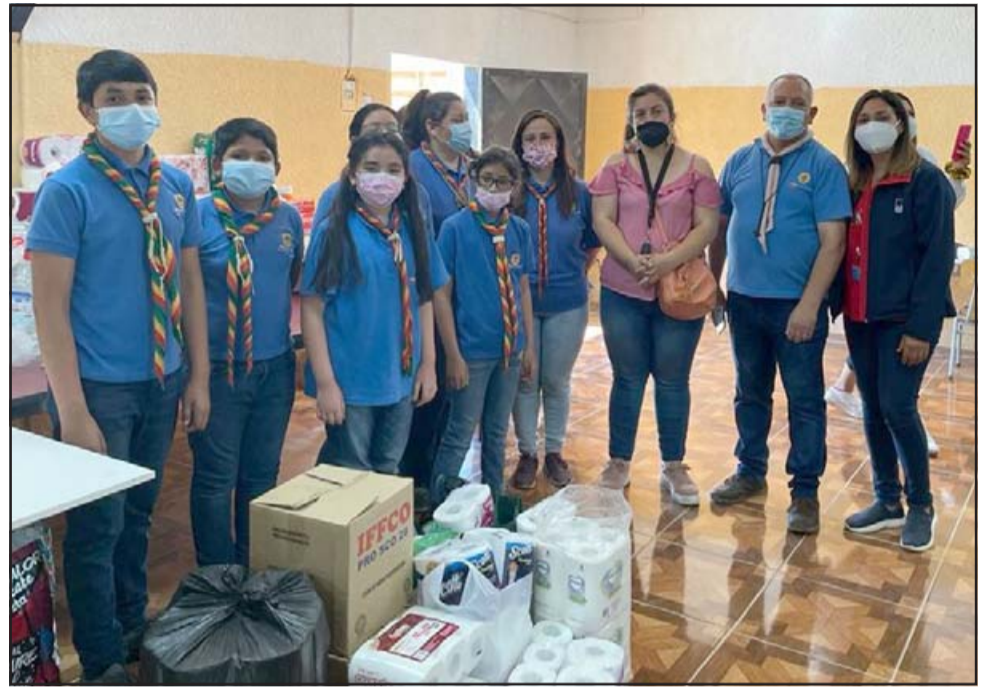
DAME UNA MANO.- Aquí vemos una de las brigadas de Scouts Ashanti Chile, haciendo una pauta en la colecta para abuelos de 21 de Mayo.