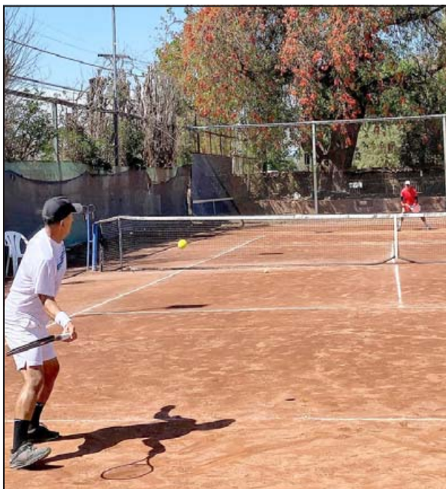
Hace una semana que empezó el abierto José Lepe.

club, que desde las cinco de la tarde de cada viernes tienen la posibilidad de aprender a jugar el único deporte que le ha dado medallas de Oro Olímpicas a Chile.