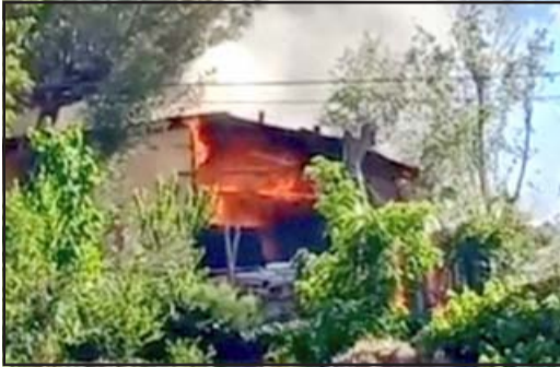
El fuego literalmente devoró las viviendas.

Cuatro adultos y dos niñas damnificados en Catemu