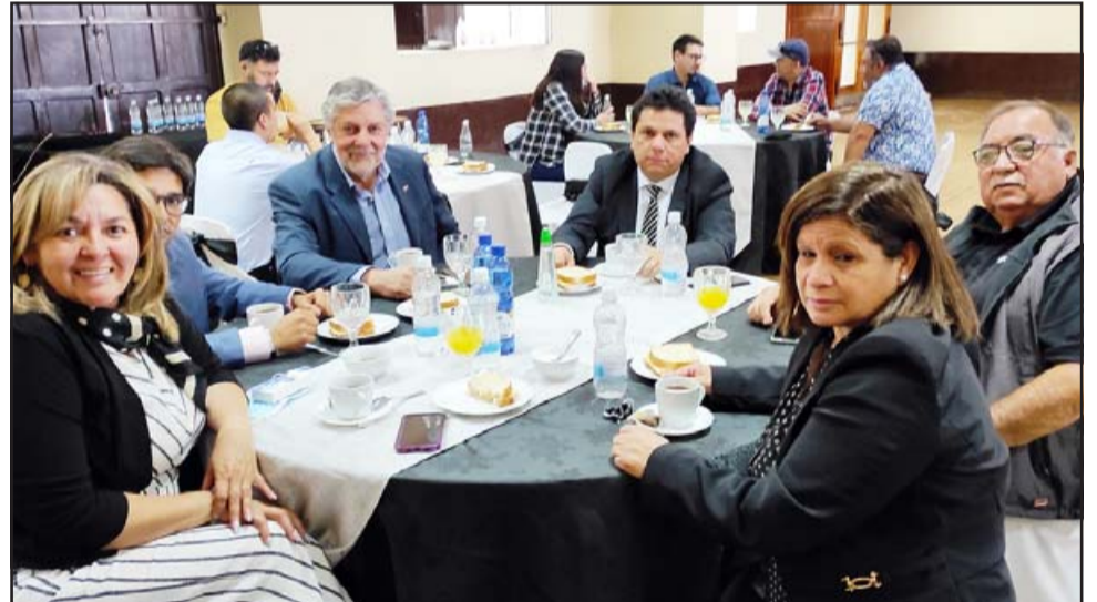
A LA HORA PACTADA.- También autoridades comunales y provinciales llegaron a la cita pactada en el salón principal de la Cámara de Comercio y Turismo de San Felipe.