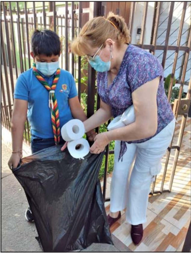
MUCHOS DONANDO.- Ella es una de las vecinas de El Canelo 3, quien con mucho cariño donó a esta noble causa.