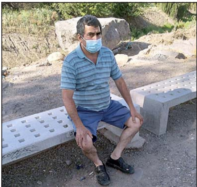
Un vecino sentado en uno de los asientos de concreto, disfrutando del parque que comienza a secarse.