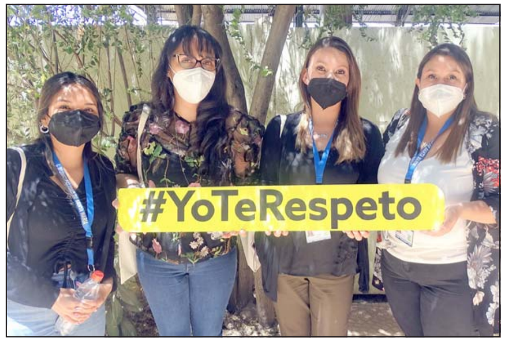
Varios funcionarios municipales participaron en esta actividad, misma que fue desarrollada por el Ministerio Secretaría General de Gobierno, a través del Observatorio de Participación Ciudadana y No Discriminación.

La Ley 20.609 consta de tres partes: La primera; en los artículos 1 y 2 se refiere al propósito de la ley y la definición de discriminación arbitraria. La segunda parte, en los artículos 3 a 14, habla sobre una acción especial para reclamar ante una conducta discriminatoria arbitraria