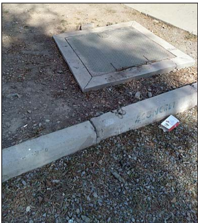
De este lugar sacan el agua para regar, pero hoy en día, por falta de mantención, el riego se ha hecho extremadamente lento.