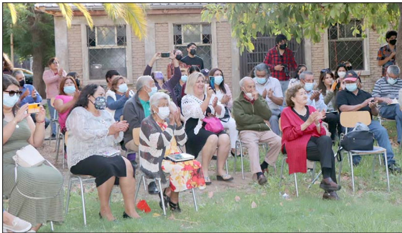
RESCATE CULTURAL.- Los vecinos de la comunidad se reunieron en el jardín de la parroquia de Catemu, pues desde hace ya casi dos años no se presentaban libros.