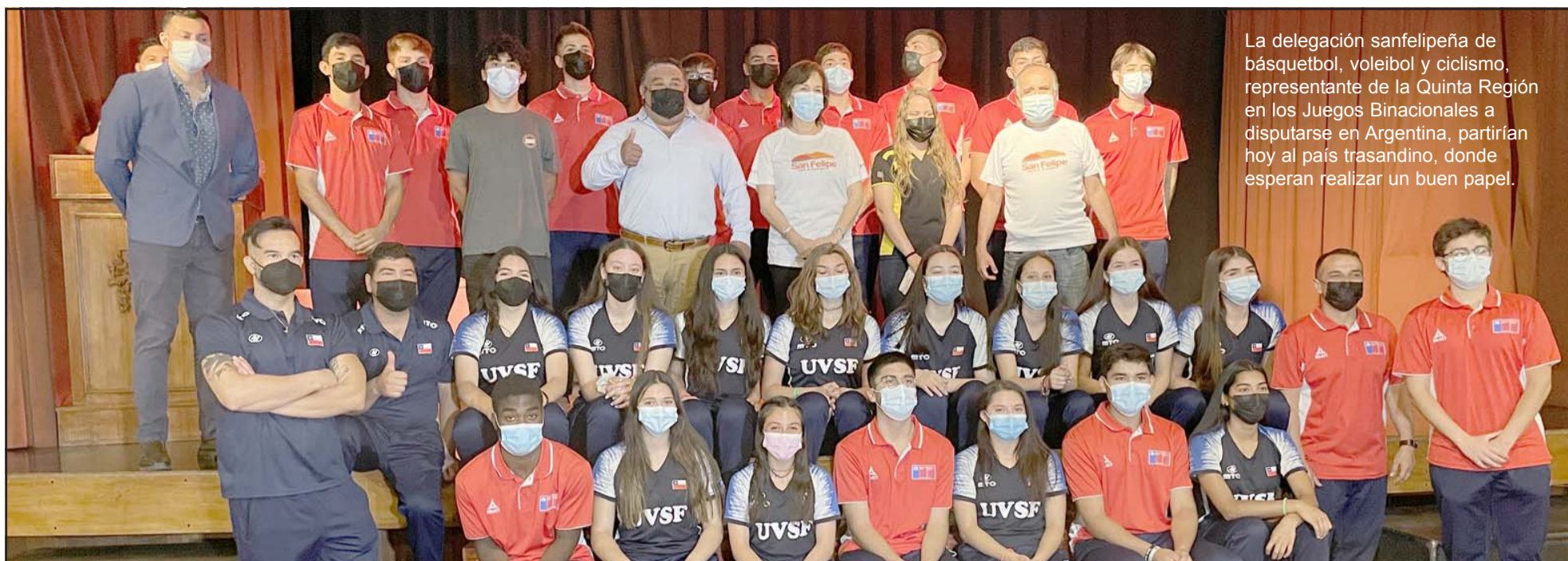
La delegación sanfelipeña de básquetbol, voleibol y ciclismo, representante de la Quinta Región en los Juegos Binacionales a disputarse en Argentina, partirán hoy al país trasandino, donde esperan realizar un buen papel.