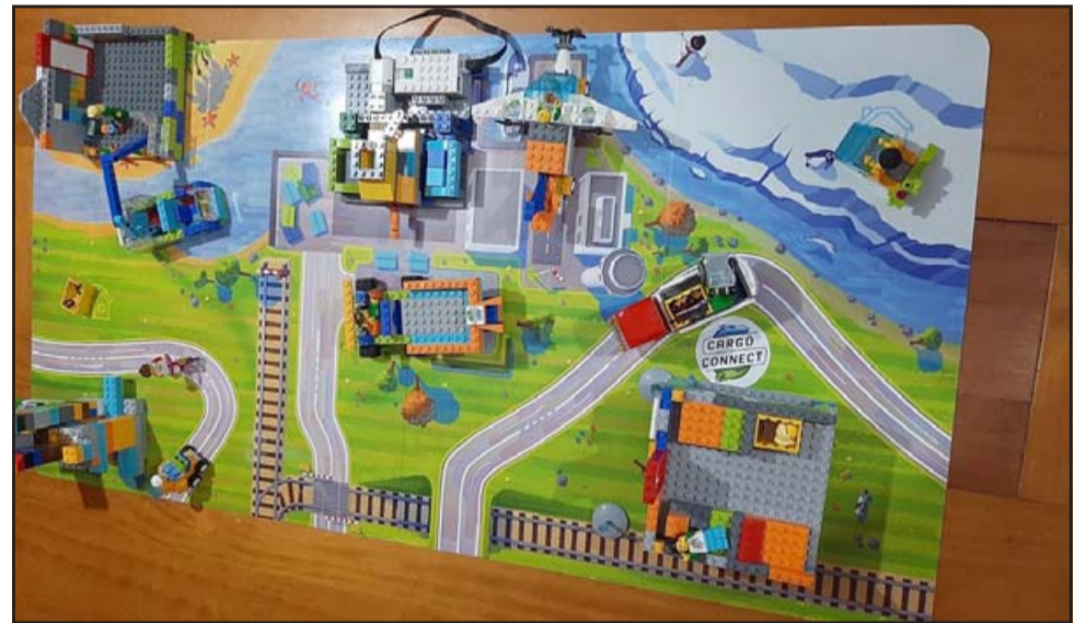
Proyecto Completado.- Así se ve terminado el proyecto de los niños de Ashanti Chile, y por ello recibieron sus creadores su respectiva medalla.