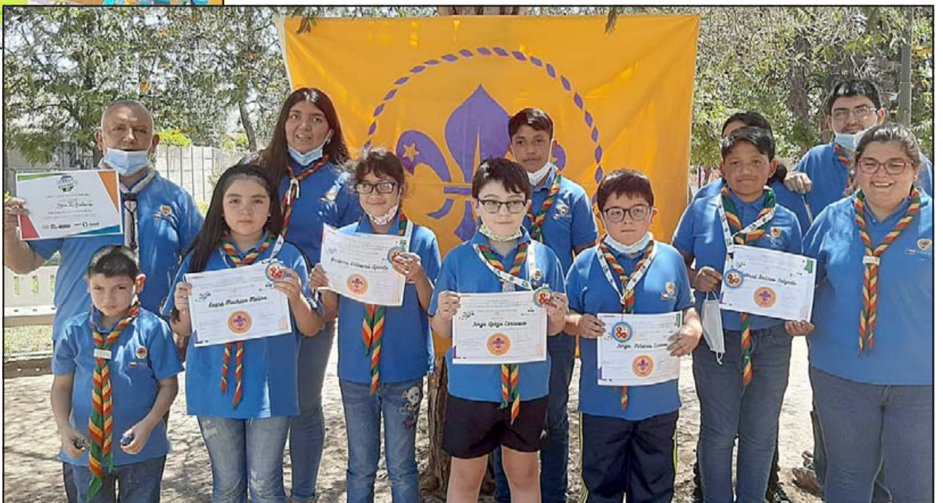
CON SU DIPLOMA.- Al final del día cada uno recibió su diploma de participación en este Torneo Nacional de Robótica Online.