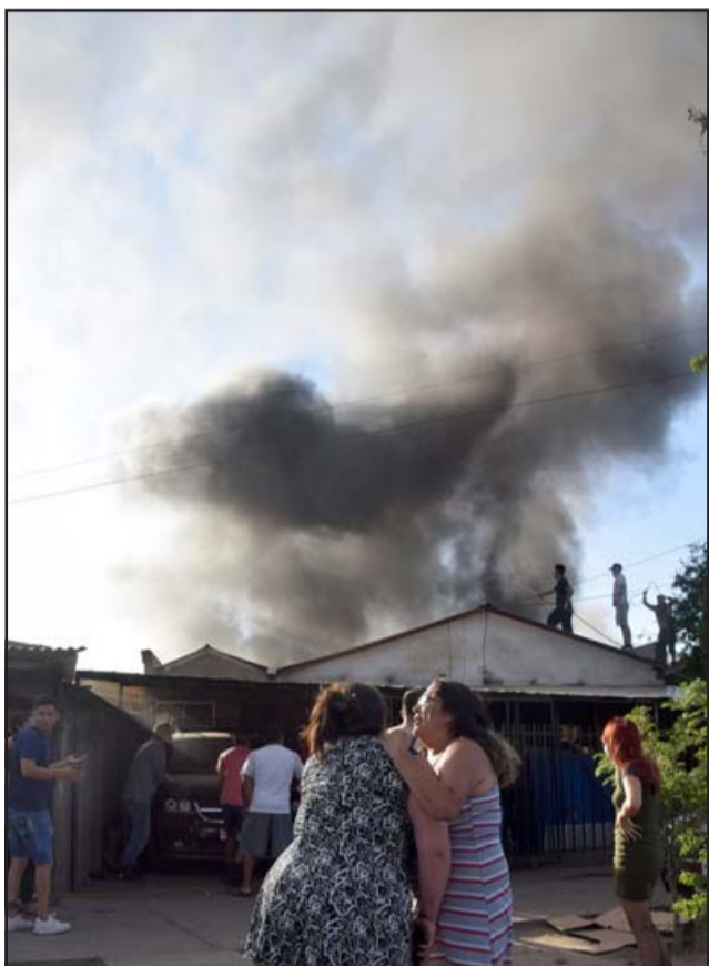
IMPOTENCIA.- Estas vecinas ven con impotencia cómo sus pertenencias y su hogar queda destruido por las llamas.