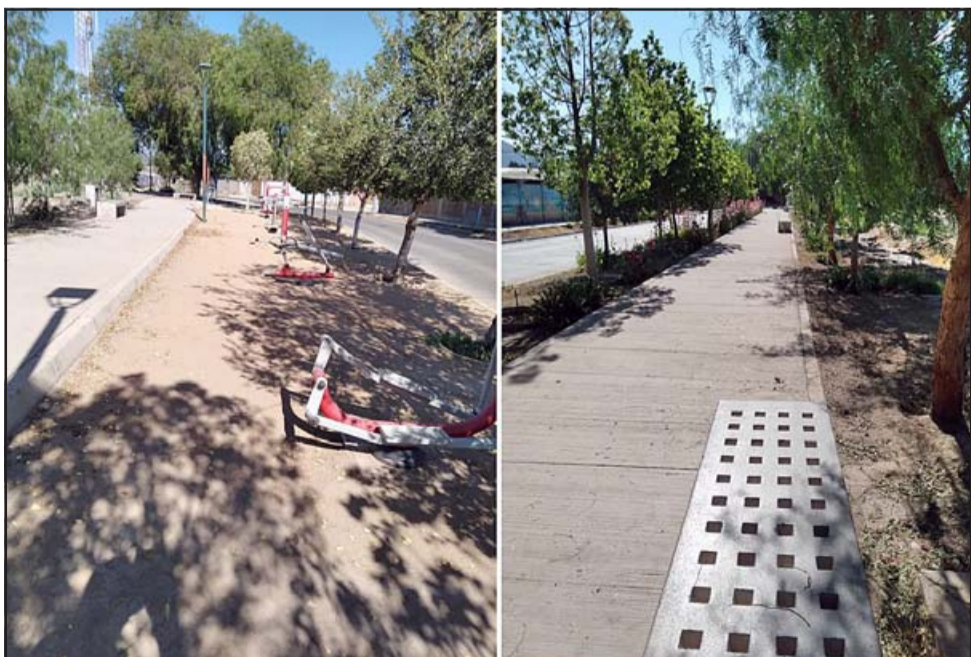
Acá una imagen de la costanera, lindo paseo, máquinas de ejercicios. Los vecinos tienen sobradas razones para desear mantener este lugar verde.