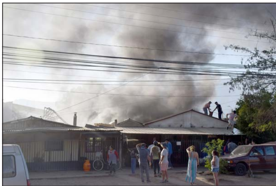
LO PIERDEN TODO.- Este fue el escenario que ensombreció toda la población El Esfuerzo la tarde de este lunes en las inmediaciones de Diego de Almagro con Benigno Caldera.