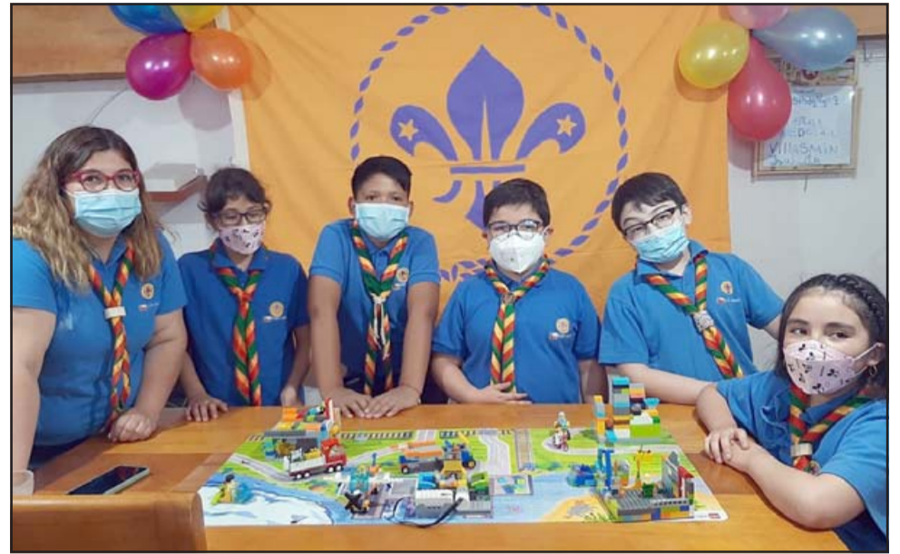
TALENTOS LOCALES.- Aquí tenemos a estos tremendos traviesos construyendo su ciudad con legos, actividad enmarcada en el Torneo Nacional de Robótica Online.

- El torneo comenzó a las 9 de la mañana y finalizó a las 13:20 horas, una vez finalizado nos dirigimos a la plaza de La Doñita, en donde realizamos una sencilla y emotiva ceremonia de pre-