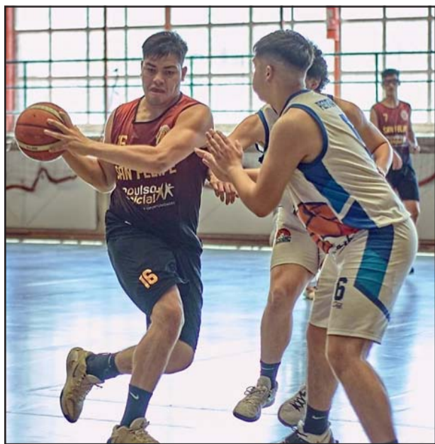
El joven integrante de San Felipe Basket formará parte de la Selección Chilena Sub-17 que en diciembre próximo hará una gira por la provincia de Buenos Aires.

La Selección Chilena masculina de básquetbol menor de 17 años, tiene agendado partir el viernes 10 de diciembre hacia la Argentina, y su retorno al país está programado para el martes 21 del mismo mes.