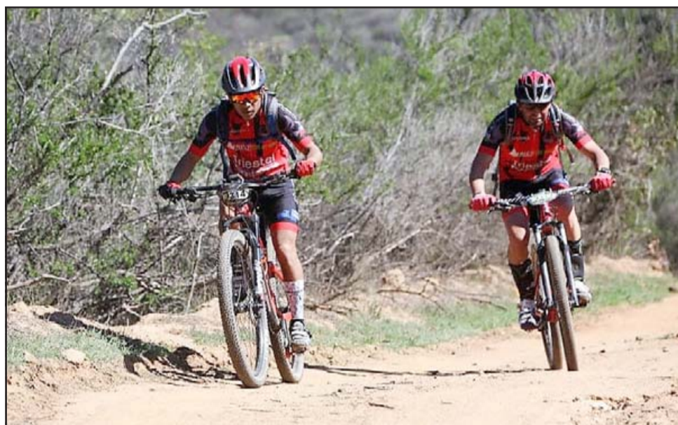
Los y las mejores exponentes del MTB del valle y el país competirán en el campeonato de MTB 'Quinta Cordillera'.

Los interesados en ser parte de la competencia pueden pedir mayores antecedentes en las redes sociales del club Gárgolas SMA.