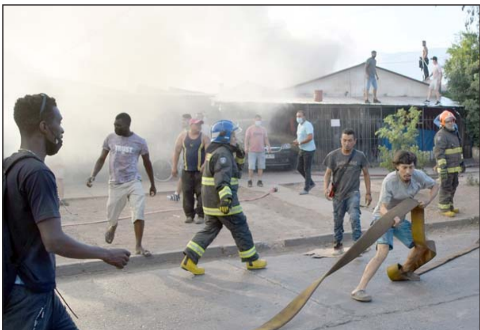
TODOS AYUDANDO.- Aquí tenemos a este otro vecino tirando líneas en media calle, hoy martes sabremos qué tan altas son las pérdidas de esta familia.