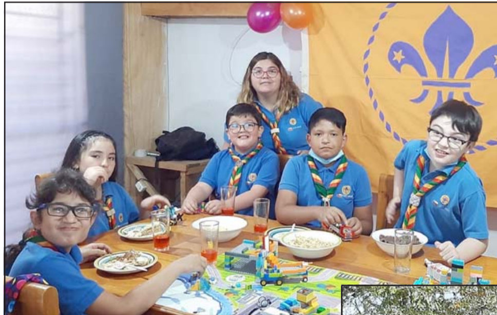
BUEN APETITO.- También hubo tiempo para cargar las pilas y saborear buenas meriendas.

Piñones Carrasco, Jorge Opazo Carrasco y Gabriel Salinas Salgado. Roberto González Short