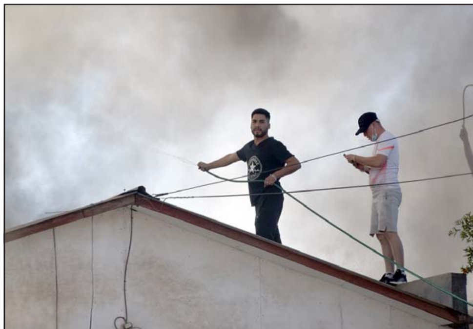
HÉROES LOCALES.- Estos jóvenes son héroes verdaderos, aunque no tenían el recurso hídrico, hicieron todo lo posible para evitar que las llamas consumieran otras viviendas.