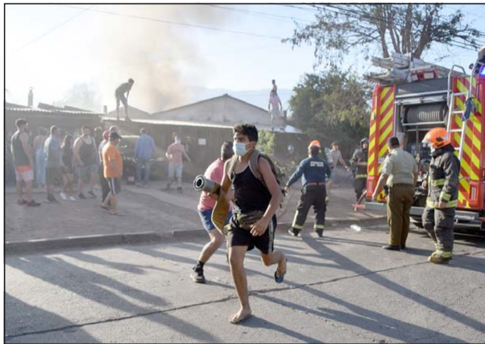
CORRIENDO POR EL AGUA.- Por algunos instantes hubo personal de Bomberos, las mangueras, los carrobomba, pero no había agua; cada segundo era una eternidad.