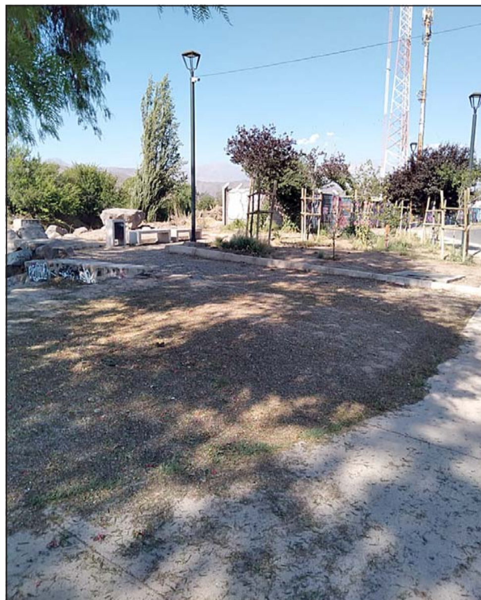
Acá el lugar que ya se secó en la Villa Las Acacias.

Señalar que estas obras tuvieron un costo de 600 millones de pesos.