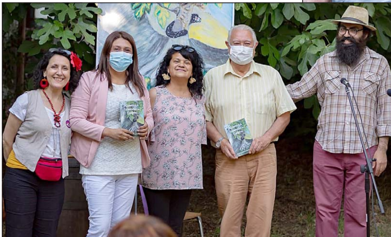
EN SUS MANOS.- Aquí vemos a varios relatores de la comuna, recibiendo ejemplares de este libro, un trabajo de tres entusiastas cultores.