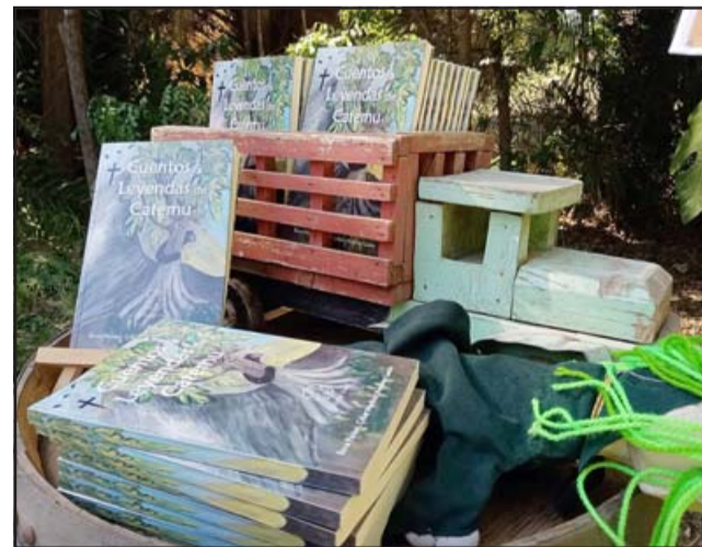
CARGADO DE CUENTOS.- Aquí vemos algunos de los ejemplares de esta obra impresa, quienes aportaron relatos pudieron acceder a varios ejemplares.