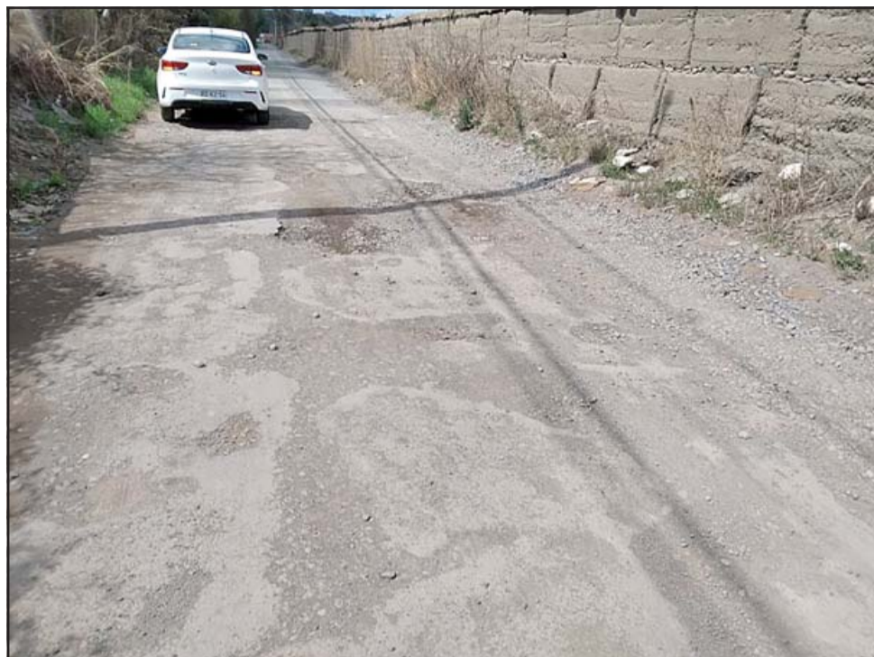
Enormes hoyos deben sortear los vehículos en calle El Convento.