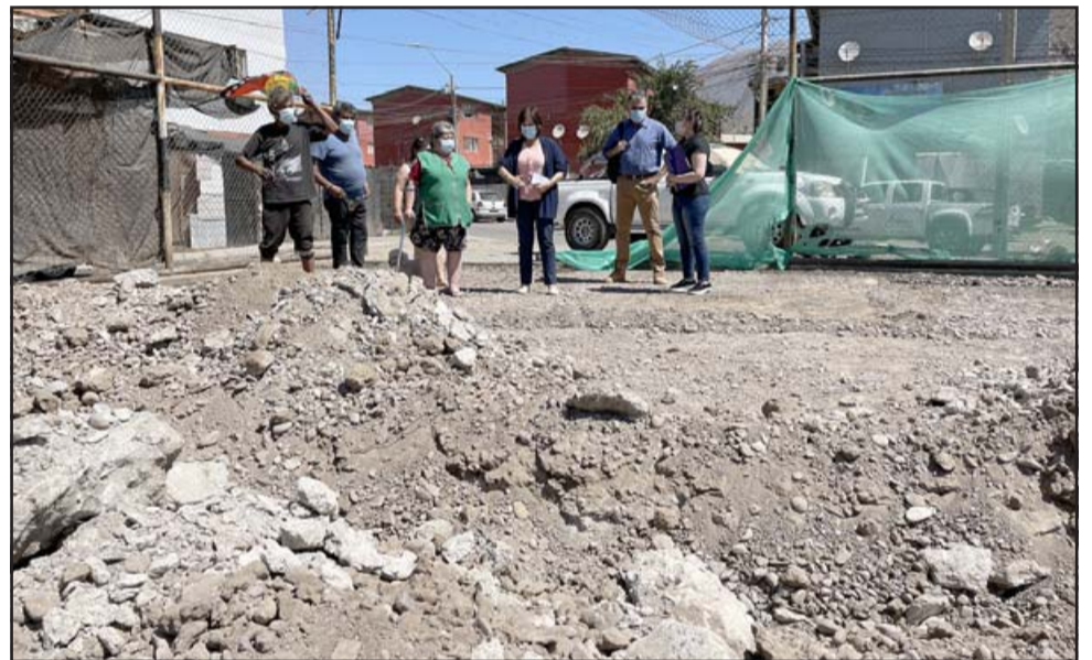
Los trabajos son financiados por la Subdere a través de un proyecto del Programa de Mejoramiento Urbano (PMU) por 33 millones de pesos.