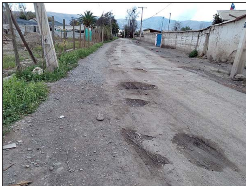
Una imagen vale más que mil palabras. Los cráteres se extienden por todo el camino.