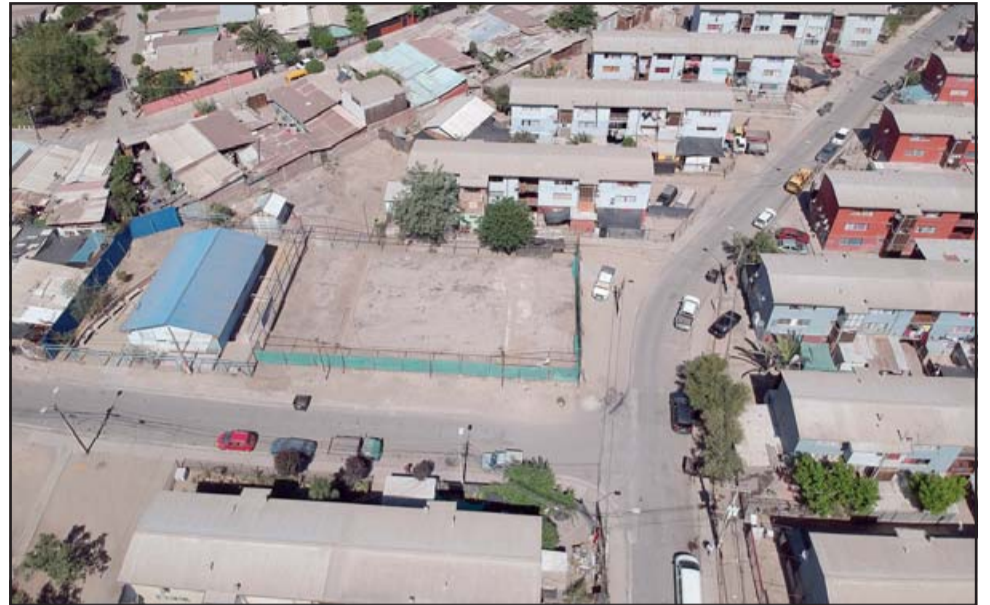
La deteriorada multicancha de la Villa Departamental está siendo sometida a trabajos de mejoramiento.

El proyecto comenzó a ejecutarse el pasado 19 de octubre y tiene un plazo contractual de 114 días, por lo que se estima su fecha de entrega para febrero del próximo año.