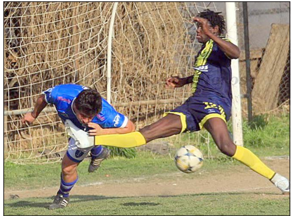
Ya existe plena certeza que el 9 de enero comenzará a rodar el balón en San Felipe.

Otro punto que deberán dilucidar es el concluir si habrá clubes invitados, ya que habría algunas instituciones de otras asociaciones interesadas en ser parte de un evento, además que hay que ponerse de acuerdo en cuántas series se competirá en un campeonato que como pocas veces en su historia ha sido tan esperado en su regreso.