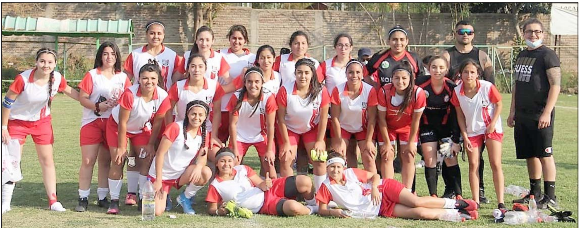
El equipo femenino del Uní Uní avanza en su preparación para lo que serán sus desafíos el 2022.

que no es lo mismo jugar dos tiempos de 45 minutos en instancias superiores, que hacerlo 25' en el amateur; ahora esperamos que en el 2022 podamos tener mejores presentaciones que las que hicimos este año».