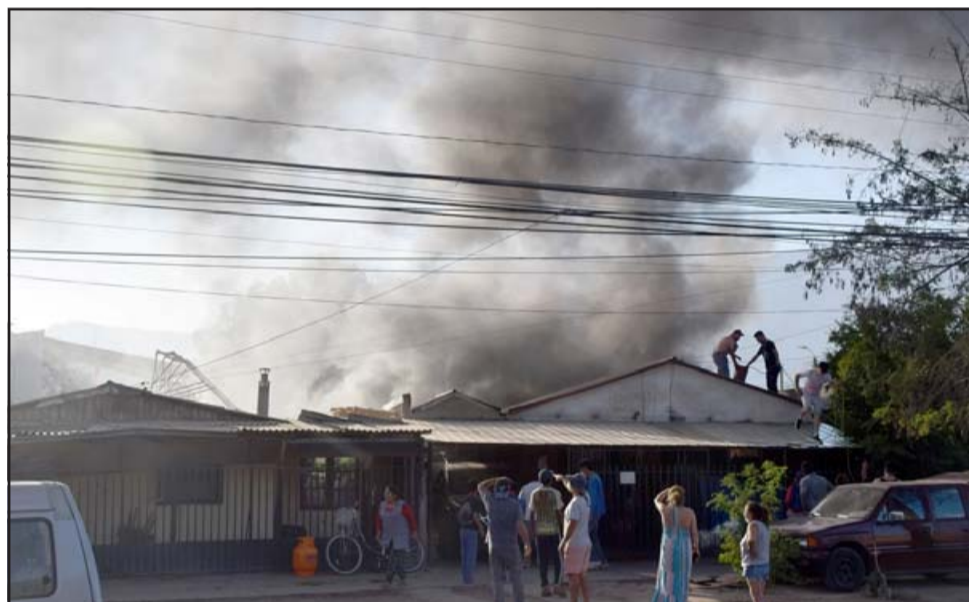
MINUTOS DE ANGUSTIA. - Las cámaras de Diario El Trabajo registraron la tragedia de esta familia la tarde del lunes.