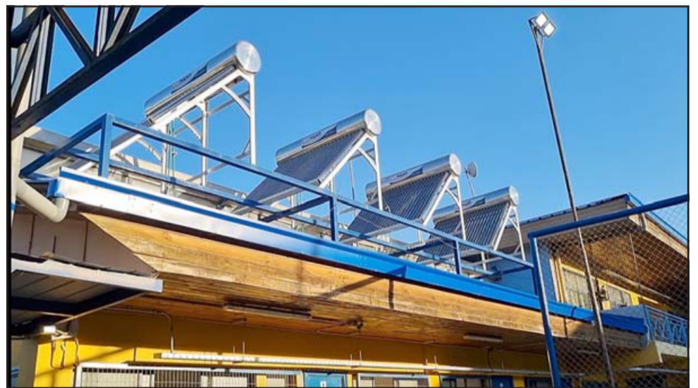
Termopaneles solares de 300 litros de capacidad para agua caliente, son algunas de las innovaciones con que cuenta desde ahora la Escuela Héroes de Iquique.