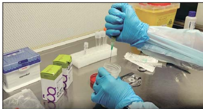
Los espermatozoides son preparados en laboratorio para ser implantados en el útero de la mujer, mediante una cánula, en el momento exacto en que ocurre la ovulación.