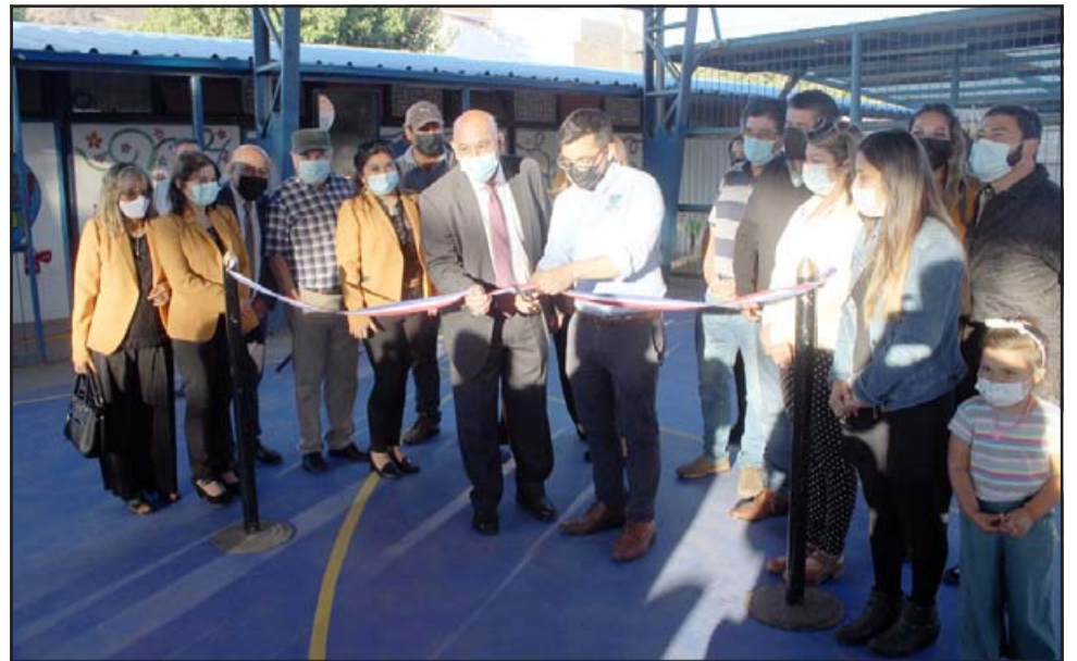
El tradicional corte de cinta dio por inaugurado el remozado establecimiento.

AVISO: Por robo quedan nulos cheques N° 4867674, 4861675, 4861673, Cta. Cte. N° 22309052009 del Banco Estado, Sucursal Arturo Prat 100, San Felipe. 25/3