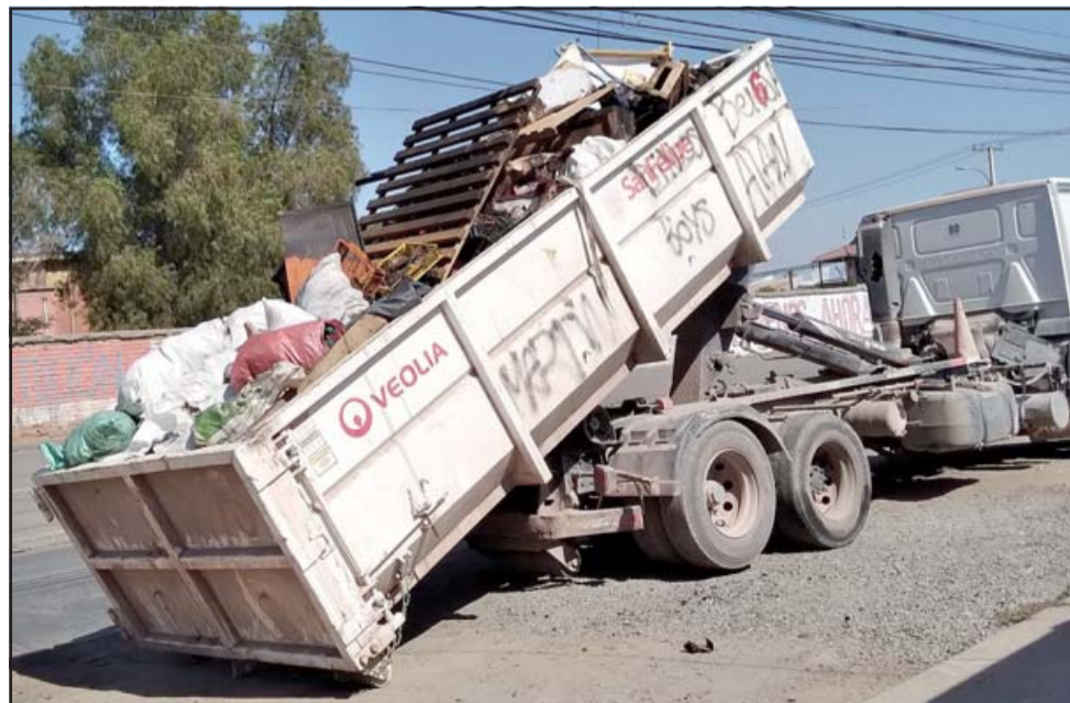
TODLO PERDIERON. - En escombros terminaron todos los electrodomésticos, ropa, utensilios del hogar y muebles de esta familia.