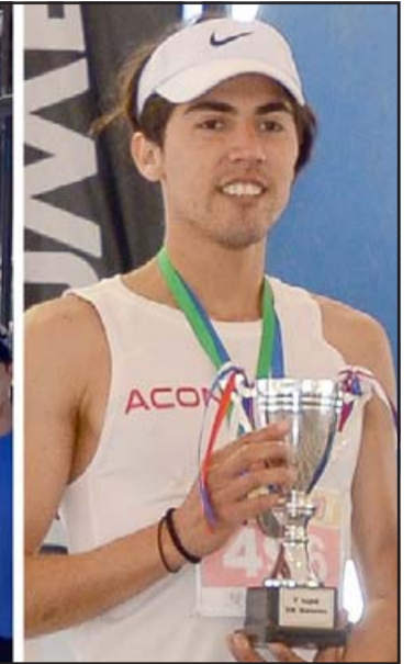
SIGUE MEJORANDO.- Cerrando el año este atleta sanfelipeño lo hace con varios triunfos, sigue entrenando para enfrentar con gran Fuerza y Vigor lo que le depare 2022.

- Ahora me encuentro descansando para volver a entrenar en un par de semanas más, para preparar las futuras competiciones del