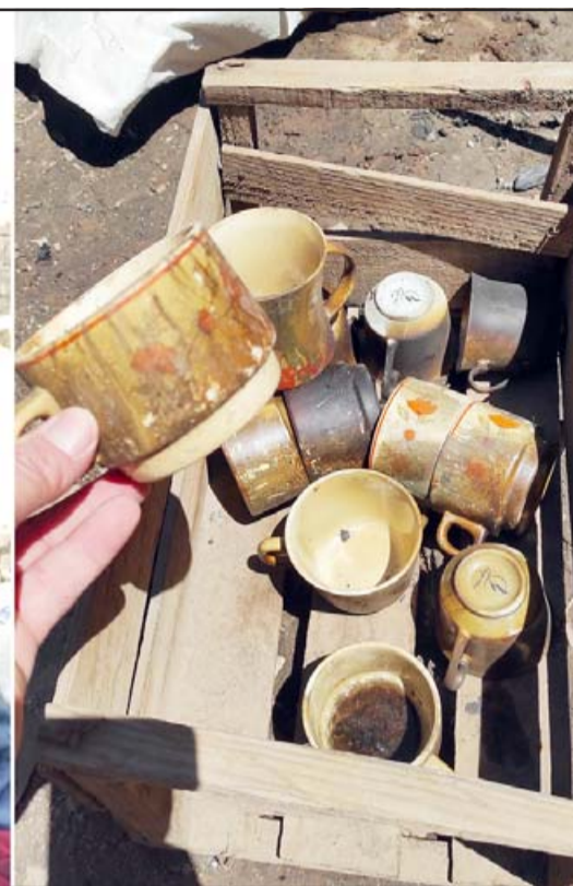
A EMPEZAR DE NUEVO. - Las pérdidas materiales de este matrimonio son totales, hasta los utensilios de cocina quedaron inservibles.