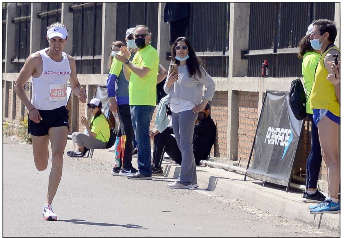
A TODA MÁQUINA.- Él sabe que en las pistas de atletismo no hay lugar para los débiles, por eso sigue entrenando y compitiendo.