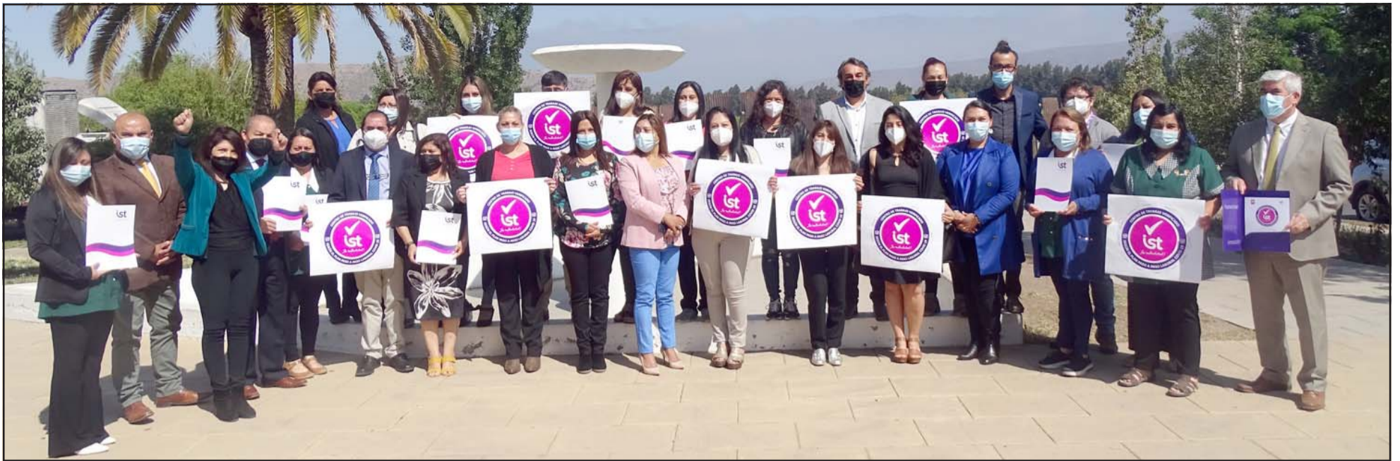
El trabajo mancomunado de la mano del IST y los equipos de cuadrillas sanitarias, directores y directoras de escuelas, liceos y jardines infantiles, permitieron que la Municipalidad de Santa María tenga hoy en día todos sus centros certificados.