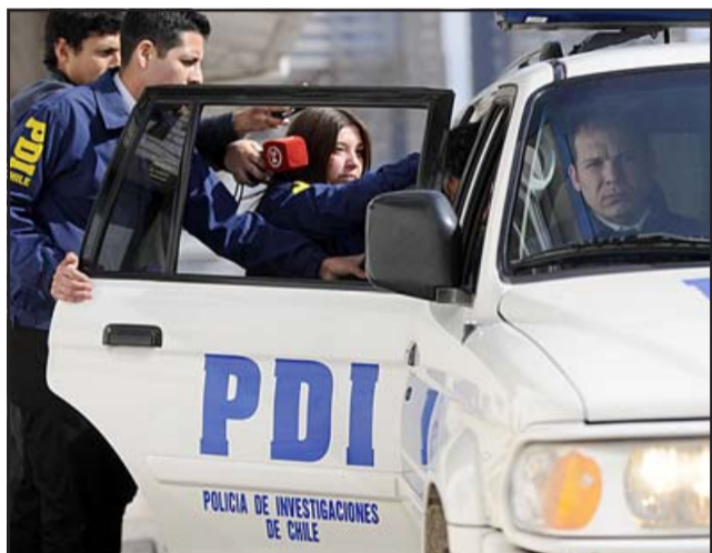
Dos personas detenidas por efectivos de la PDI, quienes vendían drogas por Delivery. (Foto referencial)

Los detenidos quedaron a disposición del Juzgado de Garantía para su respectiva formalización, instancia en que conocerán las medidas cautelares en su contra.