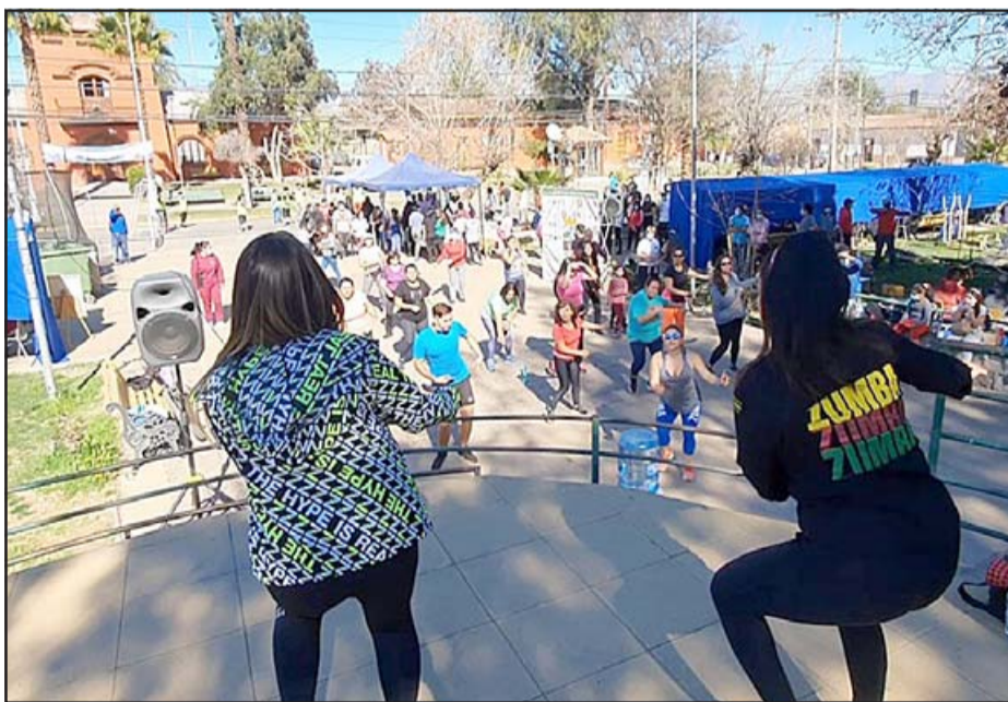
La iniciativa, que contó con varias sorpresas y regalos para los asistentes, se realizó este sábado 4 de diciembre, a partir de las 18:00 horas.

«Dispusimos de un stand para controlar temperatura, mascarillas y uso de alcohol gel. La idea era que la comunidad respetara las medidas sanitarias, por eso hicimos hincapié en que manteníamos los protocolos sanitarios para evitar contagios», afirmó.