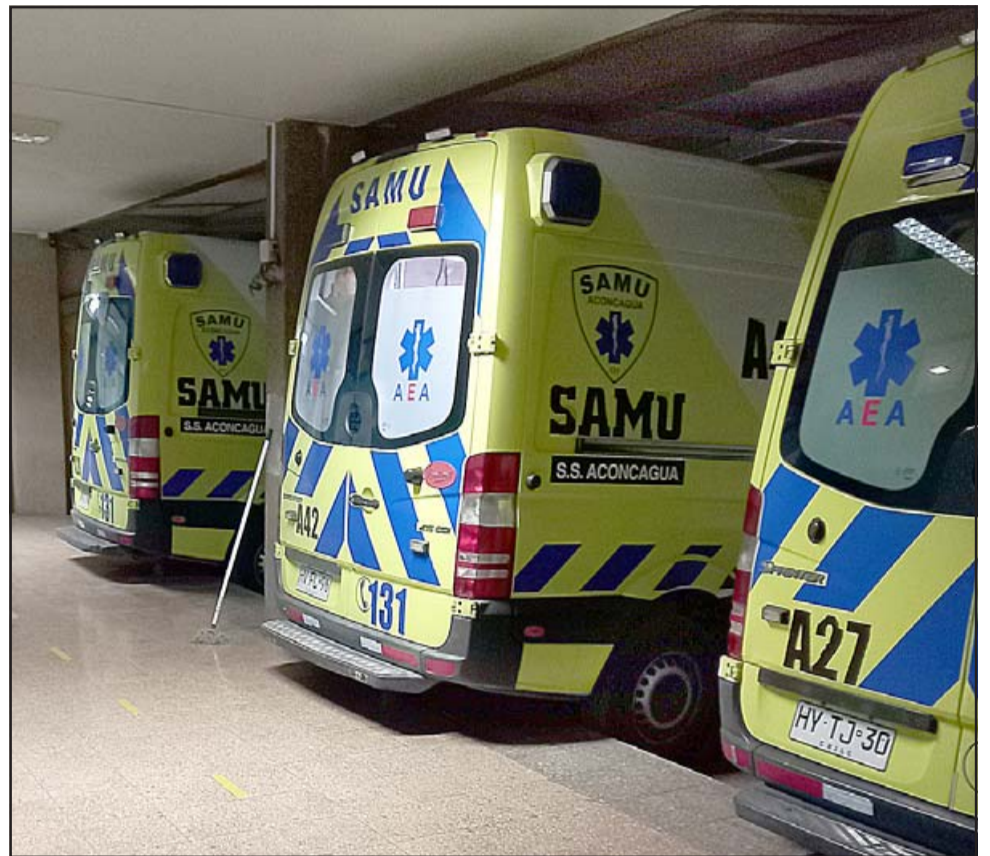
¡NO HAY AMBULANCIAS!.- Esta fotografía la tomó la denunciante al llegar al Hospital San Camilo, pues se indignó que le negaran ambulancia estando estas tres disponibles.