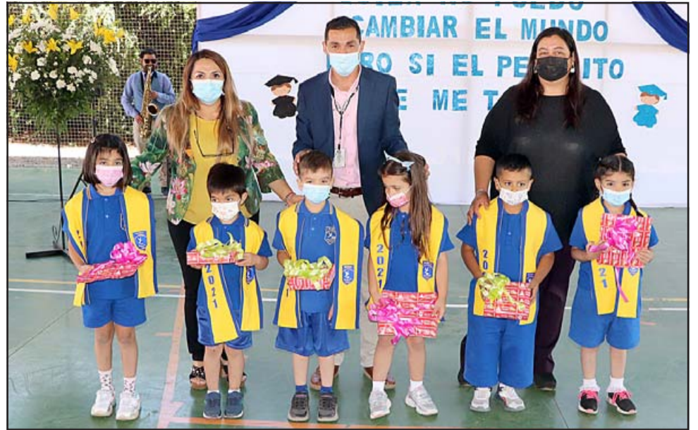
Once menores del kínder de la Escuela Jorge Barros egresaron del nivel parvulario, luego de haber cumplido con la malla curricular, con clases remotas y presenciales.

«Queremos descartar el gran esfuerzo hay que de parte de la autoridad comunal, junto al DAEM y nuestros profesores por sacar adelante un proceso que fue muy complicado durante este año 2021, del punto