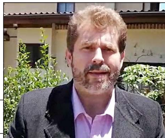
George Hübner Arancibia, Seremi de Salud Valparaíso.

una búsqueda activa de casos en la comunidad. Reiteramos que la pandemia no ha finalizado, por ello reiteramos el llamado a mantener las medidas de autocuidado, generar una cultura de testeo y vacunarse a todos quienes les corresponde según el calendario del ministerio de salud», finalizó.