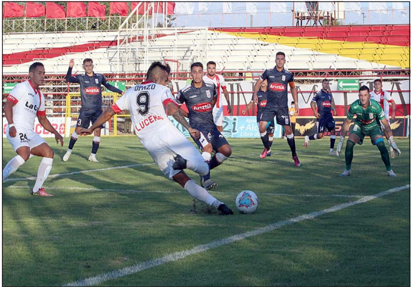
Según un exfuncionario de Deportes Melipilla, en el juego de revancha por el ascenso hubo jugadores del Uní Uní que fueron para atrás.