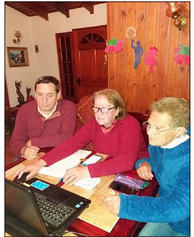
Trabajando con dirigentas en la elaboración de proyectos.

grafía de la UPLA, ya que cada uno de ellos tenía un rol dentro del proyecto, ya sea preparando los contenidos, la página Web, los informes comunitarios mensuales entre otros aspectos. Además, se puso en aplicación en la realidad socioterritorial elegida el uso práctico de muchos instrumentos que nos permitieron recopilar datos, estos fueron estructurando diversos pasos, por lo que nos propusimos en el cronograma de nuestra intervención social. Por último, queda en evidencia el provechoso vínculo con el medio que se debe establecer y mantener con las organizaciones de base, dado que es una retroalimentación mutua que promueve no sólo formar a la ciudadanía como fue nuestro caso, sino también aprovechar la experiencia vivida y hacer de ella un argumento que, apoyado con la teoría, se enseñe en las aulas de la universidad en un proce-