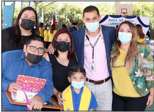
Este año si bien no hubo egreso de los octavos años básicos por falta de matrícula, al menos estos pequeñitos lograron cumplir su tarea.

presentes a los párvulos egresados, donde la autoridad comunal llamo a los padres a confiar en la educación de Panquehue, destacando los grandes esfuerzos que se han estado realizando para mejorar su nivel económico y curricular.