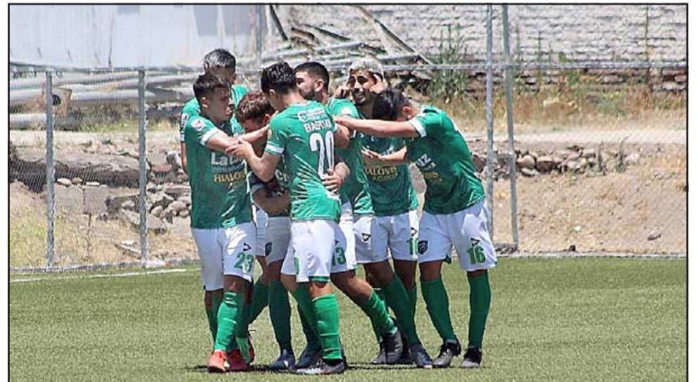
Los jugadores del 'Tra' celebran el gol que le dio la victoria.