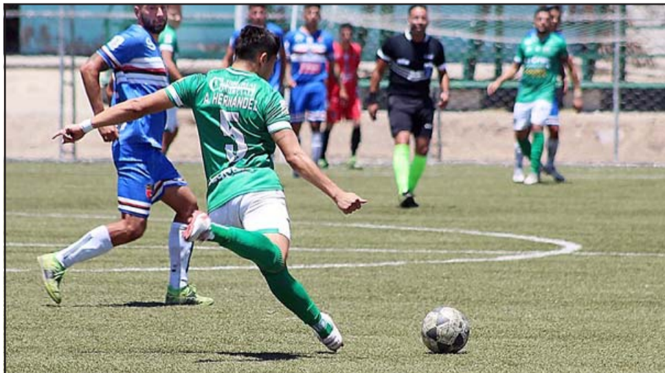
El encuentro contra San Joaquín se jugó al mediodía del sábado pasado.

ahora el equipo aconca-güino tiene campaña perfecta en el mini torneo al capturar seis puntos de seis posibles.