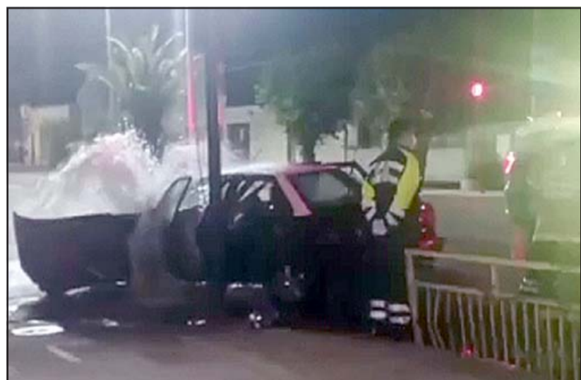
Personal del SAMU trabaja en el lugar. El conductor del vehículo en el que se originan los disparos debió ser rescatado con hipotermia del interior del móvil.

- Yo creo que hubo un problema de ajuste de cuentas, algo así yo creo.