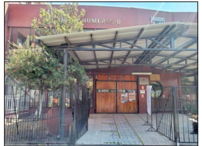
Este año son sedes de rendición de la PTU, el Liceo Roberto Humeres (en la foto), el Liceo Bicentenario Corina Urbina, la Escuela José de San Martín y la cárcel de San Felipe.