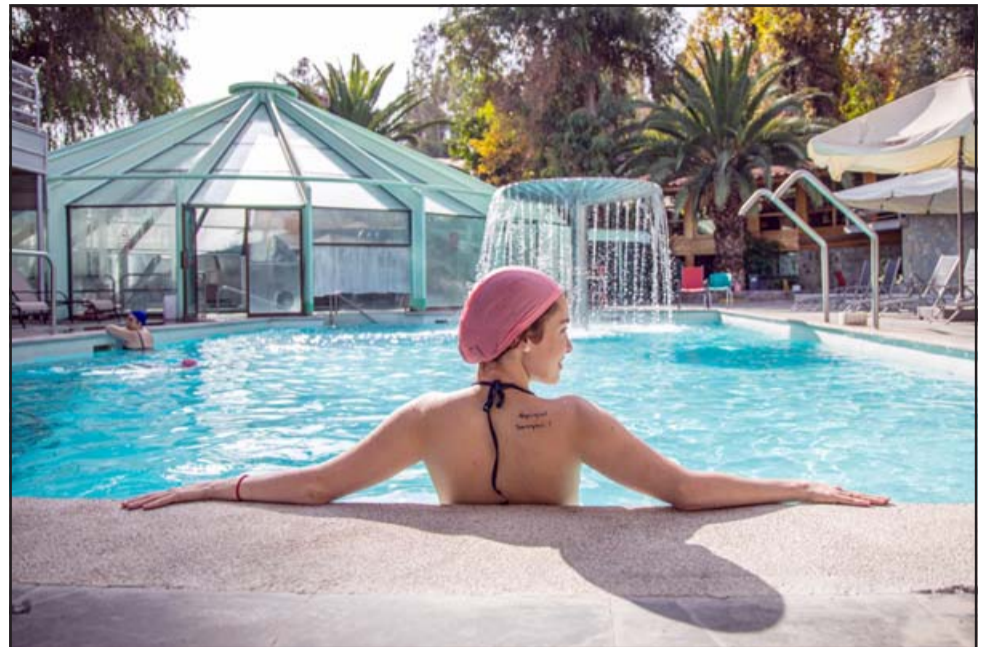
El establecimiento cuenta con tres piscinas de aguas termales que encantan a sus pasajeros.