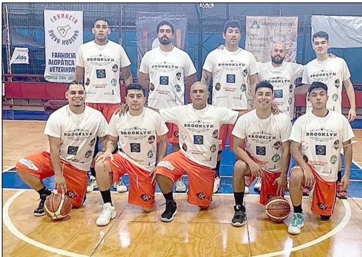
En la despedida de la actual temporada, el equipo del Prat venció al Árabe porteño.