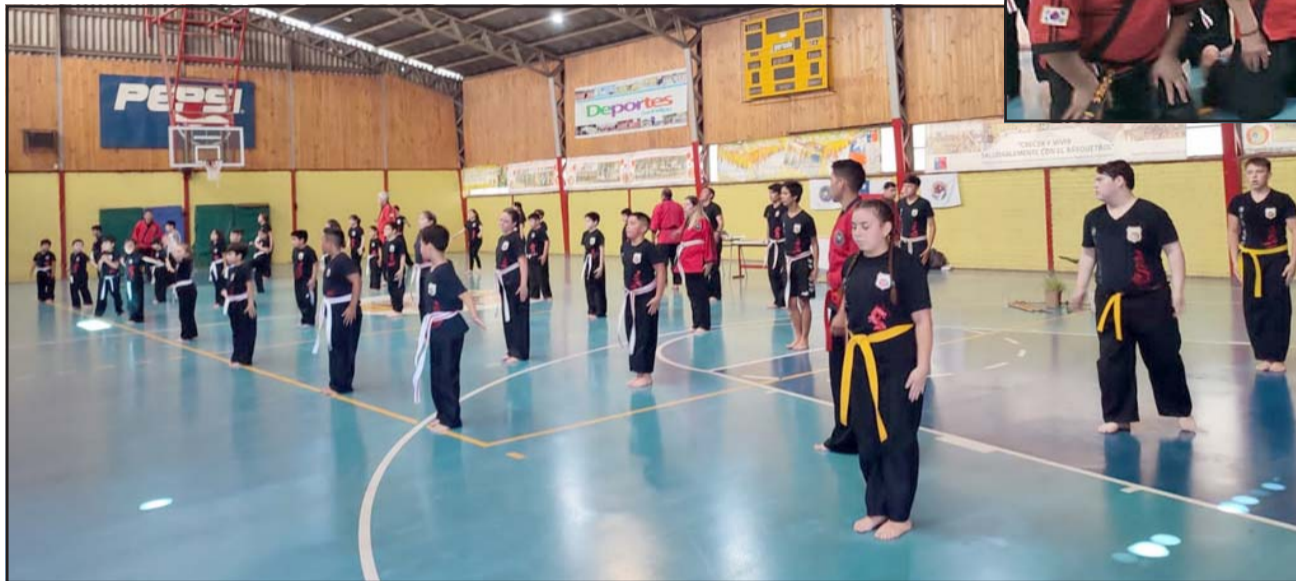
Los alumnos en posición de rendir el examen de cinturón blanco y de cinturón amarillo a naranja.