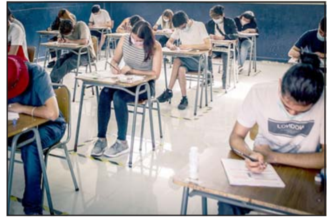
Este lunes comenzó el proceso de rendición de la Prueba de Transición, el que se extenderá hasta este viernes. (Foto de archivo)

Finalmente, y en el ámbito de los plazos para la entrega de resultados y postulaciones de cada estudiante, la docente aclaró que «respecto de las fechas para los resultados aún no hay claridad de parte del Demre, pero estimamos que podría ser la primera semana de enero».