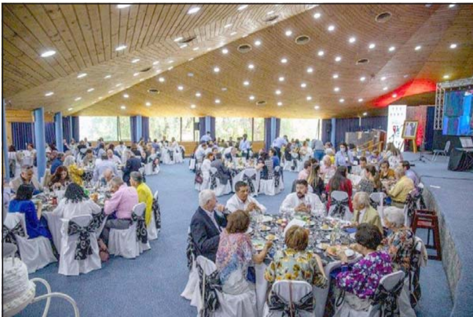
Cientes y altas autoridades comunales y regionales durante la celebración de los 75 años de existencia de Termas El Corazón .