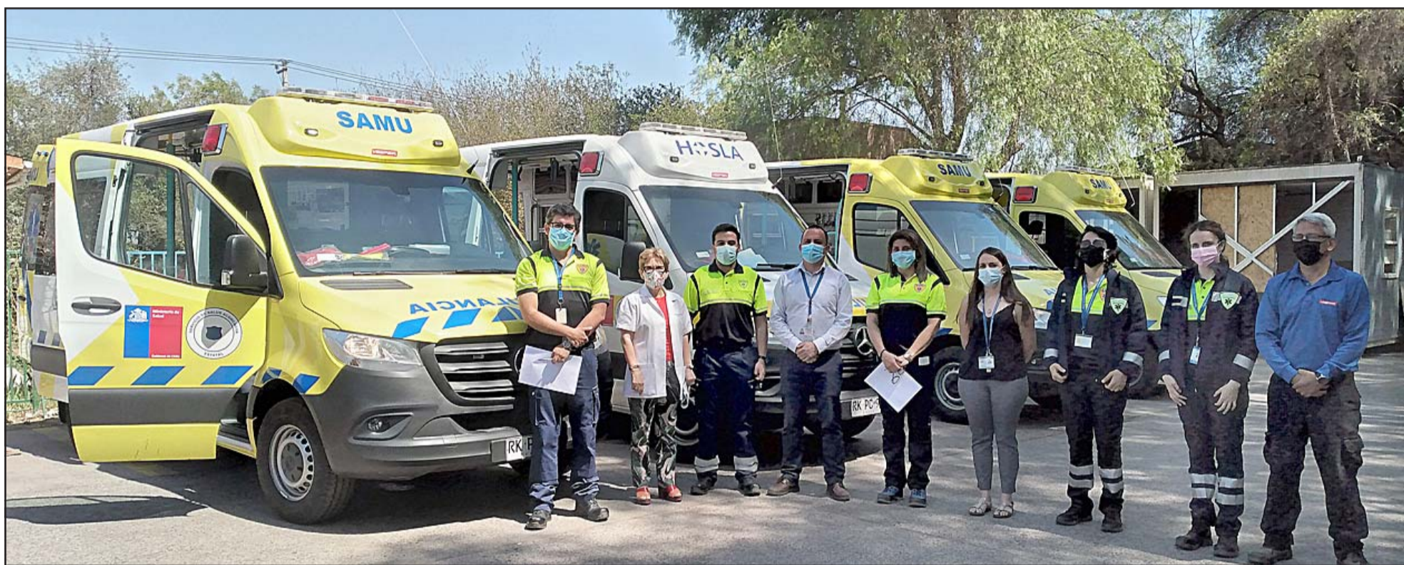
Las cuatro nuevas ambulancias ya están a disposición de la red de salud de Aconcagua.

Boisier detalló finalmente que «actualmente tenemos 16 ambulancias en funcionamiento, de las cuales 12 son básicas y 4 avanzadas. Son de última tecnología y con esto la población de Aconcagua puede estar tranquila porque contamos con todo lo que se requiere para salvar vidas».