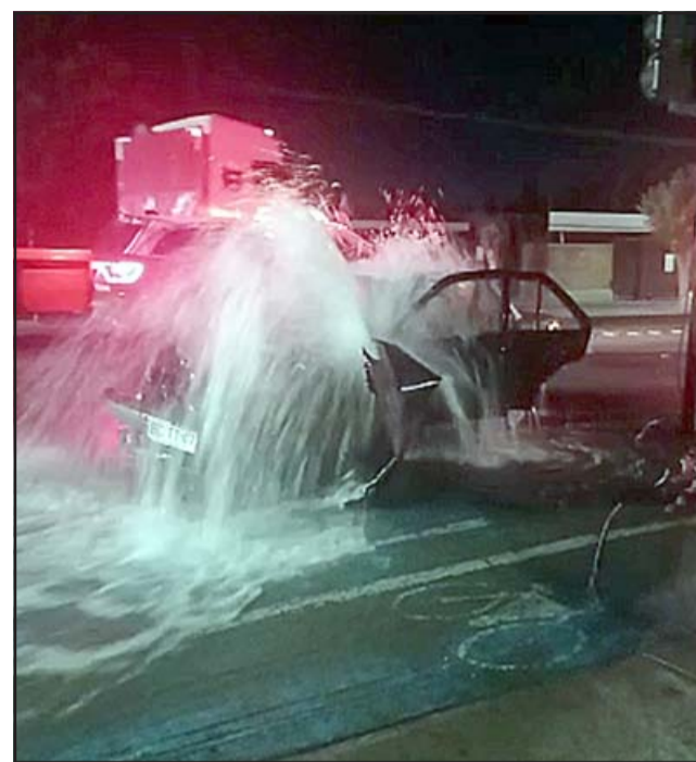
El auto negro incrustado en el grifo frente al supermercado A Cuenta de Avenida Maipú.