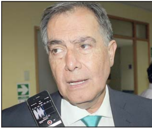
Christian Beals vuelve a ser noticia

Medida busca impedirle ejercer cargos públicos