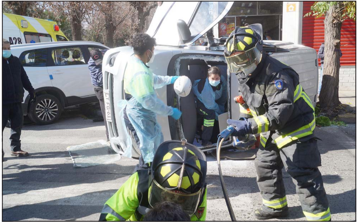
ELLOS EN ACCIÓN.- Los bomberos sanfelipeños no han dejado de atender las emergencias en nuestra provincia pese a cuarentenas y pandemia.

- Bueno, decirle que con la dotación que tenemos del 95% de los carros al día hemos tratado de que la dotación de bomberos participe en todo lo que son las emergencias, ya sean de rescate, vehicular, casas o forestal, ya los bomberos siguen. No hemos dejado de salir a ninguna emergencia, ni cuando estuvimos en cuarentena por pan-