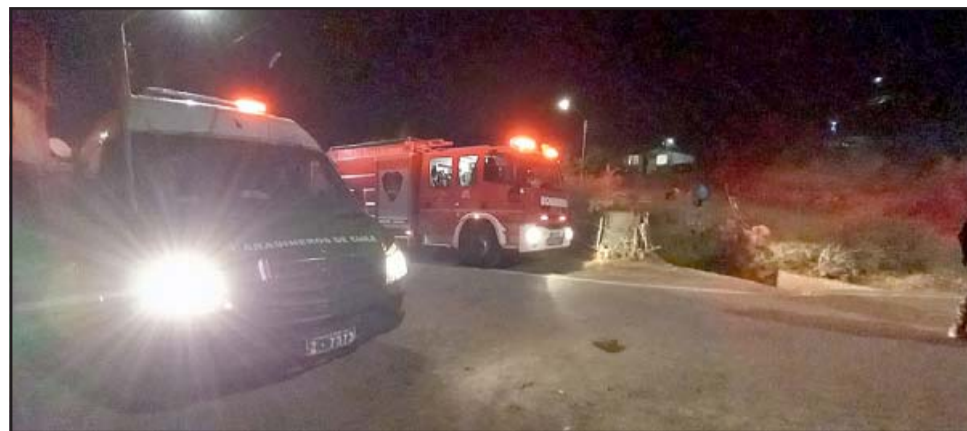
Carabineros y Bomberos de Putaendo presentes en el lugar, participando de la búsqueda del menor.

- ¿Qué te dijo el menor cuando lo encon-