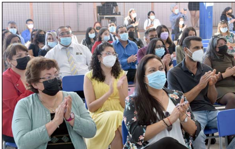
PADRES ORGULLOSOS. - Los apoderados del Corina Urbina aplaudieron a sus hijas por el éxito logrado este año, pese a la pandemia.