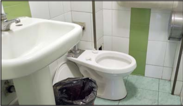
MEJORAS VISIBLES. - Los dos servicios higiénicos lucían limpios y en perfecto funcionamiento, muy diferente a lo que había hace unas dos semanas.