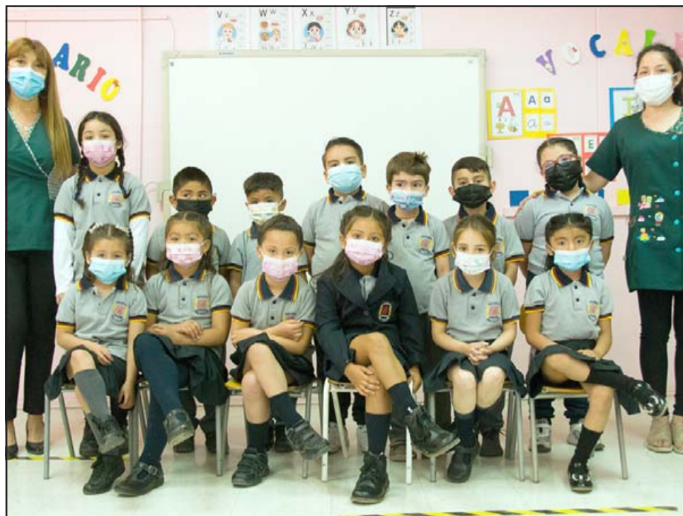
LO LOGRARON. - Estos son los pequeñitos de Kínder de la Escuela Bernardo O'Higgins, quienes el jueves salieron de curso, regresarán en 2022 a primero básico.