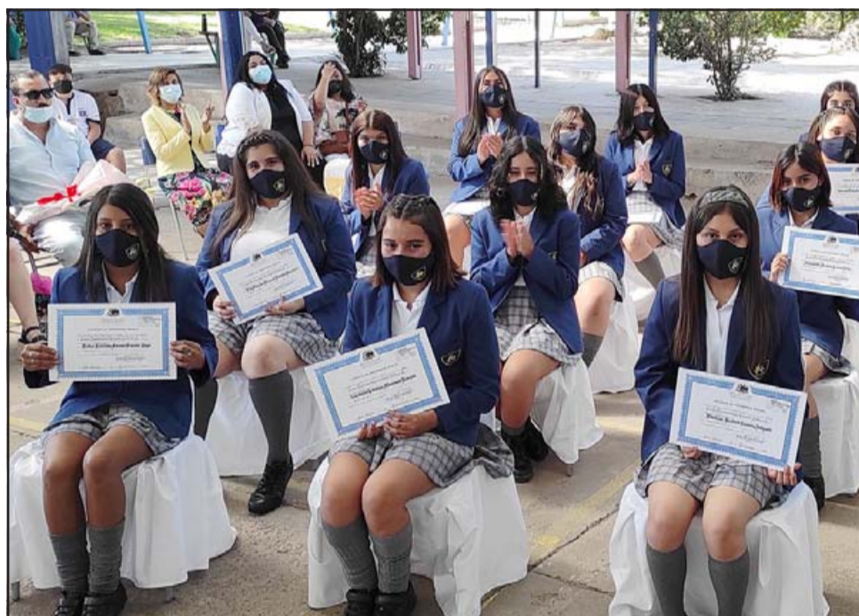
SIEMPRE EL CORINA. - Estas damitas egresaron de octavo básico y continuarán su educación media en el Corina Urbina.