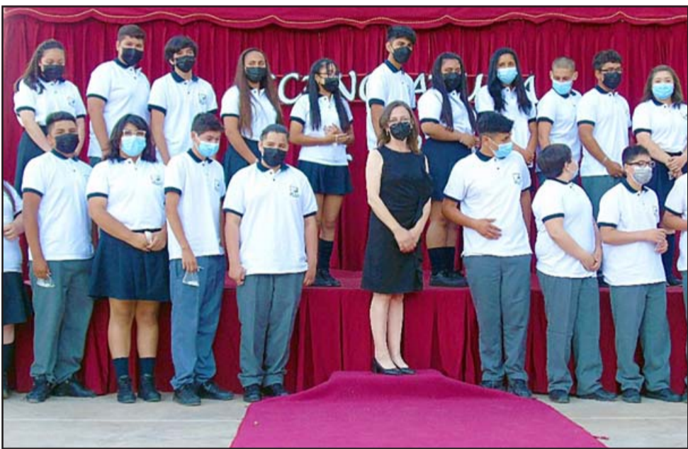
IMPARABLES. - Estos chicos pertenecen a la Escuela Almendral, en 2022 ingresarán a otras casas de estudio para continuar en la Media.