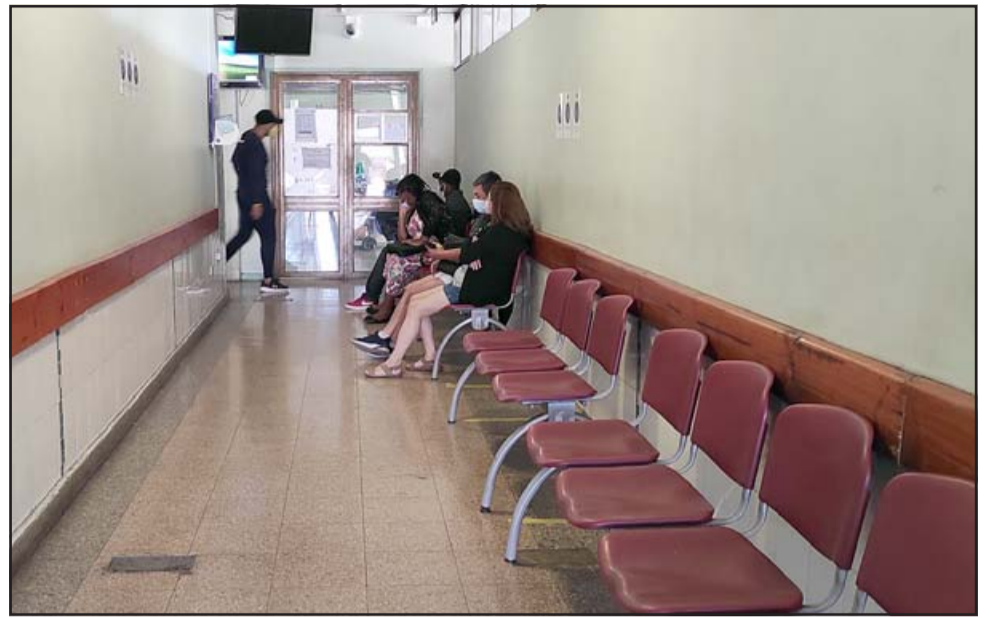
MENOS PRESIÓN. - Así lucía el pasillo principal en Urgencias del Hospital San Camilo, pocas personas esperando atención.