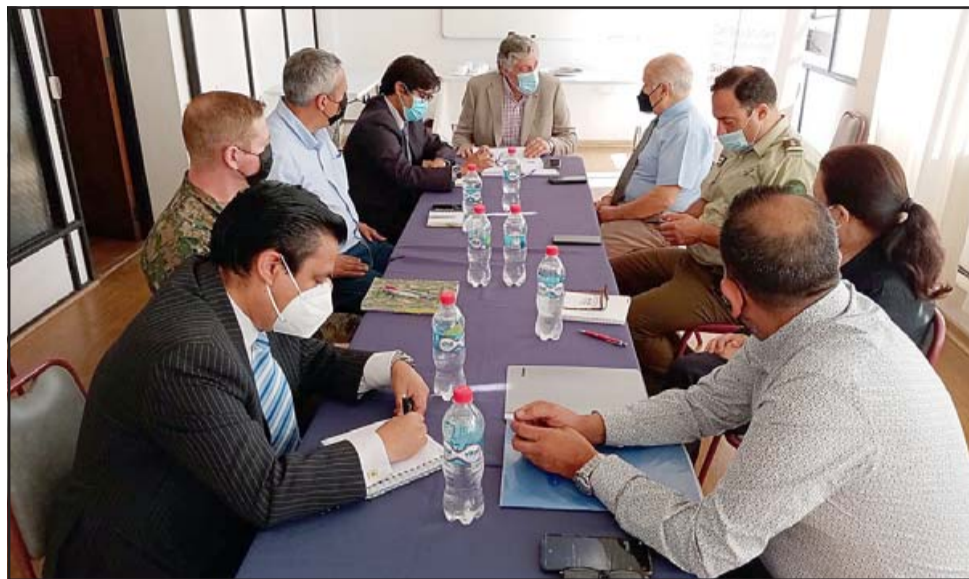
Autoridades políticas y policiales coordinan medidas para la elección presidencial de segunda vuelta de este domingo.

Respecto de alguna solicitud para alguna eventual celebración de la gente una vez ya conocido el resultado del domingo, Luksic sostuvo que «no hay todavía solicitud para alguna celebración ni tampoco para algún cierre de campaña