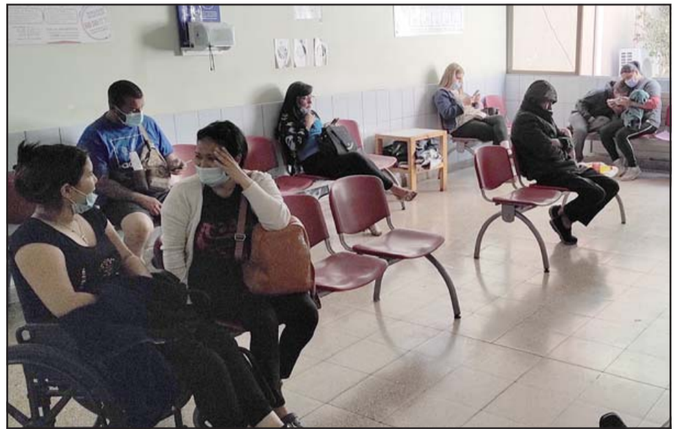
SEGUIREMOS OBSERVANDO. - En la sala de espera eran pocas las personas esperando a ser atendidas por los médicos.