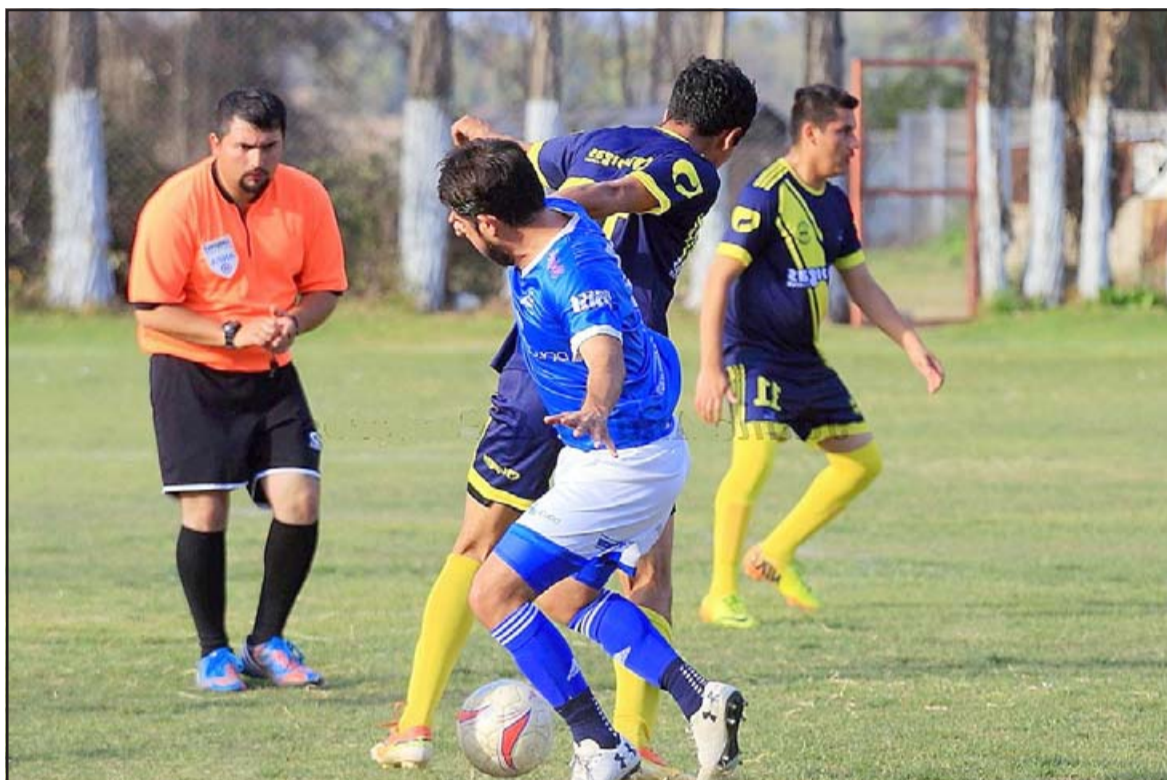
Hoy se definirá cuando se reiniciará el torneo de la Afava.