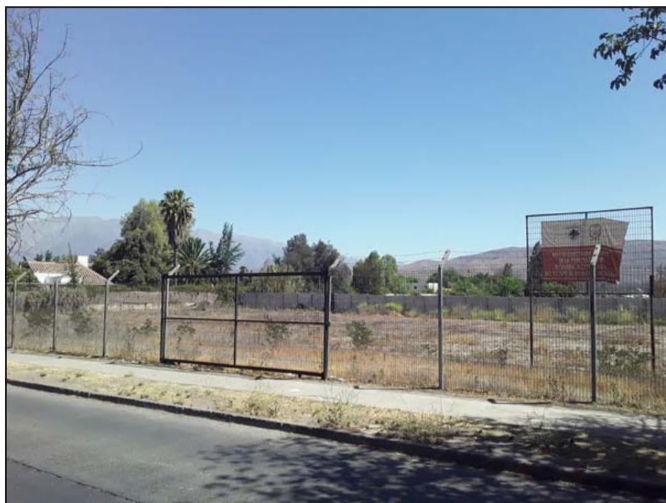
Acá debiera estar instalado el nuevo cuartel de la Primera Compañía de Bomberos en la Avenida Miraflores.

- Lo que pasa es que nosotros estamos en la etapa de diseño, tú sabes que no es llegar y generar un cuartel donde estamos hablando sobre mil millones, estamos en la primera etapa, una vez teniendo el terreno vamos a la segunda etapa que ya se ha conversado con los consejeros regionales