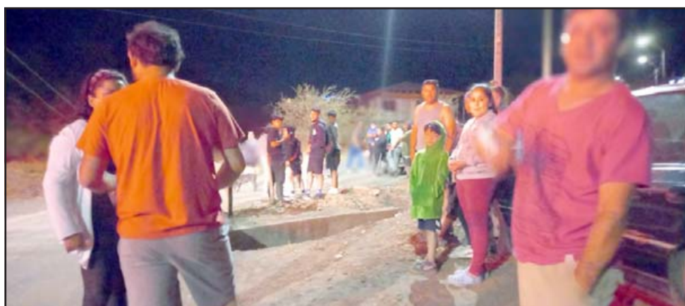
Vecinos de Las Coimas colaboraron solidaria y espontáneamente en la búsqueda del menor.

Cabe destacar que en la búsqueda del menor participó personal de Bomberos, Carabineros y más de 50 personas.