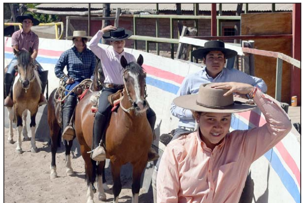
NUEVAS ESTRELLAS.- Estos chicos son de Calle Ortiz, Bellavista, Calle El Río y 21 de Mayo, debutarán la tarde del sábado 15 de enero.