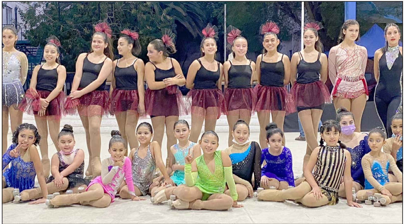
PATINAJE ARTÍSTICO. - Ellas son parte de la gran comitiva de la Academia de Patinaje Artístico Renacer, alberga a niñas entre los 4 y 16 años de edad.