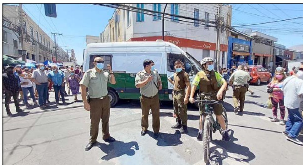
Personal de Carabineros en la intersección de Traslaviña con Prat donde se desarrollaron los incidentes.

De todas maneras el hecho causó gran expectación en el lugar, porque esa intersección es muy concurrida a toda hora, principalmente al medio día y a días de Navidad.