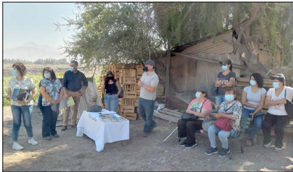
Agricultores y funcionarios municipales conociendo los beneficios del Sorgo.