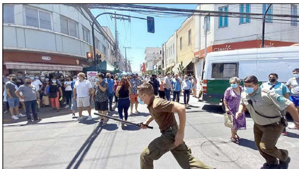
Carabineros sale corriendo en busca de las personas que participaron en la riña.