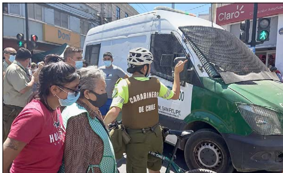
En el lugar se produjo bastante conmoción ya que al ser detenidos los involucrados en la riña, algunos comerciantes se enfrentaron a Carabineros.