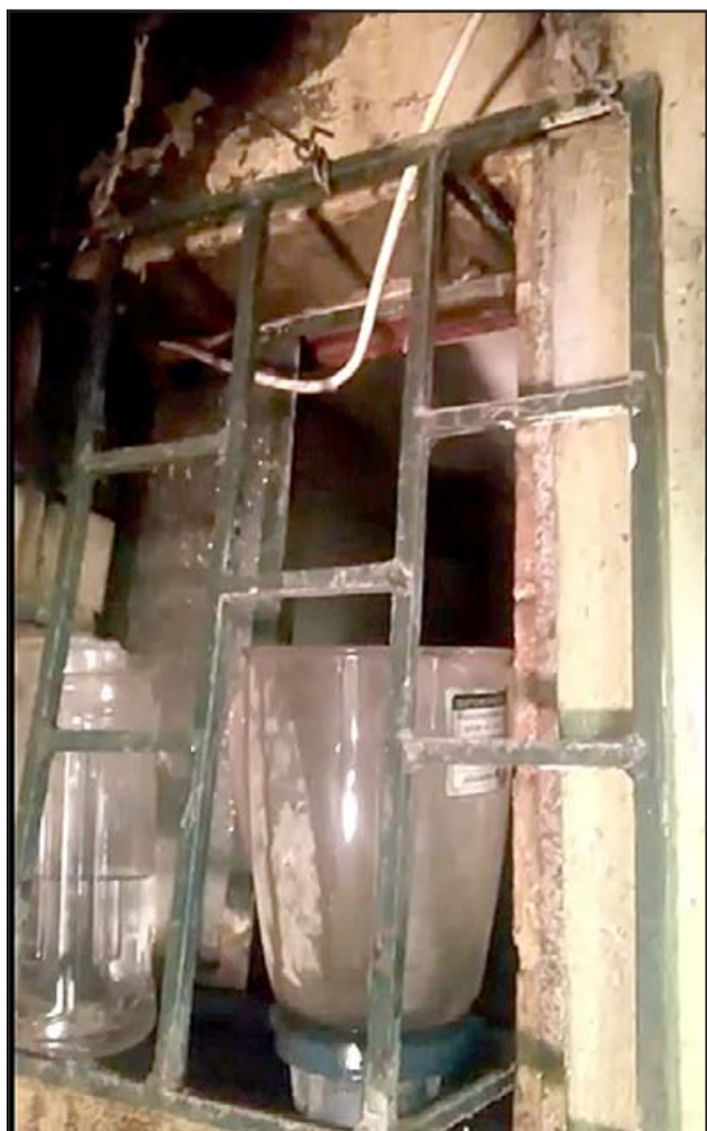
Acá una imagen del daño que provoca la gotera que cae constantemente y destruye la pintura y debilita la pared.

Finalmente reflexiona comentando que no sabe qué hacer, no sabe dónde ir para encontrar una solución que le aqueja por dos años.