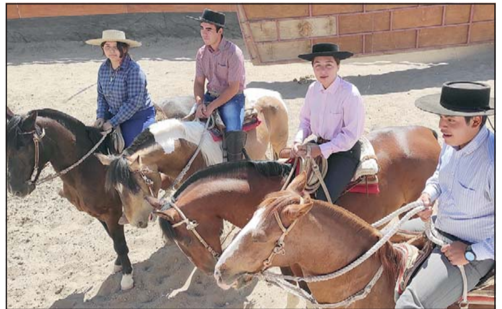
CUANDO CREZCAN.- Estos jóvenes corraleros de seguro que nos estarán deleitando muy pronto con sus desfiles de huasos.