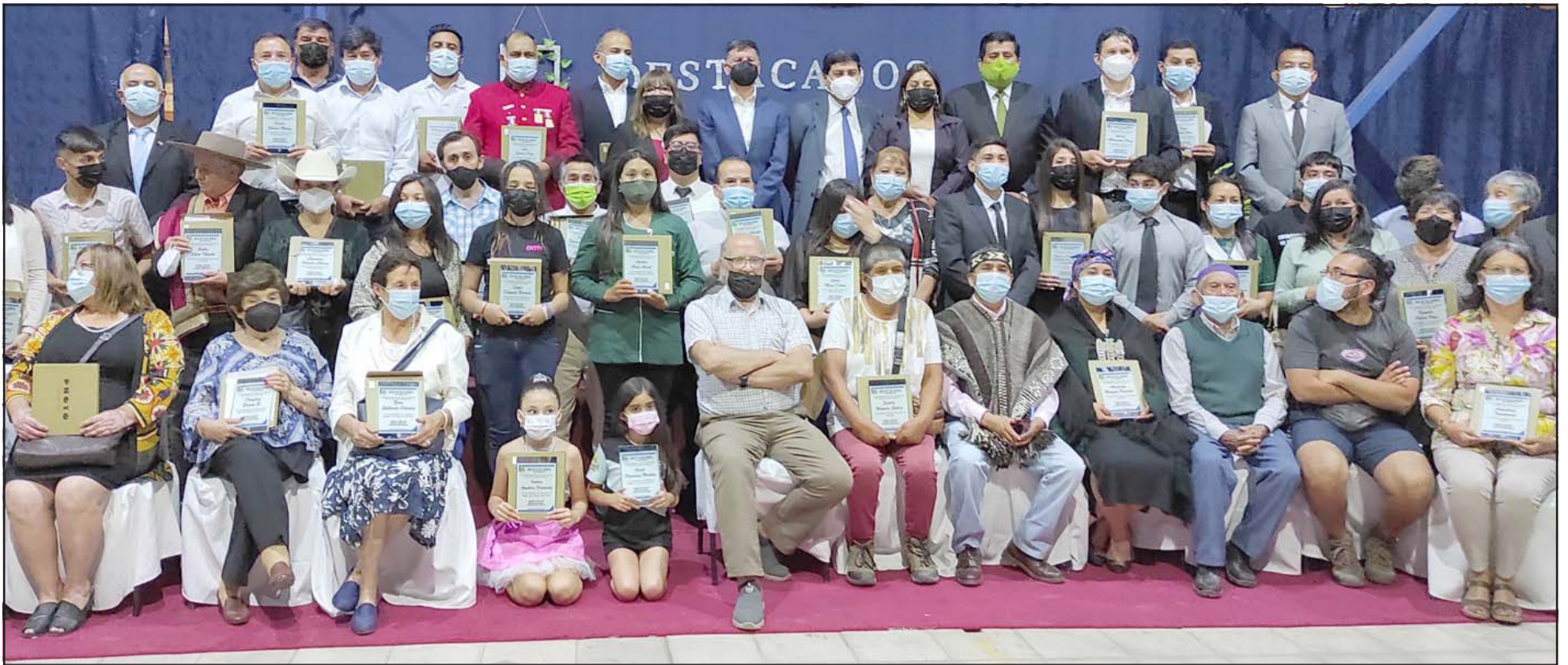
LOS MEJORES DEL AÑO.- En esta gráfica panorámica vemos a la mayoría de santamarianos que fueron destacados por el Municipio la noche de este lunes en el patio techado del Liceo Bicentenario Darío Salas.