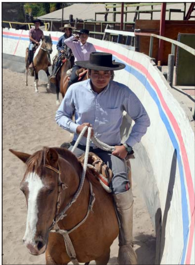
GRACIA Y JUVENTUD.- Las cámaras de Diario El Trabajo captan el ensayo de estos jinetes la mañana de este martes en la medialuna de Bellavista.