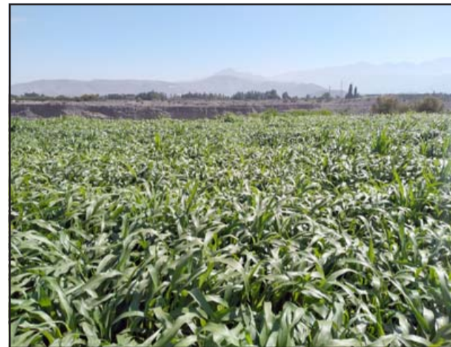
Plantaciones Sorgo en las tierras de don Evaristo Estay.