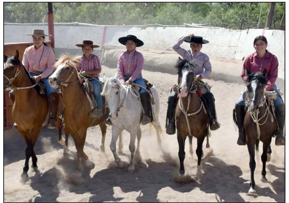
SANGRE JOVEN.- El Grupo Escuadra Ecuestre Pequeños Corraleros, debutarán con la presentación de sus jinetes juveniles este sábado 15 de enero de 2022 en la medialuna de Bellavista.