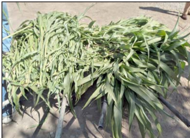
Sorgo recién cosechado y listo para ser el alimento de los animales.