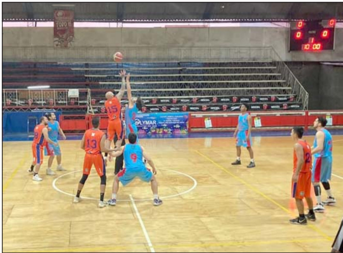
La rama de baloncesto del Prat hará dos torneos durante enero de 2022.

La rama cesterá del 'club del marinero' se ha puesto como objetivo tener un 2022 cargado de acción, y por lo mismo es que para la primera semana del mes de enero y como aperitivo al 'Juan Arancibia', organizarán un cuadrangular para las series Adulto y Sénior, evento que todavía no tiene equipos confirmados.