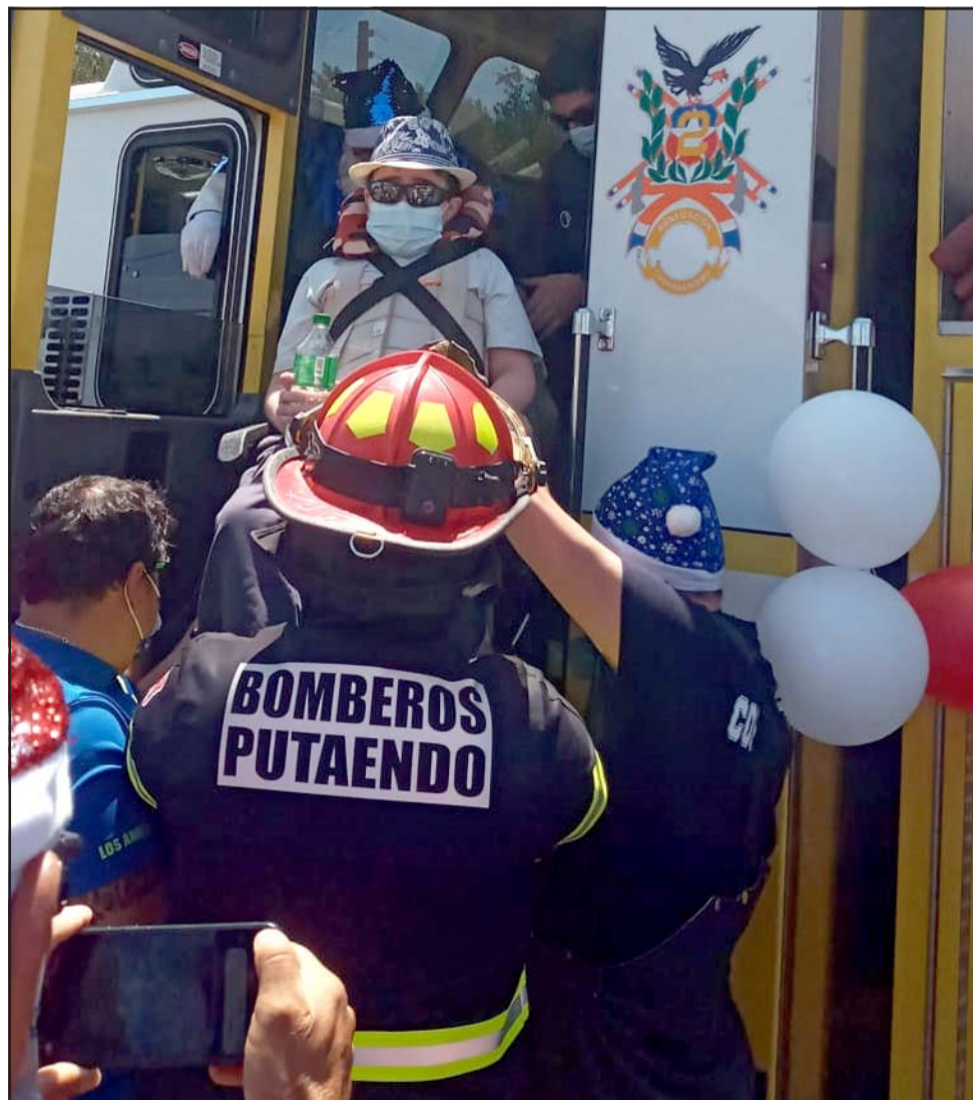
Como brigadier, Ítalo también se subió al carro de bomberos.