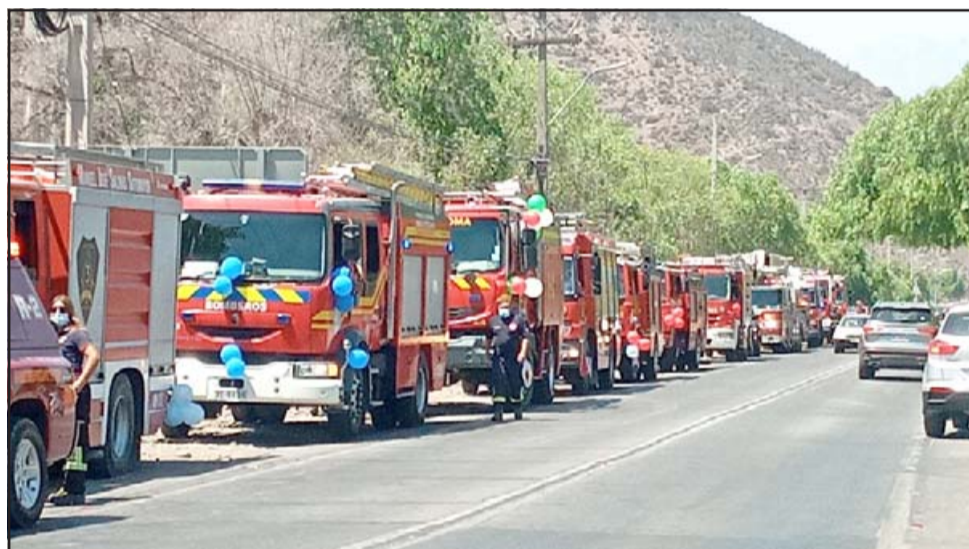
Más de cien bomberos y 20 carros llegaron al lugar para darle este reconocimiento al pequeño Ítalo, de 8 años de edad, cuyo deseo era ser bombero.