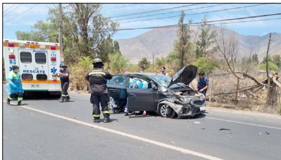
La colisión fue considerada de alta energía, según Bomberos. Afortunadamente ninguno de los heridos fue de gravedad.