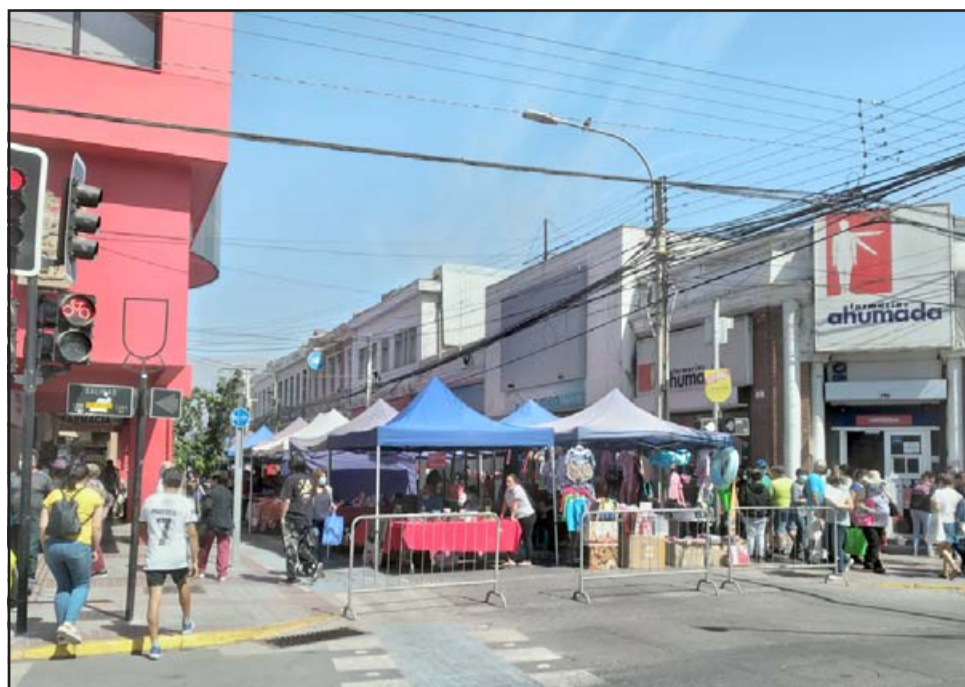
Cierre de calle Prat fue autorizado sólo hasta el pasado 24 de diciembre y se evaluará durante el día de hoy si se mantiene la medida por esta semana.

Medida que funcionó de buena manera durante la