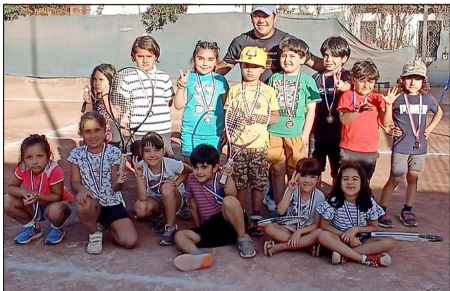
Los niños(as) de la ciudad tendrán como opción la Escuela de Verano o los talleres formativos para aprender y jugar tenis.