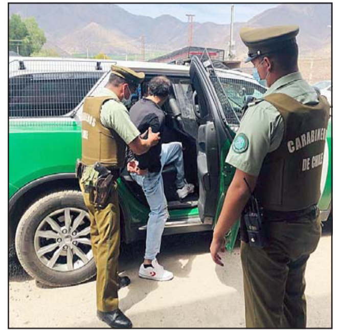
El imputado subiendo al carro policial custodiado por personal de Carabineros de San Felipe.

Aparte de la detención del sujeto, personal policial efectuó un registro de la casa con el fin de encontrar la bicicleta robada y el arma de fuego para herir a la víctima, lamentablemente esa diligencia no tuvo resulta-