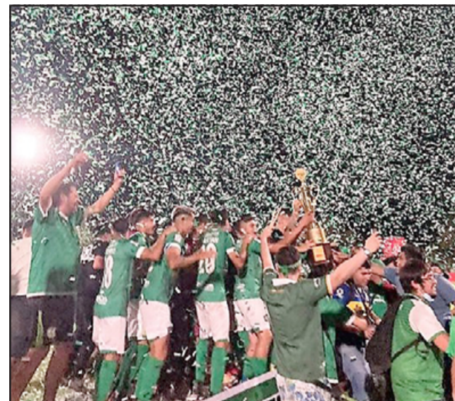
Los andinos levantan la copa que los acredita como el mejor de la Tercera División A.

Del partido mismo se puede decir que este tuvo los típicos condimentos de un pleito de la Tercera división, donde se corre y raspa mucho, pero en la que se hacen diferencias en lo táctico; fue precisamen-