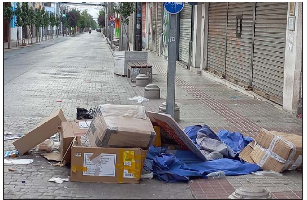
Imágenes como esta es la que se pretende evitar, por lo que el llamado es a respetar el horario de recolección de basura.

Es por esto además que se pueden solicitar bateas por medio de las juntas de vecinos; «siempre se han dispuesto bateas en algunos sectores, dependiendo de las solici-