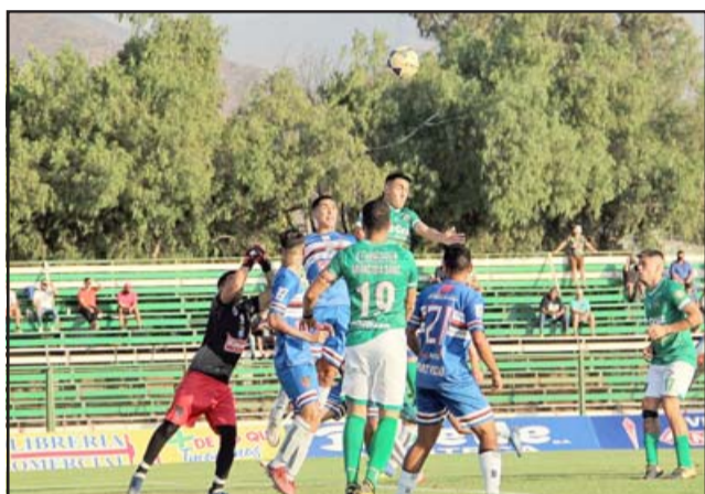
Jugadores de ambos equipos disputan un balón aéreo.

Con la compañía de sus seguidores más fieles y en un estadio Regional que en la antesala a Navidad lució notoriamente mucho más público del acostumbrado, Trasandino de Los Andes cerró una temporada brillante que coronó con un merecido título en la serie mayor del balompié aficionado chileno.