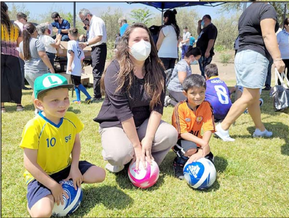
La alcaldesa Dina González Alfaro también compartió con los menores.

Niños y niñas de la Escuela de Fútbol Municipal de Calle Larga participaron de una jornada deportiva en las canchas del Instituto Agrícola Pascual Baburriza.