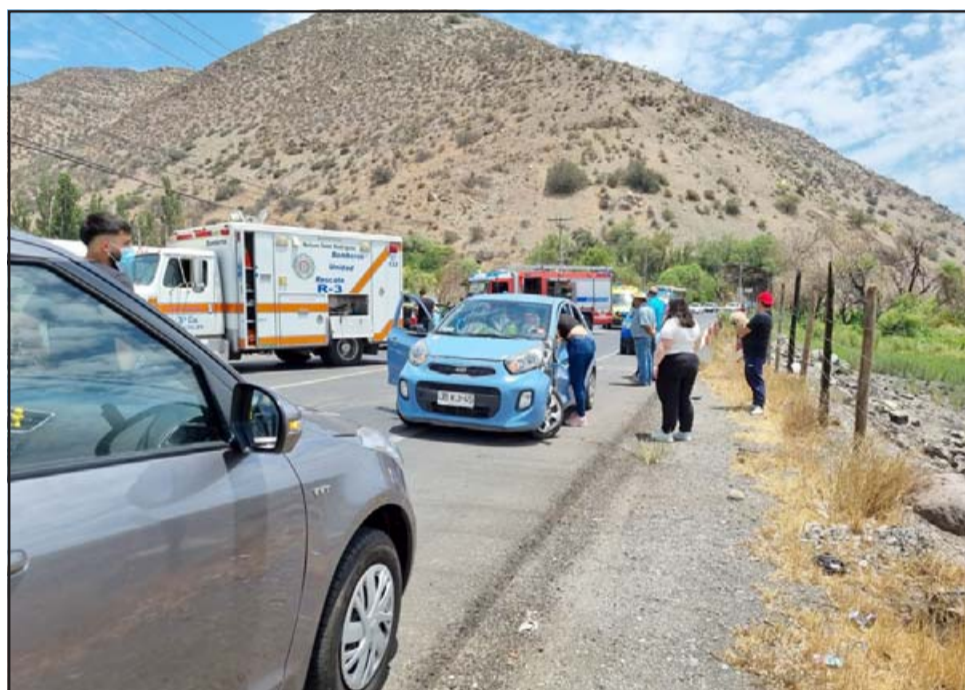
Cinco personas lesionadas dejó accidente de tránsito en el troncal 601 en Curimón.