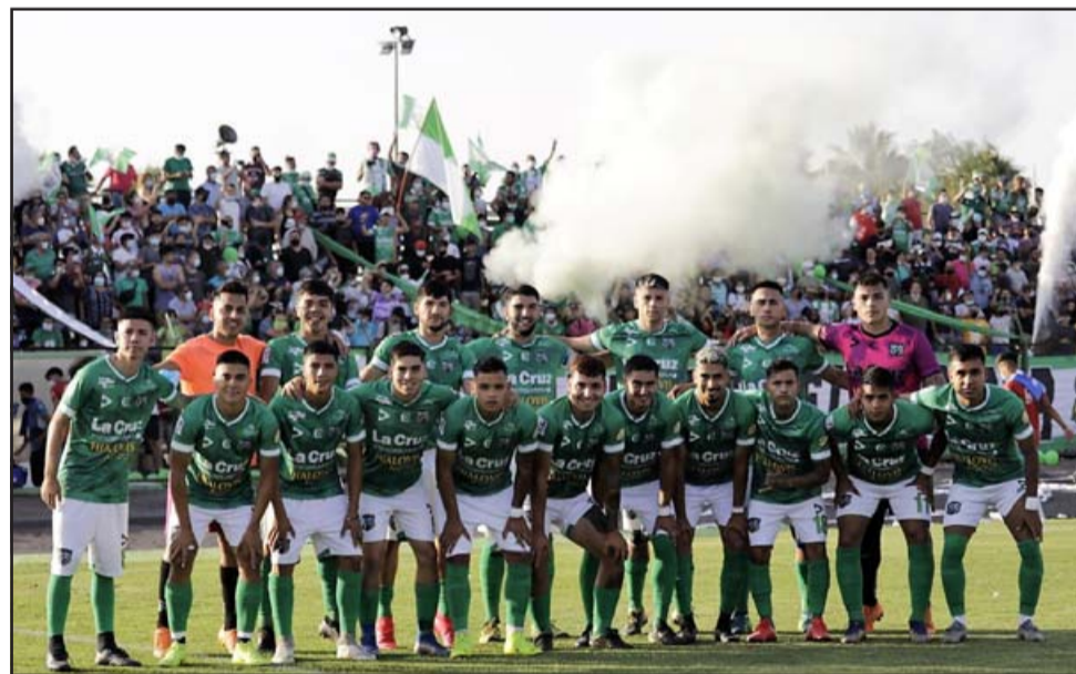
Trasandino celebró con su gente el ascenso a la serie de bronce del fútbol profesional chileno.