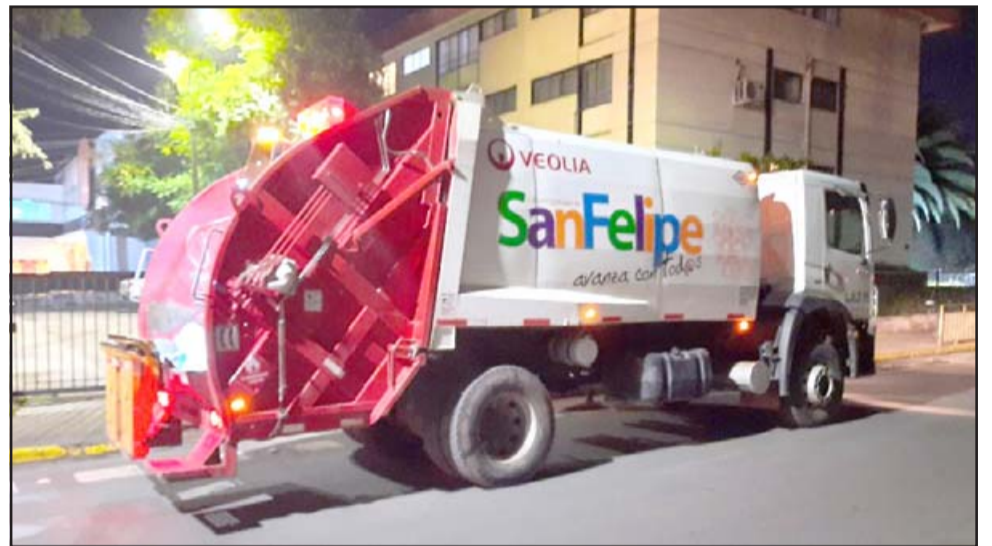
Este viernes el retiro se iniciará a las 5 de la tarde para que los trabajadores también lleguen temprano a sus casas y disfruten junto a sus familias.