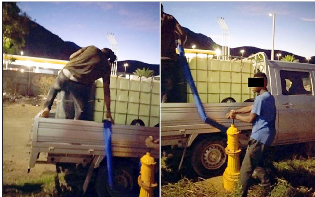
LOS MUY FRESCOS.- Acá vemos a estas personas robando el agua de esta población, las fotos las tomaron los mismos afectados.