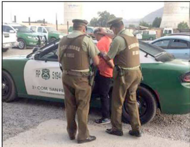
El imputado siendo trasladado por personal policial.

Se dio cuenta al fiscal de turno quien instruyó que pasara ayer en la mañana a control de detención en el Tribunal de Garantía de San Felipe para ser formalizado.