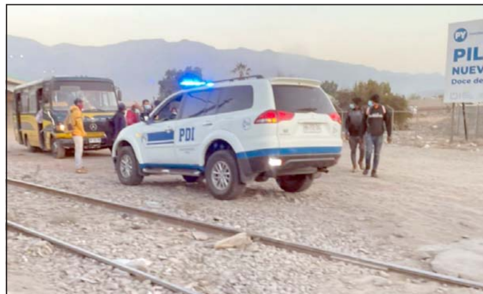
Personal de la PDI detuvo a seis ciudadanos extranjeros que están de manera irregular en San Felipe.

En este ámbito, el subprefecto indicó que «nosotros recopilamos la información en relación a sus declaraciones policiales, informamos al departamento de migraciones y es la autoridad administrativa quien resuelve una eventual expulsión o regularización de sus papeles, pero eso depende del ministerio del Interior».