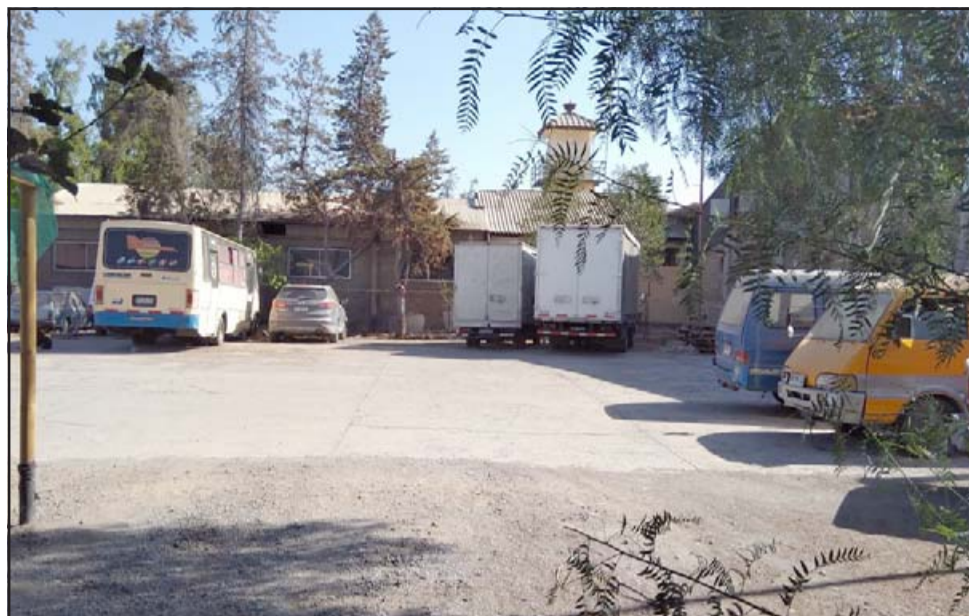
Vecinos del sector de Parrasía denuncian que su multicancha está siendo utilizada como estacionamiento desde hace años.