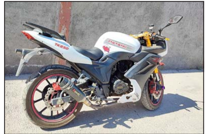
Esta es la moto que conducía el ciudadano venezolano.

Junto con lo anterior comprobaron que el conductor de la moto, de nacio-