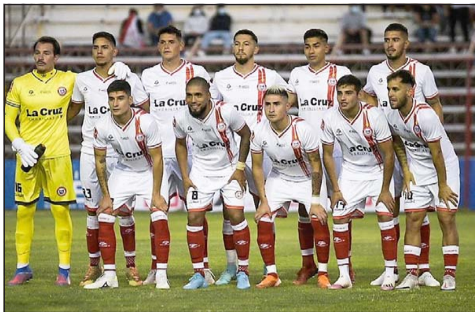
Unión San Felipe aprobó con nota azul en su estreno por el torneo 2022.