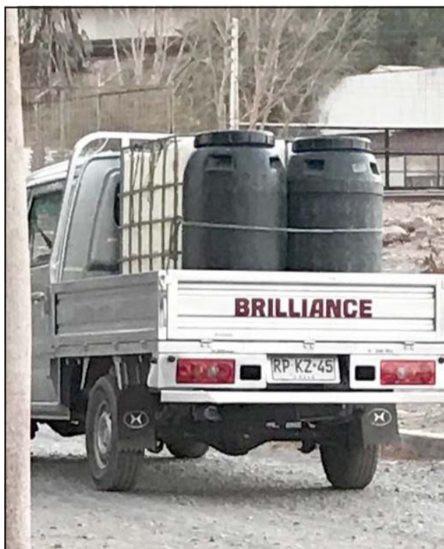
PATENTE RP KZ 45.- En este pequeño camión acarrean el agua, aunque a veces, aseguran los vecinos, llegan nada menos que con camiones cisterna.