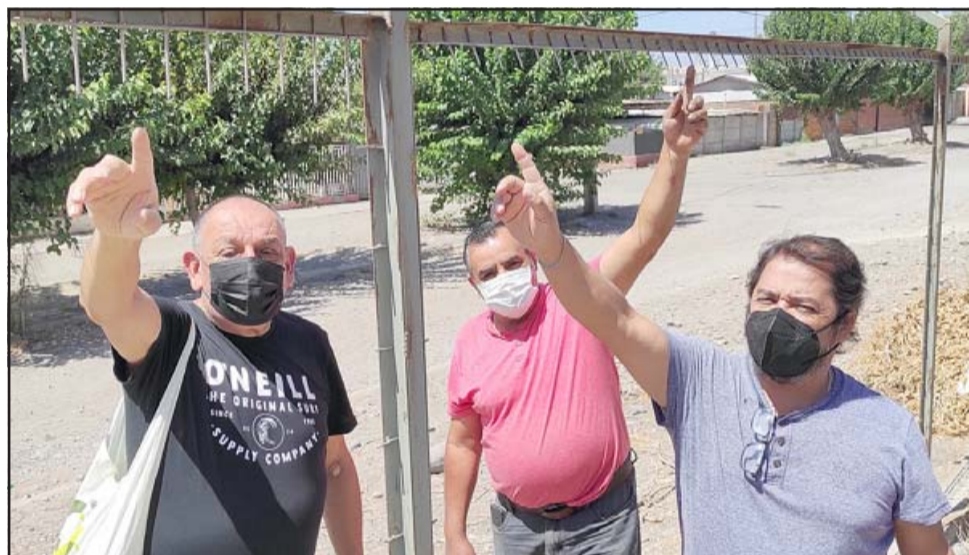
SIN RESPETO A NADA.- Los mismos vecinos nos muestran cómo la malla perimetral del terreno de la empresa Shell también fue cortada.