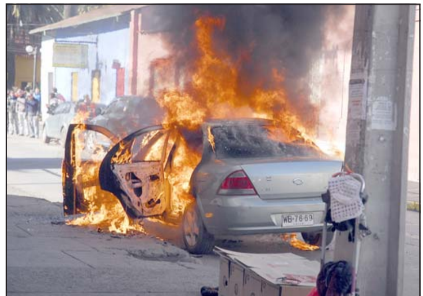
Este automóvil, obviamente robado, fue quemado ese día en la vía pública, frente a la sucursal bancaria, para crear confusión y facilitar el asalto.

El delito ocurrió a plena luz del día el 31 de mayo de 2017. Los delincuentes, para cometer el robo de cerca de 80 millones de pesos, incendiaron un vehículo en el frontis de la sucursal bancaria de calle Santo Domingo en San Felipe.