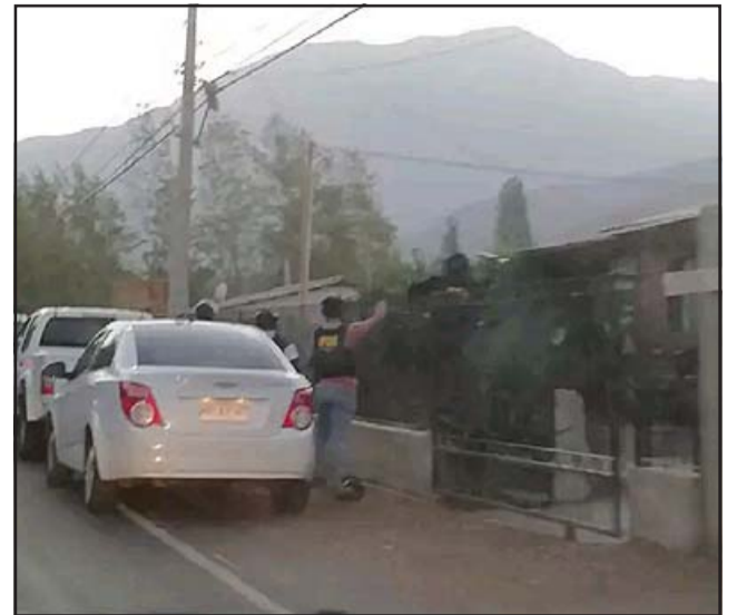
Personal de la Brigada de Homicidios de la PDI Los Andes, realizando diligencias en Calle José Antonio Salinas.

Al finalizar volvió a reiterar que desde el mismo