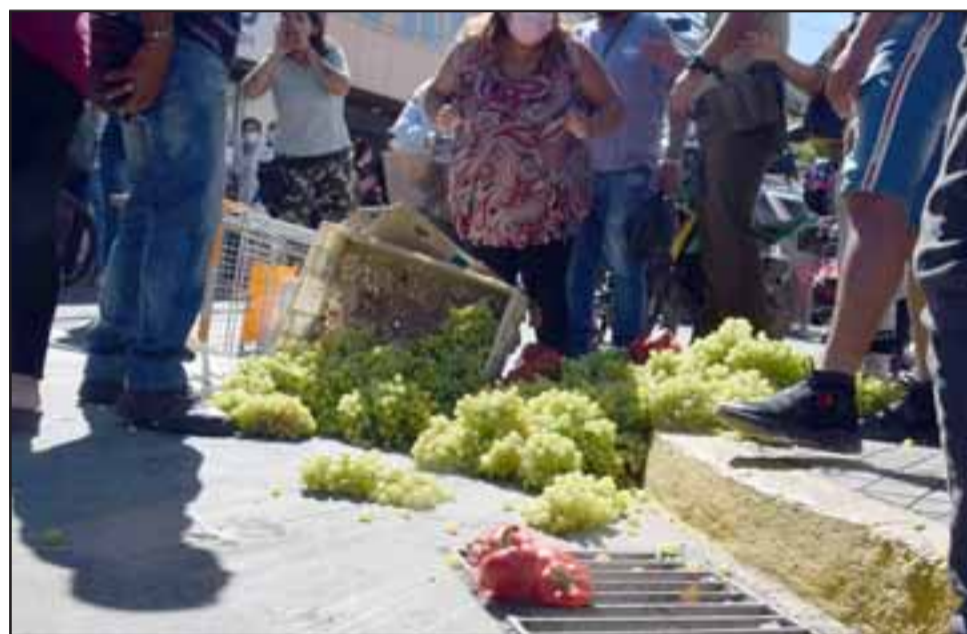
VERDADERO DRAMA.- Estas frutas no llegarán a la mesa de ningún sanfelipeño, ni dinero al hogar de quien las vendía.