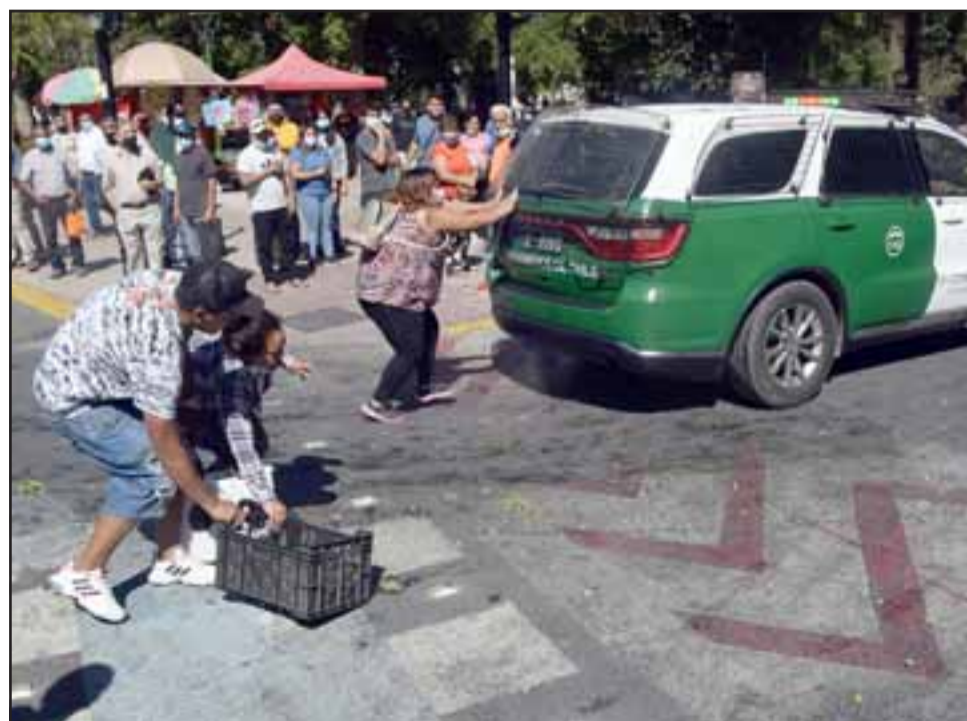
IMPOTENCIA TOTAL.- Al final de la jornada las cámaras de Diario El Trabajo captaron esta escena: Ella a punto de caer al pavimento y compañero vendedor que evita que caiga, mientras la patrulla se aleja del lugar.