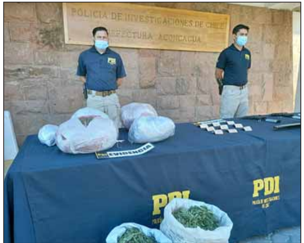
Una importante cantidad de droga y armas de fuego decomisó la Brianco de la PDI.

Junto con la droga decomisada, detectives de la Brianco además lograron