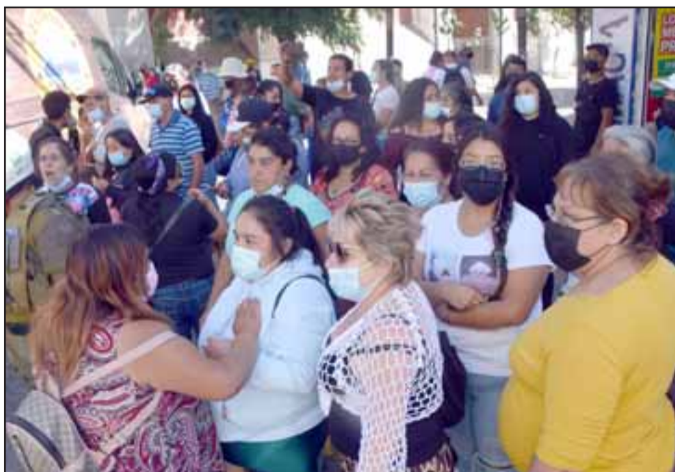
EL PUEBLO POR TESTIGO.- La gente estaba también muy molesta con el actuar de Carabineros y la forma violenta en que se desarrolló.