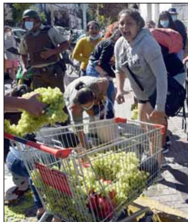
UN MAL DÍA.- Estos comerciantes no se fueron sin luchar, aunque perdieron toda su mercadería, de seguro que insistirán en mantener su fuente de trabajo.