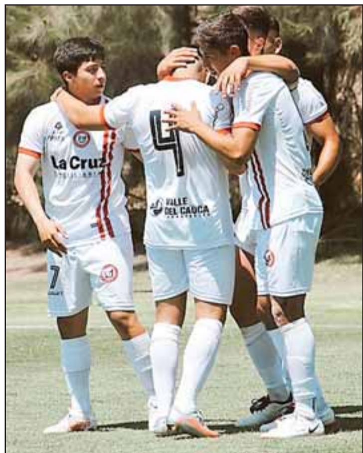
Muy pronto se producirá el debut de esta temporada para las series cadetes del Uní Uní.

El profesional es claro en todo caso respecto a que «siempre hemos creído que para poder contar con un buen futbolista es fundamental formar una buena persona; con valores, eso facilita mucho que posteriormente sean buenos deportistas y profesionales para que alguna vez puedan llegar al primer equipo y de ahí puedan emigrar; esto es a largo plazo, por lo que se debe trabajar con mucho profesionalismo y paciencia», finalizó.