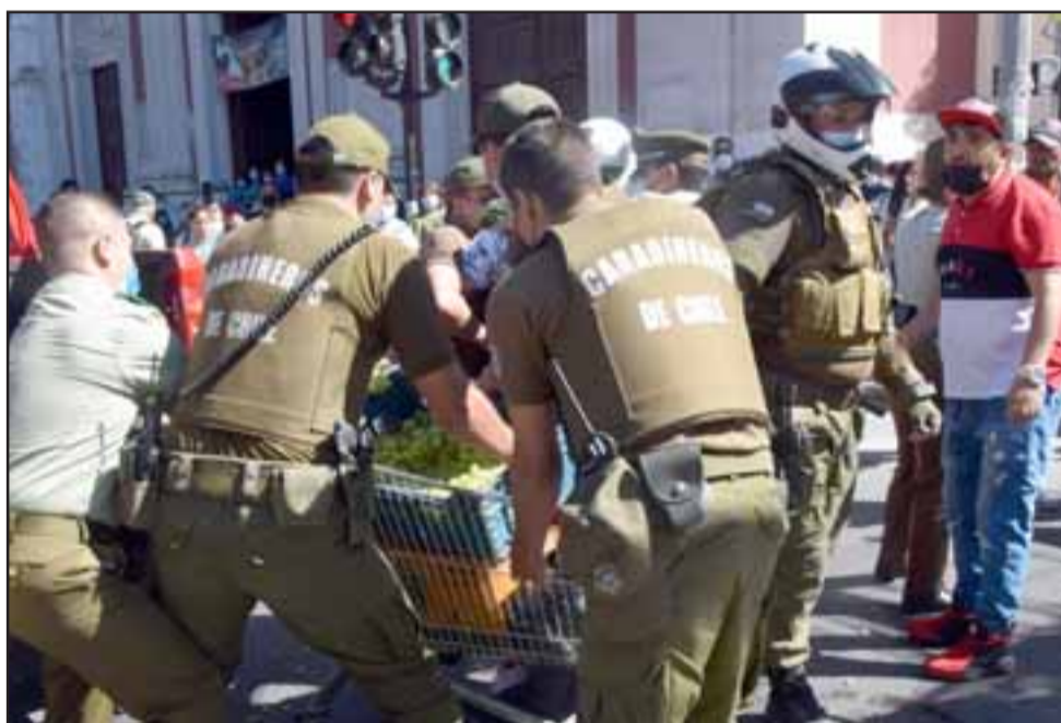
POR LA FUERZA DE LA RAZÓN.- La fuerza policial fue superior a la de mujeres embarazadas y curiosos en el lugar, al fin de cuentas los carabineros sólo cumplen órdenes del Municipio.