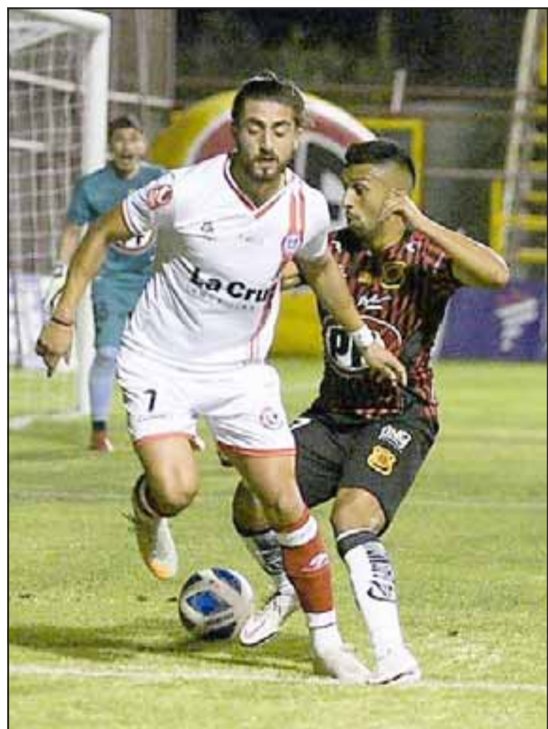
Los sanfelipeños ahora como visitantes intentarán repetir todo lo bueno que hicieron en el debut.