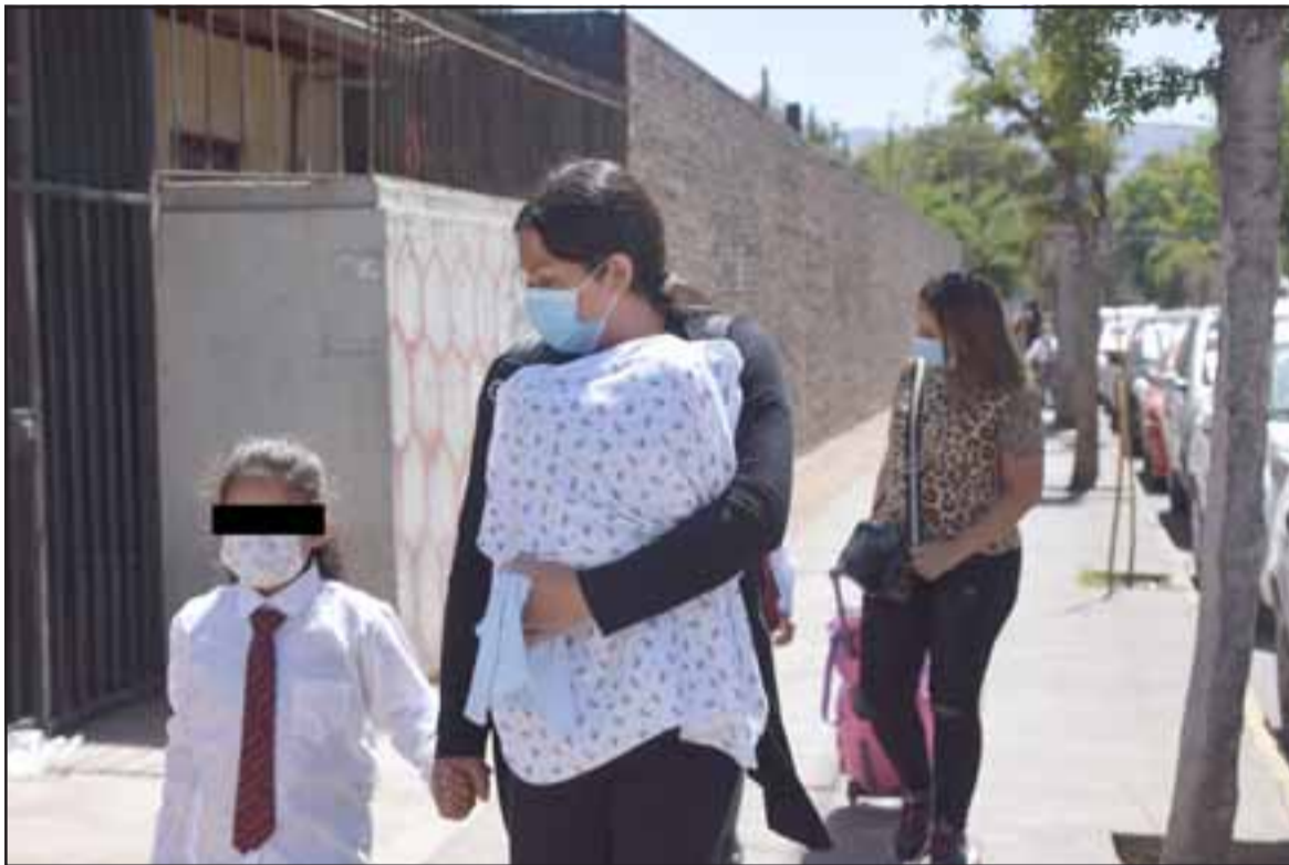
TIC TAC...- Diariamente caminan debajo de esta palmera cientos o miles de personas, muchos de ellos niños.