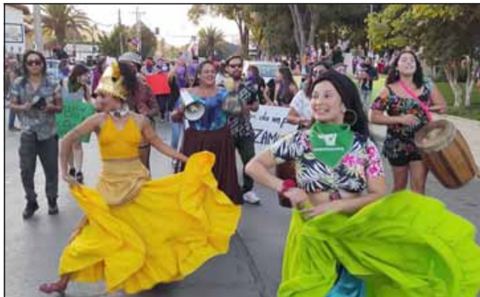
BELLAS MUJERES.- Las céntricas calles de Santa María se cubrieron la tarde de este martes con cientos de mujeres al ritmo de comparsa y alegría.