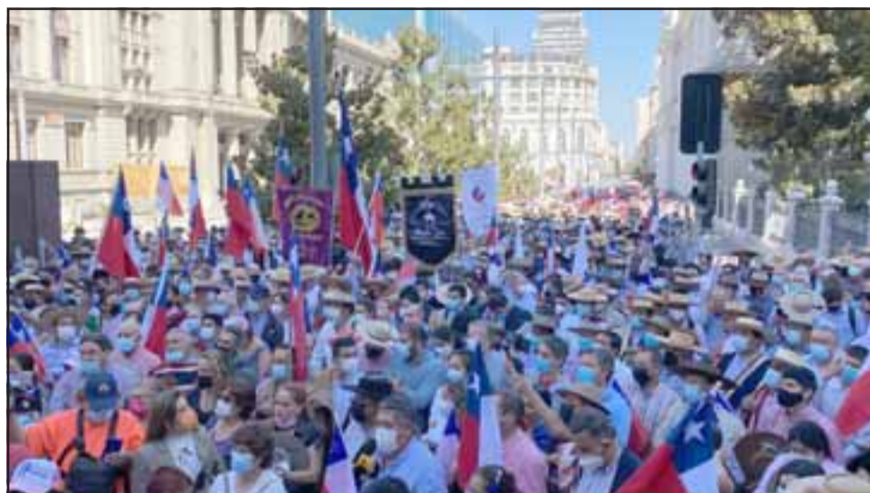
En la imagen gran cantidad de huasos participando de esta masiva manifestación en el Ex-Congreso en Santiago.

la y difundirla. Cualquiera de los países medianamente ordenados consagran sus tradiciones. Las tradiciones son lo que le dan identidad a un pueblo, lo que nos diferencia a un pueblo de otro, y Chile tiene una riqueza cultural única y muy preciada y no estamos dispuestos a que algunos constituyentes, en forma abusiva, nos pasen por encima. Así es que el día de hoy (ayer) hemos juntado más de dos mil personas en el kilómetro cero, al lado de la Plaza de Armas a las afueras de la Convención Constituyente, el Ex-Congreso Nacional, para manifestarnos. Para manifestar pacíficamente como siempre lo hemos hecho en todas las marchas. De cien marchas que se han hecho a lo largo de Chile, no ha habido ningún desmán y esta no fue la excepción. Esperamos que los constituyentes cambien el rumbo y nos den el espacio para conversar, a escuchar nuestras propuestas. Nosotros sabemos que en algunas cosas necesitamos regularlas o perfeccionarlas, pero bajo ningún punto de vista estamos dispuestos a que los constituyentes vengán a prohibirnos nuestra chilenidad. Es curioso, pero hoy día, estando dentro del palacio de la Convención Constituyente, no vi ninguna bandera chilena, vi