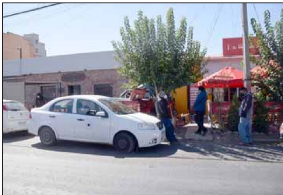
Desde este otro ángulo se puede apreciar a ambos vehículos involucrados en el accidente.