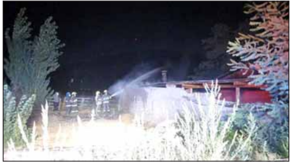
Rápida respuesta de Bomberos impidió que el fuego consumiera una vivienda en su totalidad.

Respecto de las causas del incendio, el relacionador público indicó que « la investigación la está