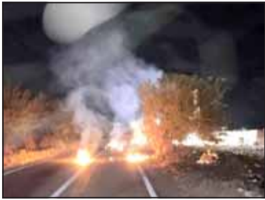
Malestar en El Asiento