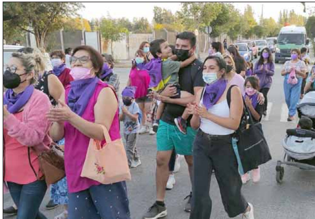
A LAS CALLES.- Familias enteras y mujeres de todas las edades marcharon con alegría en las calles de Santa María.