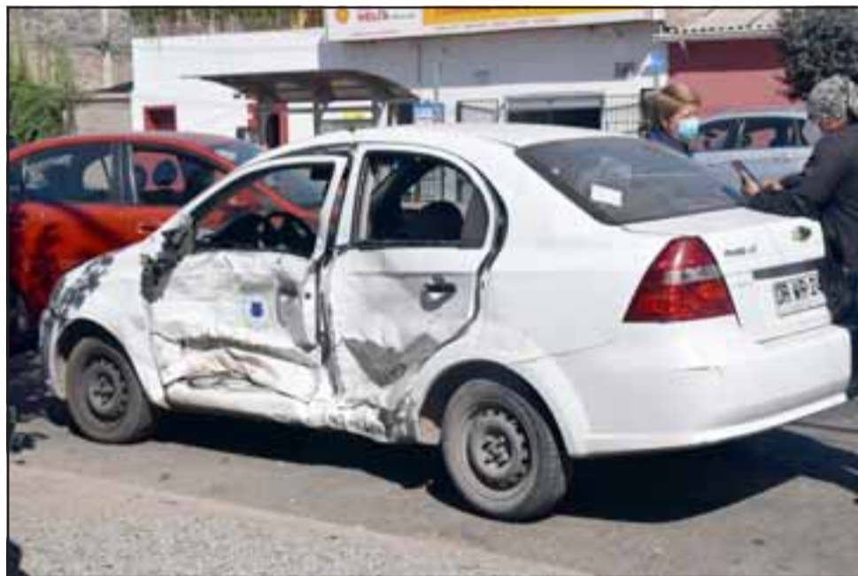
El otro automóvil involucrado pertenece a la municipalidad de Santa María, el cual transportaba a personas que acuden a dializarse.