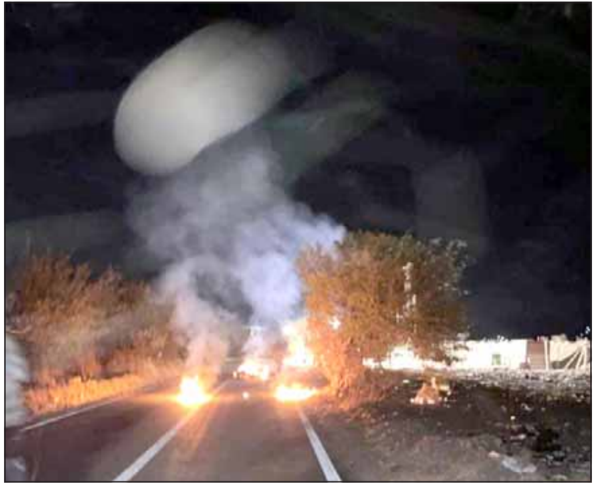
Vecinos manifestándose en el sector El Asiento.

- Por supuesto, si usted revisa la historia, todos cuando hablan de la historia de la revolución francesa por ejemplo, la causa fue el hambre en la comunidad de Paris, eso motivó a la gente que no tenía nada que perder, a manifestarse abiertamente y eso cambió todo el parámetro de la visión del mundo con la declaración de los derechos humanos y otras cosas más. Entonces yo no puedo más que decirle a las autoridades que esto es una franca provocación, porque la gente lo siente así, están manifestando el sentir de las personas, están porque yo he hablado con ellos, ver que los motiva, entonces no es una actitud sana, no es una actitud que a nosotros nos resulte agradable. Estamos hablando de un elemento vital, no solamente la vida de uno en el momento, sino que uno tiene que pensar en los nietos, en los hijos, en todo lo que se viene si pensamos como país perdurar por mucho tiempo, tenemos que hacer cosas que beneficien a nuestro país, a la gente de nuestro país, eso es lo que creo yo. Y en este caso esa actitud hostil que hemos sentido por parte de la DOH, porque ellos están detrás de esto, es un poco insensata porque si nosotros pedimos que nos muestren estudios para estar más tranquilos, no lo han hecho y quieren seguir adelante, por eso están trabajando de noche para evitar estas protestas. Yo personalmente no estoy incitando a la violencia, pero creo que aquí las personas han sido violentadas inicialmente y lamentablemente la violencia acarrea más violencia.