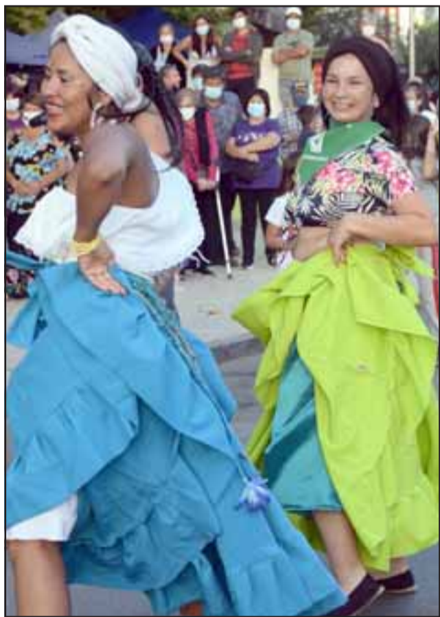
CADA DÍA MÁS FUERTES.- Hubo danzas de distintos países con sus respectivos atuendos, nadie quedó fuera de esta influencia cultural y artística.