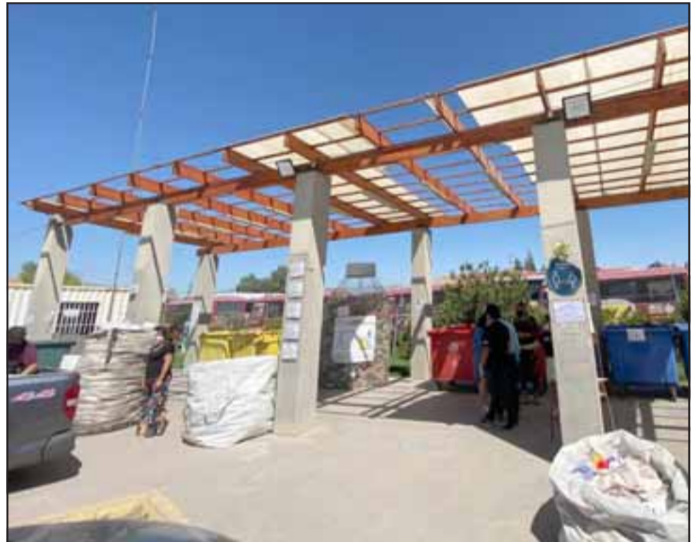
La Municipalidad de Los Andes cuenta con un Punto Verde abierto a toda la comunidad que se encuentra ubicado en callejón San Martín S/N.