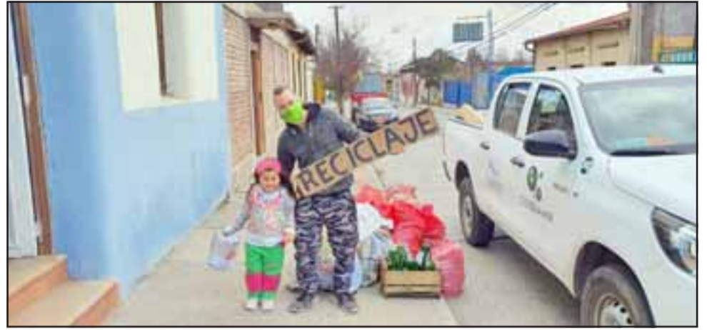
Cada día son más las personas que aportan al cuidado de nuestro maltrecho planeta reciclando su basura.