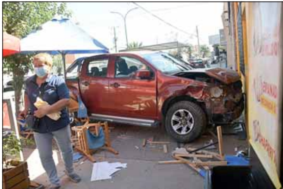
Chocando la muralla de una vivienda, así terminó una camioneta que protagonizó accidente en la Avenida Maipú. Por suerte no habían peatones.

Respecto de las causas del accidente, el mayor Ramírez señaló que «hay que considerar la dinámica del accidente, preliminarmente podemos decir que fue de alta energía por dónde quedó la camioneta roja, pero es materia de la SIAT determinar las causas».