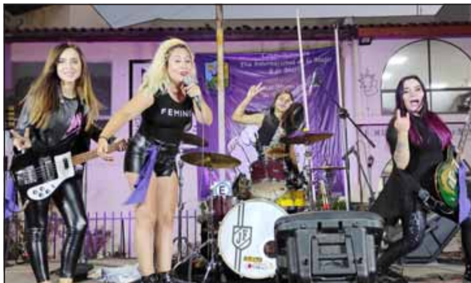
ARTISTAS DE LUJO.- Al final de la jornada las chicas del Grupo Bandana, quienes pusieron a bailar a todos los presentes con sus temas rockeros y hasta de la Nueva Ola.