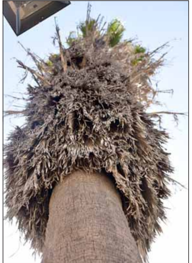
PELIGRO INMINENTE.- Esta palmera es muy alta, posiblemente unos 30 metros de altura, y está cargada de ramas secas que podrían caer.

Diario El Trabajo hicimos fotografías de la palmera y, efectivamente tiene la apariencia de no haber sido intervenida durante mucho tiempo, también es visible el riesgo de que caiga una o varias ramas en cualquier momento.