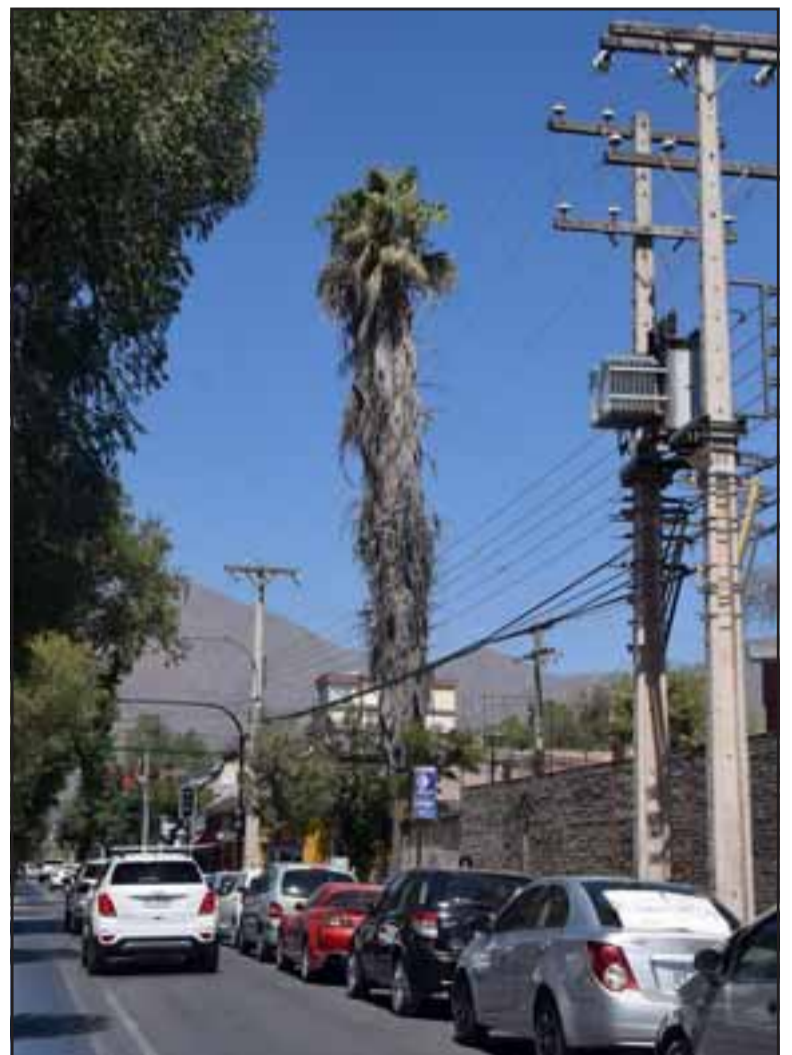
MUY ALTA.- Así se ve desde calle Salinas, ojala pronto las autoridades eviten una posible tragedia en el centro de nuestra ciudad.