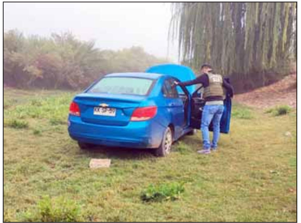
Este es el tercer vehículo usado en el asalto que fue encontrado ayer en Rinconada.

El automóvil corresponde a uno marca Chevrolet, color celeste, patente KK-SP 59.