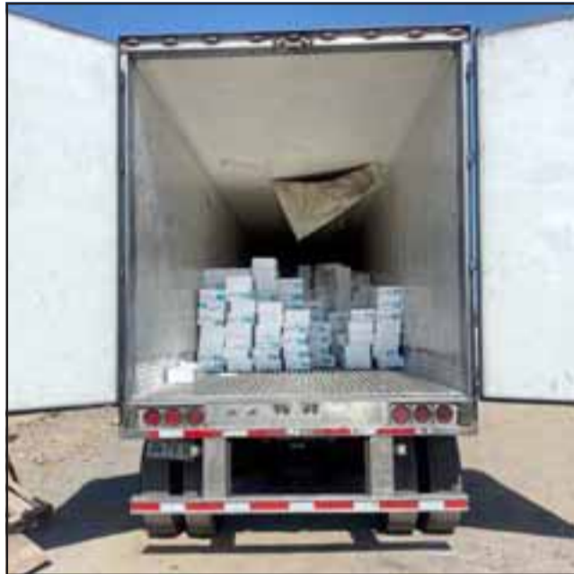
Nada menos que 400 millones de pesos en salmones logró recuperar Carabineros en Santa María, los que habían sido robado con camión incluido en el sector de Angostura.

En el momento otras dos personas se fugaron del lugar y son buscadas por personal policial.