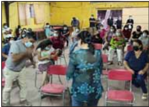
SIN POZO.- La noche del martes se reunieron vecinos y comitiva nacional de la DOH.

DOH: 'Vinimos a informar, no a imponer soluciones'