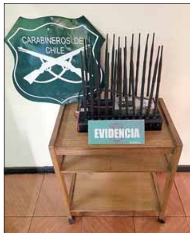
Este es el sistema GPS que emitió la señal por la que pudo ser ubicado el camión.