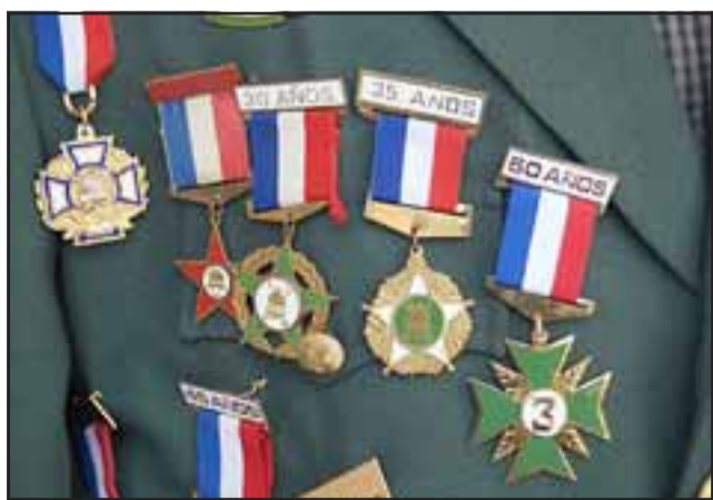
ES MILLONARIO.- Estas medallitas son el pago de los voluntarios de bomberos, porque todo su trabajo lo realizan de manera gratuita.