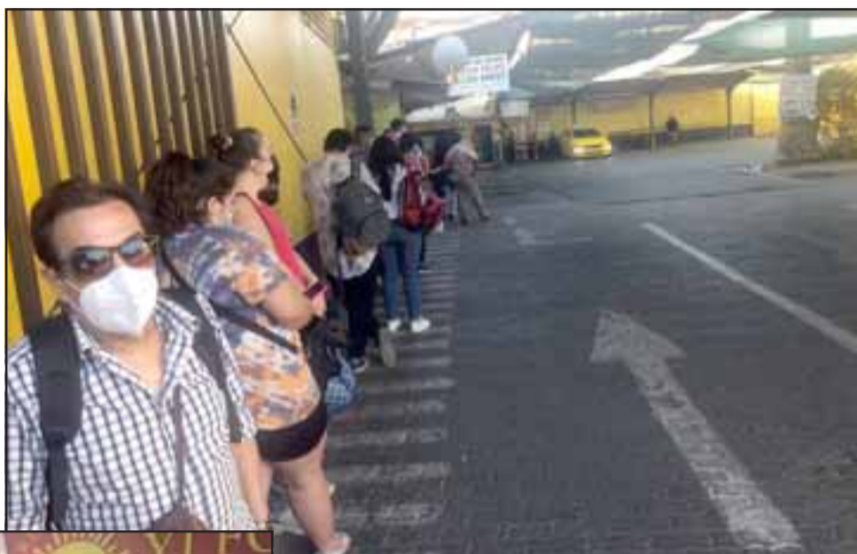
LARGA ESPERA.- Personas al interior del terminal de colectivos de calle Merced, esperando locomoción a Los Andes e intermedio.

Importante señalar que la conversación se realizó a pasadas las 18:00 horas, faltando minutos para las siete de la tarde.