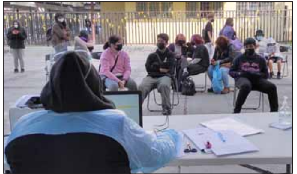
ESTO AÚN NO TERMINA. - Unas trece personas resultan diariamente positivas con estas pruebas rápidas y gratuitas en la Plaza Cívica de San Felipe.

Prueba rápida arroja resultados en apenas 15 minutos: