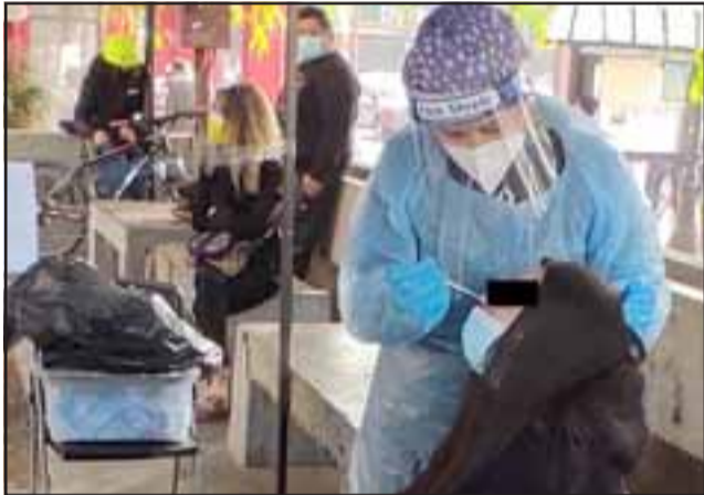
RESULTADOS RÁPIDOS. - Este procedimiento y el del PCR son lo mismo a través de la técnica naso-faringe, la diferencia es que el Antígeno detecta la carga viral presente en el cuerpo en ese momento.

Un aproximado de al menos trece personas diarias son detectadas con Coronavirus en la Plaza Cívica de San Felipe, solamente en el stand del Cesfam San Felipe El Real que funciona de lunes a viernes con 25 muestras o test rápidos, mismos que dan su resultado en sólo 15 minutos.