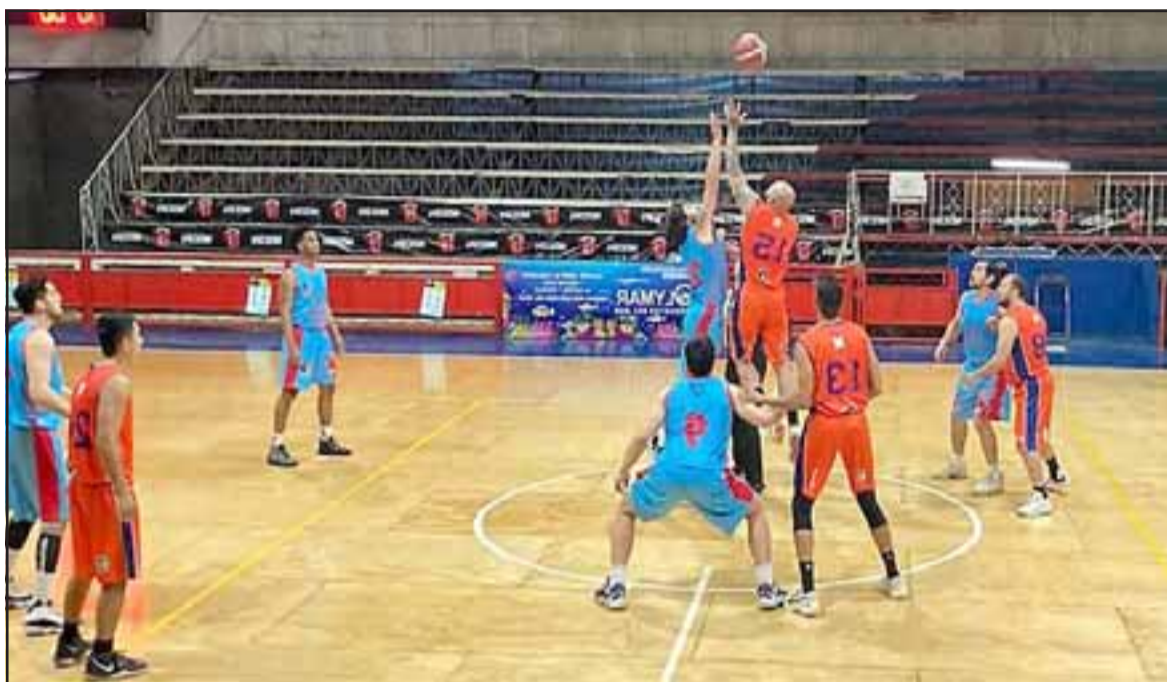
El baloncesto del club Arturo Prat está en búsqueda de un entrenador.