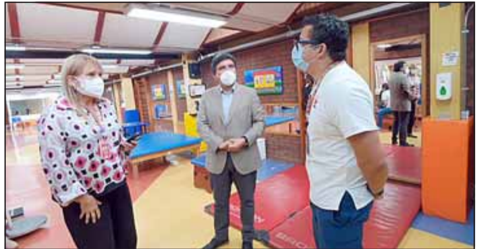
El alcalde de San Esteban se reunió con la directora del Centro Teletón de Valparaíso, para solicitar que las niñas y niños de la comuna puedan recibir sus atenciones en San Esteban u otra comuna de Aconcagua.

En esa línea, agregó que «me comunicaré con el resto de mis colegas alcaldes y alcaldesas de Aconcagua, que estoy seguro que encontraré una buena recepción, para así encontrar un lugar que permita recibir estas atenciones periódicas en beneficio de nuestros ni-