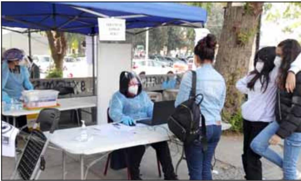
SÓLO SINTOMÁTICOS. - Familias completas llegan diariamente a realizarse este examen, pues los resultados son casi inmediatos.