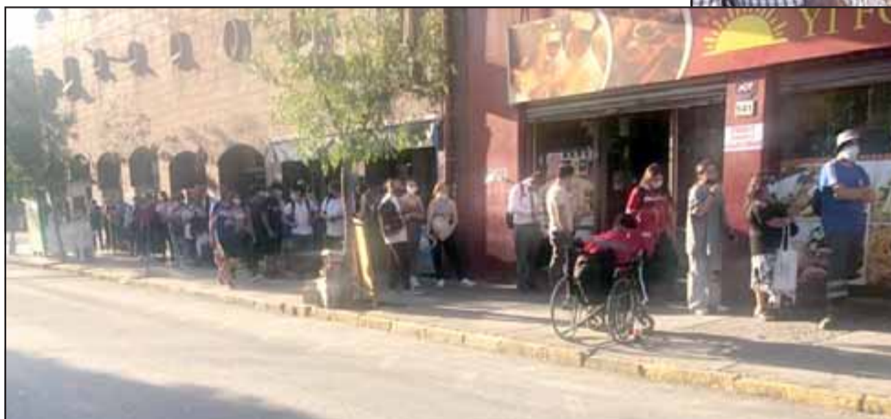
IMPRESIONANTE.- La fila de personas llegaba hasta calle Coimas ayer en la tarde.