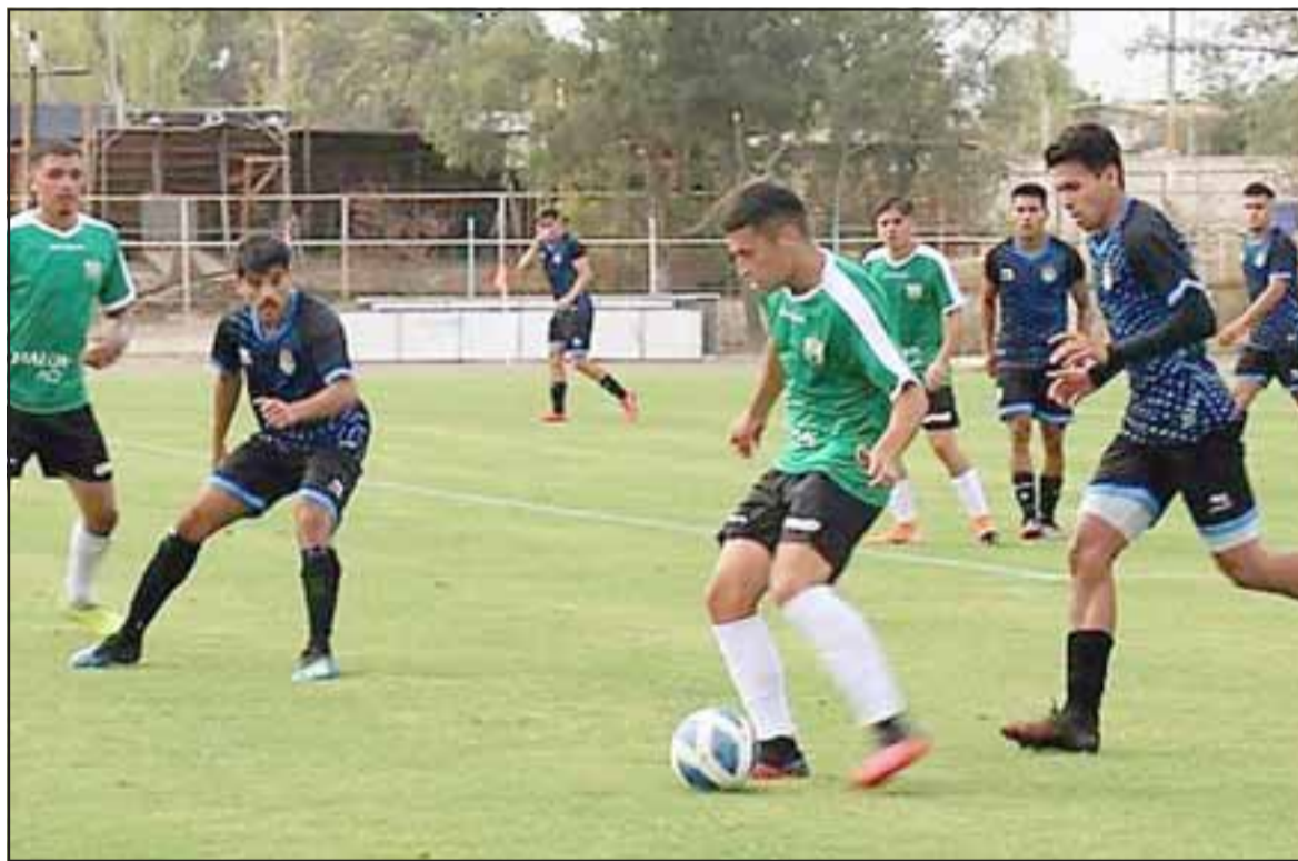
En pocas horas más Trasandino jugará su primer partido oficial en el 2022.

La Higuera – San Bernardo; Provincial Ranco – Deportes Valdivia; Provincial Ovalle – San Marcos de Arica; Colegio Quillón-Deportes Iberia; Cóndor Pichidegua – General Velázquez; Aguará – Rodelindo Román; Independiente de Cauquenes – Union Bellavista