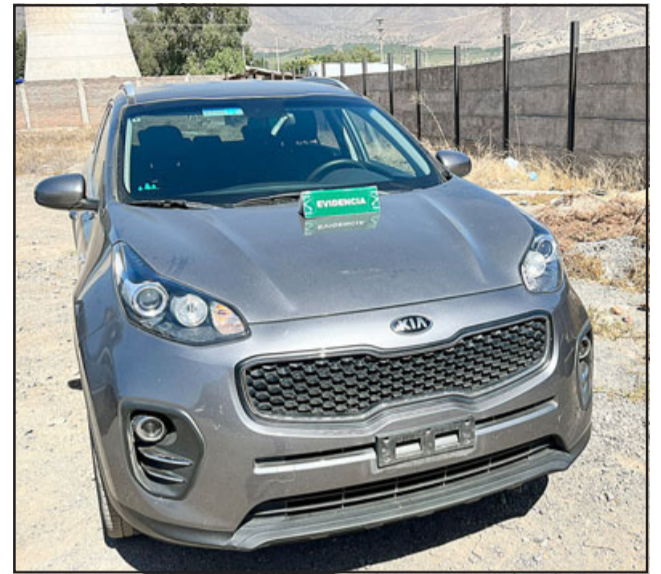
Este es el nuevo auto recuperado por Carabineros con encargo por robo desde Santiago.

Hechos de similares características, es que todos los autos recuperados en estas circunstancias registraban sus placas patentes falsas y los números de chasis adulterados. Esta vez, una persona de 30 años fue detenida por estos delitos.