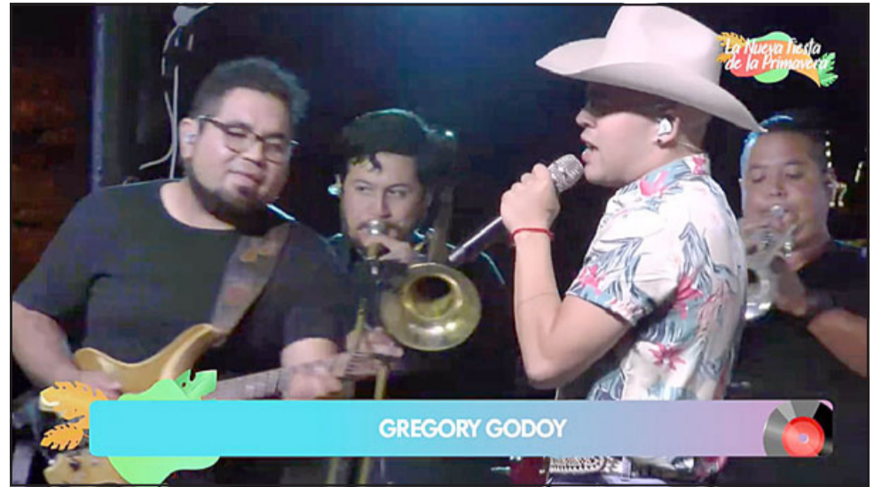
RANCHERA TROPICAL.- Acá lo vemos con toda su energía e histrionismo al lado de sus músicos, brillando con luz propia.

- Así es, recientemente fui confirmado como uno de los artistas principales en la