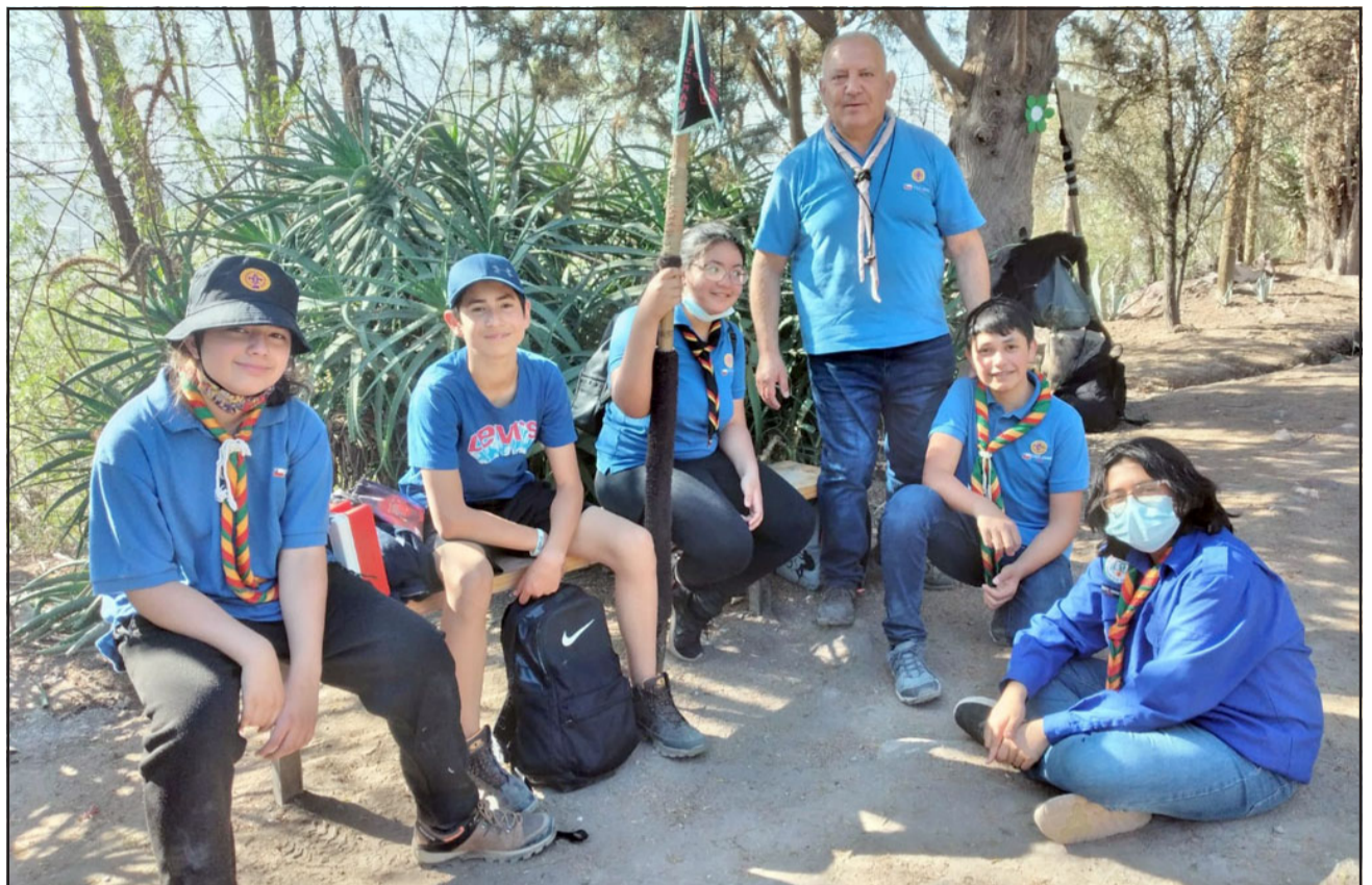
NUESTROS SCOUTS.- Acá tenemos la nueva generación 2022 de Scouts sanfelipeños, quienes enseñarán a otros lo aprendido.