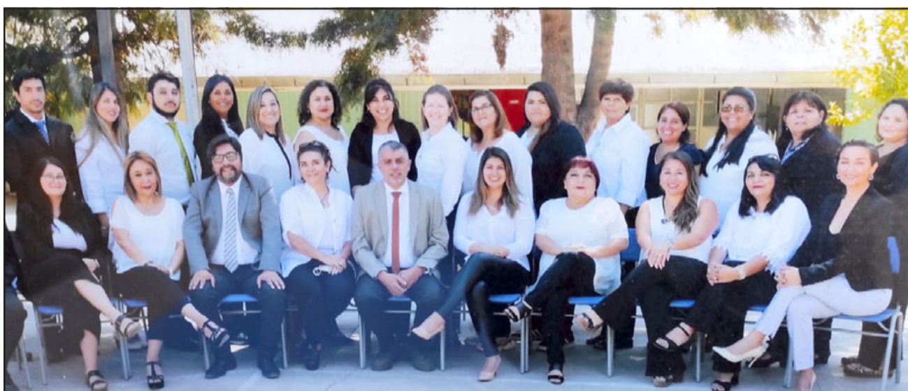
ELLOS AL FRENTE.- Ellos son los profesores que conforman el plantel docente 2022, quienes se esfuerzan por mejorar su escuela en todo momento.