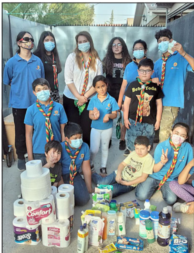
AYUDAN MUCHO.- En cada oportunidad estos chicos han estado presentes para apoyar a los demás durante esta pandemia.