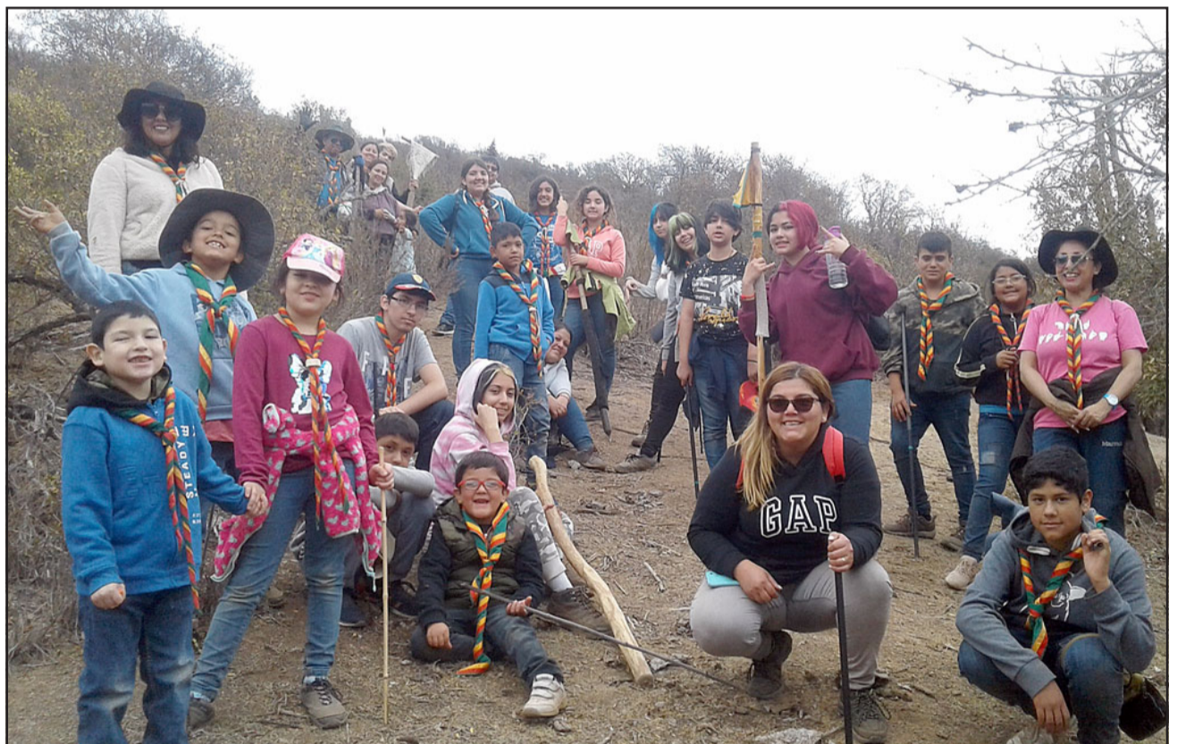
A CAMPO ABIERTO.- También realizan sus viajes al campo, ahí aprenden cómo sobrevivir y técnicas de aprendizaje para no depender de la tecnología.