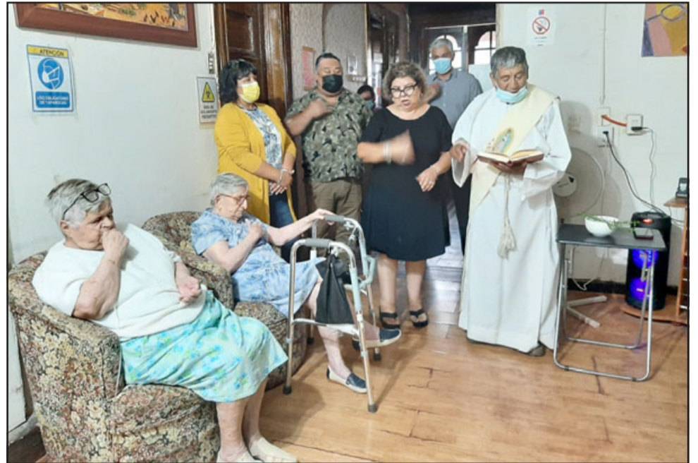
Con la bendición sacerdotal se dio por inaugurado el nuevo Eleam privado en San Felipe.