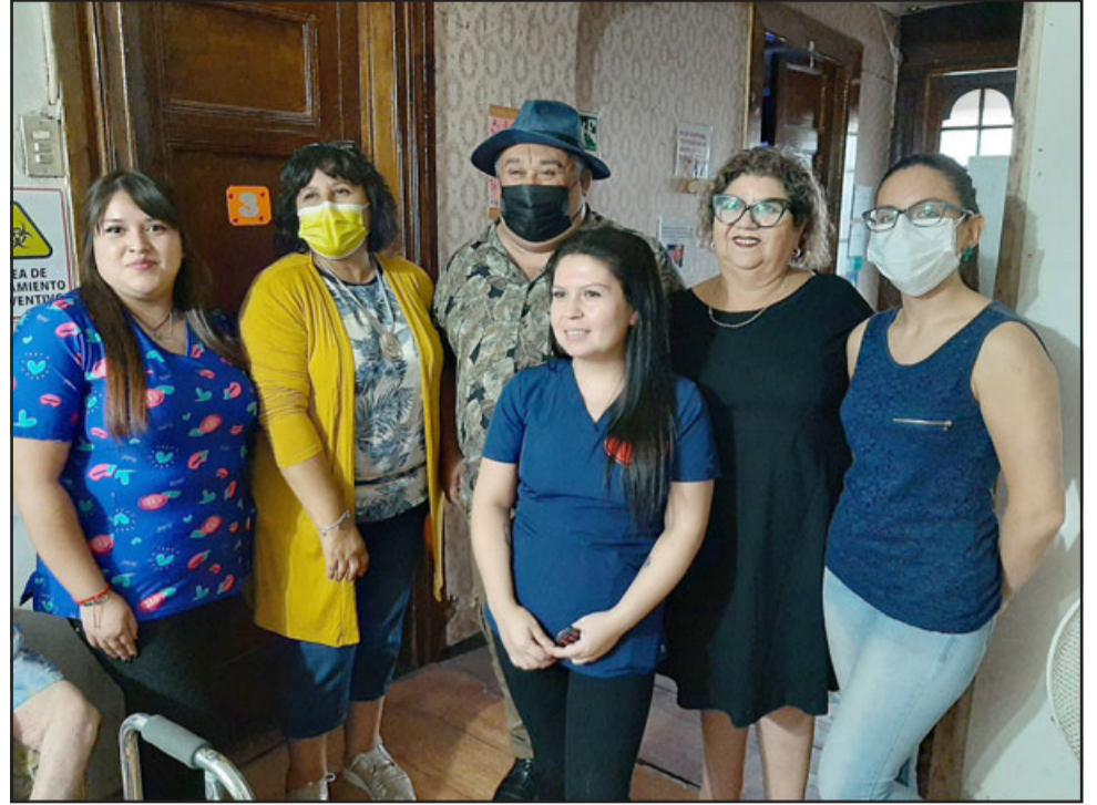
La ceremonia inaugural contó con la presencia de autoridades comunales, apoderados y amigos, quienes destacaron la importante labor que realizan estos Eleam.

Al finalizar la ceremonia de inauguración, los asistentes pudieron compartir un cóctel preparado especialmente para la ocasión.