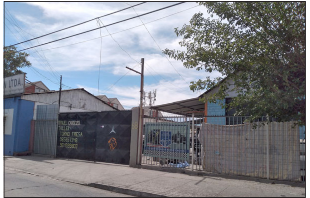
Más de 15 millones en diversas especies robaron delincuentes desde taller mecánico.

González además agregó que «es lamentable, entre suma y resta vamos en 15 millones de pesos entre herramientas, el escáner que se robaron que cuesta 4 millones de pesos y otras muchas cosas. Habíamos hecho una inversión gran-