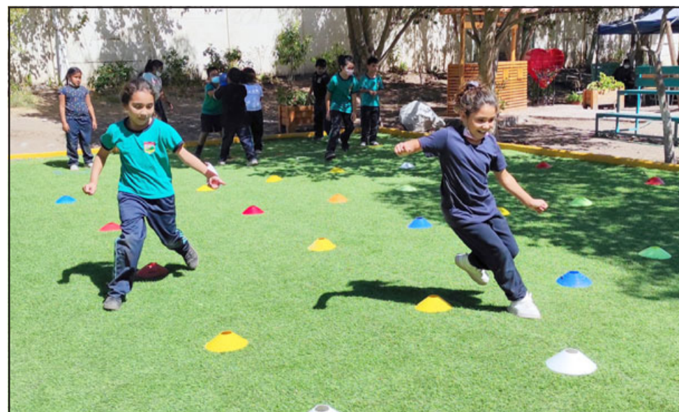
CESPED SINTÉTICO.- Acá los vemos corriendo y disfrutando de sus recreos al aire libre, gracias al esfuerzo de sus profesores.