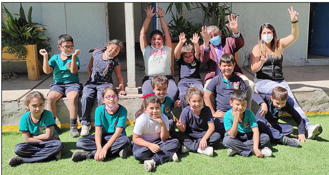
CANCHA DE LUJO.- Ellos son los pequeñitos de prebásica, quienes ahora tienen césped sintético en el antiguo patio de tierra en el que se ensuciaban diariamente.

- La cancha de párvulos con césped sintético, los niños ocupaban para jugar el patio de tierra, pero tenía un desnivel de 50 centímetros aproximadamente a cero. Era como una parte del cerro y eso también lo han hecho los profesores con palas y picota, durante una semana estuvieron trabajando con ese terreno, esa cancha la logramos comprar con Fondos SEP, compramos ese pasto sintético, hicimos esa cancha, las orillas, se compró con fondos de Mantención el pasto sintético y se pagó la instalación. Eso salió aproximadamente 3 millo-