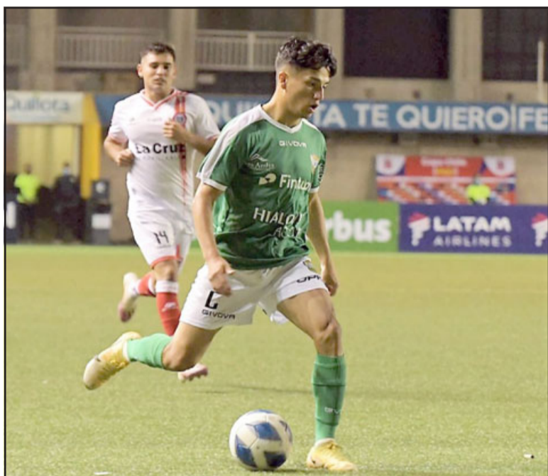
Ante el Uní Uní, Trasandino demostró que podrá luchar por cosas importantes en su serie.