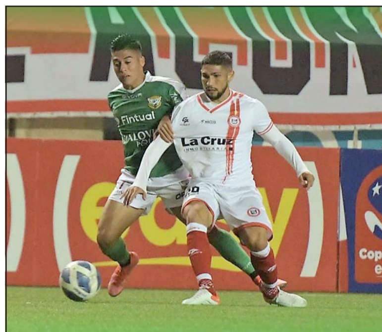
El estadio Lucio Fariña de Quillota fue escenario de un entretenido 'Clásico del Aconcagua'.

Unión San Felipe vio muy claro que su rival ya no tenía herramientas ofensivas, por lo que comenzó a ejercer una presión alta que terminó por descomponer to-