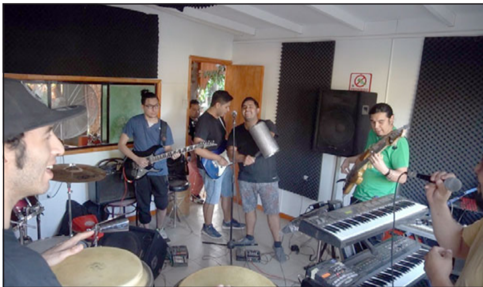
NADA LOS DETIENE.- Sus ensayos los realizan semanalmente y ni la pandemia ha logrado hacer que se estén quietos.