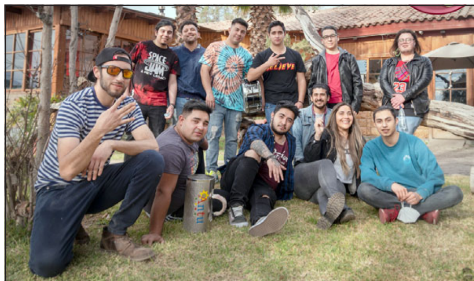
LA KINCHO.- Aquí tenemos a estos tremendos músicos aconcaguinos posando para las cámaras de Diario El Trabajo.