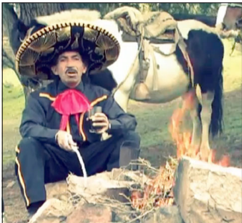
COMO LOS GRANDES. - Acá lo vemos en una escena de Charro, cantando grandes temas mexicanos a todo pulmón.