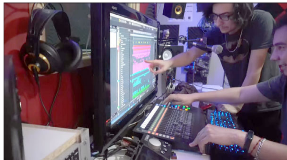
YA EN INTERNET.- La producción del videoclip ‘Y nada más’ se grabó con el mejor estudio de grabación del valle.