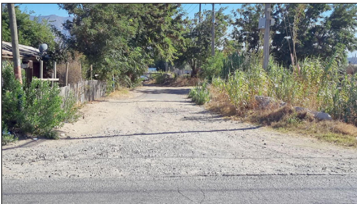
Este es el camino que se espera quede habilitado en los próximos meses.

El edil además manifestó que «por eso lo hemos decidido paralizar por un tiempo, para poder llegar a un acuerdo con ellos. Lo más probable es que tengamos, junto con Vialidad, que ejecutar obras de seguridad vial, veredas, reductores de velocidad, señaléticas para que, de esta forma, esta apertura que va a ser un beneficio gigante para los vecinos del Aconcagua, podamos mitigar los riesgos que esto puede significar para los habitantes de la localidad de Las Vegas».