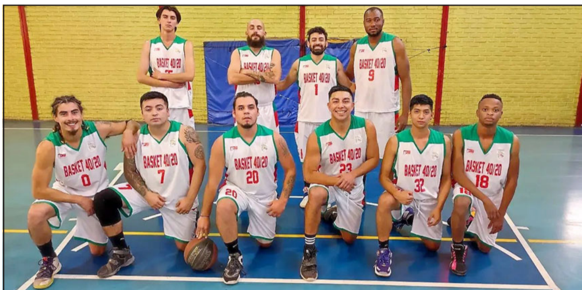
Le Bajón Básquet se impuso en el debut a un equipo del Prat.