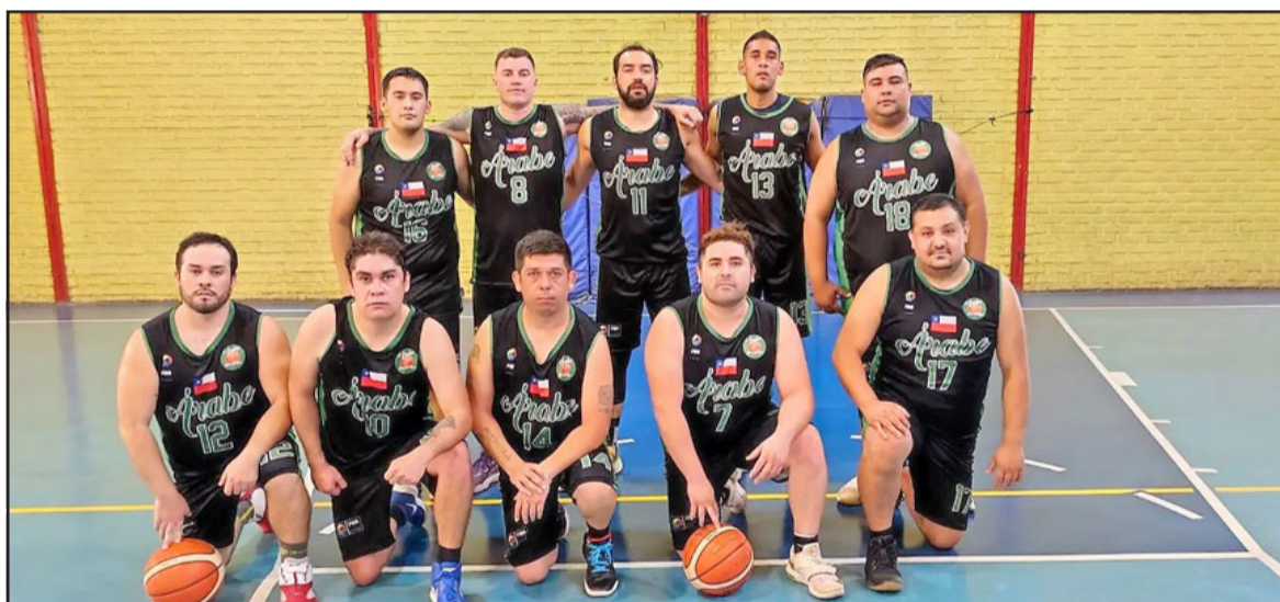
El histórico Árabes tuvo un estreno feliz en el Apertura de la ABAR.