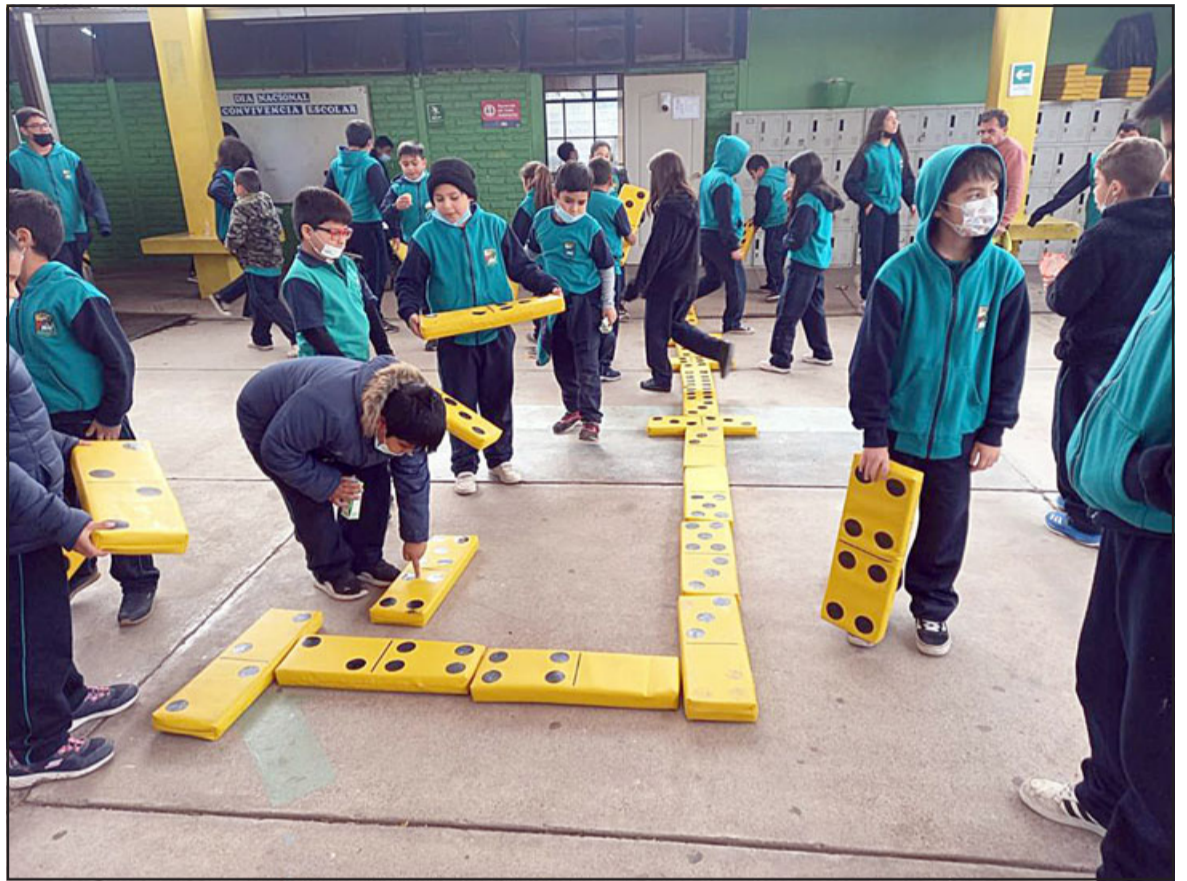
Estudiantes de la Escuela Almendral participando de la 'Ludoteca'.