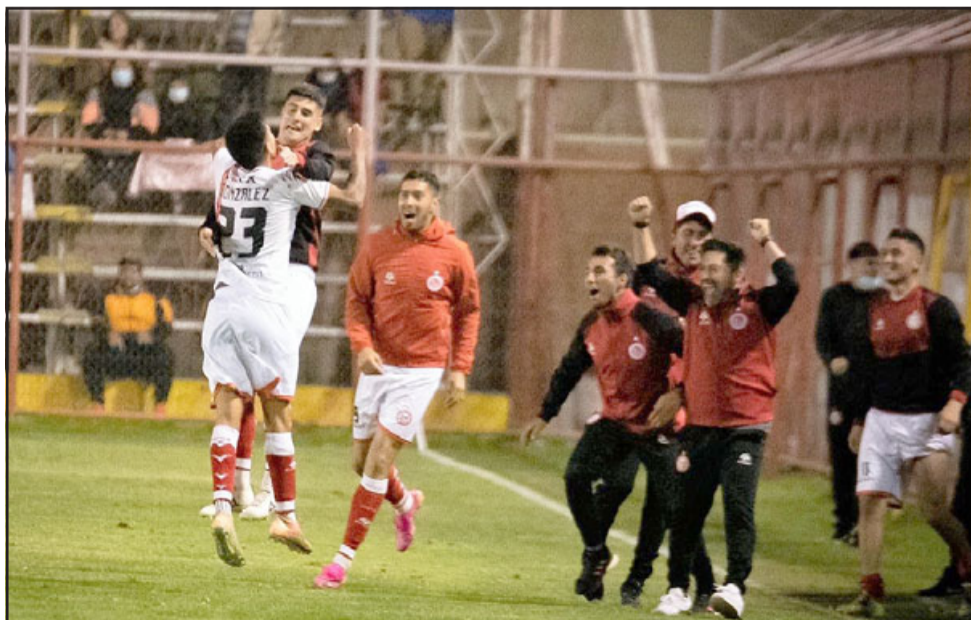
Jugadores y el cuerpo técnico unionista festejan la dramática paridad lograda en la última jugada del partido.