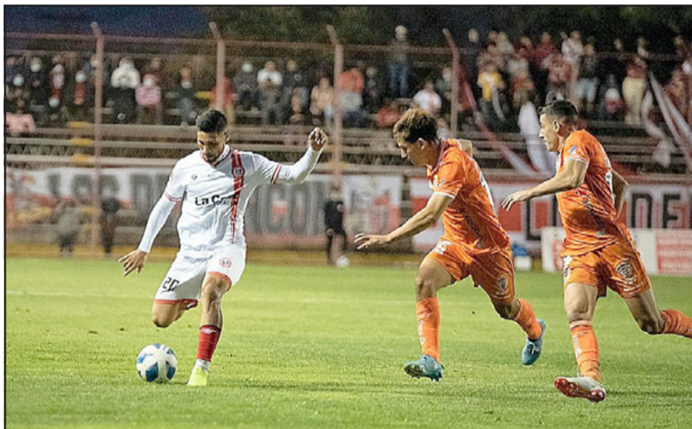
El juego entre sanfelipeños y mineros se caracterizó por su ritmo e intensidad.