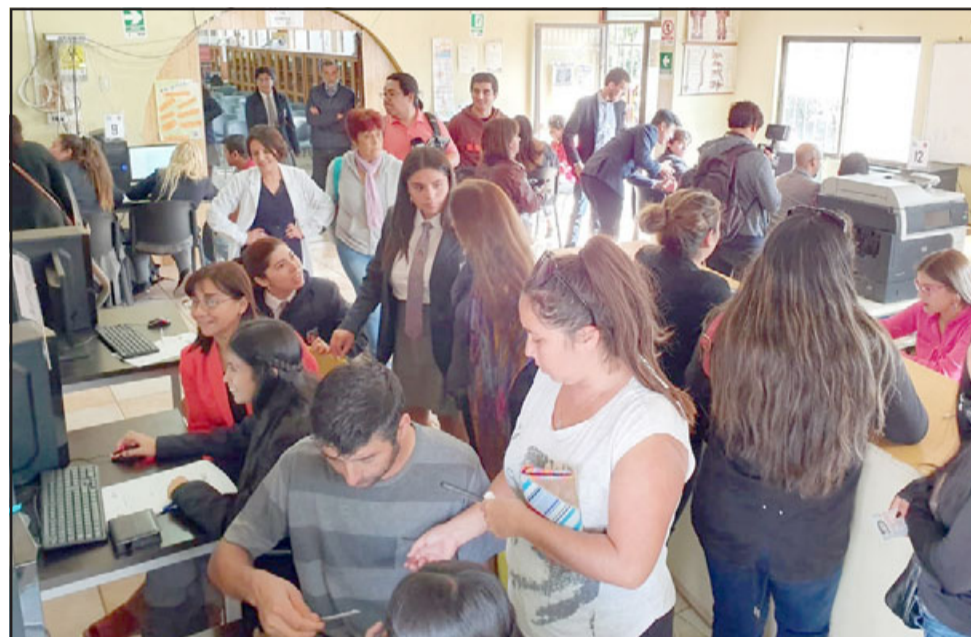
Desde hace ya varios años el alumnado del Liceo Roberto Humeres viene apoyando a los contribuyentes en su declaración de renta.