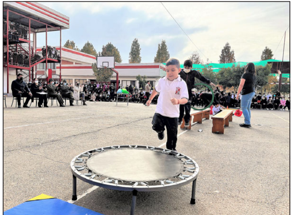
Los alumnos de básica del Liceo Mixto realizaron actividades artísticas y deportivas en el acto de clausura.