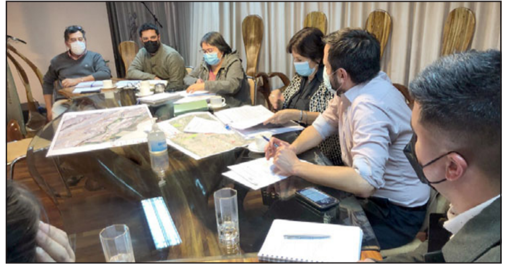
Equipos de la Municipalidad de San Felipe se reunieron con el Seremi de Bienes Nacionales.

• Autoridad regional se mostró dispuesto a estudiar la posibilidad de ceder al municipio algunos inmuebles que hoy se encuentran en estado de abandono y reconoció la urgencia de avanzar en otras materias como terrenos para viviendas, extracción de áridos y el traspaso de 'la isla' ubicada en Michimalonco Oriente.