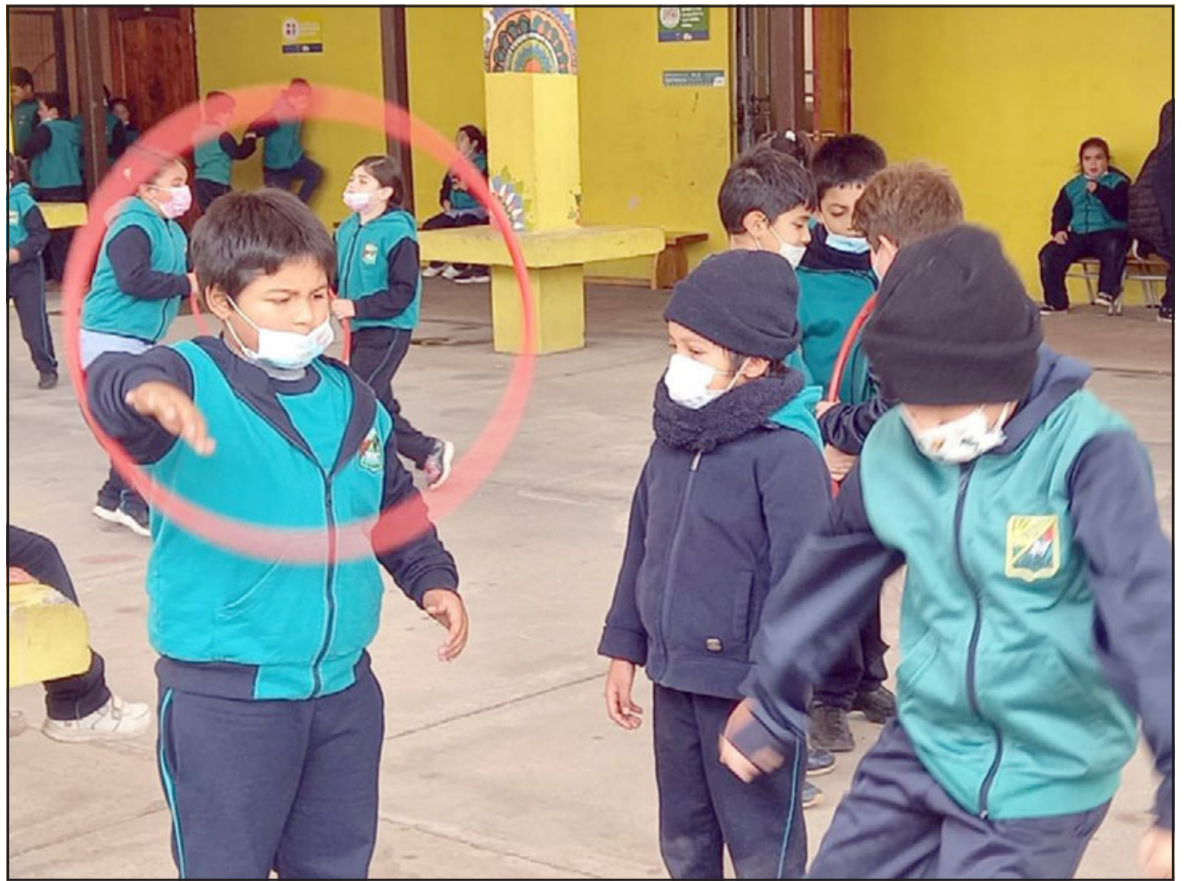
'Ludoteca' de la Escuela Almendral busca generar mejores espacios de convivencia escolar.