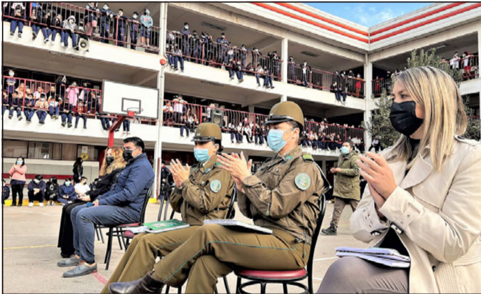
La actividad dio por clausurado el Mes de la Convivencia.

Durante este mes y en función de todas las actividades que se realizaron, se logró aumentar los niveles de compañerismo y disminuir los conflictos.