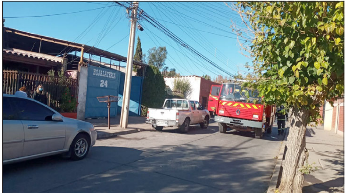
Bomberos logró controlar rápidamente incendio en calle Salinas con Uno Norte.

Afortunadamente la emergencia no pasó a mayores debido a la oportuna acción de bomberos quienes lograron controlar rápidamente la emergencia.