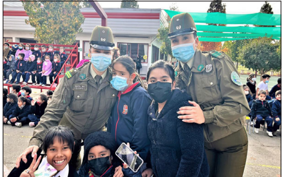
A la actividad asistieron dos representantes de Carabineros de Chile, una de ellas fue apoderada del establecimiento.